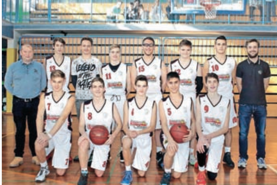
Ekipa kadetov Krvavec Botana

Zelo dobro igrajo tudi pionirji Europcar Krvavec, ki so imeli v prvem delu veliko smolo s poškodbami igralcev. Zelo tesno so izgubili z močnimi ekipami Krka, ECE Triglav in Vrhnika. V drugem delu so premagali ljubljansko Ježico,