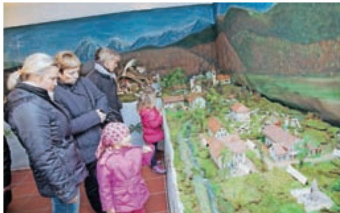
V Petrovčevi hiši je na ogled razstava jaslic.