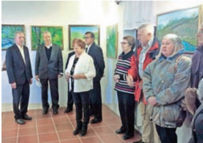
Prešerno vzdušje na odprtju razstave, ki je sedaj na ogled v Domu Taber.