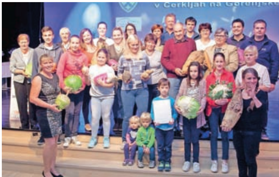
Letošnji nagrajenci s pestro bero pridelkov