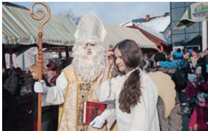
Cerklje je obiskal tudi prvi izmed dobrih mož, Miklavž.