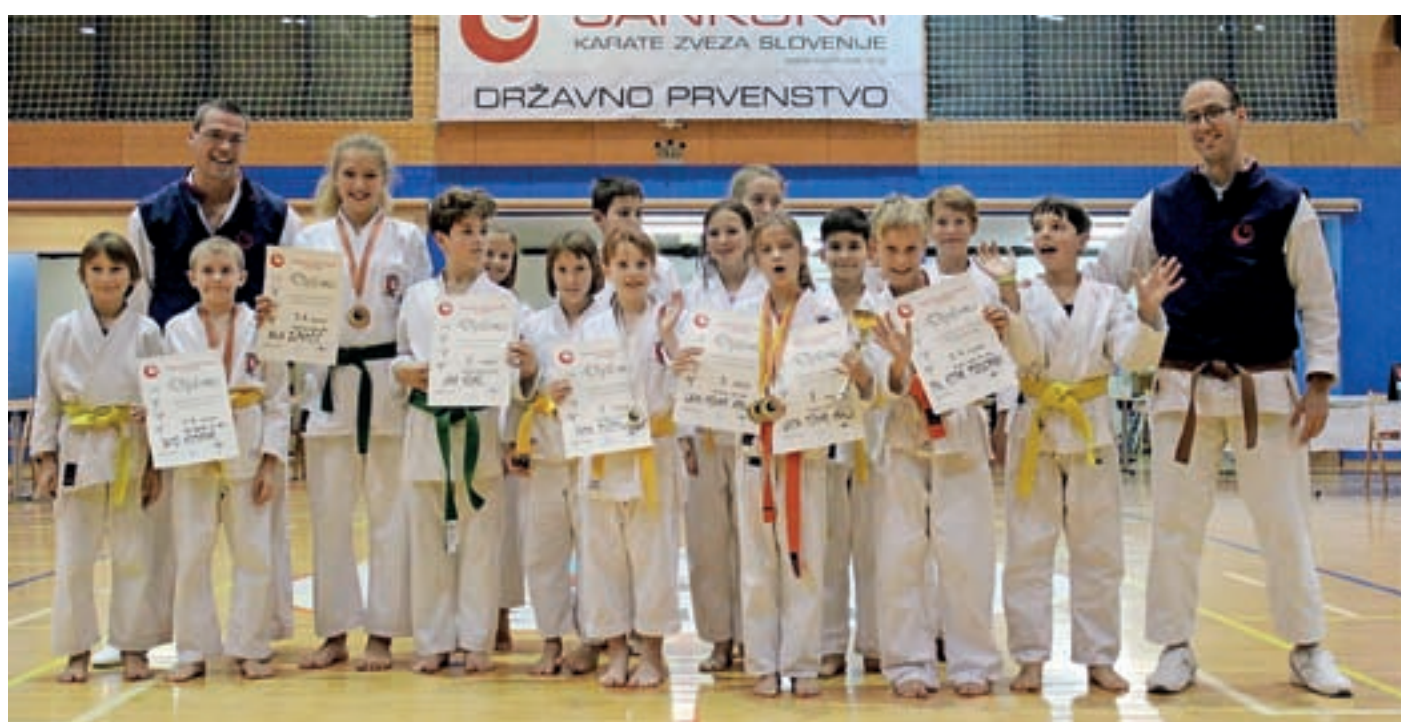
Karateisti na državnem prvenstvu v sankukai karateju za otroke