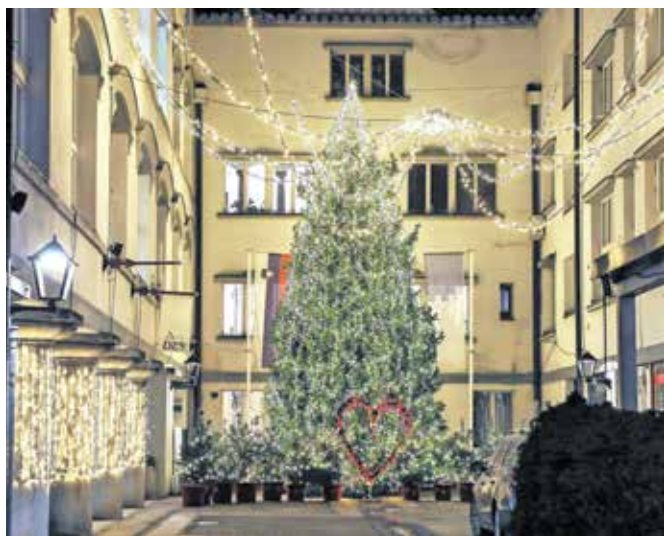
Praznične poti bodo domačine in obiskovalce razveseljevale vse do 8. januarja 2023.

nja prazničnih okraskov, obdaril pa jih je tudi Miklavž s spremstvom. Starejši so se gredli ob toplih napitkih in glasu izjemne Saše Lešnjek, ki je nastopila s skupino. Praznične poti, ki so letos razširjene do prenovljenega dvorca Neuhaus, bodo domačine in obiskovalce razveseljevale vse do 8. januarja.