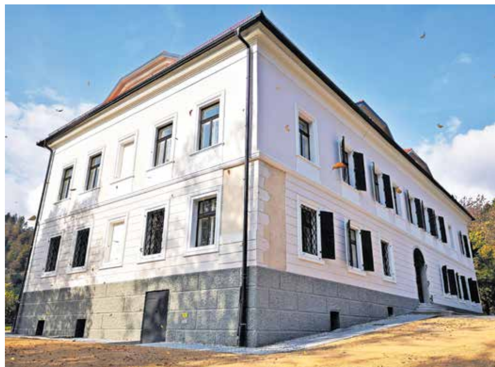
Obnovljeni dvorec Nauhaus / FOTO: OBČINA TRŽIČ

Kot so poudarili na Občini Tržič, bo obnovljena podoba, ki jo dvorec dobiva z letom 2022, v prvi vrsti prispevala k lepši veduti mesta. Še večjo vrednost bodo pomenile dejavnosti, ki se bodo dogajale znotraj njegovih zidov.