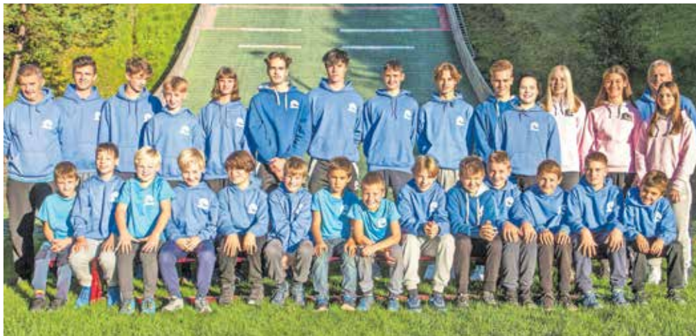
Mladi orli potrjujejo, da so skoki v Tržiču doma in da so v klubu Tržič FMG pogoji za razvoj izvrstni.

»Mladi orli so tako tudi letos potrdili, da so skoki v Tržiču doma ter da so v klubu Tržič FMG pogoji za razvoj izvrstni. Zato vsi zainteresirani v Sebenje, kjer lahko naredite prve korake v svet najlepšega športa na svetu.«