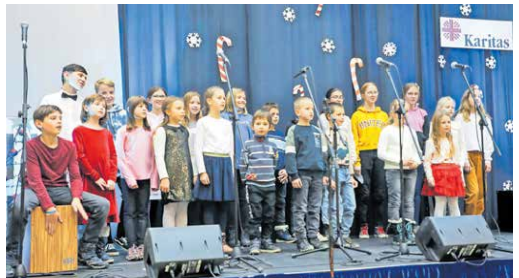
Otroški pevski zbor je s svojim nastopom ganil številne obiskovalce.

dvorano prevzele tudi domažalske pevke Ain't Harmony ter zmagovalka slovenske popevke po mnenju občinstva Mia Guček, ki se je predstavila s pesmijo Nove slike. Vsakoletni dobrodelni koncert Župnije Križe je največja akcija zbiranja prostovoljnih sredstev, na kateri je bilo tudi letos mogoče kupiti adventne venčke. Nekaj besed pa je zbranim namenil tudi župnik Župnije Križe in predsednik Župnijske karitas Kri-