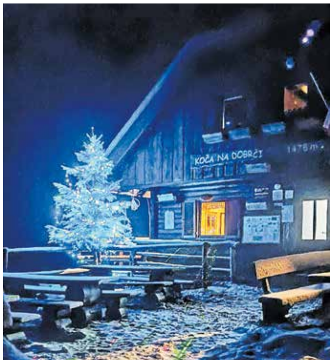
Koča na Dobrči