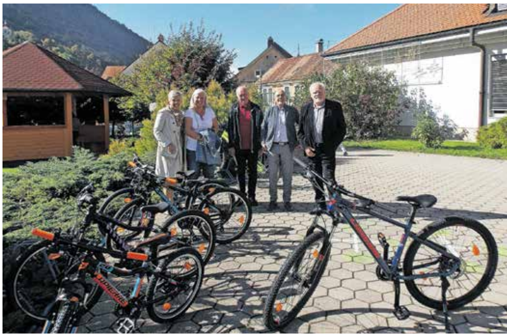
S kolesi, ki so jih podarili OŠ Tržič, so rotarijci izkazali veliko dobrodelnost in zavedanje o pomenu prometne vzgoje.