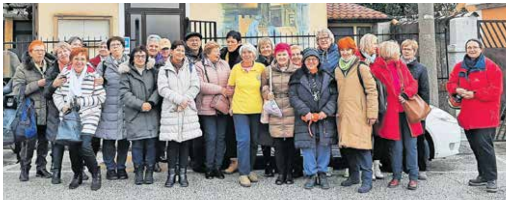
Skupinska slika Društva upokojencev Tržič