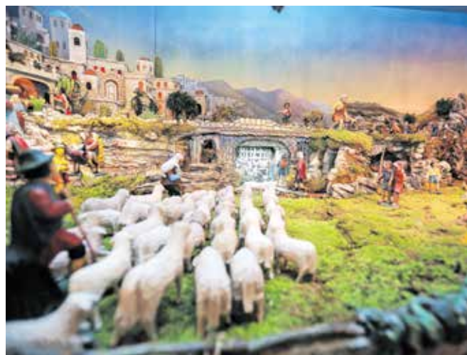
Tekčeve jaslích sodijo med najlepše dosežke ljudske duhovne kulture na Slovenskem.

Po sprehodu po Trgu svobode je vodnica Neža pripovedovala zgodovino, o bogastvu tržiških obrti in podjetnosti ljudi, odkrila kakšno skrivnost stare tržiške hiše. »Tržič ima dušo in priča, kako pomembno