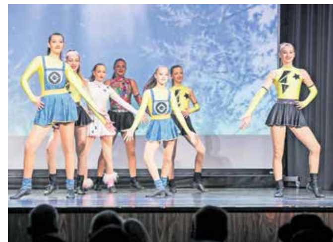
Z nastopom so navdušile tudi plesalke Plesnega kluba Tržič.

in breakdancea. Število članov Plesnega kluba Tržič kaže na to, da s svojimi plesalci delajo s srcem, saj v njihovih vrstah vsako leto pleše okrog dvesto plesalcev. Na nedavni slavnostni akademiji ob občinskem prazniku se je predstavila skupina deklet, rokenrol formacija, ki tekmovanja v Sloveniji običajno zaključijo na prvem oziroma drugem mestu. Tudi nastopi na svetovnih pokalih jim niso tuji, tam dekleta dosegajo odlične uvrstitve v izjemni svetovni konkurenci plesalcev.