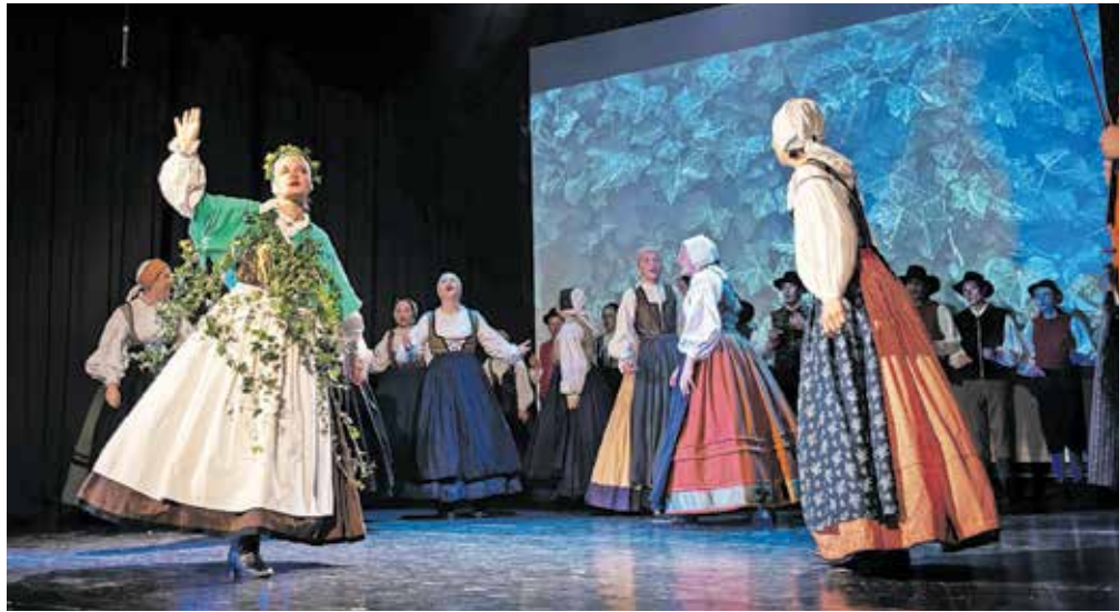
In vrtela in vrtela se je vehta baba...