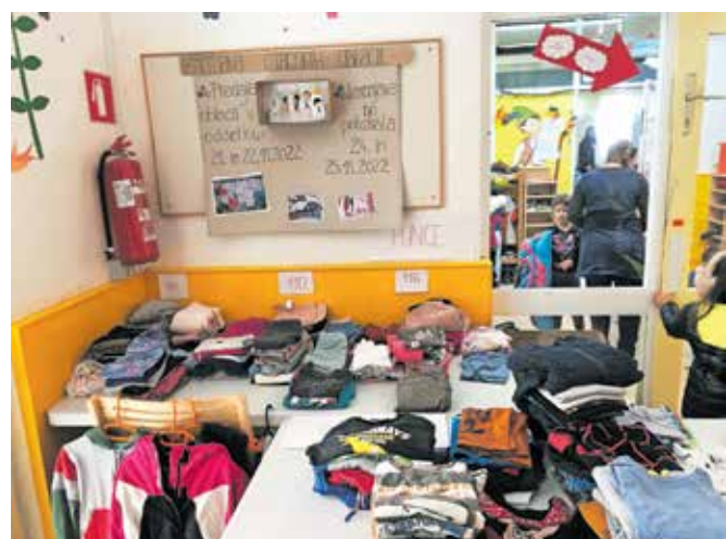
Akcija je bila med starši lepo sprejeta, oblačila, ki niso našla novih lastnikov, pa so podarili humanitarnim organizacijam.

je zaživela. Od 24. do 25. novembra so starši lahko izbirali oblačila za svoje malčke. Ker smo prejeli ogromno lepih oblačil, ki še niso našla novega lastnika, smo akcijo podaljšali do konca novembra. «Akcija je bila med starši lepo sprejeta, oblačila, ki niso našla novih lastnikov, pa so podarili humanitarnim organizacijam. »Sicer smo zelo hvaležni, da smo oblačila lahko podarili, a želeli bi si, da bi več oblačil našlo novega lastnika že na izmenjevalnici. Tako bi dop-