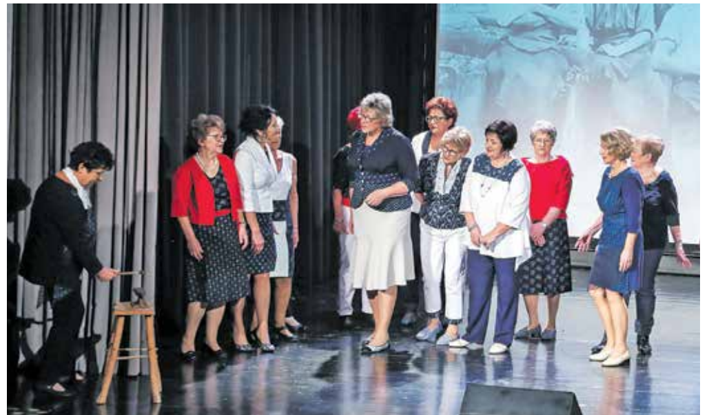
S simpatičnimi koraki in živahnimi ritmi so plesalke v tretjem življenjskem obdobju poskrbele za prešerno vzdušje v polni dvorani Kulturnega centra.