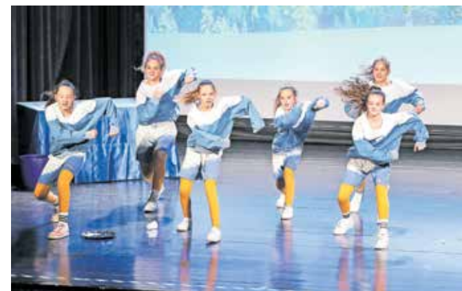
Nastop plesalk Plesnega studia Špela na nedavni slavnostni akademiji Občine Tržič