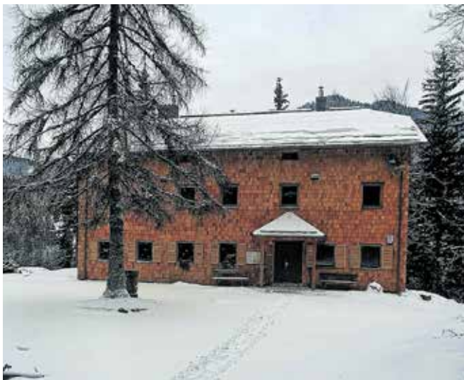
Dom pod Storžičem

(1478 m n. m.) in Dom pod Storžičem (1123 m n. m.). S celovito energetsko prenovno Koče na Dobrči so izboljšali energetska učinkovitost objekta, povečali rabo obnovljivih virov energije, zmanjšali porabo pitne in sanitarne vode ter povečali zajem in zalogovnike za pitno vodo. Zamenjali so poškodovano streho in neučinkovito stavbno pohištvo, prenovili razsvetlavo, posodobili sistem ogrevanja, namestili