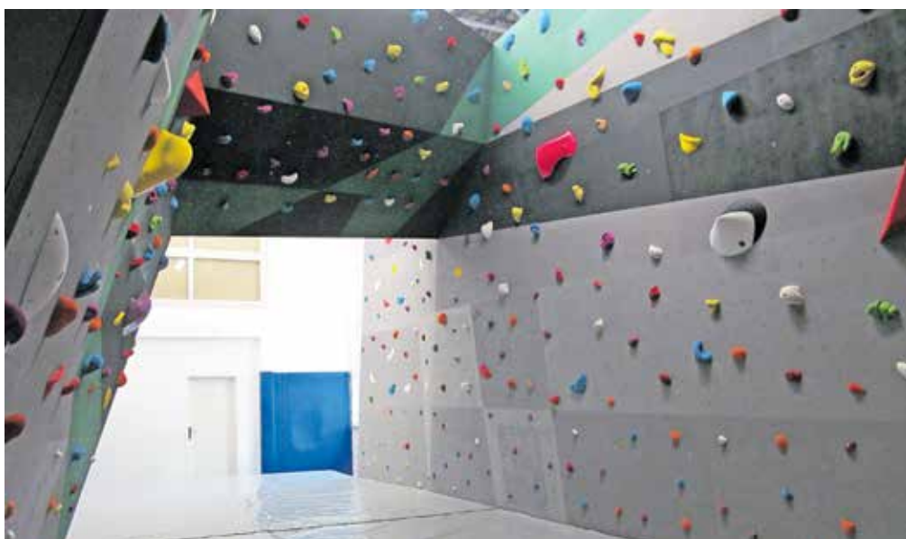
Nova plezalna stena ponuja devetsto plezalnih oprimkov.

Tržič – Z novim šolskim letom so v Dvorani tržiških olimpijcev predali v uporabo novo nizko plezalno steno, predvideno za rekreativno vadbo, vadbo otrok in mladine, začetnike in izkušenejše plezalce, vadbo članov enot Civilne zaščite in članov enot prostovoljnih gasilskih društev. »Nova nizka balvanska plezalna stena ima okvirne skupne površine 145 kvadratnih metrov s samostojno konstrukcijo in plezalno površino, izdelano iz vezane plošče debeline 21 milimetrov, ponuja 900 plezalnih oprimkov, do 15 piramid velikosti od 60 do 120 centimetrov in do 25 volumnov velikosti od 50 do 120 centimetrov. Pod plezalno površino so varovalne blazine, skladne s predvidenimi stan-