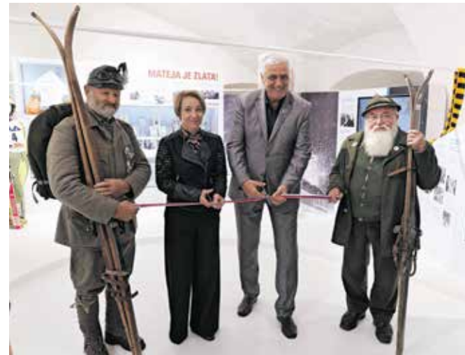
Slavnostni prerez traku ob odprtju stalne razstave Mateja je zlata!

Od ene kolajne pa se ni ločila. »Ta je lesena, na njej so gorenjski nageljni in niti ne vem, za katero mesto sem jo dobila. Stara sem bila šest, sedem let in je povezana z mojim očetom. Takrat še nisem znala voziti po progi, nisem razumela, da so leva in desna vratca, in je oče smučal ob meni in mi s palico kazal pot. Izredno ponosna sem bila na to kolajno in sem še danes.«