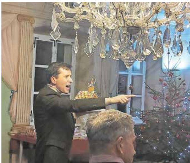
Na 11. tradicionalni dobrodelni dražbi slaščic so zbrali rekordno vsoto za socialno ogrožene skupine.

godkov. V okviru projekta Dan za življenje, s katerim poskušajo ozavestiti in motivirati ljudi, da bi pristopili k oživljanju, so izdali zloženko, ki našteva vse defibrilatorje v občini Tržič in na kratko pojasnjuje ravnanje v primeru srčnega zastoja. Da pa bi projekt podkrepili tudi na praktični ravni, je Rotary klub Tržič Naklo izpeljal nekaj delavnic oživljanja in uporabe defibrilatorja. V Planinskem domu na Kofcah so namestili avtomatski defibrilator in postopke oživljanja prikazali ljubiteljem planin, v Biotehniškem centru Naklo so se z njimi seznanili dijaki zaključnih letnikov, v podjetju Mali-E-Tiko pa so bili tečaja oživljanja deležni zaposleni. »Rotary klub Naklo Tržič je na območju teh občin v zadnjih sedmih letih namestil skoraj dvajset defibrilatorjev, ki so že rešili kakšno življenje. Pomembno pa je, da se z njihovo uporabo seznanimo, že preden je to nujno potrebno, zato tudi izvajamo te-