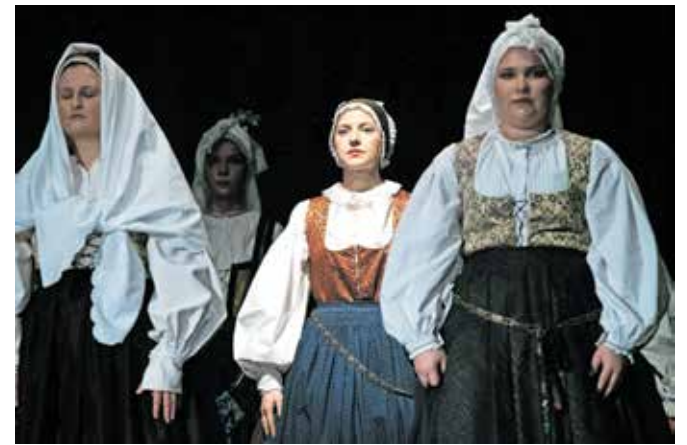
Ljubezen do petja in plesa povezuje folklorne, ki obujajo in ohranjajo kulturno dediščino.