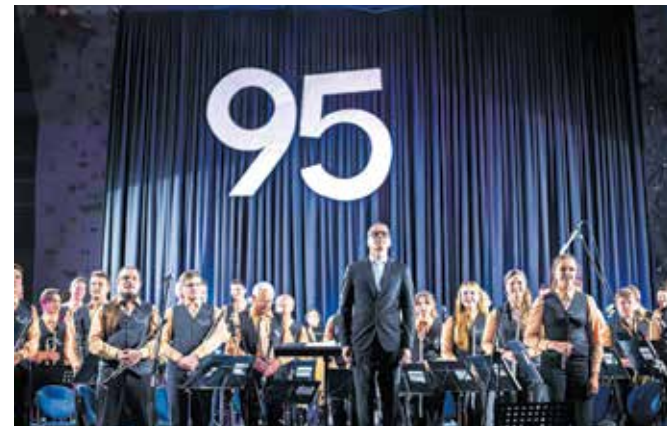
Koncert Pihalnega orkestra Tržič ob 95-letnici delovanja 21. maja letos

katerem se nam bo pridružila odlična Alenka Godec in ki bo potekal v tradicionalnem terminu, ko se praznični obroki že dodobra poležejo, v tržiškem organizmu pa se sprosti nekaj prostora za kulturno poslastico – vidimo se 26. decembra 2022 ob 19. uri v Dvorani tržiških olimpijcev. Vstopnice, ki se odlično obnesejo kot novoletno darilo in katerih cena ni odvisna od inflacije, si lahko zagotovite v predprodaji po ceni osem evrov ali tik pred koncertom pri vhodu v dvorano za dva evra več.