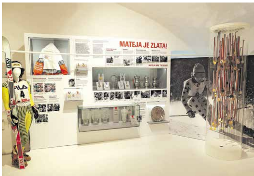
Nekateri predmeti so že na ogled, preostali bodo v prihodnjem letu v oglednem depozitu na podstrešju Trziškega muzeja.

priznanja in pokali veliko pomenijo, a je tudi v njej dozorela odločitev, da jih je pripravljena dati od sebe. Kot je dejala, je v to nihče ni nagovoril, je pa najprej mislila, da Trziški muzej sprejema samo eksponate trziških smučarjev, ona pa ni Trzičanka. »Potem so mi razložili, da je to Slovenski smučarski muzej, ki je tudi strokovno izredno dobro voden.« Poigravala se je s tem, ali bi dala vse predmete ali ne ... Bolj ko je pakirala, večji bi bil lahko občutek, da nekaj izgublja, a se ji je dogajalo ravno obratno. »Ponovno sem začela doživljati vse te predmete, ki so pomemben del mojega življenja. Šele ko damo, vemo, da imamo. To, kar je bilo prej po mojih vitrinah, predalih, je zdaj postalo naše in je dostopno tistemu, ki ga to zanima.«