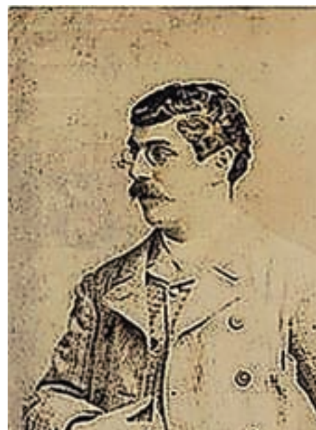
Ignacij Borštnik

Borštnik je v Zagrebu ostal 25 let, ker ni bilo možnosti, da bi se vrnil v Ljubljano. Pač pa se je v Ljubljano pogosto vračal kot gostujoči umetnik. Naj omenim le dve njegovi ljubljanski stvaritvi: mojstrsko je upodobil Kantorja v Cankarjevi drami Kralj na Betajnovi in odigral vlogo Ritmojstra v sloviti Strindbergovi drami Oče. Kreacija stotnika Edgarja v Strindbergovem Smrtnem plesu je bil eden izmed Borštnikovih igralskih viškov v Zagrebu, Ritmojster bleščeči zadnji višek v Ljubljani. Po predstavi so ga odpeljali v bolnišnico, kjer je 23. septembra 1919 izdihnil.