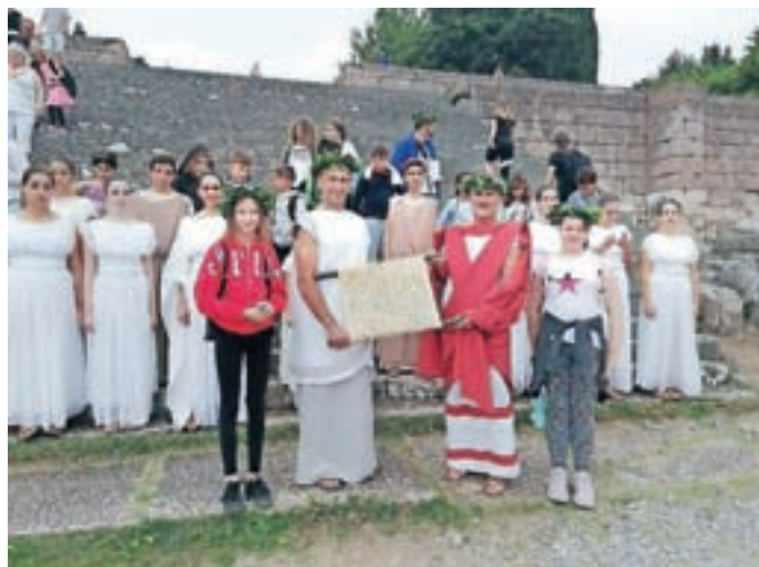
Dve učenki sta teden preživele na izmenjavi na otoku Kos.

Šola je uspešno kandidirala tudi za evropska sredstva projekta Erasmus+. Gre za projekte, ki povezujejo šole in učence iz različnih držav Evropske unije. V vsako od držav gostiteljic bosta potovala po dva naša učenca v spremstvu učiteljev. V projektu bodo sodelovali učenci med desetim in dvanajstim letom starosti. Prvo gostovanje je že za nami, dve učenki naše šole sta