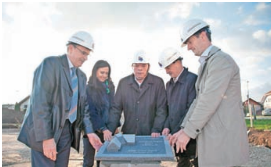
Polaganje temeljnega kamna za nov zdravstveni dom

Tudi sam vsem občankam in občanom želim vesele praznike ter srečno in uspešno novo leto. Želim si, da bi – ne le v občini, temveč tudi po državi in drugod po svetu – zavel veter medsebojnega spoštovanja, saj le to omogoča prijetno bivanje v skupnosti in nadaljnji razvoj.