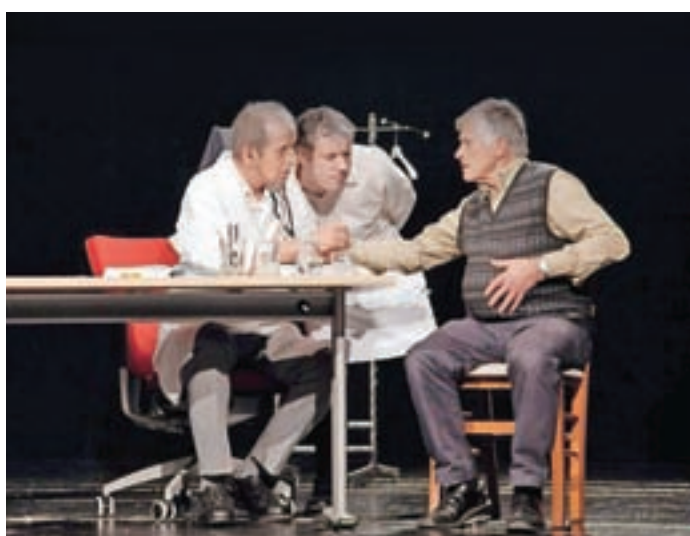
Člani Dramske skupine Pod stražo so na oder postavili komedijo Lažni zdravnik.

Naši najmlajši se pridno pripravljajo na obisk varovancev Doma Taber in na prihod Božička. Otroško igrico o dobrem