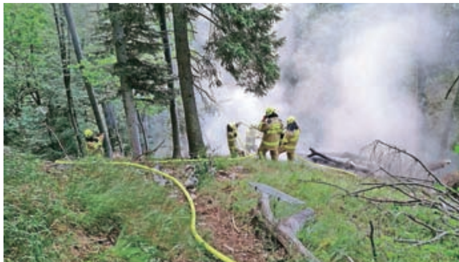
Z intervencije na Potoški gori

Ob večjih intervencijah, kjer smo sodelovali tudi s poklicnimi gasilci iz Kranja in drugimi prostovoljnimi društvi, smo uporabljali gasilsko opremo, ki smo jo obnovili in prenovili v zadnjem letu, ter vsa vozila, s katerimi razpolagamo v svojem društvu. Ravno zato smo izredno veseli, da smo se odločili za nakup novega vozila, ki je že v prvem letu sodeloval pri skoraj vseh intervencijah, seveda pa vozilo spoznavamo tudi na rednih tedenskih vajah. Tedenske vaje, ki jih izvajamo vsak petek in so obarvane z različno tematiko, so najpomemb-