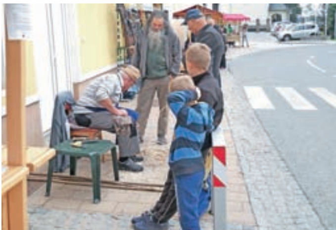
Zanimanje za pletenje tradicionalnih preddvorskih cajn

Dan Slovanov so v sodelovanju z Občino Preddvor, Krajevno knjižnico Preddvor in Vrtcem Čriček Zgornja Bela pripravili v Centru za trajnostni razvoj podeželja Kranj in Zavodu za varstvo kulturne dediščine, priredili pa so ga v počastitev Dnevov evropske kulturne dediščine 2017.