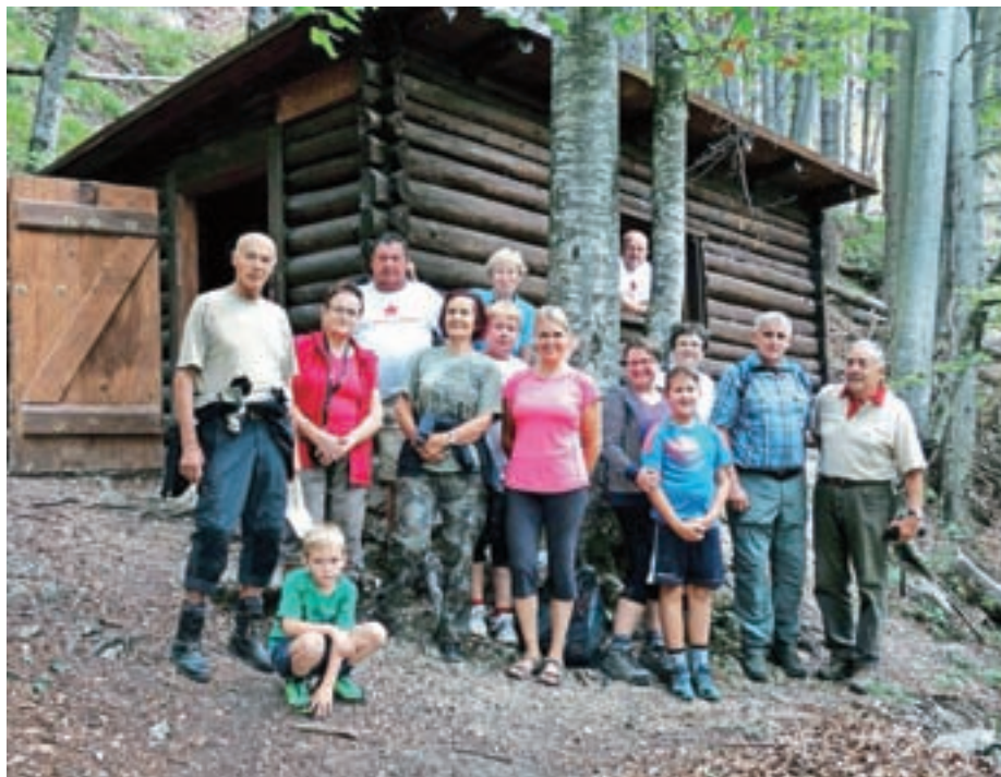
Pohodniki k partizanski bolnici Košuta

Bolnica leži na nadmorski višini 1034 m in je delovala od aprila 1944 do maja 1945. Ker je bilo ambulant več, so jim dodajali črke abecede. Košuta je dobila ime ambulanta A ali 666. V njej so bile štiri postelje in nekaj skromne opreme. Za ranjence so skrbele negovalke, saj