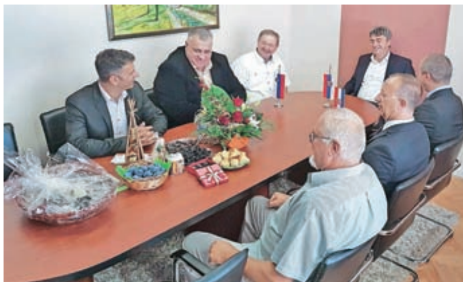
V Blacah uradno ...