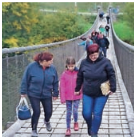
Na visečem mostu Santa Lucia

Letos smo se člani Turističnega društva Kokra odločili, da si ogledamo Koroško. Odpeljali smo se preko Jezerskega vrha v Avstrijo do kraja Aich / Dob, kjer smo se sprehodili po čudovitem visečem mostu, imenovanem Santa Lucia. Most se nahaja na križišču dravske ter podjunske kolesarske poti. Zasnovan je tako za pešce kot tudi za kolesarje in je z razponom 140 metrov najdaljši viseči most v spodnji Koroški. Speljan je 58 metrov nad sotesko Freistritchgraben / Bistriški graben. Premer nosilne vrvi je 91 mm, kar nanese na 45 ton skupne