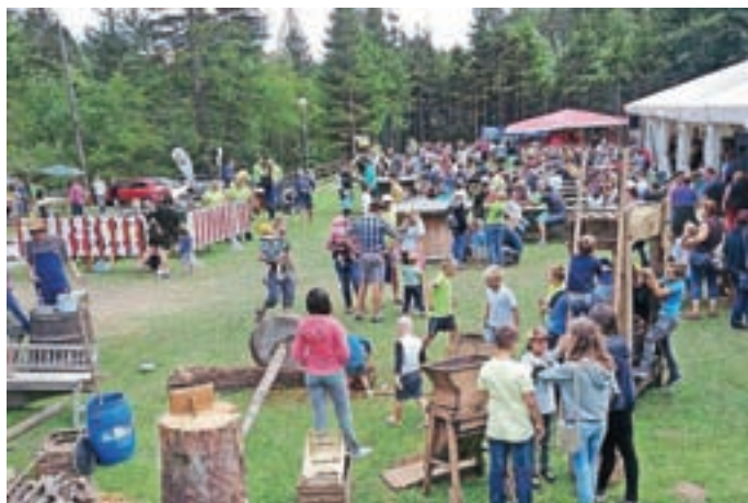
Prizor z veselice

je bil na žganjekuhi, kegljanju za jarca, bogatem srečelovu ter še veliko drugih aktivnostih, med drugim je bilo poskrbljeno tudi za otroški kotichek za najmlajše, zaigral pa je ansambel Zupan. Obiskali so nas tudi prijatelji iz Italije, s katerimi si vsako leto izmenjujemo obisk. Pohvalimo pa se lahko tudi s kmečko kuhinjo, ki je bila v celoti razprodana: štruklji, masevnik, flancati, žganci in posmodulje so šli za med. Obiskali so nas tudi starodobniki iz Voklega in Suha špaga iz Škofje Loke. Po končani prireditvi si vsi delavci privoščijo izlet, vsako leto drugam, letos nas bo pot vodila v Kočevje. Še enkrat HVALA vsem delavcem, ki so res dokazali, da smo "ekipa, da te skiipa".