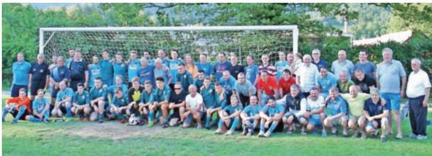
Udeleženci srečanja generacij