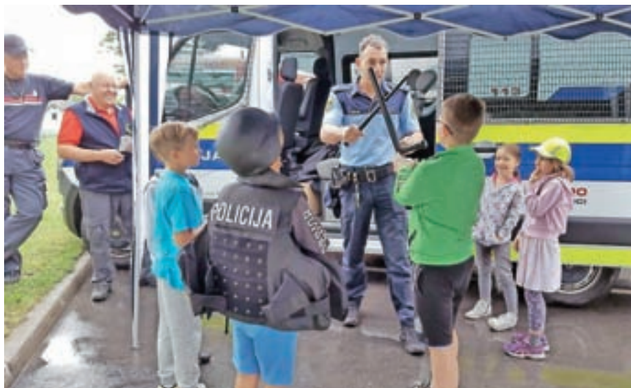
Otroke je močno pritegnila policijska oprema.

Poletne aktivnosti je finančno omogočila stranka Povezane lokalne skupnosti.