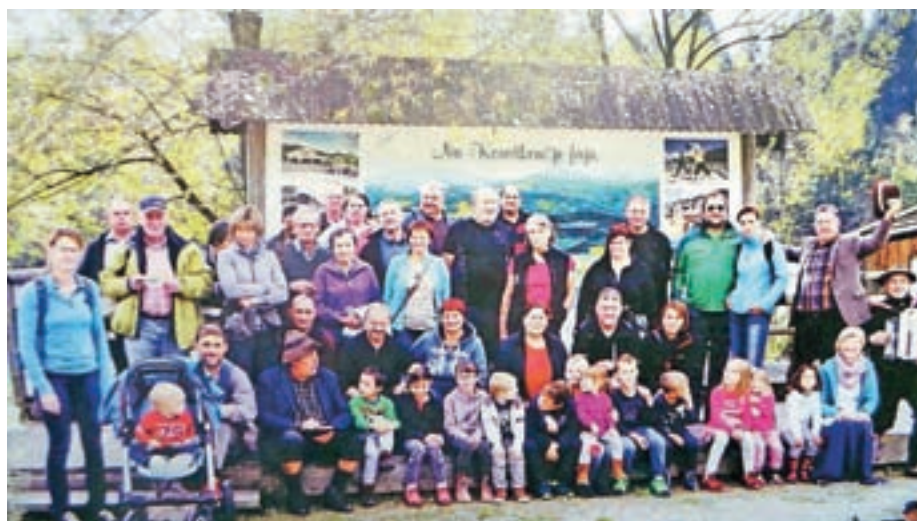
Ogledali smo si Koroško

teže mostu. Zaradi nosilnosti mostu si ni treba delati preglavic, saj prenese težo 1700 oseb.