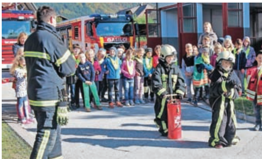
Zabaven obisk pri gasilcih

V okviru meseca požarne varnosti so učenci od 1. do 3. razreda preddvorske šole, ki so se jim pridružili šolarji iz Kokre, tudi letos obiskali gasilce domačega gasilskega društva. Čeprav je s strani prostovoljnih gasilcev za sodelovanje s šolo na delovni dan v dopoldanskem času potrebnega obilo prilagajanja, so se znova odzvali naši prošnji in nas prijazno sprejeli. Animacija z lutko, pravljica o Ježku Snežku in požaru, predstavitev postopka oživljanja, podrobna predstavitev gasilskih vozil in raznovrstne opreme, »sprehod« skozi vozilo, pomerjanje gasilske zaščitne obleke in ciljanje »tarče« z vodo ter prikaz gašenja z gasilnim