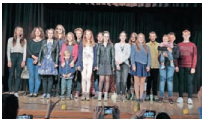
Letošnji nagrajenci za ljubezenska pisma