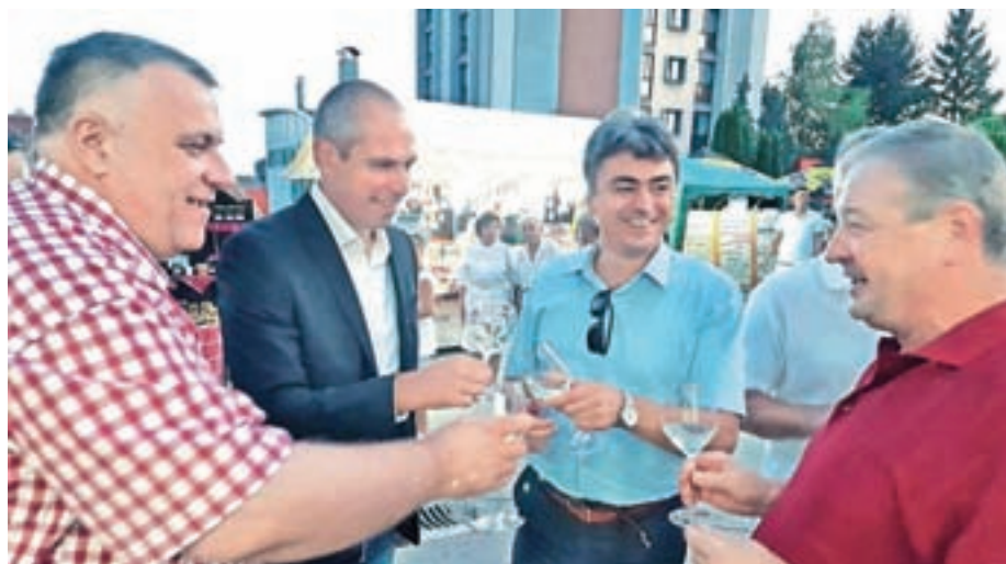
... in manj formalno

stilarno slivovke in mlin. "Navzoči so bili tudi predstavniki Vodnjana, tako da smo imele tri prijateljske občine ob tem dogodku tudi skupno medijsko predstavitev. Vse tri občine se dogovarjamo