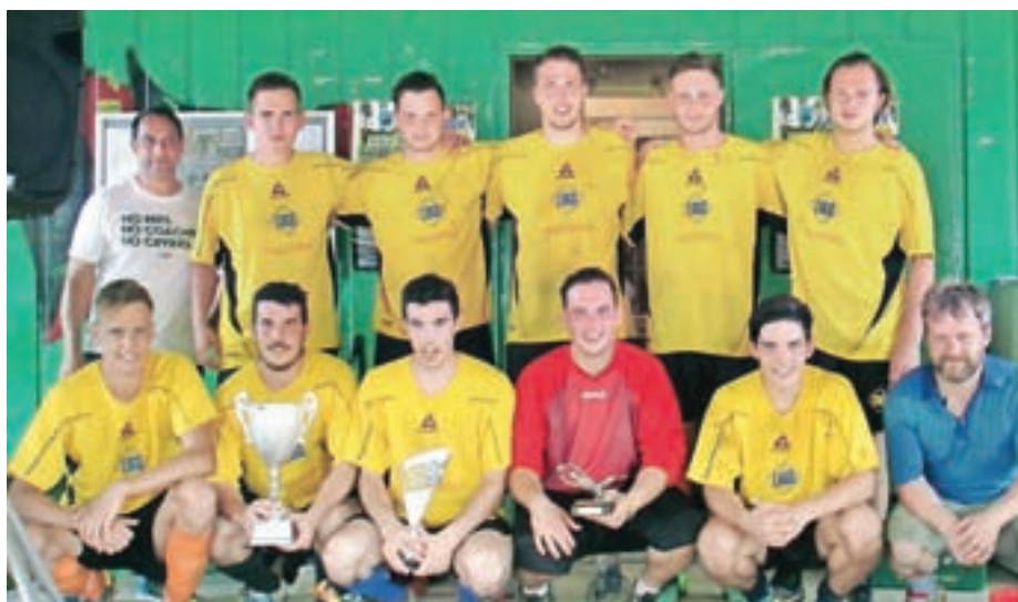
Zmagovalci prvenstva Cvetličarna Urška

Pri aktivnostih v zvezi s Športnim parkom Voke je prišlo do zapleta pri pogajanjih o odkupu sosednje parcele. Kljub temu nadaljujemo redno delo v novi tekmovalni sezoni 2017/18.