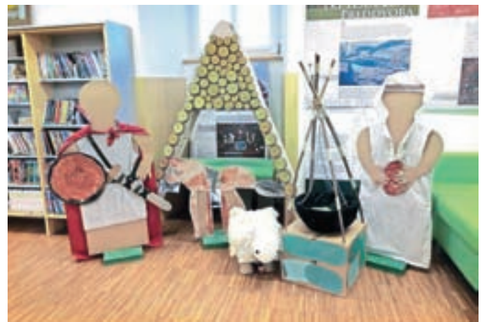
Z razstave o Slovanih v Preddvoru