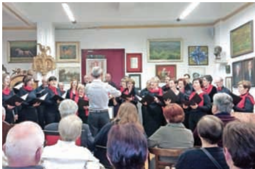
Osmega februarja so pripravili že tradicionalni recital ob kulturnem prazniku v Galeriji Mizarstva Ovsenik v Gorenjah pri Kranju.

V ponedeljek, 8. februarja, pa smo pripravili že tradicionalni recital ob kulturnem prazniku v Galeriji Mizarstva Ovsenik v Gorenjah pri Kranju. MePZ Musica viva Kranj-Primskovo je v Galeriji Ovsenik prvič nastopil ob odprtju Galerije pred dvajsetimi leti in z manjšimi prekinitvami nastopa vse do danes. Za naslov koncerta smo letos vzeli naslov pesmi mnogo prezgodaj umrlega pesnika Marka Pavčka To ni nobena pesem,