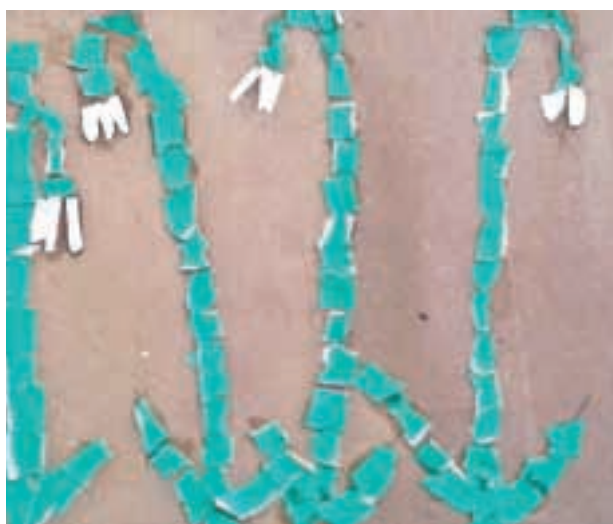
Aleks Skodlar, 1.e