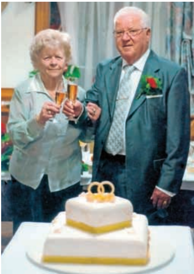
... in na nedavni biserni poroki

Mari in Marijan sta se spoznala na Primskovem. Oba sta plesala pri folklori, igrala v predstavah, kot je bila 'študentje smo' v petdesetih letih prejšnjega stoletja v tedaj zelo dejavnem Kulturno umetniškem društvu na Primskovem. Par sta bila pet let, preden sta se odločila za skupno življenje. Poročila sta se 11. februarja leta 1956 na mrzlo zasneženo soboto. Spominjata se, da je vso noč pred poročnim dnevom snežilo in v jutro so se zbudili s tridesetimi centimetri novozapadlega snega. Nevestin oče je hitro poprijel za lopato in odkidal novozapadli sneg vse od nevestinega doma v Kokrškem logu do vrha klanca na Primskovem. Ženin se je praznje oblekel v temno rjavo obleko s srjavo in kravato, za kar je kredit vzela teta Micka. Nevesta je oblekla nebesno modro obleko in preko temen plašč, poročni šopek pa je imela iz kal (po domače škronicljev) in asparagusa. Nevestina priča je bil brat Franc, ženinova pa stric Franc. Do magistrata v Kranju so ju pripeljali s kočijo na štirih kolesih ('sposojenim' avtom). Po zaobljubi na magistratu je sledila cerkvena poroka v kranjski stolnici, zavezal ju je k skupnemu življenju župnik g. Blaj. Prstana iz rumenega zlata je izdelal zlatar Rangus, v črno belo fotografijo pa je njun poročni portret zabeležil g. Kramar.