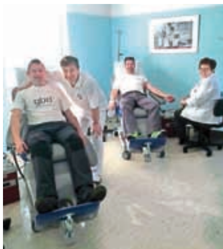
Še pred ogledom poletov v Planici smo se gasilci v petek zjutraj ustavili v SB Jesenice in darovali kri.

Želimo vam prijetne in varne pomladne dni. Z gasilskim pozdravom NA POMOČ.