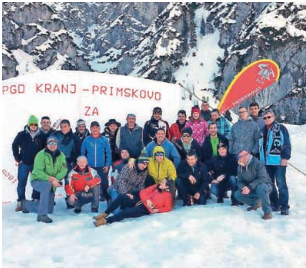
Tudi gasilci PGD Kranj-Primskovo smo prejšnji konec tedna navijali za naše orle v Planici.