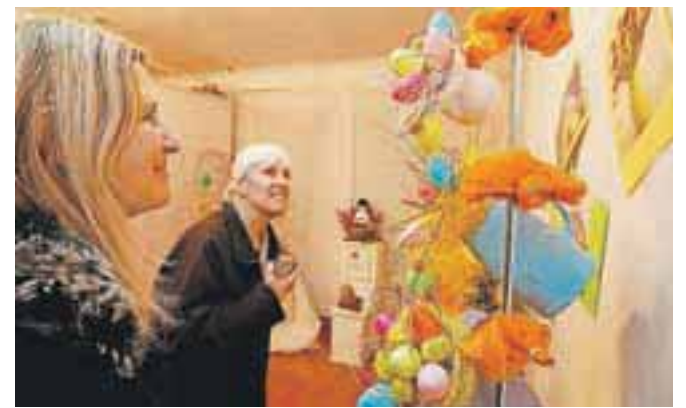
Dijaki Biotehniškega centra so predstavili pomladne trende v floristiki.