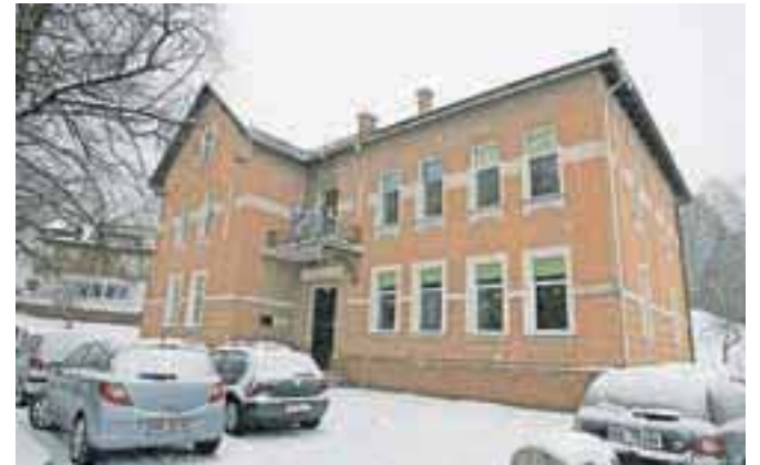
Dela na šolskem posloplju v Podbrezjah naj bi se začela v maju ter končala prve dni septembra, ko šola praznuje stoletnico.

Energetska sanacija stavbe vrtca Rožle je z občinskim proračunom načrtovana za prihodnje leto, v popolnem obsegu pa naj bi se dela začela izvajati po selitvi otrok v novi vrtci. Načrt energetske sanacije stavbe ter ostalih vzdrževalnih del je Projektivno podjetje Kranj. Vzdrževalna dela na objektu, ki niso predmet energetske sanacije so v projektu obdelana ločeno in predstavljajo samostojno fazo gradnje. Slednjim je občina vložila prijavo na razpis Ukrep 322 Razvoj podeželja, na odločitve o vlogi pa še čakajo.