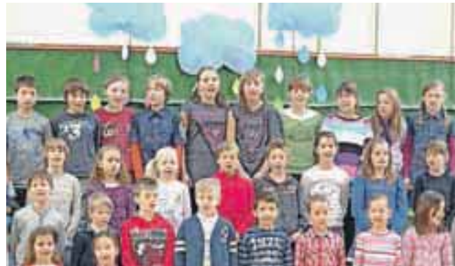
Otroci so peli, plesali, igrali na inštrumente, deklamirali, imeli mini modno revijo ...