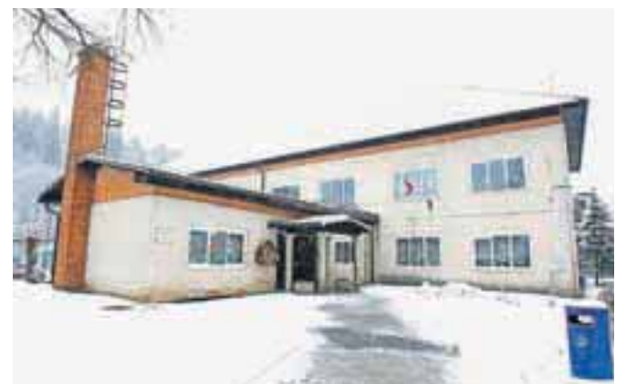
V sklop gradnje prizidka k šoli v Dupljah sodi poleg zunanje ureditve parkirišč tudi energetska sanacija obstoječega objekta, ki se bo nadaljevala in končala v prihodnjem letu.

Na podlagi Odloka o priznanjih občine Naklo (UVG, št. 42/99) objavljam: