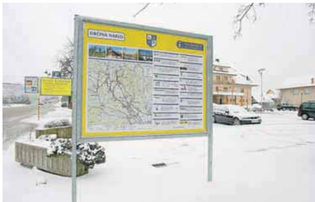
Obnovljena turistična tabla v Naklem, ob gostilni Marinšek

Vse knjige, ki so izločene iz obtoka izposoje iz Krajevne knjižnice Naklo, so na voljo v sejni sobi občine Naklo. Knjige vzamete brezplačno, marca je na voljo strokovna literatura, z aprilom bodo romani. S. K.