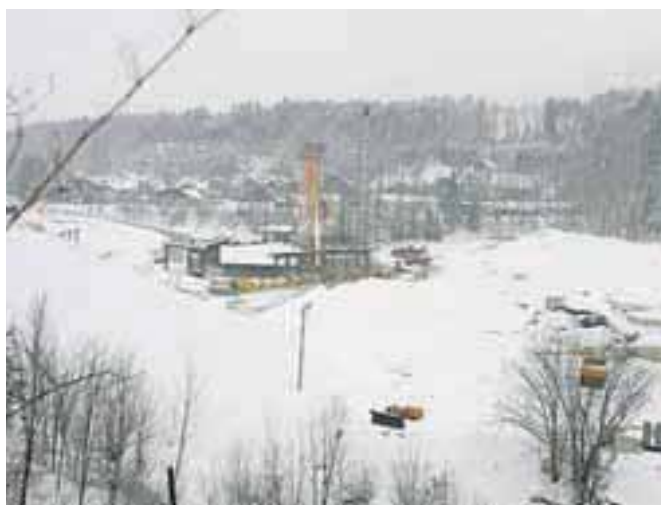
Na lokaciji asfaltne baze je predvidena gradnja stanovanjske soseske.