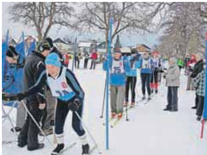
Na startu dupljanskega teka