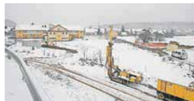
Graditi so začeli že pred zadnjim sneženjem.