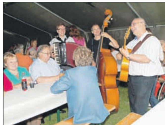
Stanovalce in povabljenke je na pikniku zabavala glasbena skupina Mešano na žaru.

Kot že vrsto let so tudi letos v Domu starejših občanov v Preddvoru pripravili tradicionalni piknik za svojce, prijatelje in znance njihovih stanovalcev. Družili so se tudi v njihovi enoti Naklo, piknik so v Naklem pripravili prvič. Poleg hrane, ki sodi na piknik, so pekli še slastne palačinke, zaplesala je Folklorna skupina OŠ Naklo, lahko so se udeležili ustvarjalnih delavnic. Stanovalce in druge povabljenke je zabaval bend Mešano na žaru. Čeprav bi sobotni naliv lahko prekinil piknik, se niti osebe enote niti drugi niso prav nič dali motiti. Nadaljevali so pod streho šotora in v avli doma ter uživali v prijetnem vzdušju. A. B.