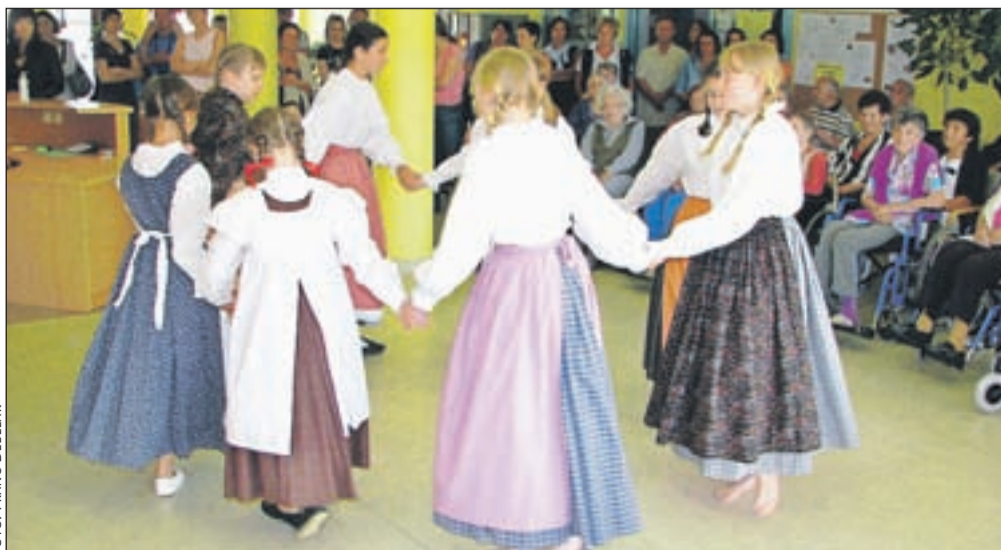
Svojim gostiteljem so Pastirčki pripravili popoldan, poln spominov na mladost.

in igrice v odrski postavitvi z naslovom Gajc, gajc, gajc - dile polne jajc!. Vmes so vesele melodije uredili glasbeniki - dva harmonikarja in klarinetist.