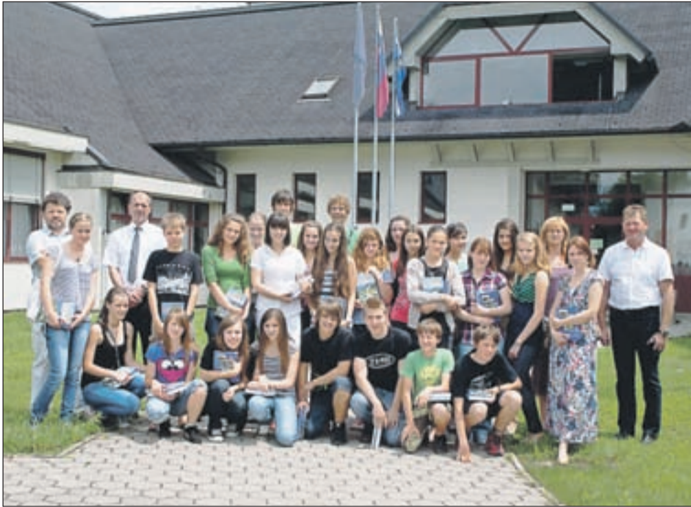
Letošnja generacija odličnjakov v družbi župana in ravnatelja