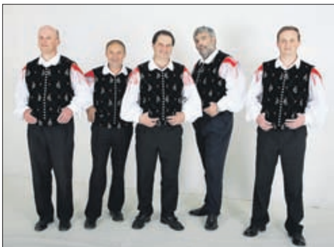
Kvintet Vedrina

Moški vokalni kvintet Vedrina je maja praznoval petindvajsetletnico delovanja. V tem času si je utrdil mesto v domačem glasbenem prostoru. Pevci so se zbrali zara-