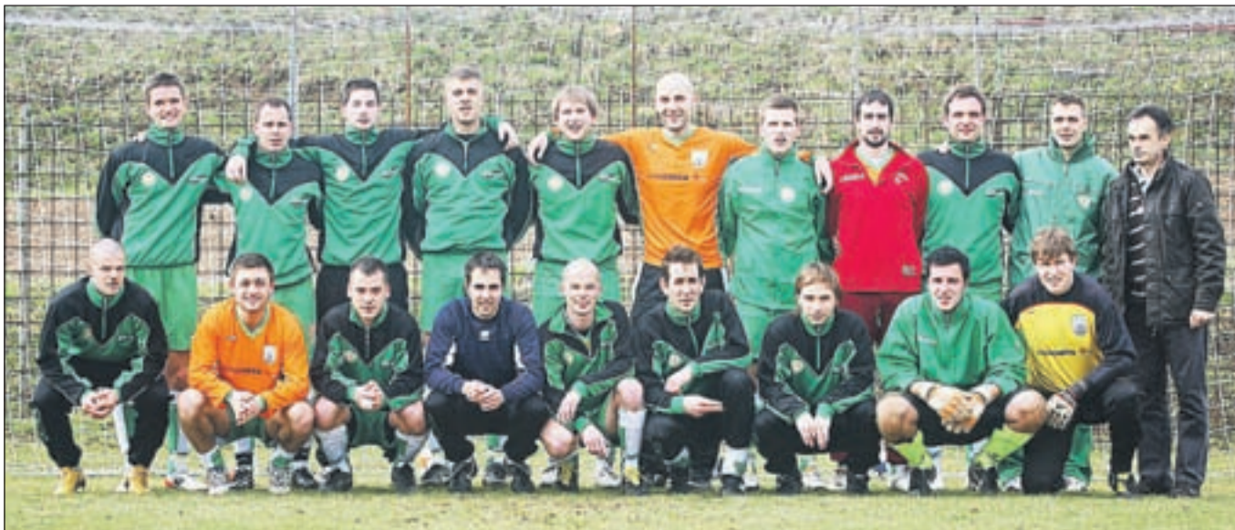
Ekipo NK Naklo je spomladanski del prvenstva odigrala bolje kot jesenskega. Točk pa je bilo precej premalo za obstanek v tretji slovenski ligi.

Kot je pojasnil, ekipa za novo sezono najbrž ne bo ostala enaka: "Nekaj igralcev bo verjetno odšlo, ker jih igranje v 1. gorenjski ligi ne zanima. Trener bo ekipo najbrž skušal okrepiti z mladinci, domačimi mladimi fanti." V klubu so ponosni tudi na igralce v ekipah v mlajših selekcijah, ki igrajo v 1. gorenjski ligi.