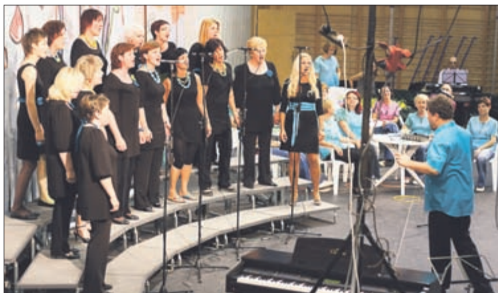
Na slovesnosti ob občinskem prazniku bo nastopil tudi Učiteljski pevski zbor Osnovne šole Naklo. Nastopili so tudi na 13. mednarodnem koncertu pevskih zborov junija v Trziču (na sliki).