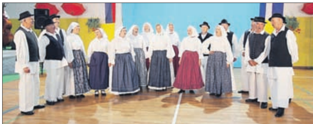
Celovečerni nastop Folklorne skupine Društva upokoencev Naklo

Celovečerni nastop z gosti je FS DU Naklo ob petnajstletnici priredila v prostorih Osnovne šole Naklo. "Prvič so bili na sporedu štirje spleti plesov, s katerimi smo se uvrstili na državno revijo. Nov je splet plesov iz Bele krajine, avtor odrske postavitve je Janez Florjanc - Fofa. In kot tretjič sem želel, da bi bil večer ubran tudi v pesmi. Nepogrešljiv je bil tudi nastop Otroške folklorne skupine Podkuca," je povzel Košič.