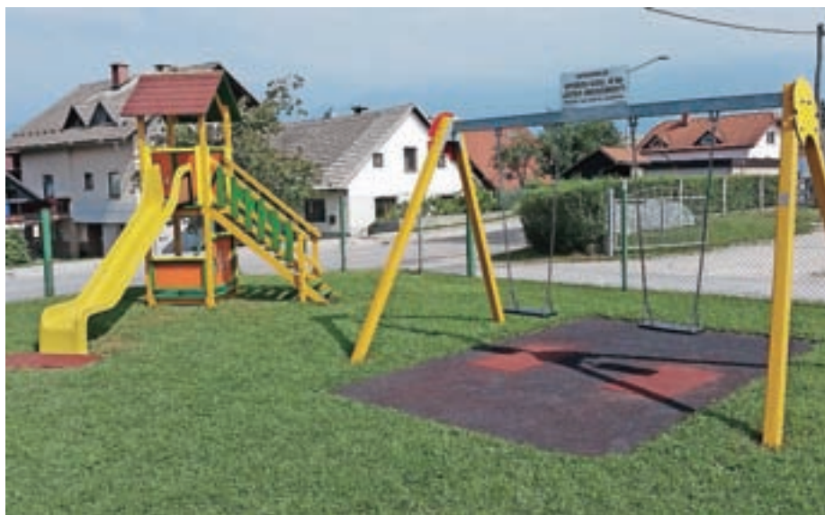
Igrala po obnovi