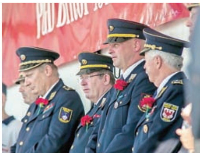
Na govorniškem odru