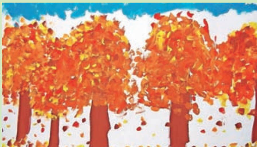
Dejavnost knjižnice se lepo dopolnjuje s šolo. Slika Mance Gorjanc iz tretjega razreda OŠ Predoslje.