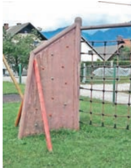
Treba bo obnoviti še plezalno steno.