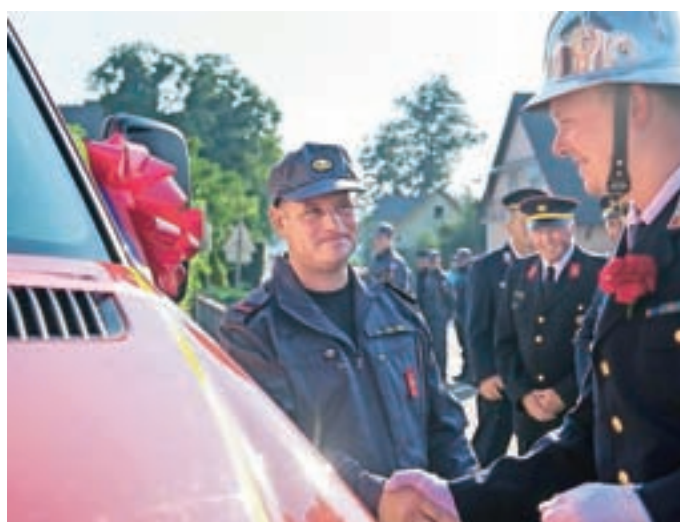
Da bo novo vozilo služilo svojemu namenu ...