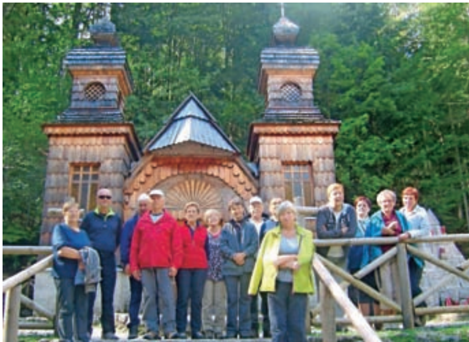
S planinskega izleta na Slemenovo špico in z obveznim postankom pri Ruski kapelici (na sliki)

O vseh dogajanjih člani obveščajo poverjenice, ki prav tako kot vodje sekcij, ki organizirajo aktivnosti, opravljajo svoje delo prostovoljno. Poverjenice moram pohvaliti za redno in hitro pobiranje članarine, saj smo med najbolj pridnimi na Gorenjskem, članarina pa je pomemben del naših prihodkov. Na pomoč nam je priskočila tudi Mestna občina Kranj, tako da društvu finančno pokrije del vseh dejavnosti in jih tako še bolj približa članom.