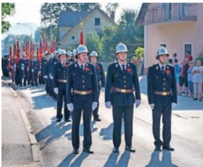
Gasilska parada skozi Britof