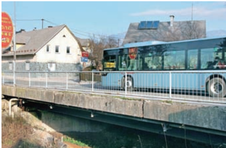
Most čez Kokro je dotrajan in čaka na obnovo.

Prav veliko sicer letos ob razpoložljivih sredstvih, teh pa je vse manj, je opozoril Globočnik, niso mogli narediti. Omenil je zdaj lepo urejeno igrišče za prstomet, ob katerem so postavili brunarico, v kateri bo nekaj del treba postoriti še v prihodnjem letu in Globočnik upa, da bodo tudi za to lahko namenili še nekaj denarja. Finančno so pomagali Prostovoljnemu gasilskemu