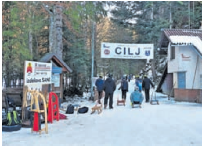
Naravno sankališče Savske jame

zati po spletni banki. Progo sicer urejajo povsem prostovoljno, prispevke pa porabijo