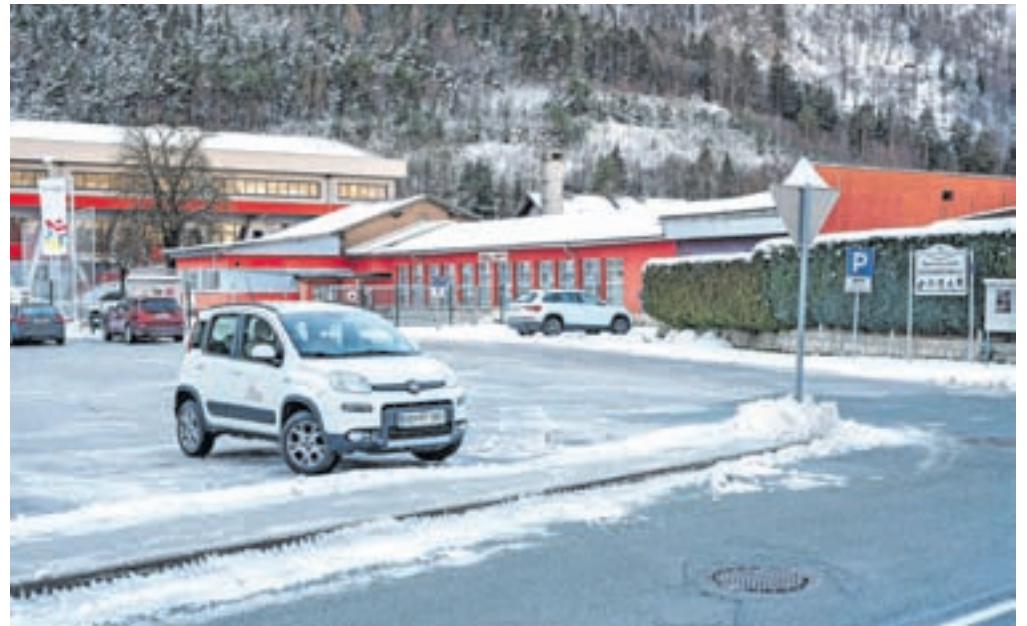
Parkirišče pred Športnim parkom Podmežakla naj bi v prihodnje postalo plačljivo.

Občinski svetniki so začeli tudi obravnavo predloga, po katerem bi parkiranje na asfaltiranem parkirišču pred Športnim parkom Podmežakla postalo plačljivo. Gre za parkirišče za osebna vozila pred zapornico ob vstopu v park, ki je v upravljanju Zavoda za šport. Kot so pojasnili v občinski upravi, je namenjeno uporabnikom Športnega parka Podmežakla, od pomladi do jeseni pa ga kot izhodiščno točko množično uporabljajo kolesarji, ki se po daljinski kolesarski povezavi odpravijo proti Kranjski Gori. Svoja osebna vozila pustijo na parkirišču večji del dneva, s tem pa zasedajo parkirni prostor, namenjen uporabnikom športnega parka. Zato so pripravili predlog novega parkirnega režima, občinski svetniki pa so v razpravi