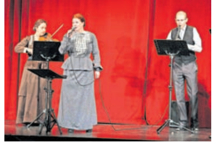
Suhe hruške so pripravile prijeten glasbeno ter tudi plesno obarvan večer. Njihov cilj pa je bila dobra volja.

koledniško vsebino, medtem ko so v drugem delu godci izvajali bolj zabavne ritme, vključno z nekaj popevkami. Šolar je poudaril, da je njihov repertoar osredotočen na ljudske in narodnozabavne zvoke, včasih pa presenetijo tudi z nečim posebnim. Koncert je poleg godcev, »oboroženih« s harmoniko, violino,