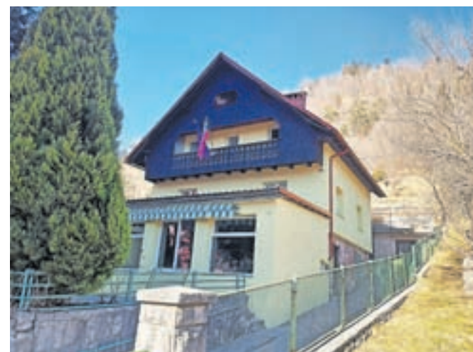
Obnovljena zunanost doma Društva upokojencev Jesenice

zdravstvena in druga predavanja ter digitalna izobraževanja. Veliko pozornosti so namenili prostovoljstvu, predvsem v okviru projekta Starejši za starejše in medgeneracijskega sodelovanja. Pomemben dosežek pri gospodarjenju z društvenim domom je bila obnova zunan-