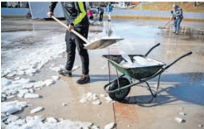
Pred rajanjem dolgo v noč je treba urediti tudi vse za postavitev šotora.

Pogovori in usklajevanje tem se je začelo že nekje oktobra, aktivno pa se s pustno povorko ukvarjajo v zadnjem mesecu. »Brez prostovoljstva ne bi šlo. V delo je vključenih ogromno ljudi, več kot tristo, na pripravah pa sodeluje staro in mlado,« sta pojasnila. Materiale za pustni karneval v veliki meri ljudje podarijo, posodijo, organizatorji pa razmišljajo tudi trajnostno, zato se strnice za vozove vsako leto shranijo in znova uporabijo.