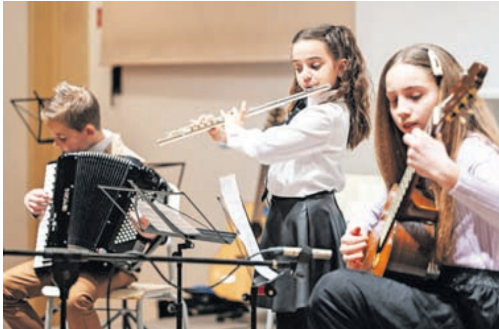
Na tokratnem festivalu se je predstavilo kar 33 družin, ki so pridno pilile svoje nastope.