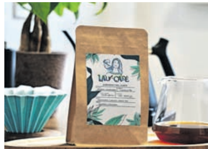
Kavo sta poimenovala Lau Café, kar v prevodu pomeni Laurina kava, na embalaži pa je podoba Laure, ki jo je narisal njen brat.

»kofetarica«, v Kolumbiji po navadi pijejo kavo na način »tinto«, medtem ko si pri nas kavo pripravlja na različne načine, od espressa, filter kave do tako imenovanega french pressa. Nad kolumbijsko kavo pa se je navdušila tudi Tonijska mama, ki jo običajno pripravi na klasičen način, po turško.