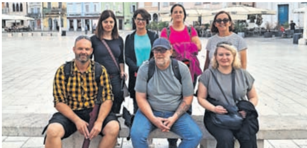
Ekipo društva Žarek