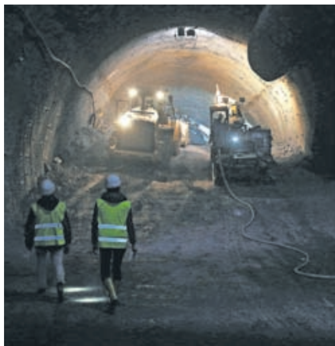
Dars v sklopu gradnje druge cevi predora Karavanke vodi projekt Karavanški vodovod.

Kot je na seji odbora za gospodarstvo in gospodarske javne službe dejal direktor javnega komunalnega podjetja Jeko Uroš Bučar, mora biti obnova vodovoda prva prioriteta. Poškodbe na