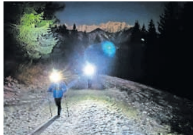
Pohod ob prvi januarski polni luni je posebno doživetje.

je ob jasnem vremenu in polnem sijaju lune potekal 14. pohod, ki vsako leto privabi od 70 do 100 pohodnikov. Pot jih je vodila od Planine pod Golico do vrha Španove-