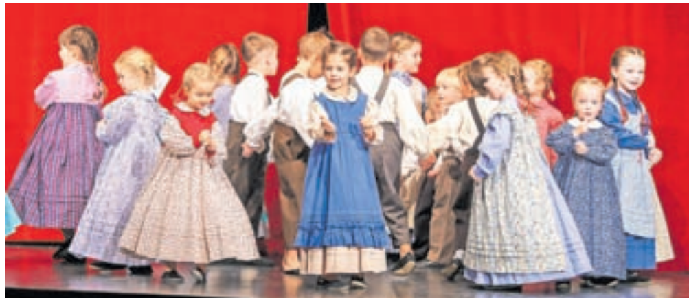
Otroška folklorna skupina Jabčki je poskrbela za kar nekaj vzdihljajev navdušenja in razneženosti.