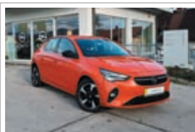
Opel Corsa-e 5,99 % obrestna mera pri financiranju

1. registracija: oktober 2020 Prevoženi km: 103.688 Motor: elektro, 100 kW