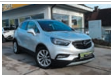
Opel Mokka X 4x4 pogon

1. registracija: oktober 2018 Prevoženi km: 86.926 Motor: dizel, 1598 ccm, 100 kW (136 KM)