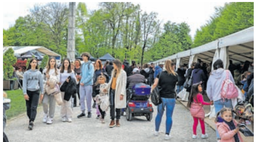
Organizatorji ocenjujejo, da je tokratni Festival čokolade v Radovljico privabil približno 25 tisoč obiskovalcev.

so presodili, da je zmagovalni praline crunchy yuzu iz čokoladnice Lucifer, drugo mesto si je prislužil praline