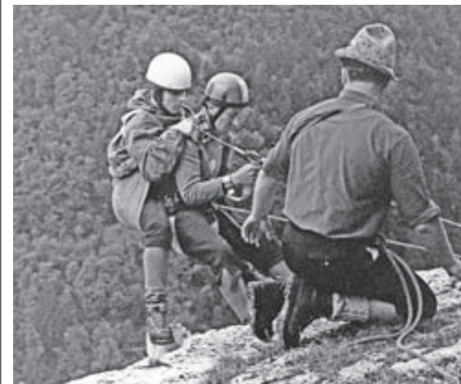
Letna vaja tehnik reševanja v Dragi leta 1970