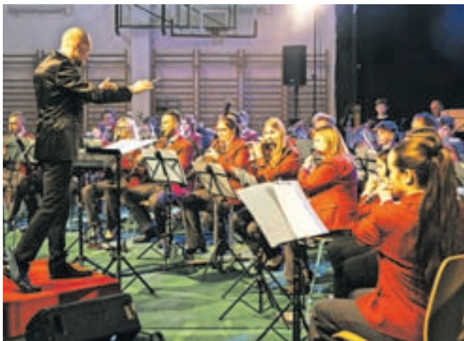
Pihalni orkester Lesce na koncertu