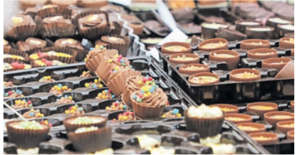
Od klasičnih slaščic iz mlečne, temne in bele čokolade pa do tistih eksotičnih z različnimi citrusi, zelišči in oreščki

Poznavalci festivala dobro vedo, da v graščini poteka tudi glasovanje za naj praline po izboru obiskovalcev. V čokoladnici Zotter v Avstriji