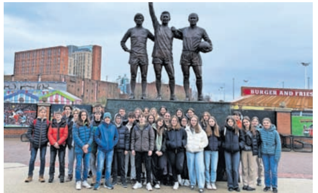
Pred nogometnim stadionom Old Trafford v Manchesteru