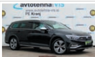
Volkswagen Passat Park Assist krmilna avtomatika

1. registracija: marec 2021 Prevoženi km: 139.180 Motor: dizel, 1968 ccm, 147 kW (200 KM)