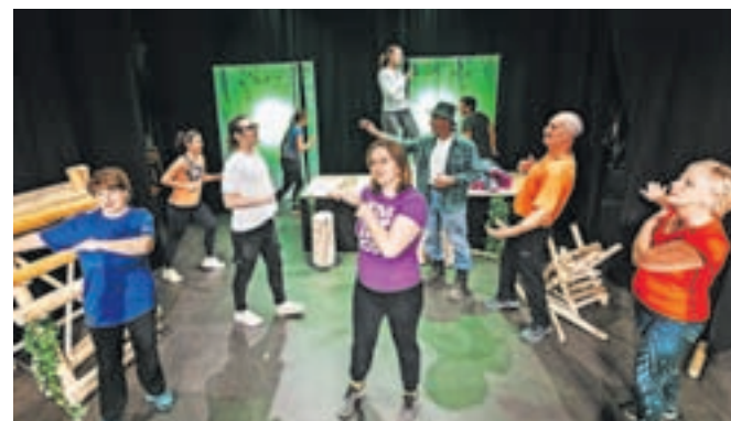
V Linhartovo dvorano tokrat prihaja le Gledališče Belansko s predstavo Delamo na sebi.

da se bodo potrudili, da se boste gledalci na predstavi nasmejali. Vstop na predstavo je brezplačen. Gledališče Belansko Kulturnega društva Bohinjska Bela je letos edina skupina odraslih z območja radovljiške izpostave Javnega sklada RS za kulturne dejavnosti, ki se je prijavila na srečanje. Med 10. junijem in 13. junijem pa bo Območna izpostava Javnega sklada RS Radovljica v Linhartovi dvorani gostila štiri najboljše gledališke predstave za odrasle z Gorenjskega po izboru selektorja Roka Kravanja. Tudi vstop na te predstave bo brezplačen.