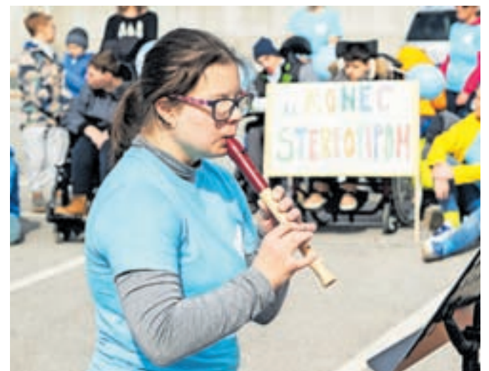
Ob svetovnem dnevu Downovega sindroma so se v znamenju pesmi in plesa družili tudi v Lescah.