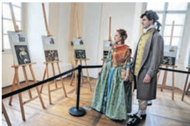
Mozaiki so bili v času festivala na ogled v Baročni dvorani Radovljiške graščine.

»Namen je bil, da se z mozaiki posladkajo otroci in odrasli, ki morda na festival ne morejo. Zato jih bomo predali bivalnim skupnostim in oddelkom Centra za delo, usposabljanje in varstvo Radovljica, pediatričnemu oddelku Bolnišnice Jesenice, domu starejših občanov v Radovljici ter Kriznemu centru za mlade Kresnička.«