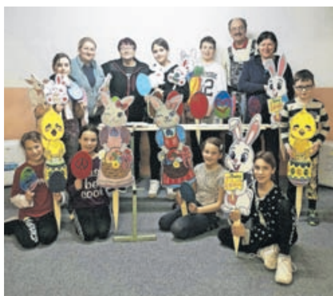
Udeleženci delavnice z mentorjema in izdelki