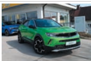
Opel Mokka-e 100 % električni pogon

1. registracija: maj 2021 Prevoženi km: 58.912 Motor: elektro, 100 kW