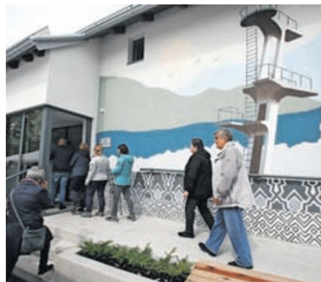
Osrednji motiv poslikave stavbe predstavlja silhueta nekdanjega skakalnega stolpa arhitekta Ivana Vurnika pred silhueto vrhov karavanskih gora.