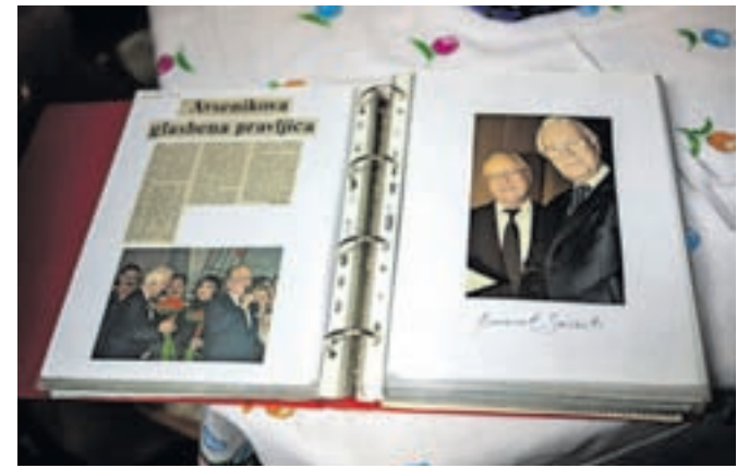
Album z izrezki člankov o Ansamblu bratov Avsenik; pod fotografijo Slavka in Vilka Avsenika je kot posebna dragocenost tudi Slavkov originalni podpis.