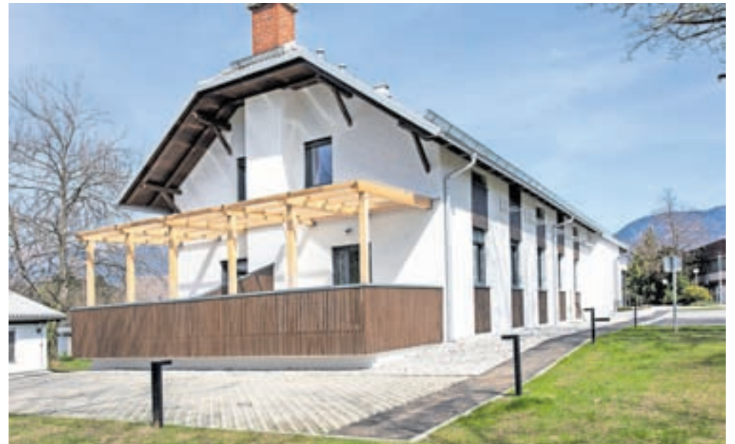
Stanovanja so uredili v stavbi nekdanje gostilne Kozolec, kjer je imelo pred prenovitvijo prostore tudi društvo upokoјencev.

Približno milijon in pol evrov vredna investicija je bila v 36 odstotkih financirana iz evropskih sredstev, sklad pa bo stanovanja oddal v najem z javnim razpisom. Upravičenci za pridobitev so osebe s statusom upokoјenca ali druge starejše osebe, stare nad 65 let, ki izpolnjujejo tudi vse druge pogoje razpisa. Ta je objavljen na spletni strani nepremičninskega sklada.