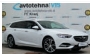
Opel Insignia Intelli-Lux LED matični žarometi

PE Kranj, C. Staneta Žagarja 53a, 04 281 71 70