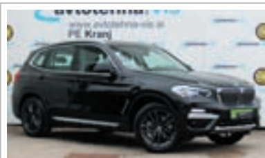
BMW X3 ogrevani sedeži in volanski obroč

PE Kranj, C. Staneta Žagarja 53a, 04 281 71 70