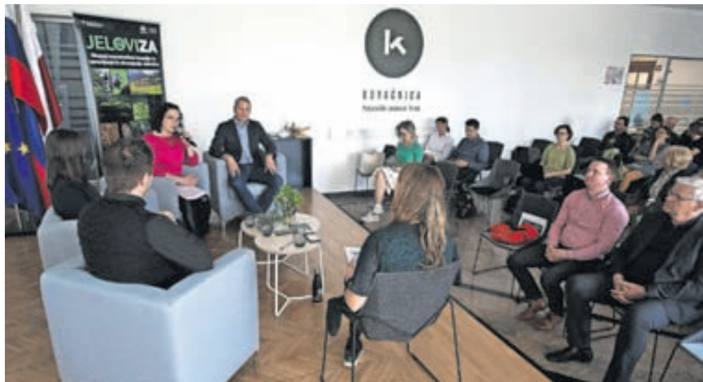
Z zaključnega dogodka projekta JeloviZA