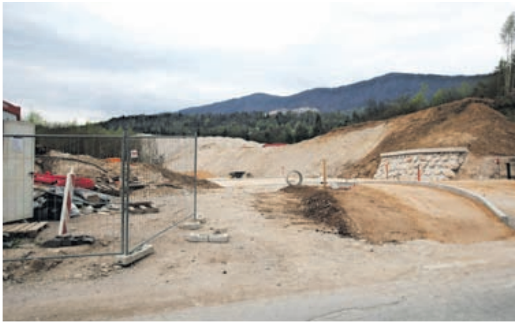
Območje nad Zbirnim centrom Radovljica komunalno opremljajo, do konca leta pa bosta tam stala nova nadstrešnica za vozila in skladiščni prostor Komunale Radovljica. V prihodnjih letih načrtujejo tudi selitev upravne stavbe podjetja.

V drugi fazi je na območju načrtovana tudi gradnja nove upravne stavbe. Ob tem na Občini Radovljica poudarjajo, da bo komunalno opremljeno območje tudi priložnost za razvoj dejavnosti drugih gospodarskih subjektov. Projekt namreč omogoča širitev gospodar-