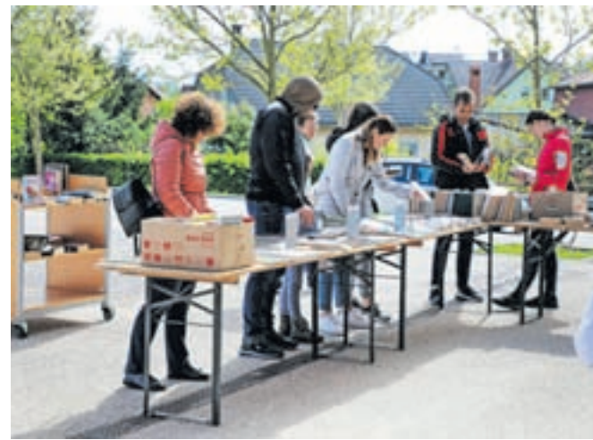
Knjižni sejem ob svetovnem dnevu knjige

»Praznovanje dneva knjige je sicer povezano s starim ljudskim običajem, ki izhaja iz Katalonije, ko so si Katalonci od nekdaj na dan svetega Jurija 23. aprila podarjali vrtnico in knjigo. Rekli so: Vrtnica je za ljubezen, knjiga pa za vedno! Dan je posvečen promociji branja, hkrati pa je želja spodbuditi ljudi, še posebej mlade, da odkrijejo užitke branja in pridobijo