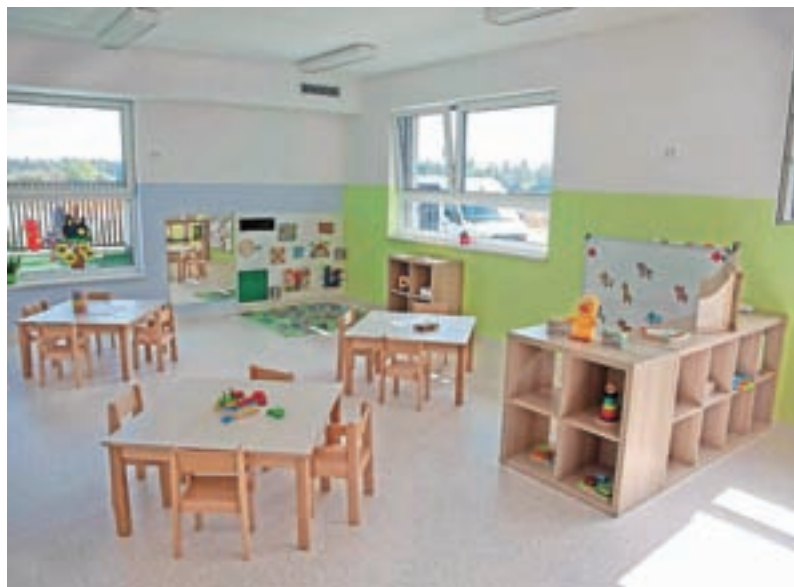
Notranji prostori sodobno opremljenega vrtca