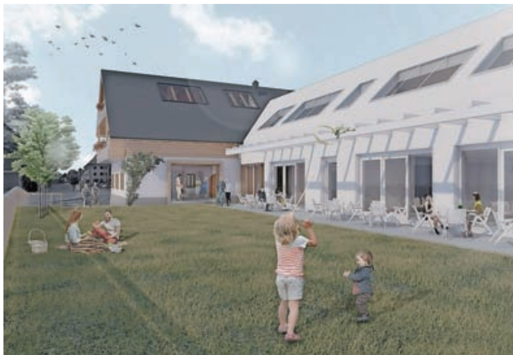
Takole bo videti Blagneča hiša po končani gradnji.

Po pogajanjih in uskladitvi pogodbe z aneksom pa so se dela vendarle lahko začela. Pogodbena vrednost objekta znaša 761 tisoč evrov (z DDV).