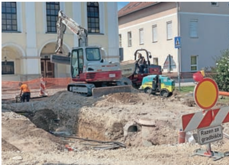
V Voklem (na sliki) in na Prebačevem potekajo gradbena dela.

Prebačevo in Voklo sta še zadnji dve naselji v občini Šenčur, ki nimata v celoti zgrajene komunalne infrastrukture. Dela bodo dokončana do avgusta prihodnje leto.