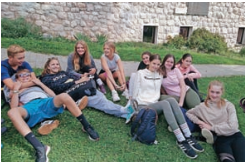
Sproščeno druženje na športnem dnevu