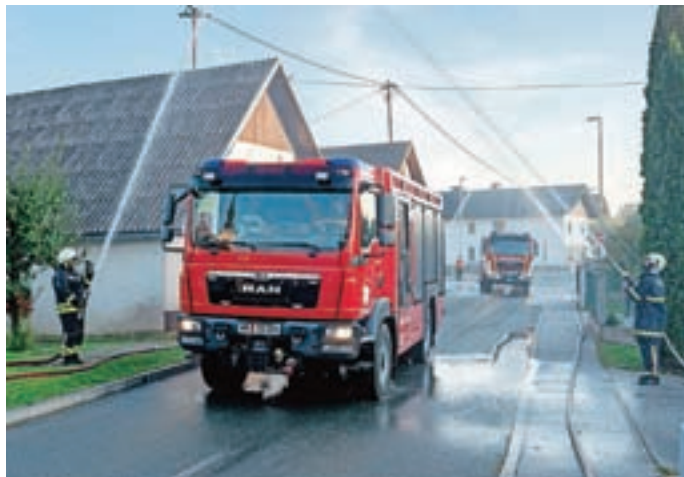
Sprejem novega vozila v Hotemažah

Vozilo je v tridesetih odstotkih financiralo PGD Hotemaže, sedemdeset odstotkov pa je prispevala Občina Šenčur.