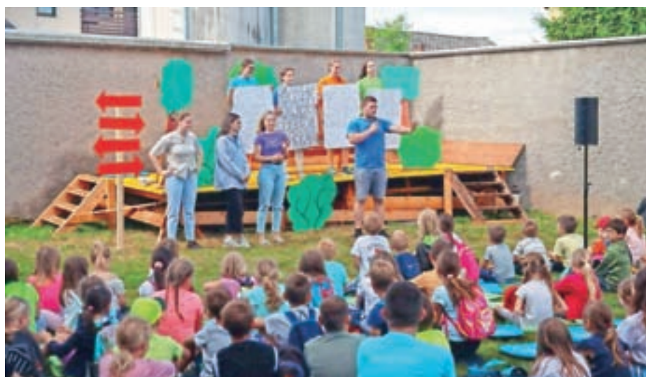
Razporeženje na letošnjem oratoriju je bilo sproščeno kot vedno.

Od 5. do 10. julija je v Šenčurju potekal poletni oratorij. Prve tri dni so bili na oratoriju mlajši otroci, druge tri dni pa so ga obiskovali starejši otroci. S smehom, veseljem in igrivostjo so otroci skupaj z animatorji spoznavali blaženega Carla Acutisa. Petinštirideset pogumnih animatorjev je 130 otroškimi nasmehom predstavilo vrednote zmernosti, vedoželjnosti in dobrosrčnosti. Med popoldanskimi velikimi igrami pa je bilo ogromno smeha, teka in skakanja gor in dol. Tako otroci kot animatorji smo do konca uživali!