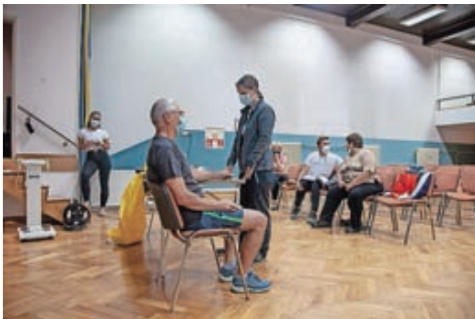
Občani so si lahko izmerili tudi krvni tlak.