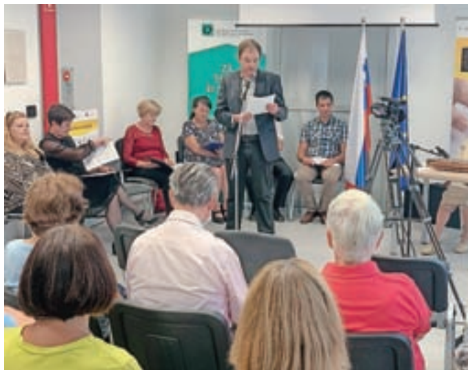
Člani KUD Valentin Kokalj Visoko so prebirali odlomke Finžgarjevih del.