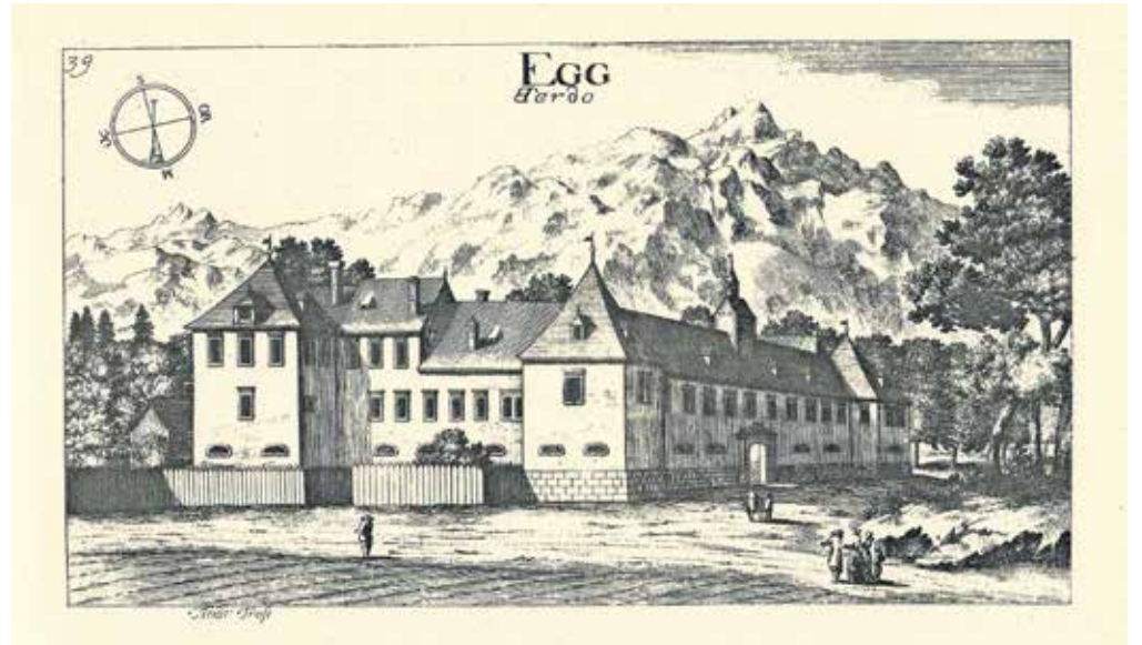
Grad Brdo na Valvasorjevi upodobitvi iz 17. stoletja ...

Posestvo je bilo sicer v sedemdesetih letih prejšnjega stoletja ograjeno z nekaj manj kot deset kilometrov dolgo ograjo, okrog katere na zunanji strani poteka v glavnem makadamska pot, ki omogoča sprehode, tek in kolesarjenje. Rezidenco in celotno posestvo je v času socializma stalno nadzorovalo številno varnostno osebje in