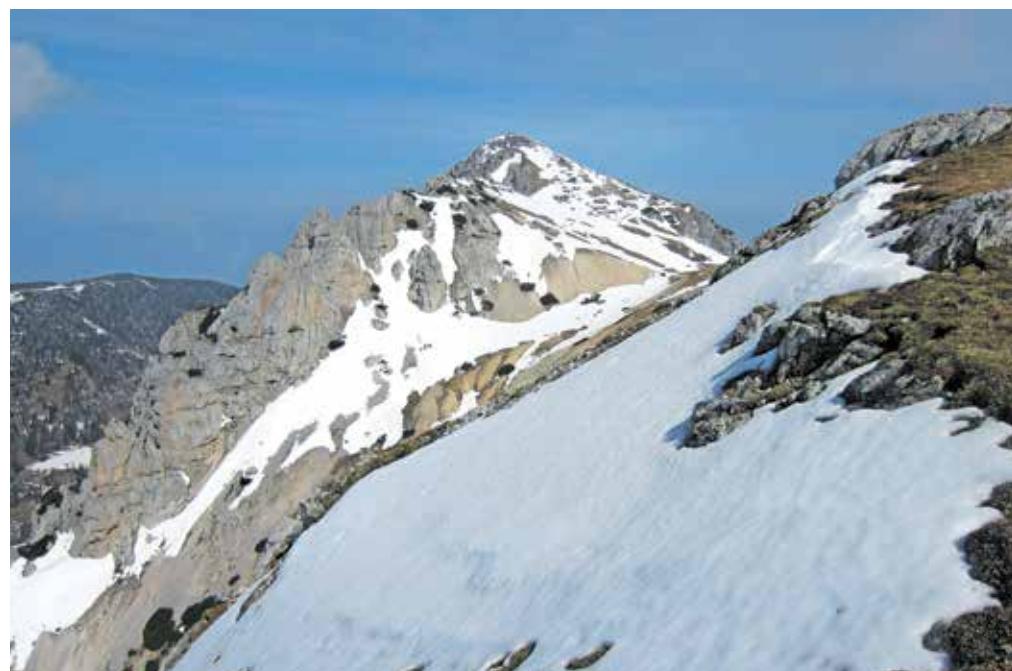
Pogled na vrh Obirja, ko prihajamo iz smeri sedla Šajda / Foto: Jelena Justin

Obir je mogočna, proustoječa gorska veriga, ki je od sosednjih vrhov ločena z globokimi dolinami in se dviga skoraj 1800 metrov nad Dra- vsko dolino. Zaradi bogatih