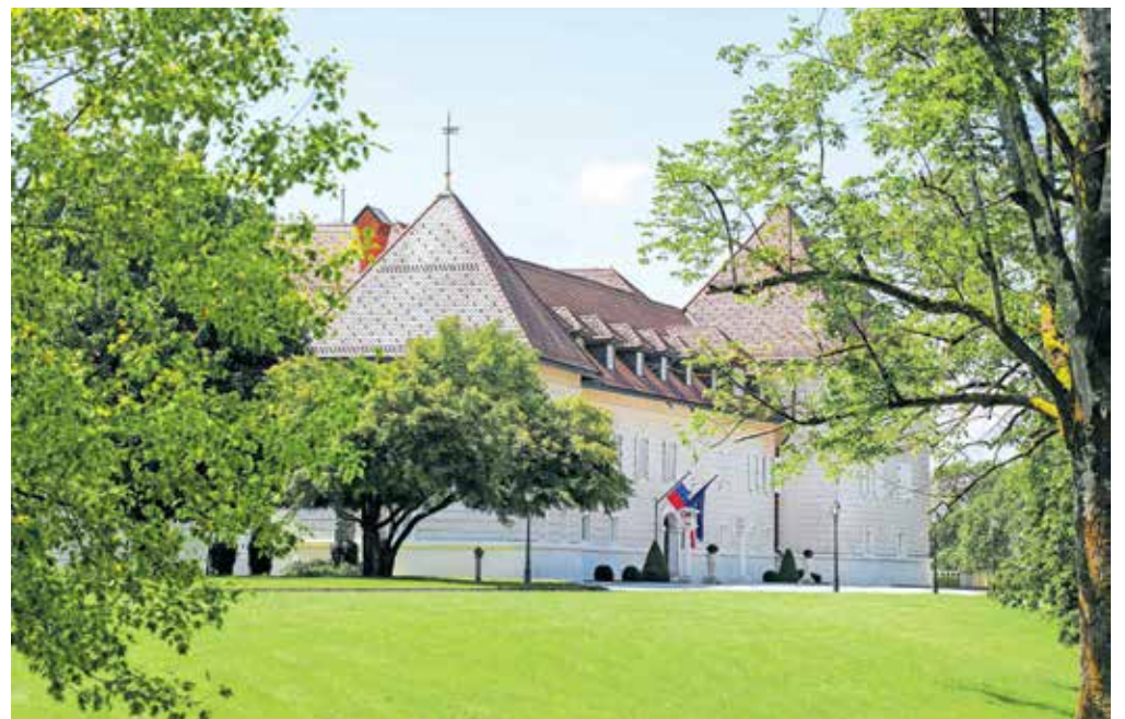
... in pogled nanj z enake točke danes.

Poleg protokolarnе vloge je grad Brdo pomemben tudi v ohranjanju kulturne dediščine. Grajski saloni in hodniki se ponašajo z bogatimi zbirkami kipov in slik slovenskih umetnikov, stilnega pohištva iz različnih zgodovinskih obdobj, dragocenih kristalnih lestencev, preprog, ima pa tudi bogato založeno grajsko knjižnico.