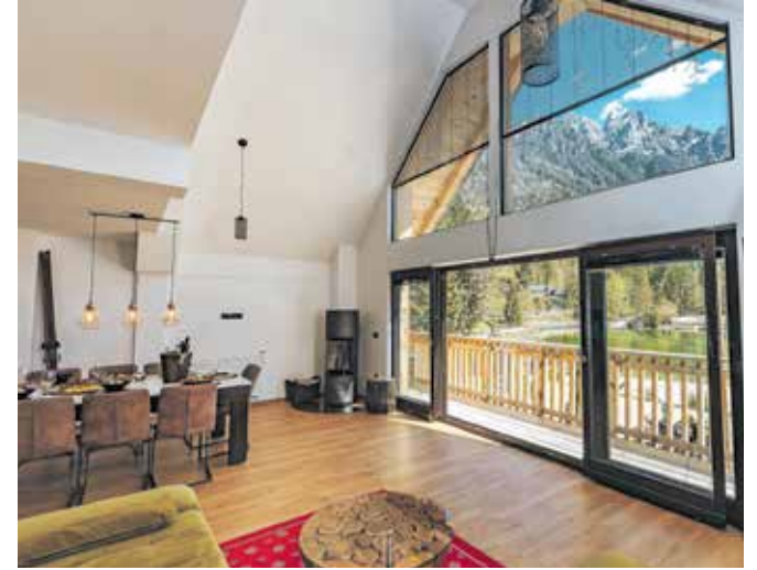
Apartmenti, zgrajeni kot dihalnice

Če se vrnemo k naravnim danostim Jasne. Vodo v jezera poskušajo vzdrževati na 19 stopinjah Celzija, kar je primernejše za osvežitev kot kopanje v njej. »S tem je manj negativnih vplivov na kakovost vode.« In še nekaj drugih podrobnosti. Iz odsluženih smučarskih gondol, ki so jih pripeljali s Kanina, jih reciklirali in jim vdahnili novo življenje, bodo v Jasni naredili intimne prostore restavracije za večerje za dva. Na voljo je tudi brezplačno parkirišče za motoriste, njim so namenjene tudi prav posebne klopi v naravni senci. V Jasni trenutno zaključuje 18-mesečni projekt »sanatorija za poškodovane bodike«, kjer so uspeli rešiti več kot polovico pomrznjenih