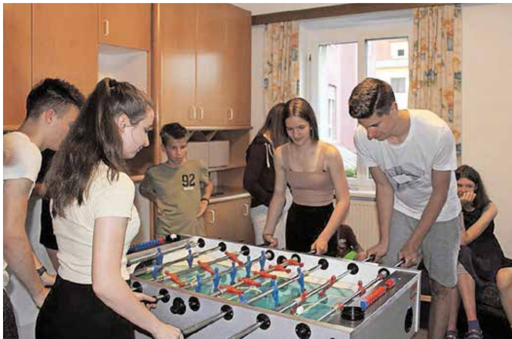
V Slomškovi hiši je poskrbljeno tudi za razvedrilo.