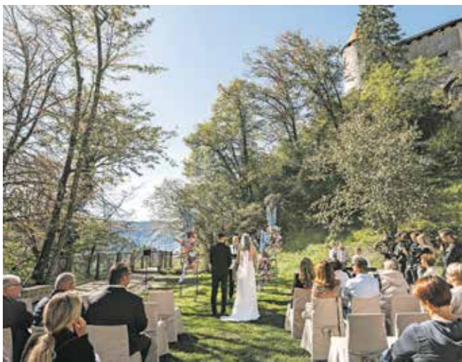
Grajski park je ena od treh poročnih lokacij na Blejskem gradu. / Foto: Ana Gregorič

Poletje v Festivalni dvorani Bled bodo oblikovali mednarodno priznani festivali, ki jih Zavod za kulturo Bled organizira v sodelovanju s partnerji. Med 26. in 30. junijem letos že drugič prihaja Festival sodobne glasbe .abeceda. V organizaciji inštituta .abeceda se bosta vsak dan zvrstila po dva večerna koncerta. Koncerti ob 19. oziroma 20. uri bodo posvečeni glasbenikom mlajše generacije, uro kasneje pa bodo obiskovalci v izvedbi ansambla .abeceda prisluhnili večinoma novim skladbam, ki jih bodo posebej za to priložnost ustvarili