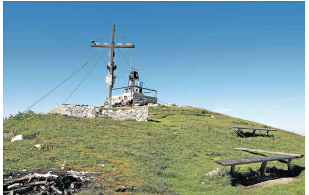
Vrh Obirja oziroma Ojstrca