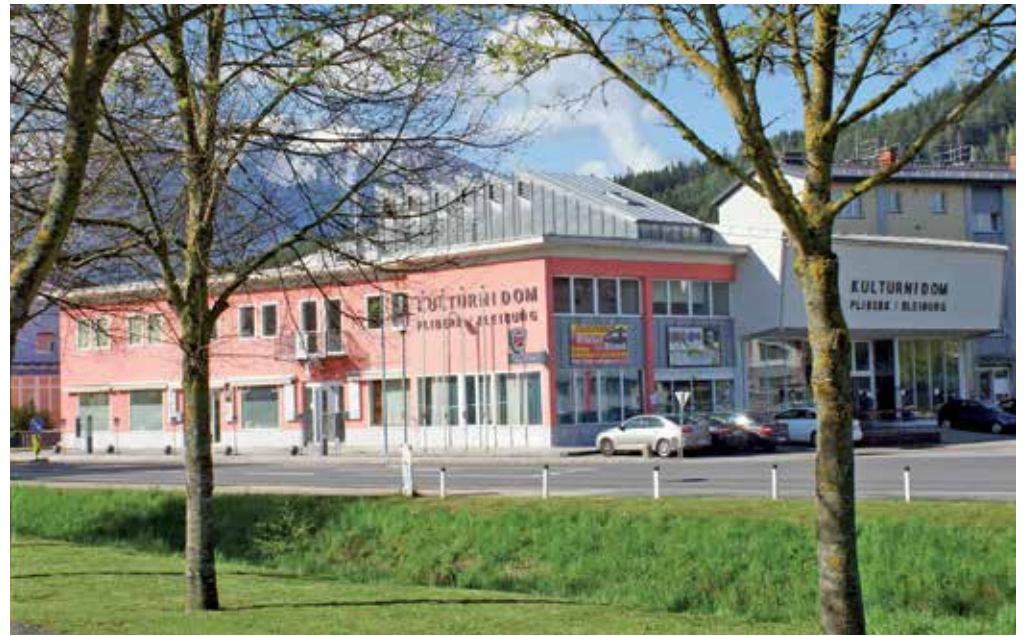
Kulturni dom Pliberk, kakršen krasi Pliberk danes

Na slovesnem uradnem odprtju aprila 2004 je predsednik Fric Kumer poročal: »Že v minulih 50 mesecih se je zvrstilo v kulturnem domu več kot 260 prireditev, samo v letu 2003 pa je prišlo v kulturno središče ob Velikovški cesti 20.000 obiskovalcev.«