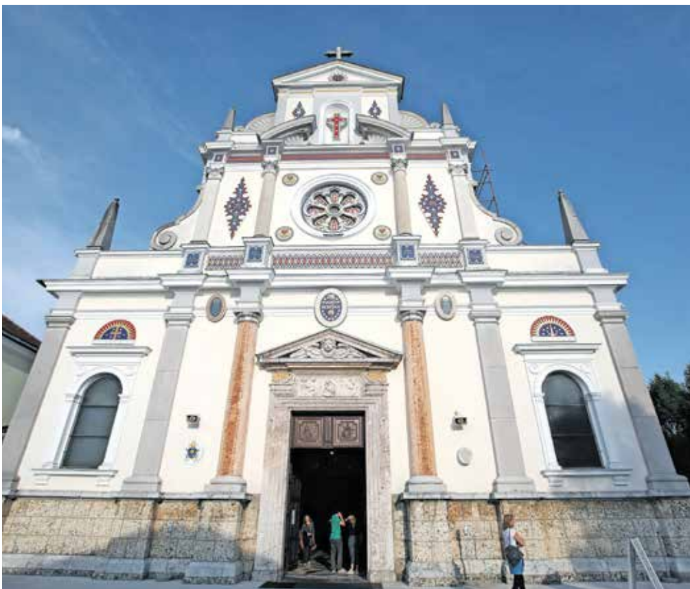
Vurnikov podpis nosi tudi bazilika Marije Pomagaj na Brezjah, za katero je mojster v šestdesetih letih prejšnjega stoletja napravil načrt prenove fasade.