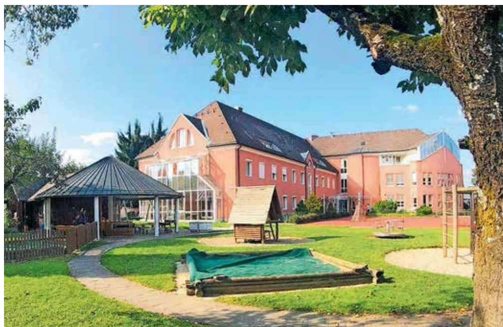
Slomškova hiša dobrega počutja v celovški Ainethovi ulici