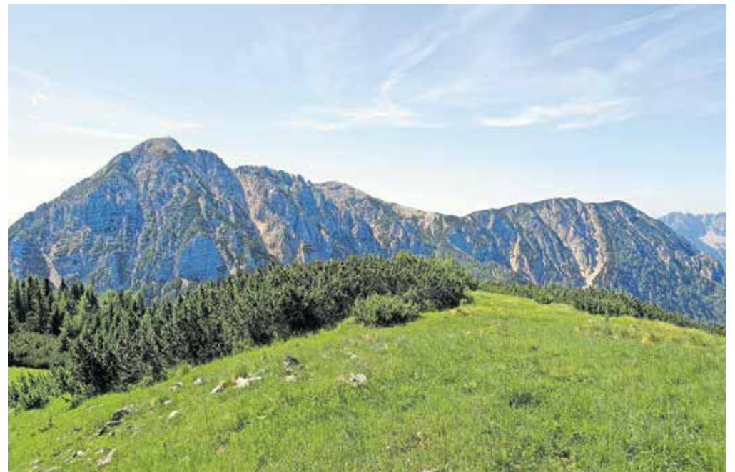
Pogled na razpotegnjen greben Obirja, kot ga vidimo z Malega Obirja

vršnem pobočju Obirja nam ponudi lep razgled na naš končni cilj in divji, skalnati svet v njegovi bližini. Kmalu zagledamo ostanke nekdanjega rudarskega poslopja/planinske koče pod samim vrhom Ojstrca.