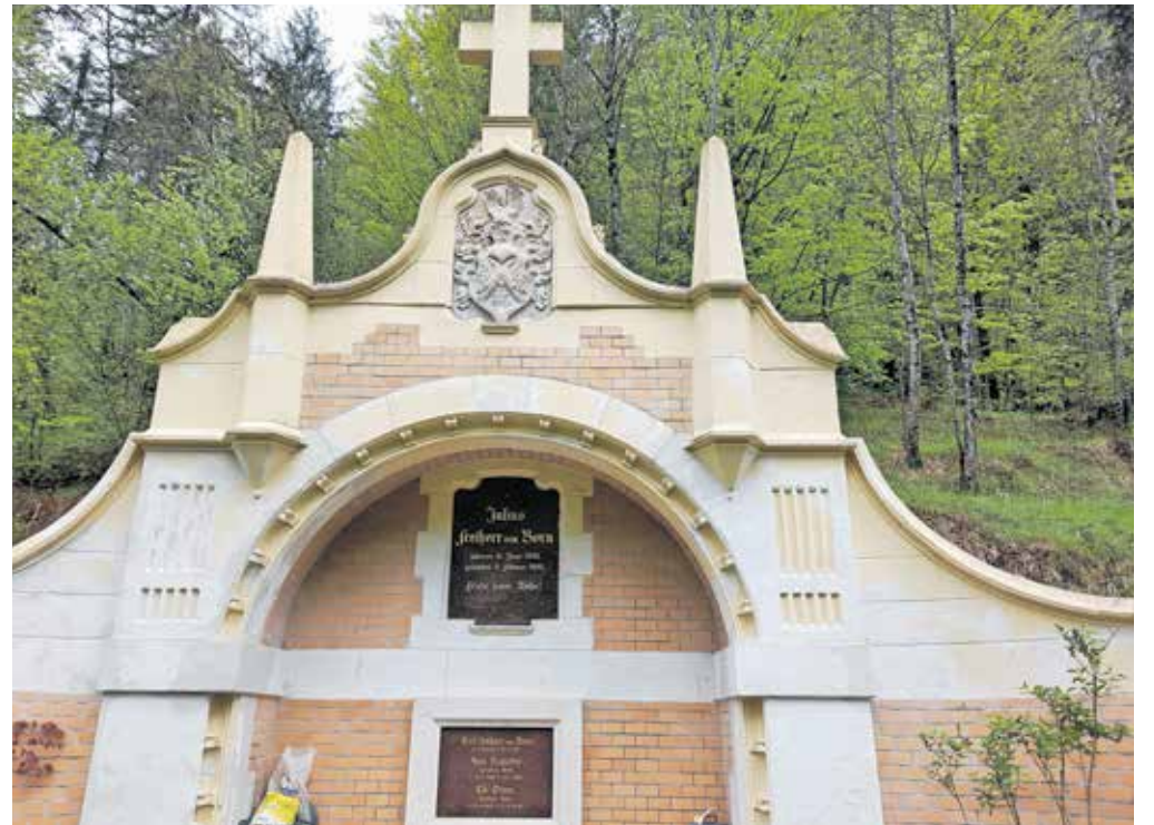
Bornova grobnica v Jelendolu