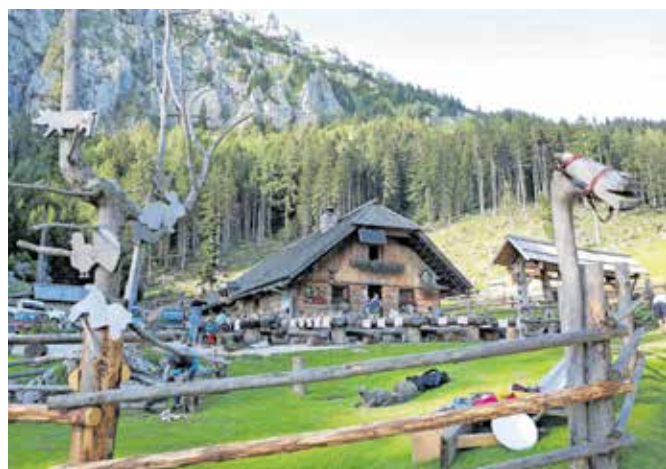
Dolga njiva, priljubljena planina pod Košuto