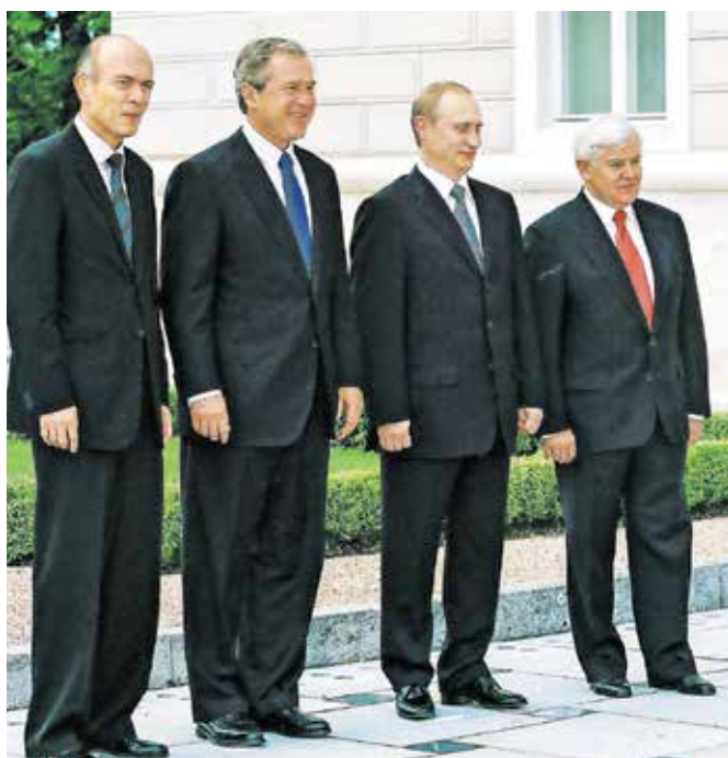
Na Brdu sta se leta 2001 srečala takratni ameriški predsednik George W. Bush in ruski predsednik Vladimir Putin. Sprejela sta jih takratni predsednik države Milan Kučan in predsednik vlade dr. Janez Drnovšek.

cer na Kranjsko prišla najkasneje ob koncu 14. stoletja. V sto letih je ob uspešnem gospodarjenju in na podlagi sklepanja zakonskih zvez ter z njimi povezav s pomembnimi plemiškimi rodbinami pridobila premoženje in