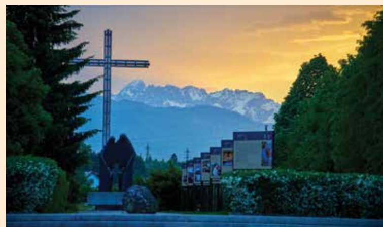
Večerni Ave v Parku miru.