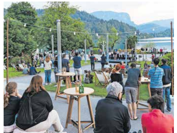
Novo festivalsko prizorišče na vrtu pred Festivalno dvorano

saj bo projekcija prvega slovenskega celovečernega nemega filma V kraljestvu Zlatoroga pospremljena z glasbo Andreja Goričarja v živo. Zaključni večer festivala bo v znamenju nemega filma. Tokrat bo to Erotikon z Ito Rino ob živi izvedbi glasbene partiture Andreja