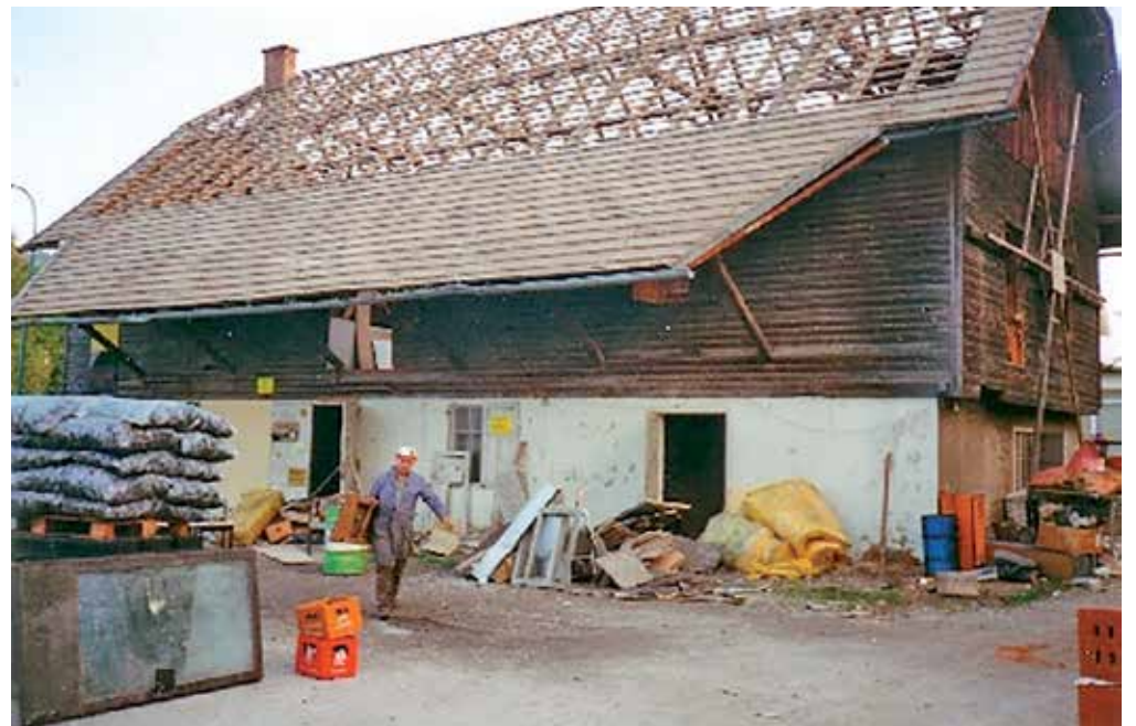
Iz tega poslopja je zrasel kulturni dom.