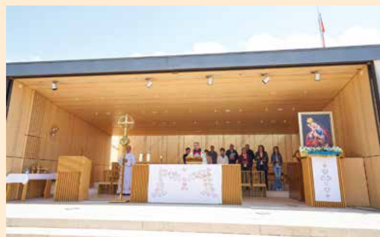
Novi oltarni prti s klekljanimi srčki, dar 200 slovenskih klekljaric.