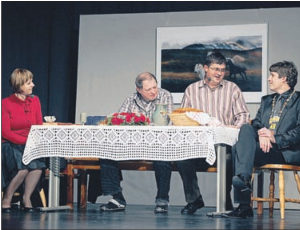
Igralci iz Loma so povabili župana, da je podelil priznanja Občine Tržič.