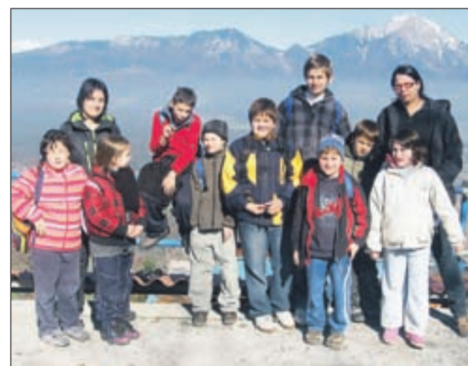
Mladinski center Centra za socialno delo Trzič poskrbi tudi za zanimive izlete.