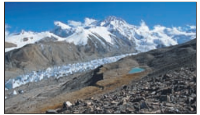
Pogled na osemtisočak Šišapangma s severne strani