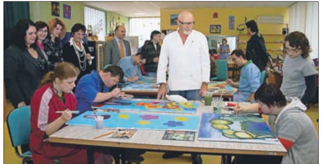
Tujci in domačini so si ogledali likovno delavnico v tržiški enoti VDC Kranj.