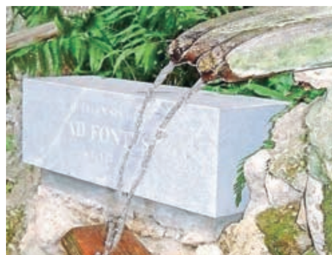
Ena od devetih postaj vodne in meditacijske poti »Adfontes – K izvirov«.

znesla nad Podjuno. V zahvalo so k cerkvi na gori prizidali kapelico, v skalno votlino pa položili njen kip.