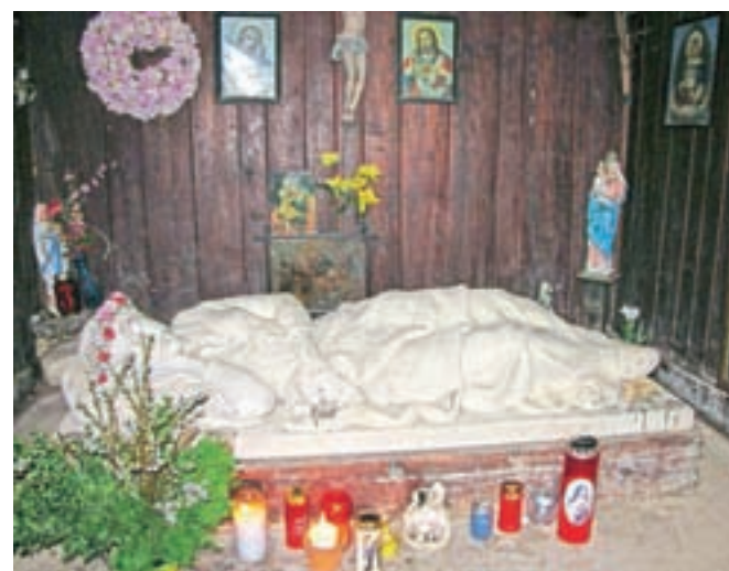
Sveta Rozalija spokojno počiva v svoji votlini.