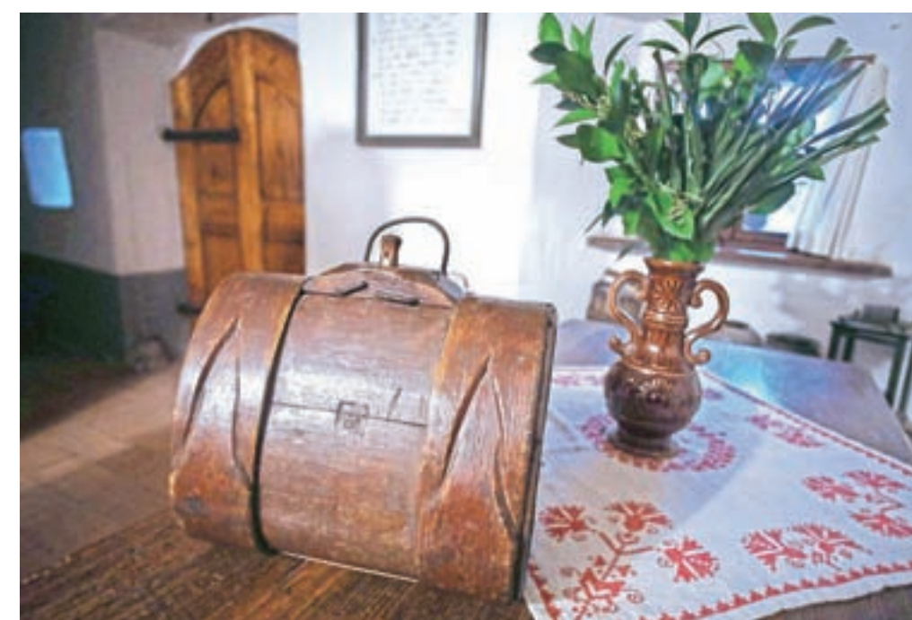
Ne, to ni ženska toaletna torbica iz starih časov, temveč »petrh« ali »putrih«, v katerem so nosili vodo, vino in ječmenovo kavo, ko so šli na delo na njivo.