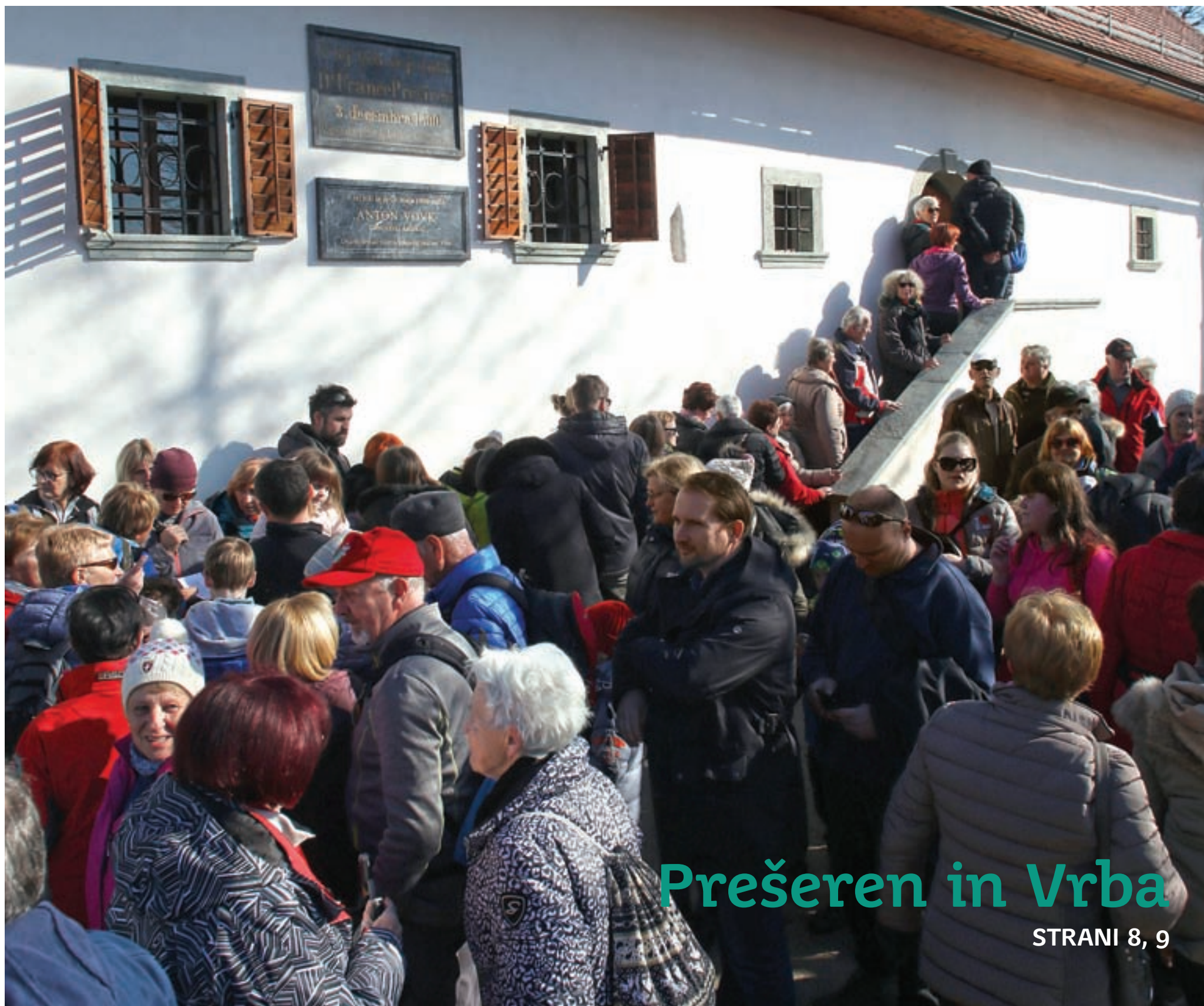
Ob osmem februarju, na obletnico smrti pesnika Franceta Prešerna, je Vrba prizorišče osrednje proslave, v vas se zgrnejo tudi pohodniki, ki na ta dan prehodijo Pot kulturne dediščine.