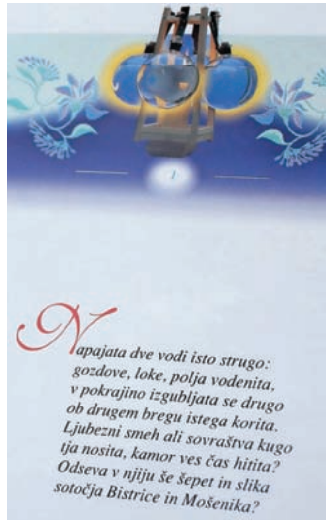
Prva oktava v monografiji V sotočju Bistrice in Mošenika