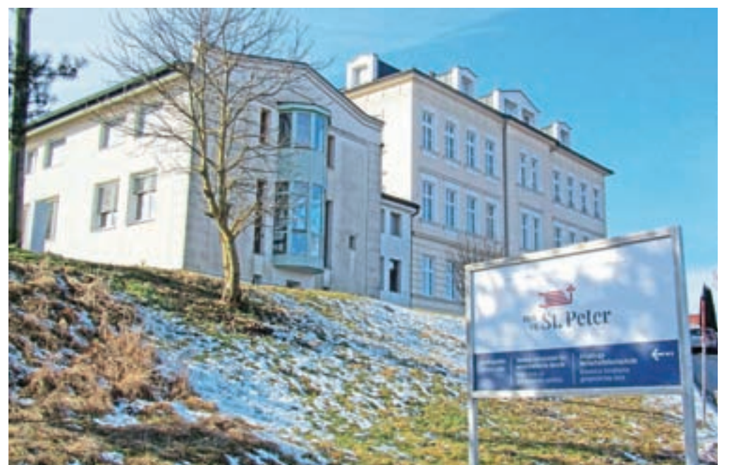
Ustanovitev Višje šole za gospodarske poklice sega v leto 1908.

šolanju ali za počitniško delo. Teh pohval smo zelo veseli, še zlasti če tudi od delodajalcev slišimo, da so naši absolventi sposobni in predvsem zanesljivi, zreli sodelavci. Podjetja danes namreč ne iščejo le sposobnih, ampak tudi zanesljive in delovnemu okolju predane sodelavce,« poudarja ravnatelj.