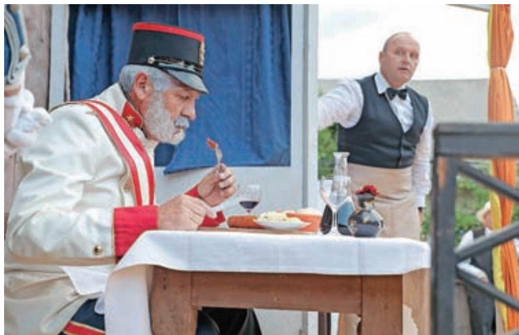
Ob junijskem prazniku Občine Naklo uprizorijo igrani odlomek o ljudski pripovedi, ki govori, da je ime kranjska klobasa nastalo v Naklem. Po tej cesti je skozi Naklo potoval cesar Franc Jožef. Poskusil je klobaso in navdušeno vzkliknil: "Pa saj to ni navadna, to je kranjska klobasa!"

Na Ivanini poti je osem informacijskih tabel, ki s sliko in besedo približajo kulturno dediščino vasi. Po poti člani KD Tabor popeljejo in jo zaključijo z legendo o Taborski Urški. Nauk legende, ki je izšla v obliki slikanice in dramskega besedila, je: »Ne pozabi izpolniti dane obljube, še posebej, če jo daš komu iz nebeškega zbora.«