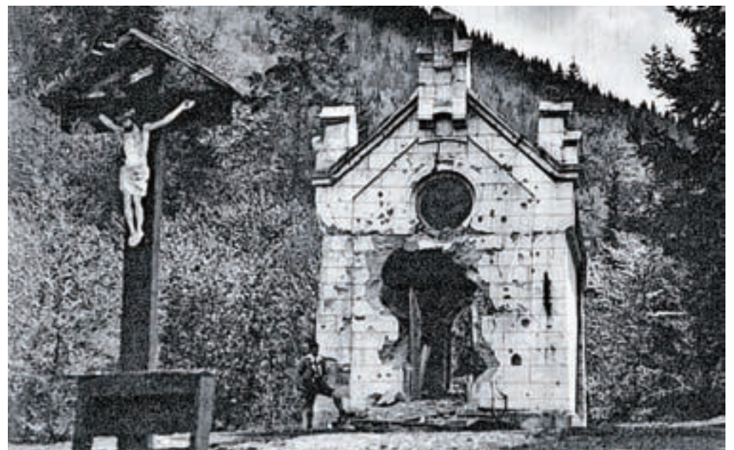
Takšna je bila kapelica po topovskem obstreljevanju maja leta 1919. Pred njo je bil postavljen križ, ki so ga tudi obnovili.