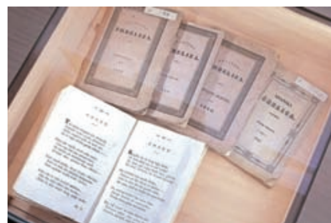
V vitrinah so na ogled dragoceni izvorni izvodi Poezije, Krsta pri Savici in Kranjske čbelice, ki so nastali v času pesnikovega življenja.