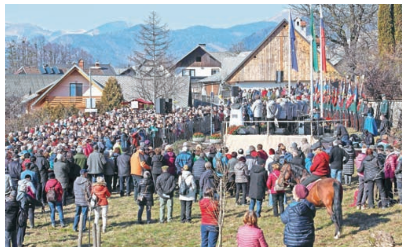
Ob osmem februarju, na obletnico pesnikove smrti, je Vrba prizorišče osrednje proslave, v vas se zgrnejo tudi pohodniki, ki na ta dan prehodijo Pot kulturne dediščine.

Prešernova rojstna hiša je ena izmed najstarejših hiš v Vrbi. Prvotna stavba je nastala v 16. stoletju, današnja podoba pa je dobila po požaru leta 1856, ko je ogenj uničil gospodarsko poslopje, slamnato streho in leseno ostrišje. Takrat so domačijo povišali in pridobili t. i. štibelc – podstrešno spalnico. Prešernovemu rodu lahko v Vrbi sledimo od druge polovice 17. stoletja dalje. V prvi polovici 18. stoletja je bil lastnik domačije pesnikov praded Jožef Prešeren (1688–1754), ki je bil podložnik begunjske graščine. Sledil mu je pesnikov ded Jernej Prešeren (1762–1800), za njim pa pesnikov oče Šimen Prešeren (1762–1837), ki se je leta 1797 poročil z Mino, rojeno Svetina (1774–1842) iz Žirovnice. Imela sta osem otrok: