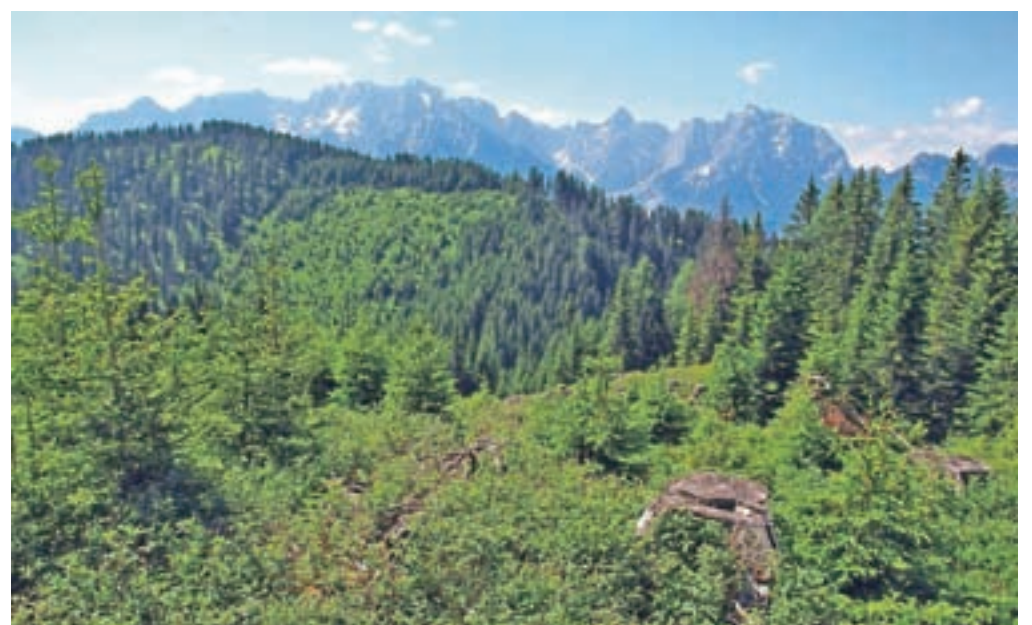
Pogled na poseko z Visoke Bavhe, po kateri sestopimo. V ozadju od desne Prisojnik, Razor, Rigljica, Rušica, Frdamane police, Špik, Martuljske Ponce in Oltarji.

tja do Montaža. Tik pred seboj zagledamo poseko, preko katere se bomo povzpeli na Visoko Bavho. V tem delu je zaradi zaraščenosti težko slediti mejnim kamnom, zato do ceste, ki jo vidimo, sestopimo kar po zvoženem kolovozu. Na cesti zavijemo desno in nadaljujemo sestop skozi gozd. Ko dosežemo dno, se pot spet postavi pokonci, kjer v strmih vzponu dosežemo Visoko Bavho (1647 m n. m.). Če z njenega vrha pogledamo nazaj proti Kamnatemu vrhu, bomo na njegovi južni strani videli grozeč podor. Z Visoke Bavhe strmo sestopimo na sedlo Bavhica (1531 m