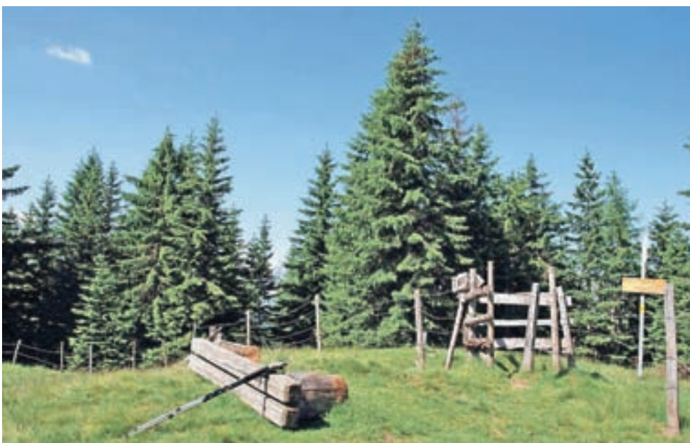
Na Kamnati vrh pripelje markirana pot iz Avstrije.

Z Vošce se spustimo do Jureževe planine, potem se po panoramski cesti, ki od Korenskega sedla pelje do Železnice, vrnemo na izhodišče.