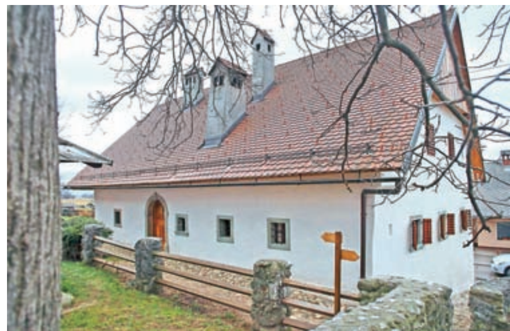
Prešernova rojstna hiša, ki je ena od hiš na Poti kulturne dediščine Žirovnica, je bila leta 2011 razglašena za spomenik državnega pomena.