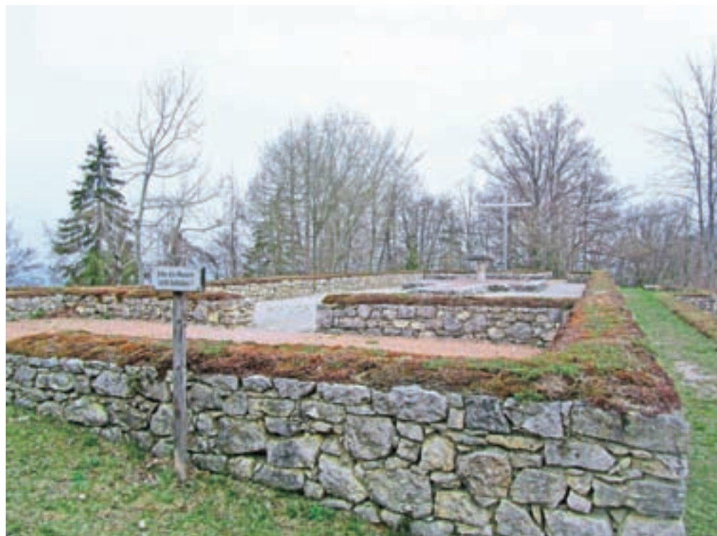
Arheologi so našli temelje petih cerkva in drugih cerkvenih in romarskih objektov.

Emina romarska pot je dolga 688 kilometrov in povezuje kraje, povezane z Eminim življenjem oziroma z njenimi posestmi. Začetek poti je v Pliberku, nato pa se po prestopu mejnega prehoda Raunjak nadaljuje v Mežico, v Črno, mimo Ivarčkega jezera do Slovenj Gradca in naprej skozi Maribor do Ptuja in Ptujске gore. Pot obišče Kozjansko, del Dolenjske, Žiri, Crngrob, Jošt nad Kranjem, Železnike, Bohinj, Vrbo, Begunje, Drago, planino Prevala – Ljubelj in Borovlje ter se konča v Krki, kjer je sveta Ema pokopana.