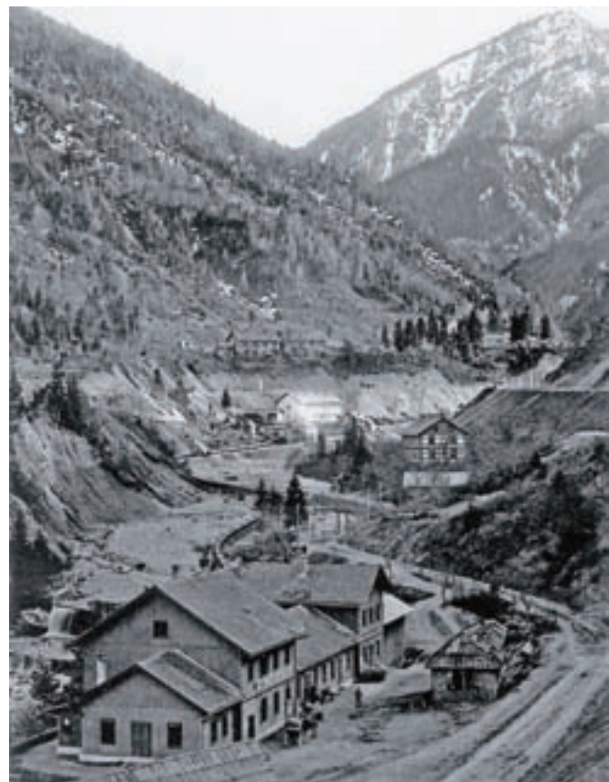
Za potrebe gradnje karavanškega železniškega predora v letih 1901–1906 so v Področci postavili delavsko naselje s stanovanjskimi, upravnimi, gospodarskimi in strojniškimi objekti. Nekateri od njih stojijo še danes.