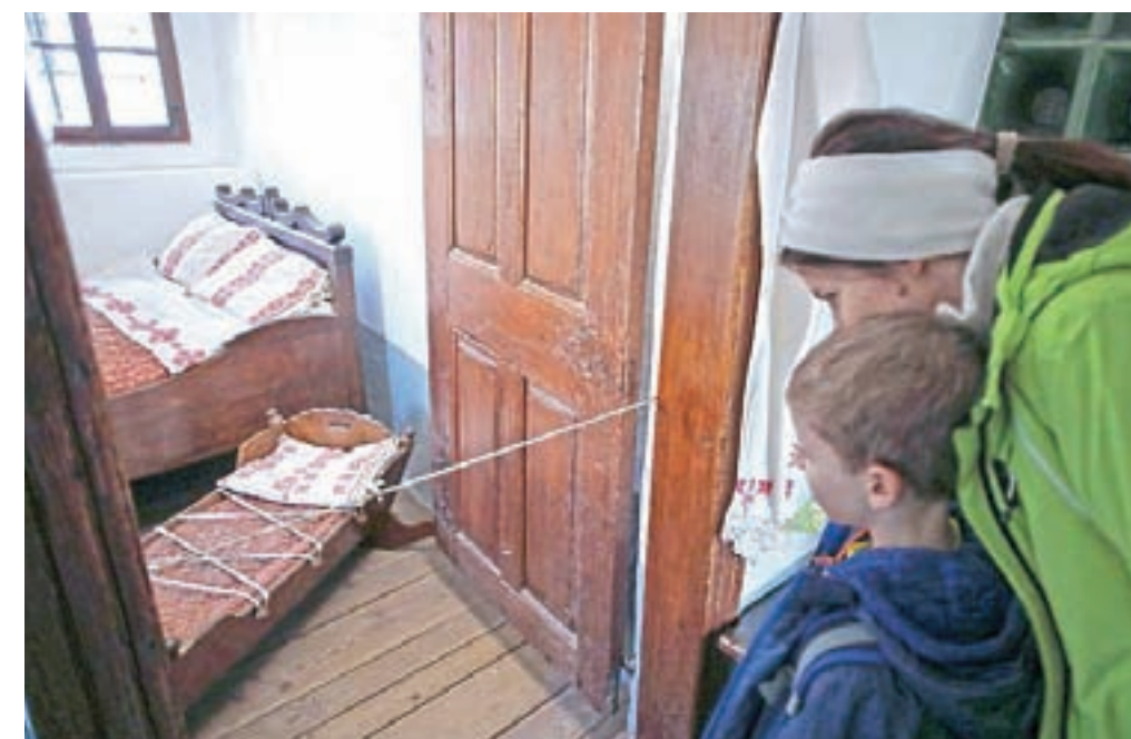
Najdragocenejši eksponat v hiši je originalna zibka, v kateri so zibali Prešerna kot dojenčka.