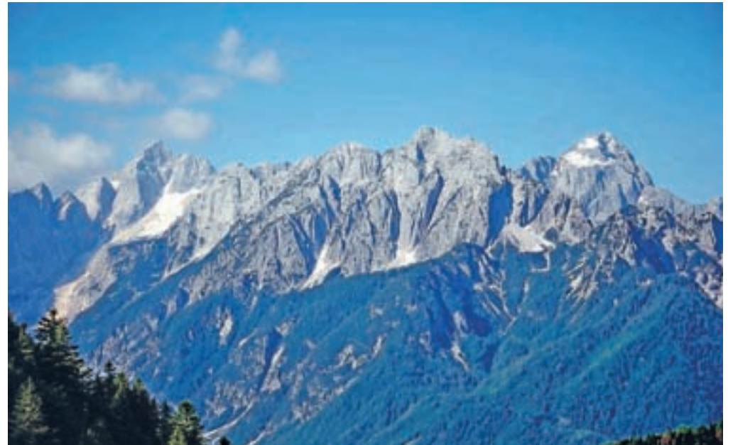
Izpod Jerebikovca se zazremo v samo nederje Jalovca in Mangarta.

Sledimo cesti, na koncu katere nas smerokaz usmeri ostro desno po gozdnem slemenu. In že smo na vrhu Kamnatega vrha (1647 m n. m.). Drevje okoli vrha nam ne privoščiti nobenega posebnega razgleda. Po travnatem slemenu se spustimo mimo mejnih kamnov, ki jim zvesto sledimo. Pri mejnem kamnu številka 179/01 se pot usmeri desno in se spusti skozi pas gozda do poseke. Na tem mestu je razgled več kot čudovit, saj se pred nami razpre veriga vzhodnih in zahodnih Julijcev, od Kukove špice pa vse