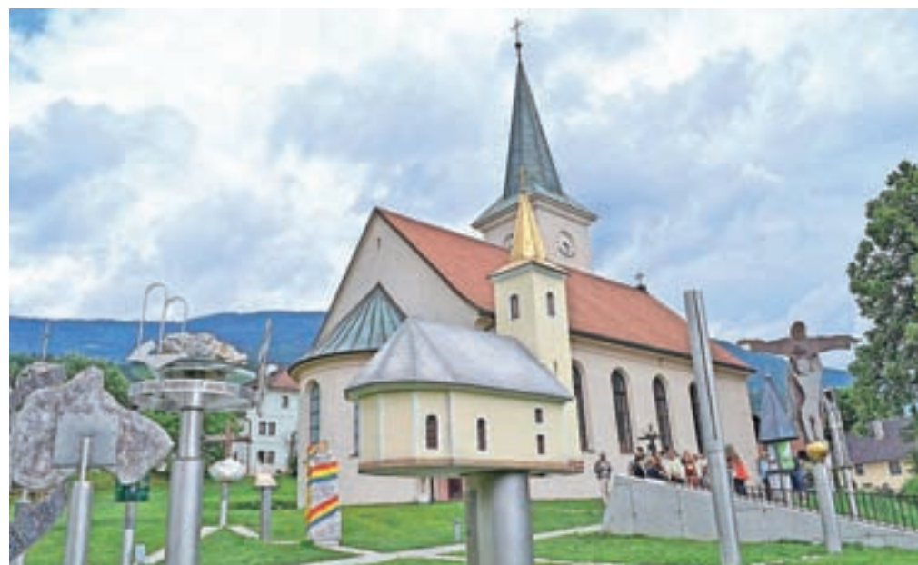
Maketa protestantske cerkve v Zagoričah, kjer se je protestantizem med koroškimi Slovenci ohranil do 19. stoletja, pred protestantsko cerkvijo v Brezah (Fresach). V tamkajšnjem muzeju je shranjena slovenska Dalmatinova Biblija iz Zagorič.

Žarišče reformacijskega gibanja je bil tudi Celovec, ki je leta 1518 postal glavno mesto dežele Koroške in