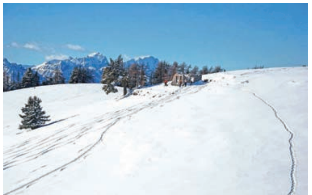
Vošca je obljudena v vseh letnih časih, tudi pozimi.