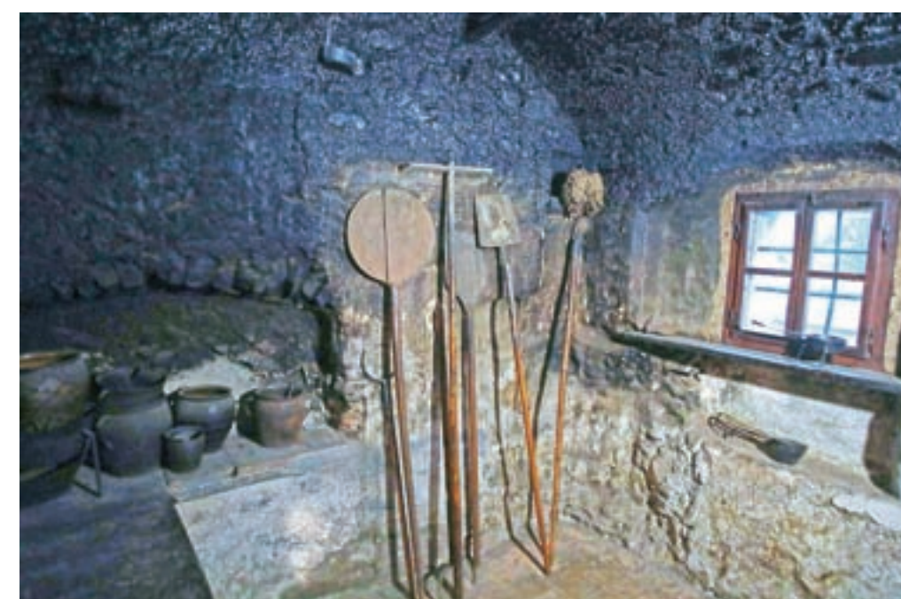
Veliko zanimanja zlasti tujih obiskovalcev vzbudi odlično ohranjena črna kuhinja.