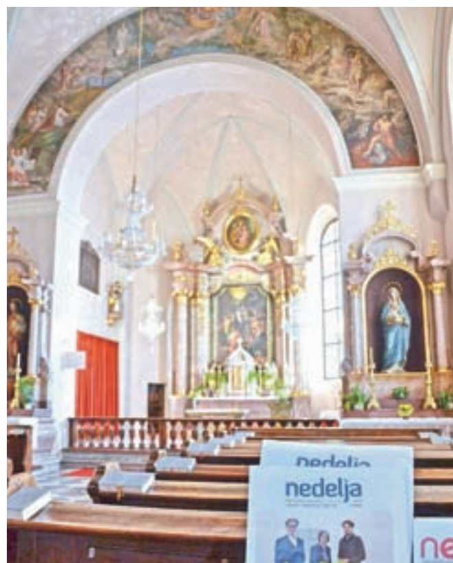
V cerkvi sv. Duha je med letoma 1570 in 1600 imela sedež slovenska protestantska župnija v Celovcu. Danes je cerkev katoliška, v njej pa je na voljo tudi slovenski cerkveni tednik Nedelja.

Reformatorji so tudi na Koroškem nagovorili ljudi v njihovem jeziku, torej tudi v slovenskem. Tega so se zavedali koroški deželni stanovci, ki so z dobro petino potrebnih sredstev podprli tisk prvega celotnega prevoda Svetega pisma v slovenščino.