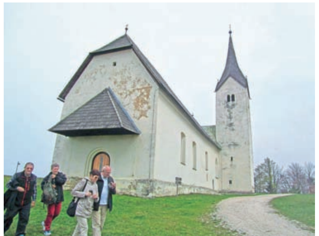
Cerkev svetih Eme in Doroteje na vrhu Emine gore, ki je skupaj z Globasnico vključena v Geopark Karavanke.

šteevamo, da je v tedanjih časih to potekala pomembna trgovska in popotniška žila in da so ob njej in nad njo nastajale obrambne točke, in da so začeli v te kraje prihajati tudi romarji, je to območje pravi zgodovinski oziroma arheološki biser. V to nas prepriča