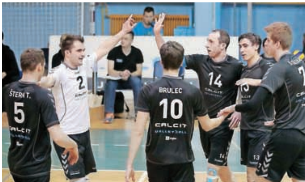
Kamniški odbojkarji nadaljujejo z odlično igro v državnem prvenstvu.