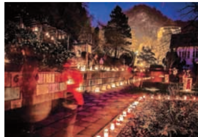
Žarki svetlobe so park spremenili v čarobno deželo.

Na prvo adventno nedeljo v Parku Evropa Ognjena Veronika ni prižgala le ene sveče, temveč je zažarel v pravljичnem soju stotine sveč.