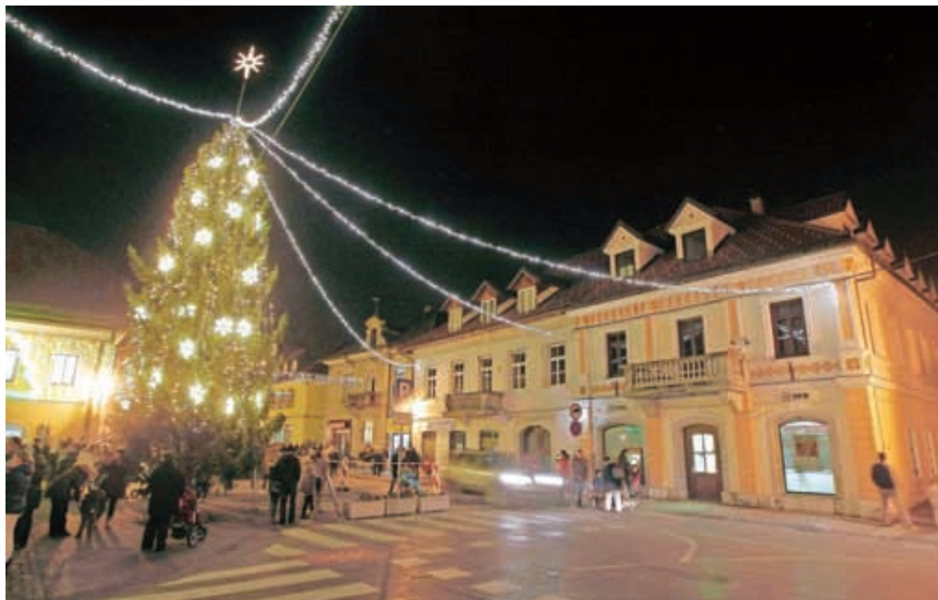
Prižig prazničnih luči je naznanil pestro decembrsko dogajanje pod krovnim naslovom Pravljični Kamnik.

S slavnostnim prižigom prazničnih luči se je v središču mesta minuli petek začelo pestro decembrsko dogajanje, ki bo trajalo vse do zadnjega letošnjega dne, letos pa bo namenjeno predvsem najmlajšim. Prav zato so ga na Zavodu za turizem in šport v občini Kamnik poimenovali Pravljični Kamnik.