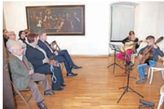
Odprtje razstave so tudi tokrat z glasbenimi točkami popestrili učenci Glasbene šole Kamnik.

mindvajset del, ki so nastala med 17. in 20. stoletjem. Največ slik je v muzejske depoje prišlo iz Sadnikarjeve zbirke, pred pol stoletja tudi z odkupom, nekaj del so pridobili iz zasebnih zbirk, večji del pa je fond nekdanjega Federalnega zbirnega centra, ki je po drugi svetovni vojni zbrane in zasežene umetnine razdelil po slovenskih muzejih. Najstarejši predstavljeni deli imata svoj izvor v samostanskem okolju, prva je slika Zadnja večerja iz prve polovice 17. stoletja, druga pa je slika z naslovom Jezusov pogovor s starši. Še posebej zanimiva je serija štirih plemiških portretov iz prve polovice 17. stoletja. Gre pa za dva portreta plemičev iz rodu Herbersteinov, grofa Thurna in barona generala