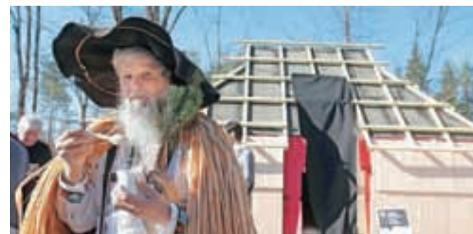
Dediščina Velike planine bo že spomladi turiste navduševala tudi v Godiču.