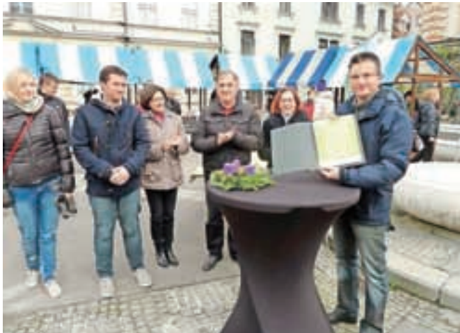
Kamniški turizem bo še bolj »zelen«.