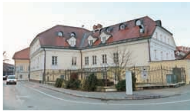
Hotel Malograjski dvor že leto in pol čaka na novega lastnika, nedavno pa je ostal tudi brez najemnika.