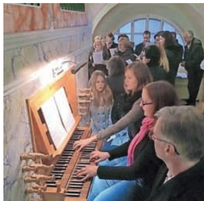
Prenovljene orgle v župnijski cerkvi v Zgornjem Tuhinju imajo zmogljivost koncertnih orgel.