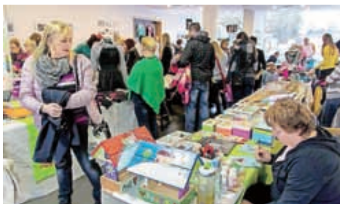
Prvi Sejem unikatnih izdelkov v Domu kulture Kamnik je privabil veliko obiskovalcev.