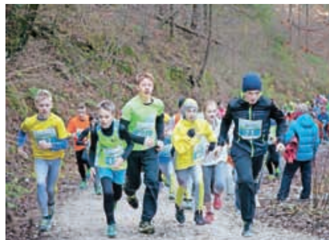
Dečki in deklice so se pomerili v teku na 1400 metrov.

zih tekmovalcev in drugih obiskovalcev, ki so ob kozarcu čaja ali kuhanega vina vztrajali še precej po prihodu zadnjih tekačev v cilj, jim je to tudi uspelo.