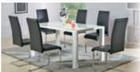
MIZA BOMBA OD