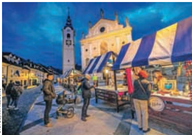
Odziv občanov na prvo Šoping Šutno je bil zelo dober.