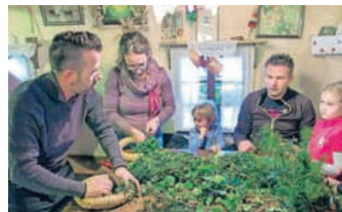
Tudi letos je delavnica adventnih venčkov privabila številne obiskovalce v Budnar co.