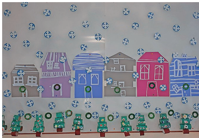
Učenci OPB 2

Delala bi projekte, kako živeti na Marsu in kako posaditi več milijonov dreves za čist zrak. S svojo pametjo bi pomagala drugim, da bi se kaj naučili. Tako bi postalo zelo pametnih še veliko drugih ljudi in skupaj bi znanje prenašali iz roda v rod. Otrokom, ki živijo v revščini, bi s svojim znanjem pomagala tako, da bi na veliko mednarodnih tekmovanjih v matematiki dosegala nagrade. S tem denarjem bi jim kaj kupila ali denar donirala. S svojimi izvrstnimi pametnimi idejami bi uničila koronavirus, gripo, raka in še veliko drugih nevarnih bolezni. Naredila bi vse, da bi svet postal lep.