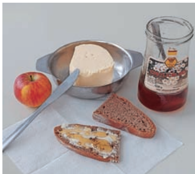
Tradicionalni slovenski zajtrk

transportne verige in spodbujamo slovenske kmete k pridelavi hrane. Za letošnji zajtrk smo v šoli uporabili slovenska živila, večinoma iz lokalnega okolja: mleko Strniševih iz Nove vasi, Koklov med iz Potoč, maslo Mlekarstva Podjed z Olševka, ekološki pirin kruh iz krušne peči Šlibarjevih iz Kovorja ter ekološka jabolka s kmetije Miš iz Doba. Na naši šoli smo tradicionalni zajtrk razširili v teden tradicionalnih jedi. Tako že šesto leto tretji teden v novembru v kuhinjah pripravljajo slovenske tradicionalne jedi: ajmoht, žgance, prežganko, zaroštan sok, glavnik, kislo mleko, posmoduljo idr. Otroci so jedi presenetljivo dobro sprejeli, zato bomo takšen jedilnik nadaljevali tudi v prihodnje. Želimo si, da bi se vsi, tako otroci kot starši, bolj zavedali, kako pomembna je hrana za ohranjanje našega zdravja, in bi še bolj cenili lokalno pridelano hrano.