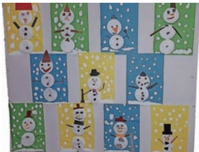
Snežaki učencev 2. b

Drr, drr, drr ... Ojoj, saj to je zvok budilke. Žal so bile samo sanje, ampak čudovite. Kaja Kalan, 4. a