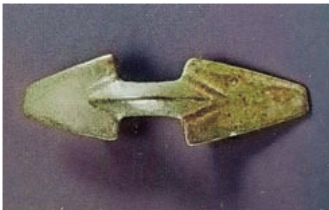
Bronasta fibula iz druge polovice 6. ali prve polovice 7. stoletja, najdena na Sv. Lovrencu (hrani Gorenjski muzej)

Prazgodovinski je sledila poznoantična poselitev gore, domnevno iz 5.–6., morda še 7. stoletja. Poznoantična naselbina je dajala zavetje staroselskemu romanskemu prebivalstvu, ki se je pred tujimi prišleki z vzhoda v času velikih preseljevanj z ravnine umaknilo na varnejše, višje ležeče območje. Več o burni dobi preseljevanj ljudstev