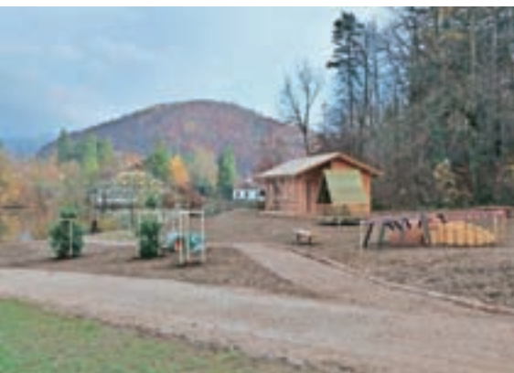
Pred slabim mesecem dni je bil pogled na obalo jezera že precej drugačen.

V okviru projekta Turizem ribjih doživetij, za katerega ima Občina Preddvor odobreno 85-odstotno sofinanciranje Evropskega sklada za pomorstvo in ribištvo, urejajo obalo na občinskem zemljišču. Projekt je težak slabih tristo tisoč evrov, ureditev zahodnega brega jezera Črnava pa je prevladujoča naložba. Glavni cilj projekta je razvoj turistične ponudbe aktivnih ribjih doživetij oziroma aktivnejše dogajanje na in ob preddvorskem jezeru, kamor