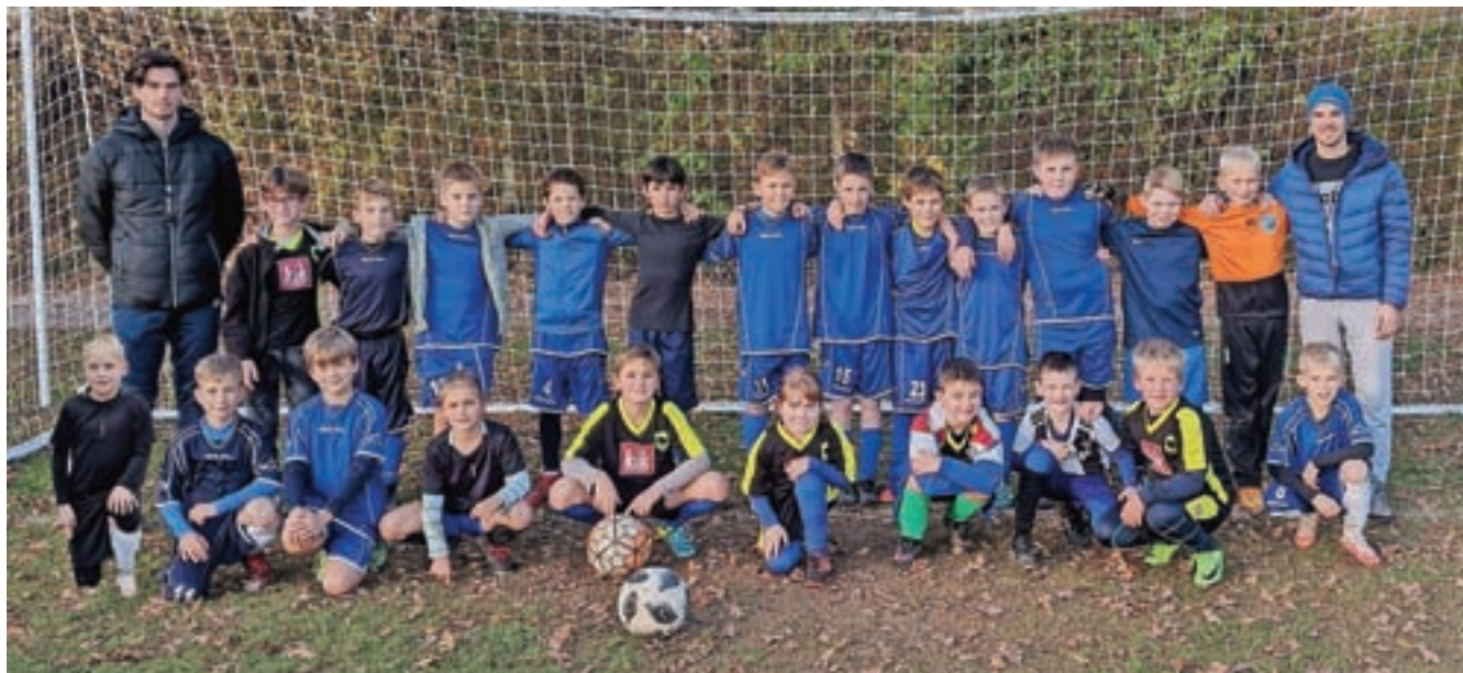
Ekipo U10

Pred začetkom nogometnih tekmovanj v jesenskem delu sezone 2021/2022 je bilo veliko negotovosti in bojzani, ali jih bomo zaradi napovedanega poslabšanja epidemioloških razmer sploh lahko igrjali.