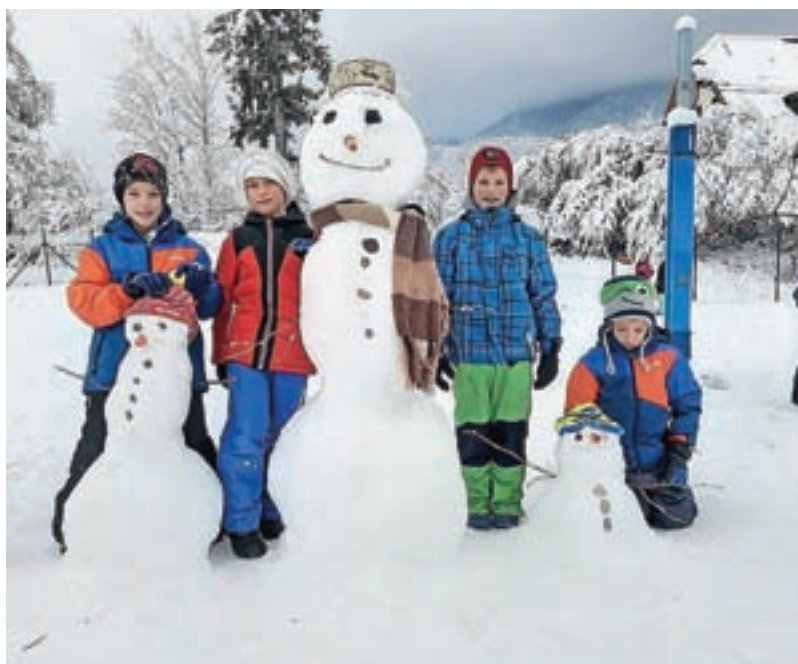
Fantje iz 3. a s svojo snežno družino

Nekega večera, ko sem se odpravil v posteljo, sem padel v globok spanec. Začel sem sanjati o gradovih in vitezih. Naenkrat sem se znašel v kočiji, ki je peljala do gradu. Ko sem prišel do gradu, so se odprla gromozanska vrata in kočija je zapeljala v graščino. Povsod je bilo polno vitezov in drugih ljudi. Med sprehodom naokrog me je glavni bojevnik vprašal, ali bi postal vitez. Takoj sem bil za, zato sem si nadel čelado in vso opremo, ki jo vitezi potrebujejo. Bojevnik me je poučeval, kako se bojujejo z mečem, sekiro in