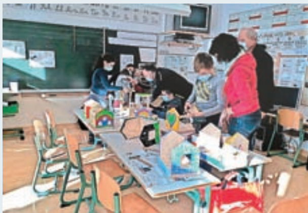
Združili so moči: ptičje hišice so sestavljali v šoli.