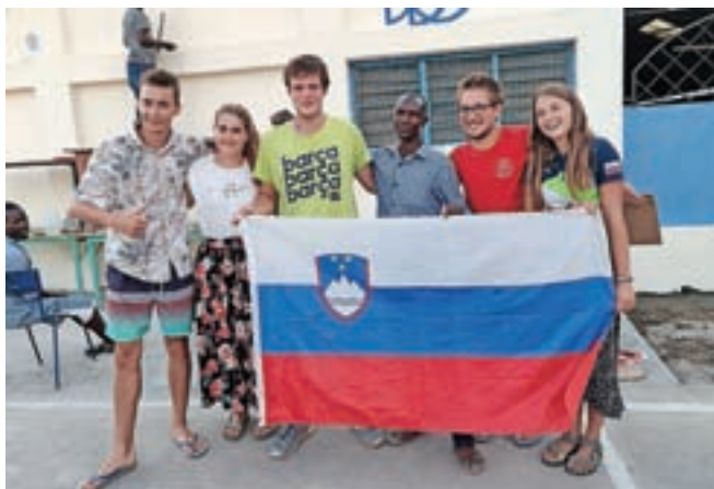
Prostovoljci v Keniji

V Lodwaru so večino časa preživeli na delovišču. »Sodelovali smo z delovodjo, izkušenimi mojstri, mladimi, ki so si želeli športno-kulturnega centra, in z nekaterimi, ki so delo dobili, ker so naključno prišli mimo.« Da ljudje tam živijo bolj od priložnostnih del, doda. Delali so pet dni v tednu, ob koncu tedna so bili prosti. Center so obnovili, prenovili, nekaj tudi dogradili. »Uredila se je okolica, posadili smo drevesa, popravili omare, okna in vrata, prepleskali prostore. Tako so sedaj objekti ponovno v uporabi in veliko prispevajo k druženju mladih, povezovanju skupnosti, kar je še posebno pomembno za kraje, kjer revščina in socialni problemi prevladujejo.« Nasmee nas, ko opisuje, kako je bila na krožniku največkrat koza; omeni pa še, da je njihova kultura zelo različna od naše. »Sploh kar se tiče pogleda