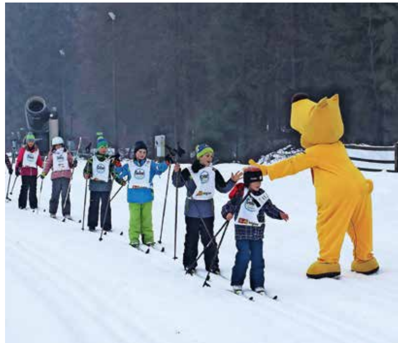
Učenje teka na smučeh je zabavno.