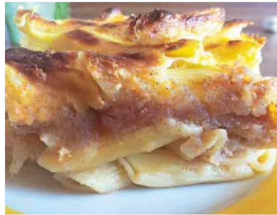
Okusen makaronov narastek z jabolki

Star bel kruh narežemo na kocke in damo v visoko skledo, prelijemo z vročim mlekom, da se kruh napoji. Na maslu prepražimo čebulo, malo česna in peteršilj in prelijemo čez kruh, premešamo in ohladimo, dodamo tri jajca, dobro premešamo in pustimo, da se vse