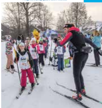
Akcija Šolar na smučih v NC Bonovec Medvode