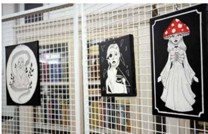
Razstavljenih je bilo dvanajst del.

Gorenjski glas je najbolj bran regionalni časopis v Sloveniji.