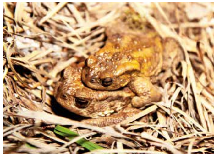
Lokacij, kjer pomagajo dvoživkam čez ceste, je vedno več.