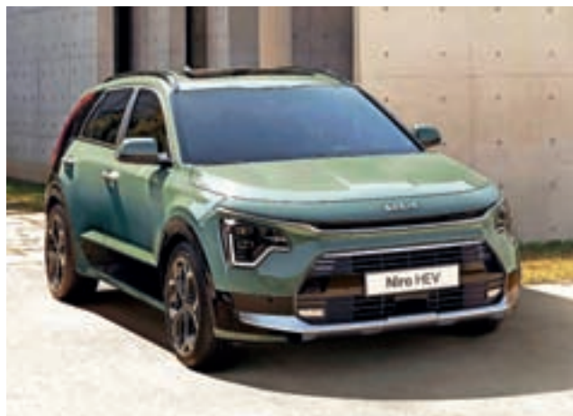
KIA NIRO – avto leta 2023 po izboru žensk

Ženske imajo pri nakupu družinskega avtomobila pomembno, velikokrat tudi odločujočo vlogo, česar se zavedajo tudi avtomobilski proizvajalci, zato z zanimanjem spremljajo izbor ženskega avta leta. Letos so ženske izbirale že trinajstič po vrsti in na mednarodni dan žena, osmega marca, izbrale Kia model Niro za najboljšega v vseh pogledih. Niro je bil izbran tudi za najboljši urbani avtomobil, Jeep Avenger za družinski SUV, Citroën C5X