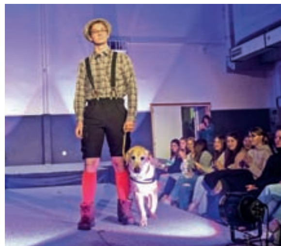
Modna revija DrugaRoka Gimnazije Kranj