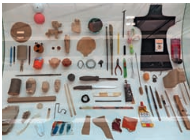
Na delovni mizi Andreja Štularja iz LG Nebo

Po knjižnici so si svoje koticke izbrale lutke iz več kot dvajsetih predstav obeh gledališč. »Ko pridejo otroci