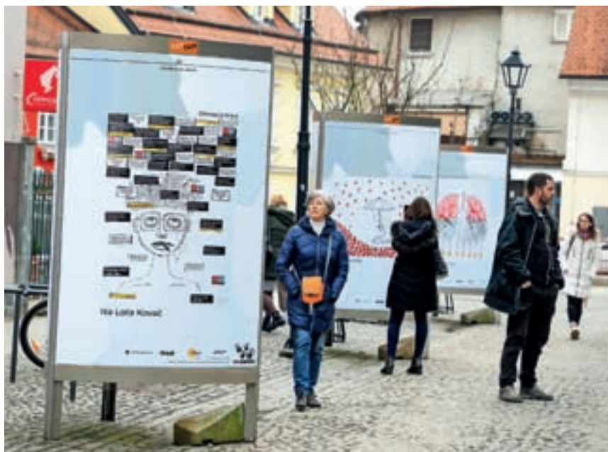
Razstava je nastala v sklopu preventivne akcije Stop zasvojenosti pod vodstvom lokalne akcijske skupine za preprečevanje zlorabe drog.

L okalna akcijska skupina (LAS) za preprečevanje zlorabe drog Mestne občine Kranj (MOK) je skupaj s kranjskimi srednjimi šolami in javnimi zavodi pripravila drugo preventivno akcijo Stop zasvojenosti. Ob tem je nastala tudi razstava