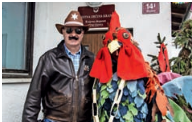
Šerif in petelin v pustnem sožitju / Foto: Vladimir Kraljič

Petelin si je začasno krajevno oblast letos spet težko izbral, ker se v Struževem vse spreminja, samo lokalni šerif z ekipo se trdno oklepa svoje funkcije. Vsakoletno težke borbene preizkušnje so petelina že zelo dobro izurile v svoji obrti, zato je na čelo 5. Strževske povorke postavil goloba za krmilo traktorja in na koncu vrste