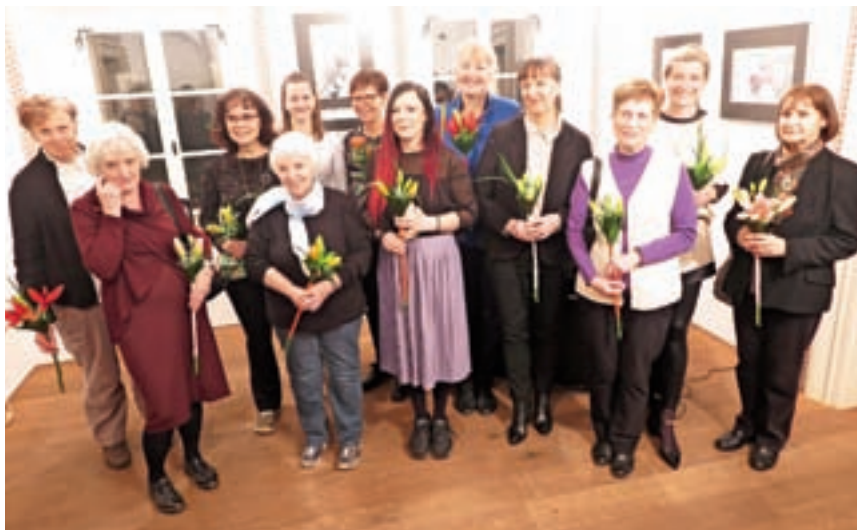
»Puharjeve« fotografkinje, ki so dodatno ocvetličile letošnji praznik