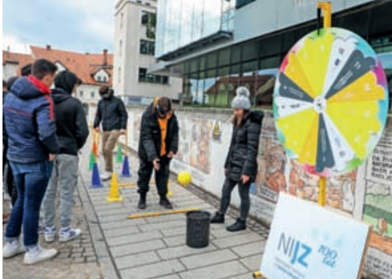
Obiskovalci so se lahko preizkusili tudi na poligonu, na katerega so se podali z očali, ki simulirajo opitost.

Ogroženi so tudi mladi. »Mlajši kot je človek, ko pride v stik z alkoholom, večja verjetnost je, da bo kasneje v življenju razvil tvegano pitje, škodljivo pitje ali pa celo druga tvegana vedenja. Možgani se razvijajo celo do 30. leta starosti in meritve možganskih funkcij pri mladih, ki so zgodaj začeli piti alkohol, in pri tistih, ki ga niso, so