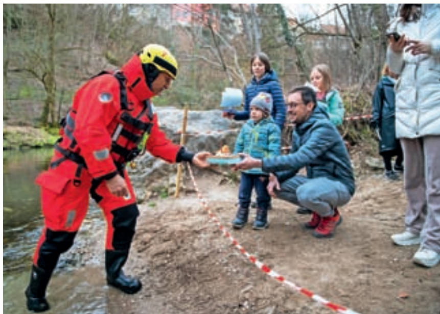
Na predvečer gregorjevega so v kanjonu Kokre že tradicionalno »vrgli luč v vodo«.