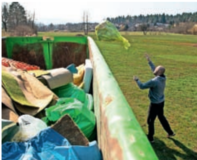
Z lanske čistilne akcije

Taborniki so zbiranje prijav večjih skupin že končali. Kot je pojasnila vodja akcije Tea Derguti, se je prijavilo skoraj 5300 prostovoljcev; med njimi trije vrtci, osem šol, deset društev, pet enot Civilne zaščite, 14 krajevnih skupnosti, Ljudska univerza, izobraževalni center B&B, Mestna knjižnica Kranj, Zavod za turizem in kulturo Kranj, Komunalna Kranj in vsi štirje kranjski taborniški rodovi. Posamezniki, ki se bodo za sodelovanje v akciji še odločili, se