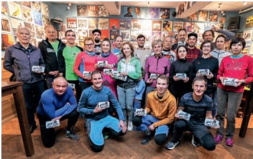
Najboljši v 16. izvedbi Kranjske zimske tekaške lige

v določenih tedenskih okvirih kakor tudi skupinski starti ob nedeljah vsakič ob 9. uri.