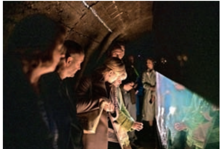
SOS proteus, informacijski center za varstvo človeške ribice v Kranju