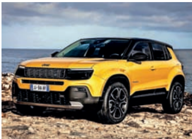
JEEP AVENGER – evropski avto leta 2023

Razglasitve naj avtomobilov leta 2023 se kar vrstijo.