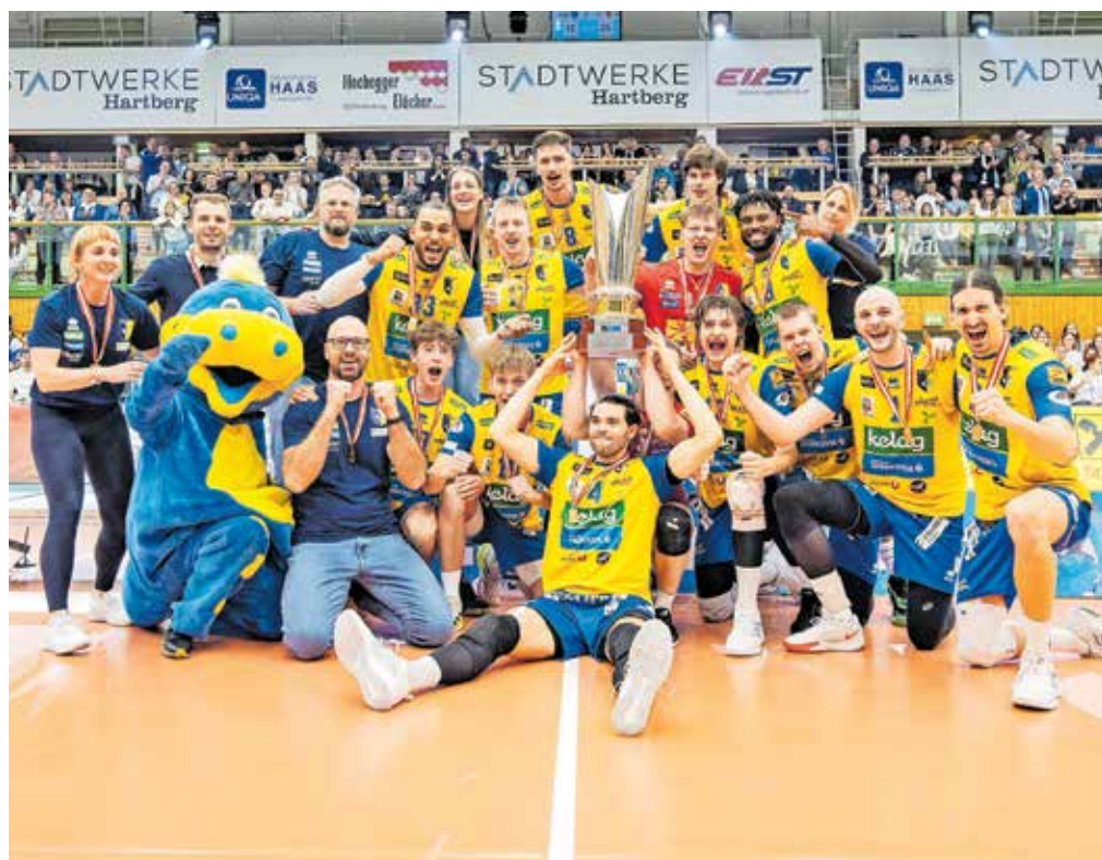
Odbojarski klub Aich/Dob, ki je včlanjen v Slovensko športno zvezo, je februarja 2024 postal avstrijski pokalni prvak.

ji in sodelavci. Društva prihajajo s celotnega dvojezičnega ozemlja, zastopane so skoraj vse športne panoge, od nogometa, odbojke in košarke pa do alpskega smučanja, atletike, planinstva, ribištva in šaha. Pohvali se lahko z vidnimi uspehi včlanjenih športnikov ali društev, npr. odbojarskega kluba Aich/Dob in ŠD Zahomec. O njih in drugih uspehih podrobno in zelo nazorno piše Simon Rustia v omenjeni knjigi, namenjeni 75-letnici SŠZ. Prav tako je SŠZ vključena v pomembne čezmejne pobude in velja za povezovalni športni člen med Koroško in Slovenijo. Skratka: vloga SŠZ je za slovensko narodno skupnost in mednarodno povezovanje neprecenljivega pomena.