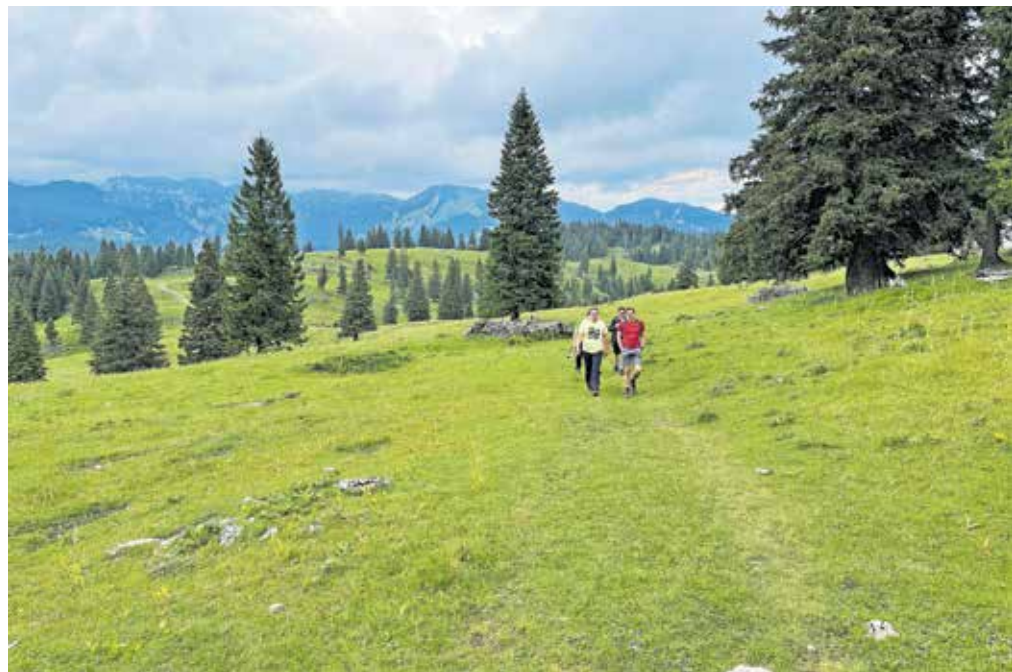
Pohodništvo je poleg smučanja, krpjanja in kolesarjenja ena izmed priljubljenih dejavnosti obiskovalcev.

Ne glede na to, kako jo boste mahnila na planino, boste na koncu poplačani. Ne le s čudovito naravo in lepimi razgledi, temveč tudi s pestro kulinariko in edinstveno kulturno zapuščino, ki skozi stoletja odzvanja v današnji čas.