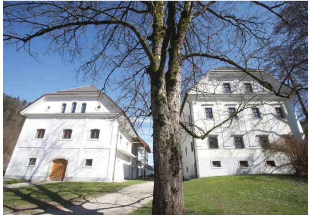
Tako Dvorec Visoko kot sosednje gospodarsko poslopje sta v zadnjih desetih letih dobila novo podobo.