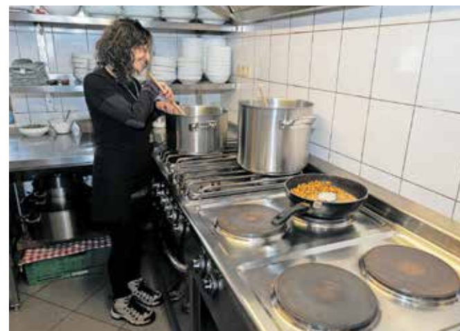
Se že kuha na petkovo jutro ...