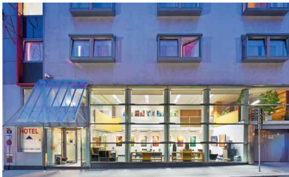
Pritličje hotela z zgolj stekleno steno poudarja povezanost hotela z ulico. Načrte za prenovo je izdelal arhitekt Boris Podrecca. / Foto: arhiv Antona Levstka

To je zanimiva zgodba. Mohorjeva je Korotan prodajala. Če ga takrat ne bi kupila Republika Slovenija in ga dala v upravljanje Mohorjevi, bi bil za Slovenijo izgubljen. Ker je takrat Jugoslavija propadla in s tem tudi promoviranje