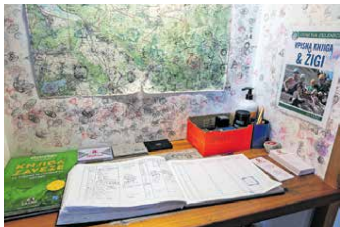
Da se ve, da smo bili 'gor'.

obrnejo v kuhinji, postrežejo goste, počistijo, kar je treba, skrbijo za okolico. Dom je v tem času odprt ob koncu tedna in za praznike, od