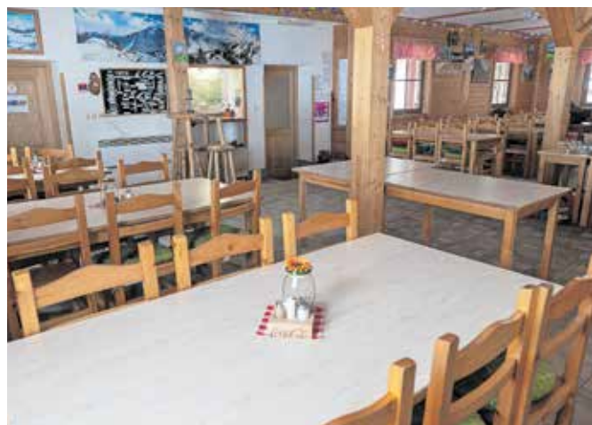
Prostorna in lepo urejena jedilnica

V planinskem domu je na voljo sedemdeset ležišč,