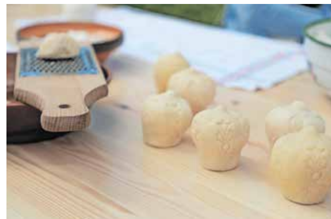
Značilni velikoplaninski sir trnič