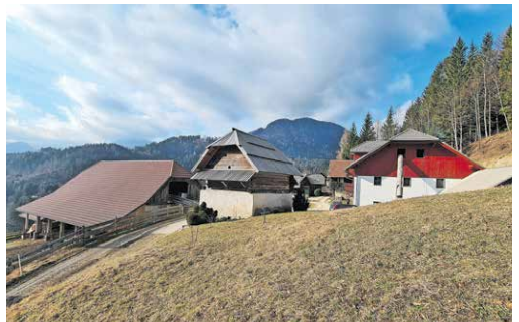
Vsa zemljišča so okrog domačije, a skoraj vsa v strmini.