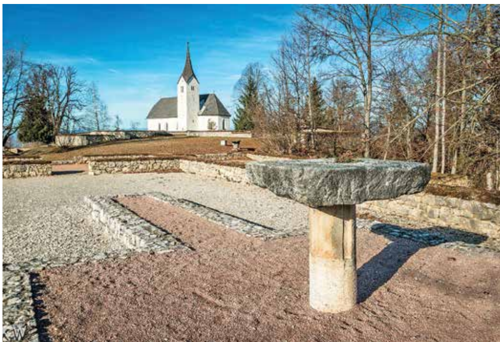
Izkopanine dveh zgodnjekrščanskih cerkva na gori Svete Heme

voril: »V moji generaciji je bil pogovorni jezik domače narečje. Nemško sem se začel učiti v prvem razredu ljudske šole. Danes je velika večina otrok prijavljena k dvojezičnemu pouku, slovenski pogovorni jezik v družinah pa vedno bolj nazaduje.« Občanke in občani živijo že desetletja brez narodnostnih konfliktov, kar je tudi soomogočilo, da je s Sadovnikom bil izvoljen za župana zastopnik občinske stranke, ki velja za slovensko. Prav tako je, poudarja Sadovnik, Globasnica