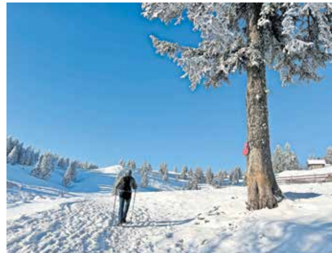
Nekatere poti so lahko dostopne tudi pozimi, za druge sta potrebni dobra telesna pripravljenost in izkušnost.

Prav zaradi bogatega kulturnega izročila in krhkega naravnega okolja je med