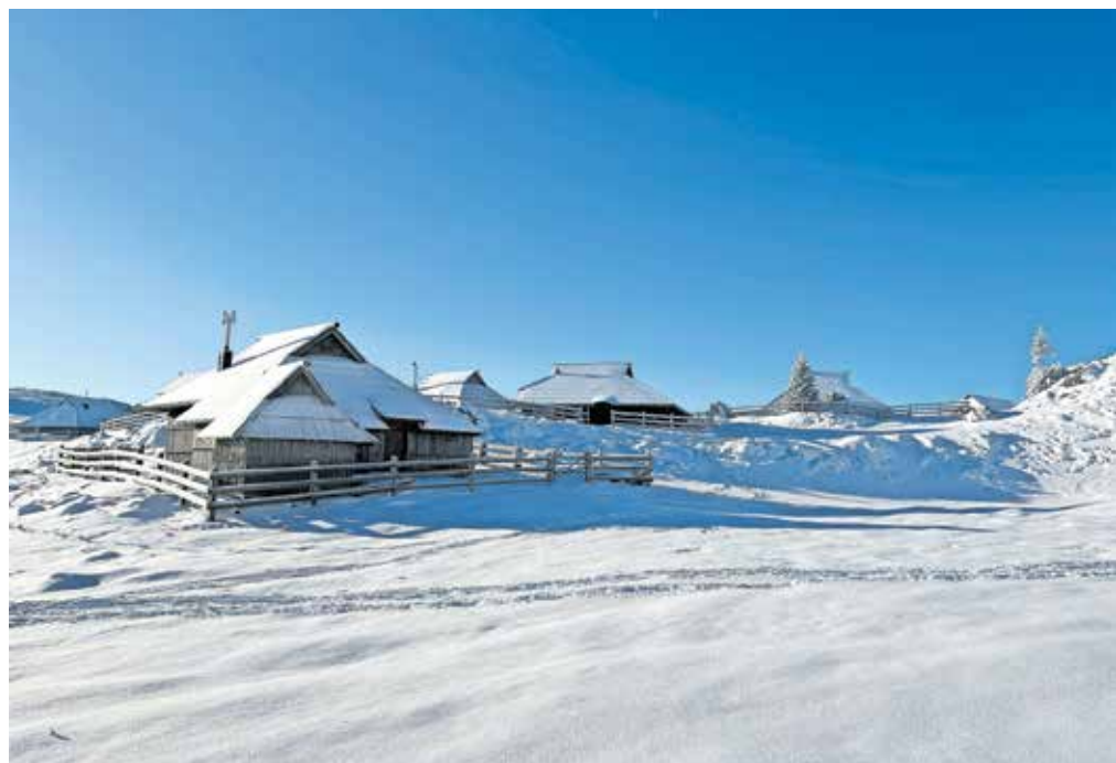
Velika planina je čarobna tudi pozimi.