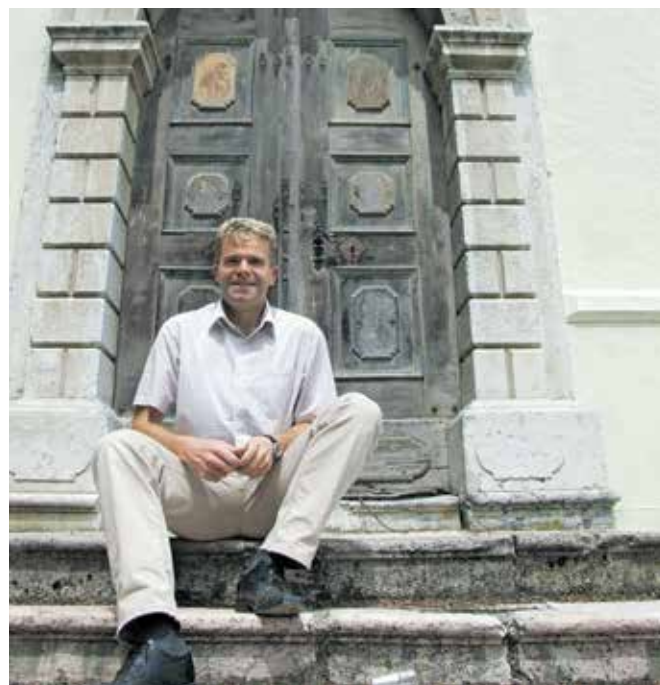
... in leta 2007