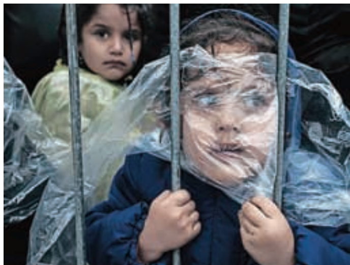
Nagrajena fotografija natečaja World Press Photo: deklica, čakajoča na registracijo v begunskem centru v srbskem kraju Preševo