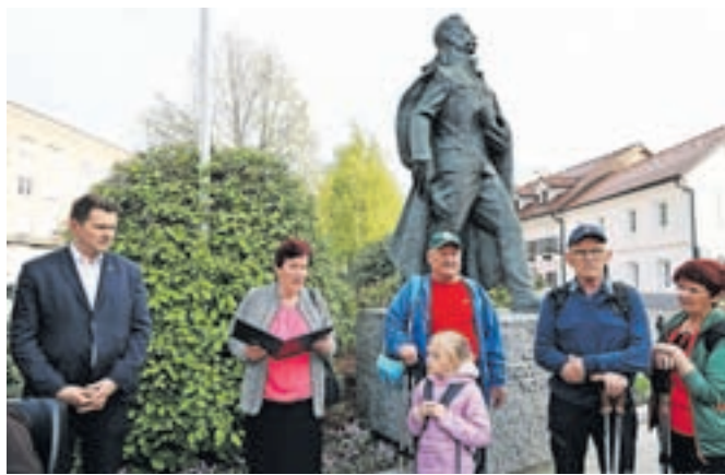
Pred pohodom so pripravili tudi krajši kulturni program.