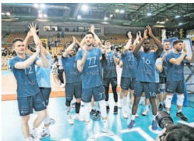
Ekipa Calcit Volley

V ljubljanski ekipi je pred polfinalnima tekmama konč-