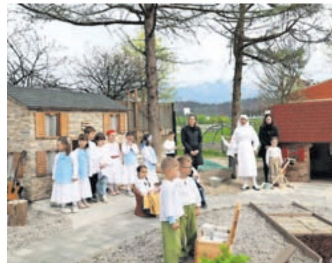
Otroci bodo skozi zgodbe slovenske vasice spoznavali korenine kulturne dediščine slovenskih pokrajin.

Občina Kamnik je za novo pridobitev namenila slabih 21 tisoč evrov, 250 evrov je bilo donacije, dobrih 8.500