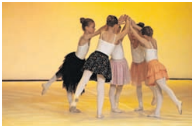
Glasbena šola Kamnik (Plesna pripravnica) s točko Podaj mi gib

Na reviji so nastopile skupine, ki gojijo različne zvrsti plesa, od baleta do hiphopa, od klasike in stilskih žanrov do sodobnih oblik izraznosti z gibom. Tako so se predstavili: kamniški Baletna šola Ana, Plesni klub Šinšin, KUOD Bayani in Glasbena šola Kamnik, Plesni studio Impulz in KUD Tarab iz Domžal ter plesalci OŠ Iva-