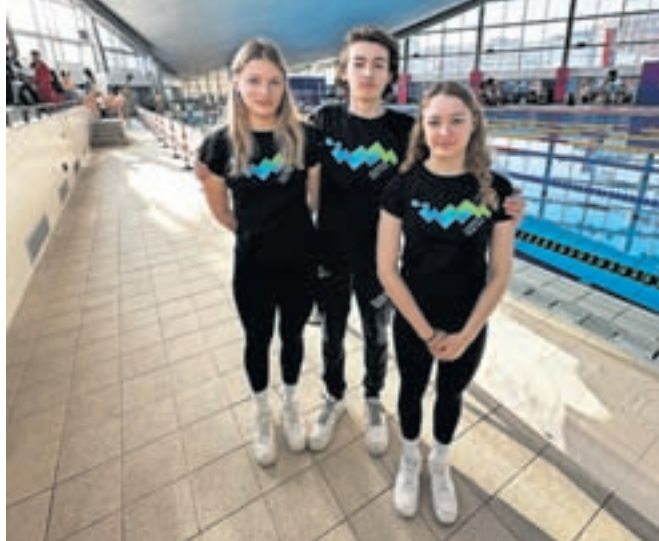
Kamniški plavalci v Beogradu

V soboto, 6. aprila, je v Ravnah na Koroškem potekal 20. mednarodni plavalni mi-