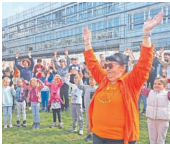
Dan zdravja na Osnovni šoli Frana Albrehta

nekatero že odhitele na šolski vrt matične šole, kjer so se skupnega gibanja veselili učenci 1., 2., 3., 7. in 8. razreda, nekateri zaposleni in članice društva Perovček. Združeni v krogu različnih generacij, obsijani s soncem in z dobro voljo v srcih smo sledili gimnastičnim vajam od glave do pete, ki jih je vodila Martina. Hitro nam je bilo jasno, da vaja dela mojstra, če mojster dela vajo, da smo lahko zdravi in poskočni, če poskrbimo tudi za gibanje. Med izvajanjem vaj smo bili zelo pozorni tudi na dihanje. Druženje smo zaključili s pozdravom soncu. Člani Društva Šola zdravja so nam za konec zapeli svojo himno. V naših srcih se je prebudila hvaležnost, da so z nami delili gibalne minute in veselje