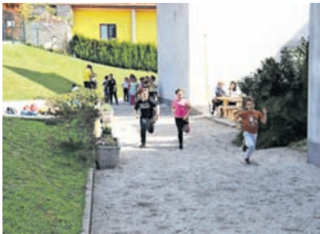
Dan športa na Osnovni šoli Stranje

Stranje – Sobota, 6. aprila, je bila na naši šoli delovna, izvedli smo Dan športa. Učenci in učitelji smo celo dopoldne spoznavali različne športne dejavnosti, ki so nam jih predstavili: Ženski nogometni klub Radomlje, Rod bistriških gamsov Kamnik, Smučarski skakalni klub Mengeš, Klub za ritmično gimnastiko Tjaša Šeme, Orientacijski klub Komenda, Judo klub Komenda, Plezalni klub Kamnik, Miki plesna šola, Šahovski društvo Domžale, Šahovski klub Komenda, Namiznoteniški klub Kamnik, Folklorna skupina Kamnik, Lokostrelski klub Kamnik, Triatlon klub Trisport Lelosi Ka-