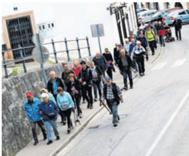
Maistrovega pohoda se je udeležilo okoli petdeset pohodnikov.