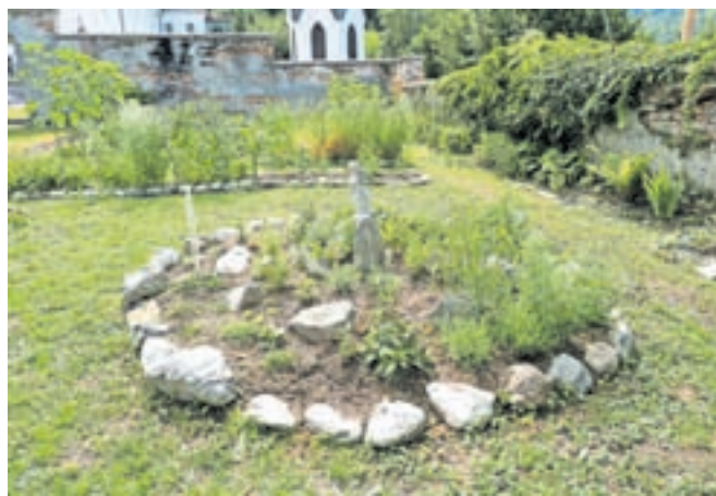
Javni zavod za kulturo Kamnik se je v projekt Commheritour vključil z zeliščarsko in kulturno dediščino.

V jedru projektnih aktivnosti je podpora tradicionalnih rokodelskih obrti in dejavnosti, utemeljenih na nesnovni kulturni dediščini – Commheritour oboje razume kot ključni sredstva za