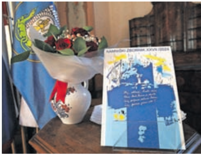
Kamniški zbornik št. XXVII/2024

Humarjeva je ob predstavitvi letošnje izdaje, 15. knjige v samostojni državi in skupno 27. knjige, poudarila, da so njihov projekt podpirali vsi nekdanji župani in tudi sedanji, zaradi česar so delo opravljali še z večjim veseljem in zadovoljstvom. Pojasnila je, da je bilo letos nekoliko manj naravoslovnih prispevkov, posebnost pa so intervjuji z gospodarstveni-