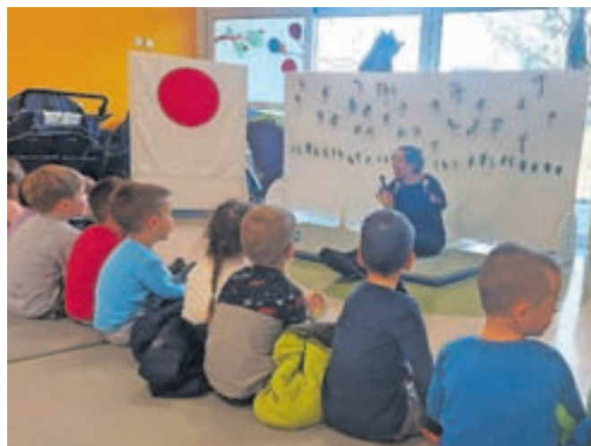
Mednarodni dan knjig za otroke v vrtcu Zarja