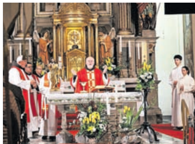
Spominska maša za pokojne profesorje in dijake Gimnazije in srednje šole Rudolfa Maistra

telji niti intelektualci, ki so bili zadnji braniki svobode. Danes smo preko optimalne točke svobode. Danes je svoboda mogoče ohraniti le tako, da se ji deloma odrečemo. Zahodna družba ta trenutek potrebuje konsenz o zmanjšanju svobode in nujni povrnitvi avtoritet, sicer bo prišlo do zdrsa v kaos in nastopa nove diktature. Bolje se je odreči delu svobode, kot pa zdrkniti v diktaturo in