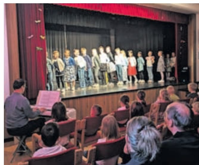
Učenci so na odru pokazali svoje talente.

sami, kostume in rekvizite so šivale in izdelovale učiteljice, vsi skupaj pa so vložili ogromno truda in energije v uro in pol dolg program, ki je minil še prehitro. Vsaj za nas, gledalce, starše, stare starše, tete in strice, ki smo ponosno opazovali, kaj vse zmorejo otroci, tudi tisti najmlajši. Zmorejo veliko, mnogokrat še več, kot si mislimo, če le kdo verjame vanje, če jim da priložnost, če je okolje spodbudno. Vsega tega v tuhinjski šoli ne manjka in zato ob tem en velik hvala učiteljicam in učitelju. Da ste nam polepšali tisto soboto in da naši otroci tako očitno napredujejo, tudi v veččinah javnega nastopanja, ki jim bodo v življenju prišle še kako prav.