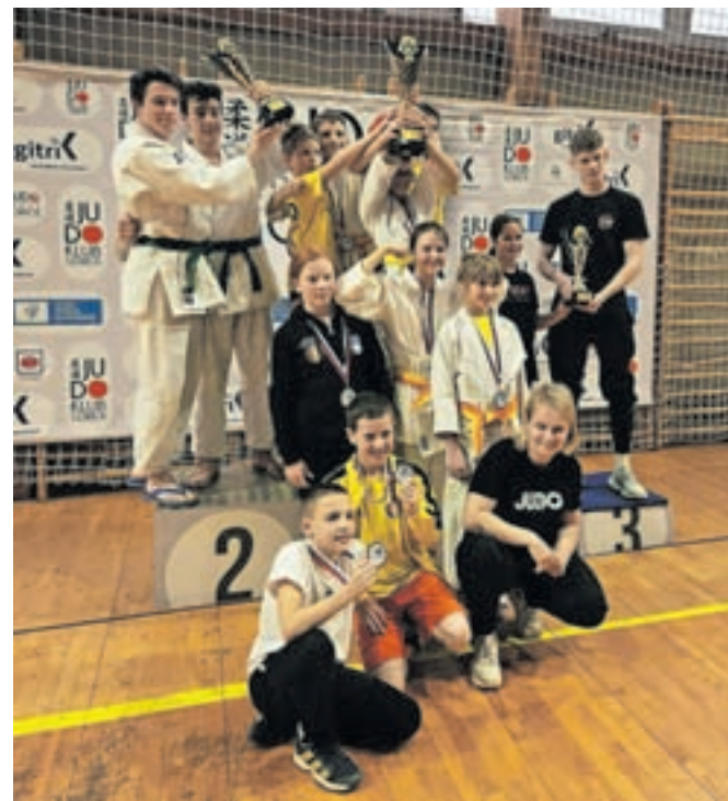
Judoisti kamniškega kluba so se s Pokala Gorice vrnili s petnajstimi medaljami.

Tudi starejši dečki in deklice U14 ter mlajši dečki in deklice U12 niso razočarali. Dru-