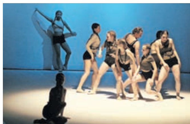
Plesni klub Šinšin se je gledalcem na letošnji območni reviji predstavil s petimi nastopi, tudi s točko Korenine (SDM1 – show dance mladinci, tekmovalna skupina).