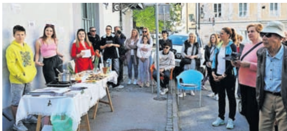
Dan odprtih vrat svetovalne pisarne za starejše