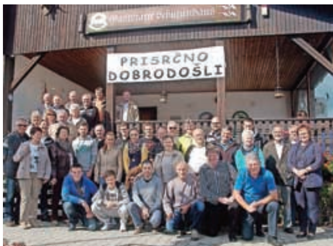
Skupinska slika iz Amberga