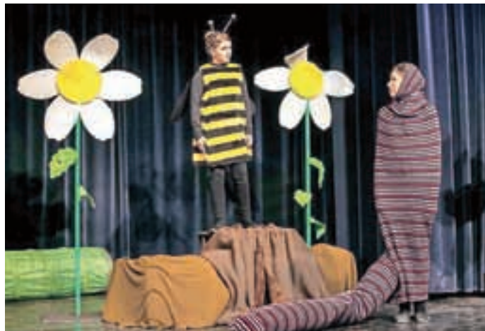
Nova otroška predstava Čebelica Maja že razveseljuje otroke.