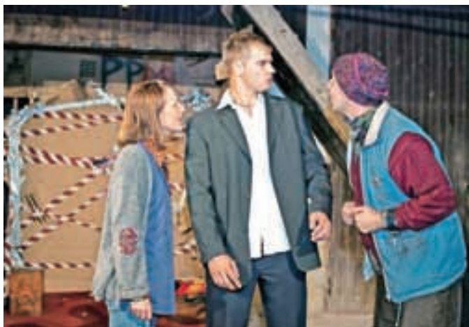
Do septembra smo igrali tragikomedijo Enajsti planet.

Kot vsako leto je bilo tudi preteklo za Kulturno umetniško društvo Predoslje zelo aktivno.