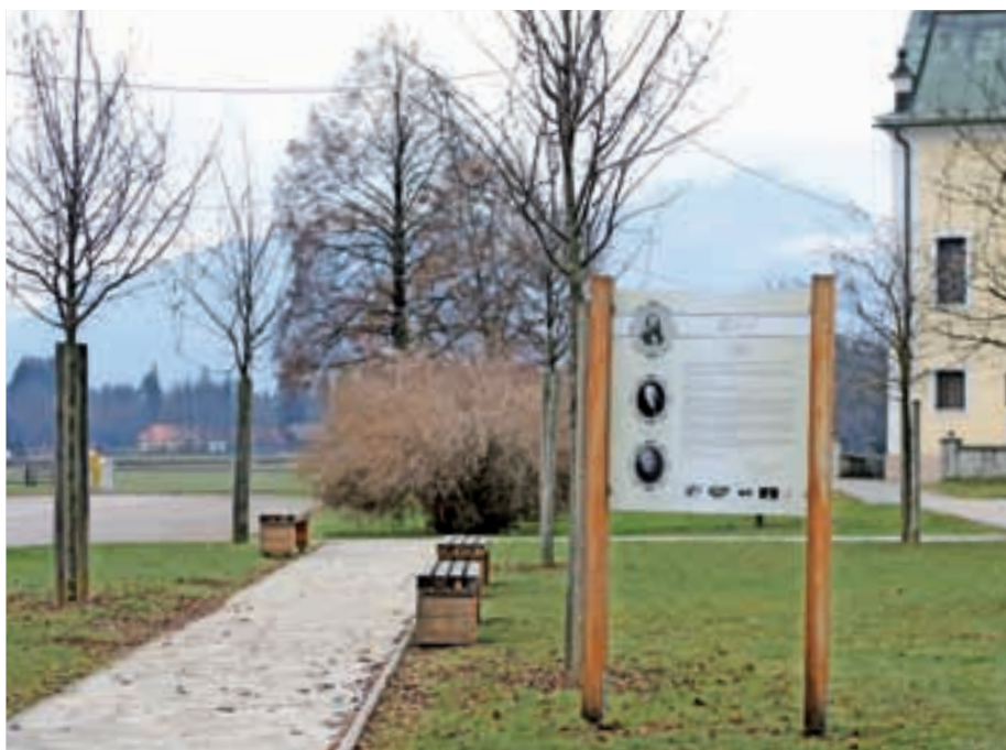
S Zoisovo potjo, ki se konča pri kulturnem domu, se ohranja in širi naprej delček krajevne zgodovine.

pričetek gradnje pa je predviden v drugi polovici leta 2016,« je povedal član sveta Nikolaj Zelnik.