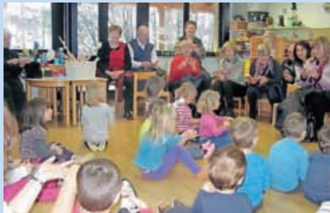
Tik pred prihodom Miklavža smo v goste povabili babice in dedke.

Seveda se s tem december še ni končal. Kje pa, šele začelo se je! Te dni nam pridni starši pripravljajo veliko presenečenje. Kaj vse, ne vemo, vemo pa, da bo veselo, prijetno in da bomo strašansko uživali.