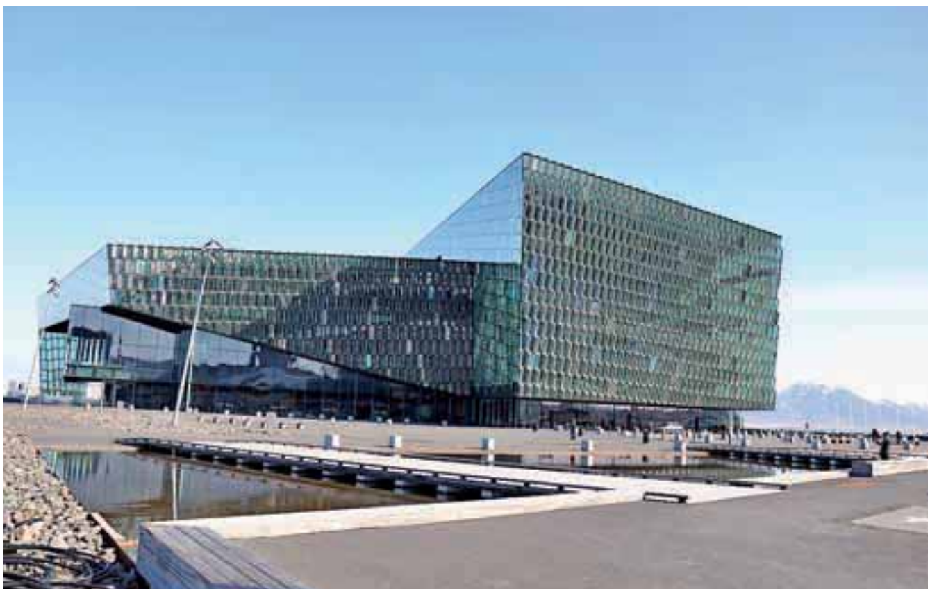
Reykjaviška opera je zaradi krize tri leta kazala »rebra«, lani so jo dokončali, tako je postala simbol krize.