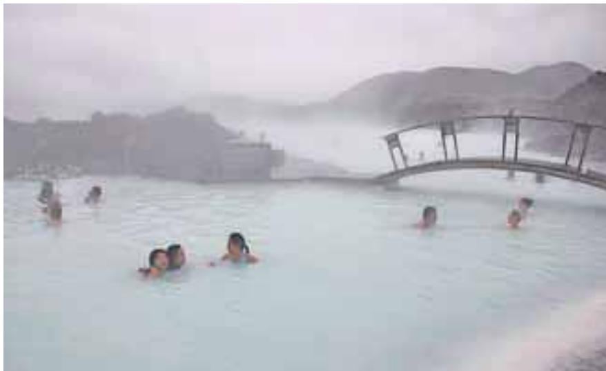
Plava laguna je čudež narave.

Odlična je bila večerja v restavraciji Skolabru, ki so jo sredi Reykjavíka uredili v nekdanji šoli, zato sprejme kar 180