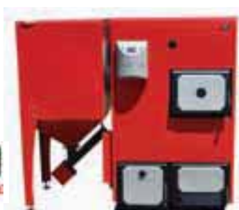
KOMBINIRANI KOTEL 3BT