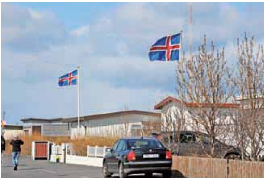
Islandska zastava je podobna danski, dodali so rdeči križ kot simbol ognjenikov.

Na izbruhe vulkanov so Islandci navajeni, ne bojijo se jih kaj dosti. Navsezadnje so njihove posledice predvidljive, tudi strokovno so na področju vulkanizma dobro podkovani. Bolj jih je strah potresov, čeprav jih na Islandiji ni, saj se tektonski plošči odmikata, potresi so običajno tam, kjer se spodrivajo. Njihov strah je torej votel. Toda kdo ve, kaj se dogaja globoko pod zemeljsko površino.