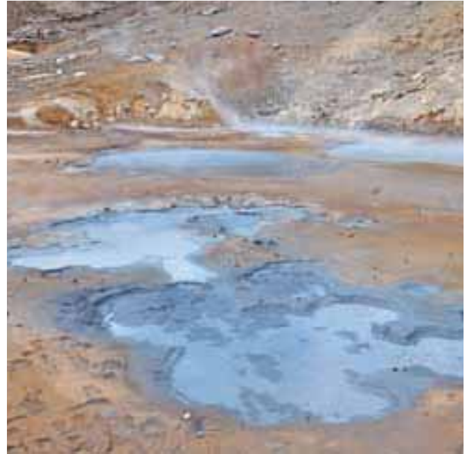
Vroči žvepleni izviri

ogled razpoke na stičišču evrazijske in severnoameriške tektonske plošče, kjer si torej podajata roke Stari in Novi svet. Na mostu nad razpoko si z eno nogo v Evropi, z drugo v Ameriki, carski občutek, ni kaj.