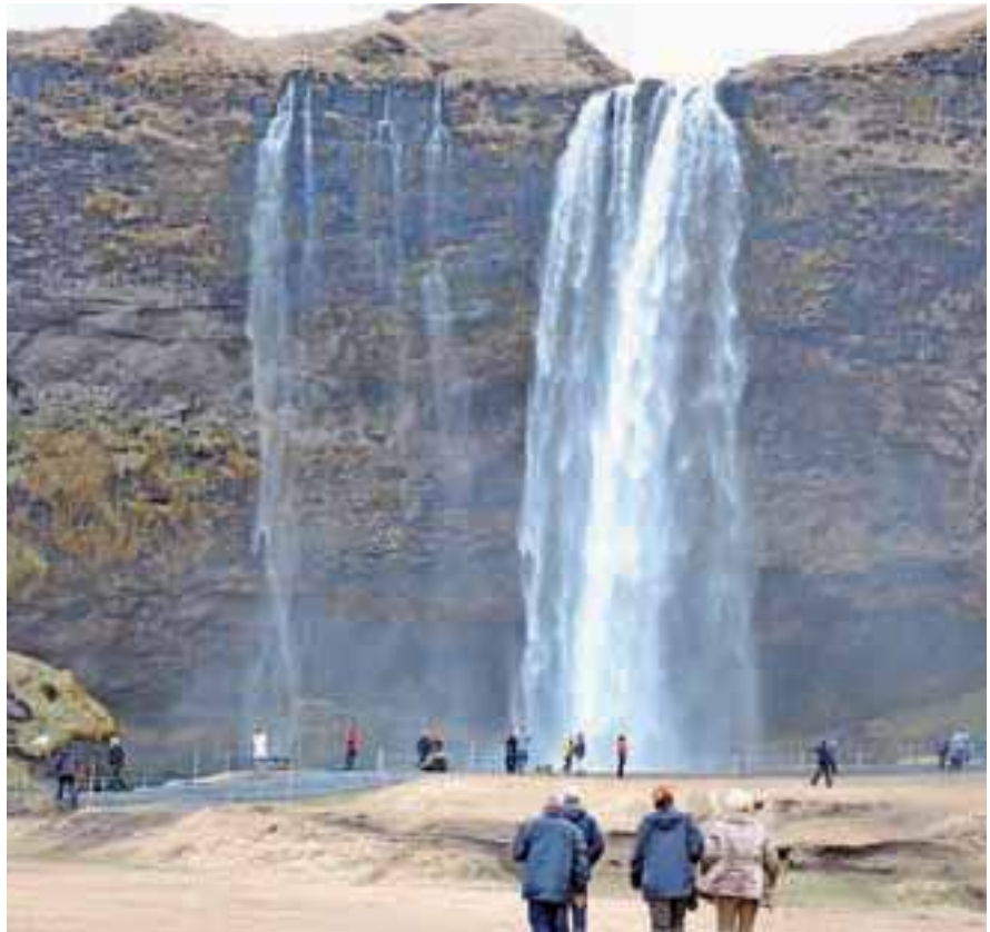
Slap Seljalandsfoss se spušča 60 metrov v globino.

Lahko rečem, da so mi bili na Islandiji všeč narava, ljudje, način življenja, kulinarika, državna ureditev, izjemno lepo oblikovani izdelki ... Skratka, vse, razen vremena, zlasti mrzlega vetra. Veliko sveta sem že videla, doslej sem samo v Jeruzalemu rekla, da ga bom še obiskala, ker je tako nabit z zgodovino. Islandiji sem prav tako rekla nasvidenje. In nisem bila edina, tudi drugi so ob vrnitvi ugotavljali, kaj vse bi si še lahko ogledali. Upam, da bom prihodnjič ujela lepše vreme in bodo nastale lepše fotografije, kajti Islandija je zaradi svoje slikovitosti in razgledov raj za fotografe.