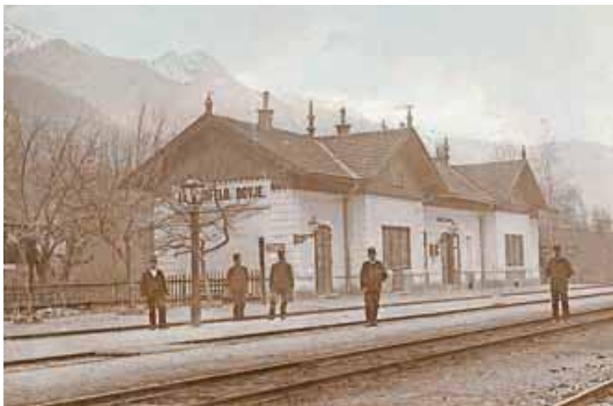
Železniška postaja Dovje-Mojstrana (Lengelfeld)