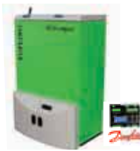
PEČ NA PELETE BT COMPACT