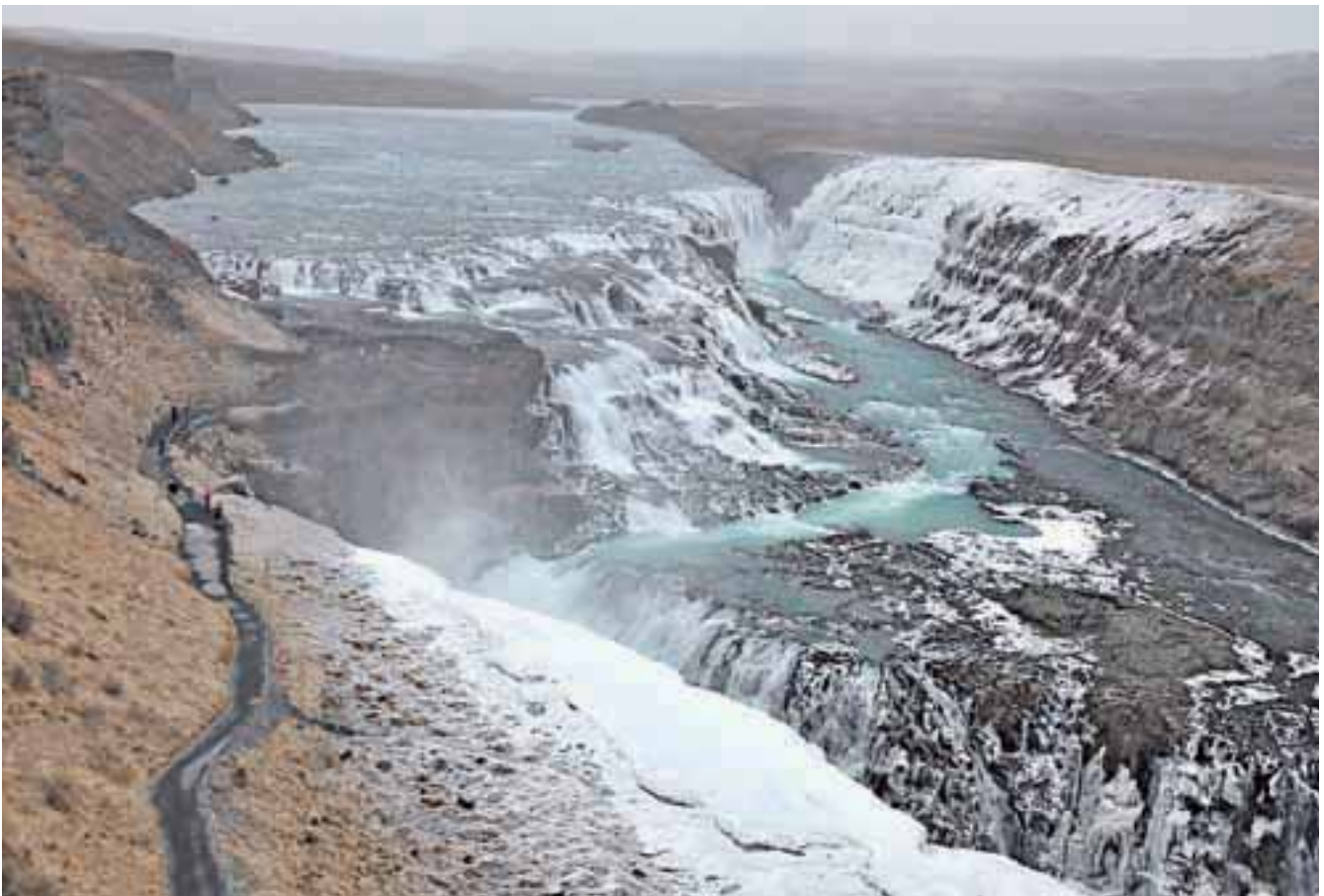
Zlati slap (Gullfoss) pada v treh stopnjah.

Po izbruhu krize so se Islandci uprli. Vsako soboto so protestirali pred parlamentom, dokler vlada ni padla, z njo vred so propadle tri komercialne banke. S pomočjo spleta so spisali novo ustavo, izvolili novo vlado. Vendar jim kljub