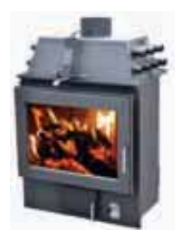
KURIŠČE KAMINA ZA CENTRALNO OGREVANJE