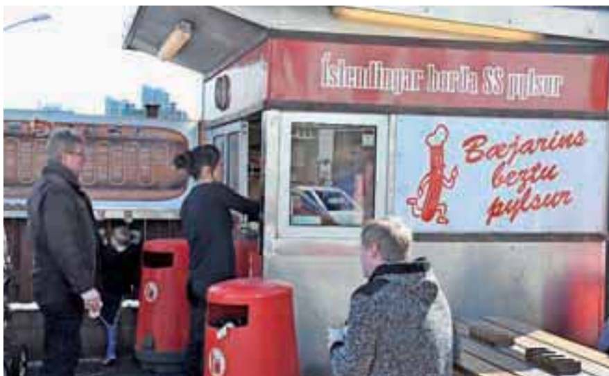
Tudi Clinton je v znameniti kiosk prišel po »vročega psa«.