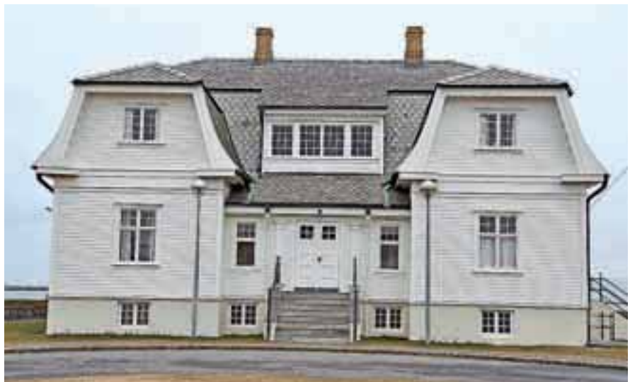
V tej hiši sta Reagan in Gorbačov končala hladno vojno.