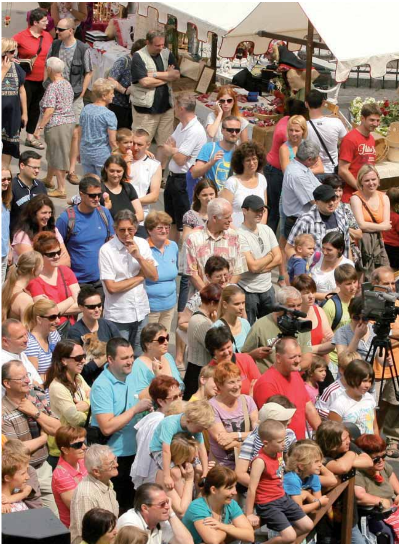
Kaj počnemo s to državo?