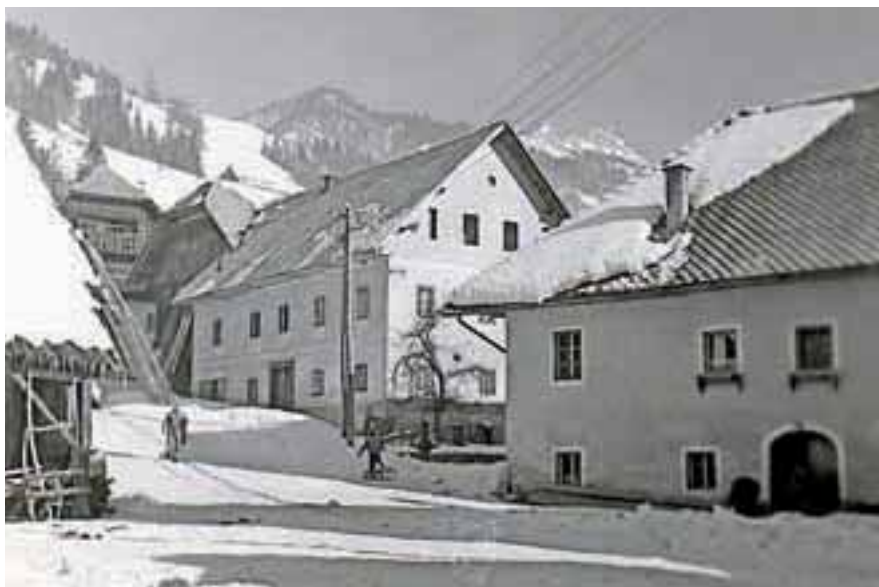
Kmečke hiše sredi vasi na Dovjem

spostva med Krko in Mirnom, kar se odraža v dovškem dialektu, ki se razlikuje od dialekta drugih vasi v Zgornjesavski dolini. Znana sta dolenska refleksa sredi gorenjskega dialektičnega ozemlja, široki e in o: tj ei in ou. Še danes so značne besede v pogovoru med domačini: sneih, breih, gneizd, mleik, streiha, keiha, breiza, sveiča, ceista, veitr, želeiz, leis, deiža, leit, leita, z leitmi, medveid, peite, prteipat, deivat, podeivat, skreigat, jeidu, veidu, seiku, nouč, snouč, mouč, bouh, stouh, lepou, grdou. Zelo zanimiva bi bila primerjava izvora in izgovora posameznih besed, ki se ohranjajo v naših krajih in odstopajo od besed sosednjih vasi v Dolini ali knjižnega jezika.