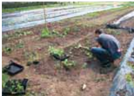
Vrt dobrih sosedov

Nataša Šink, univ. dipl. ing. agr., BC Naklo