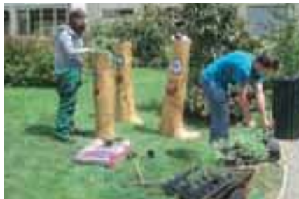
Novi družinski člani BC-ja iz smrekovih debel

Druga skupina je okrasila prostor pred šolskim ribnikom in trgovino. Dijaki so iz debela smreke izdoblili les in deblo uporabili kot posodo. Za odtok vode so na zadnji strani debel navrtali luknje, notranjost debel obložili s filcem, na filc pa nasuli substrat in nato zasadili rastline. Kadar nasajate v posode brez luknjic za odtok vode, poskrbite za drenažo (spodaj plast glinopora, na njem filc in nato substrat). Tretja skupina je imela nalogo tlakovanja