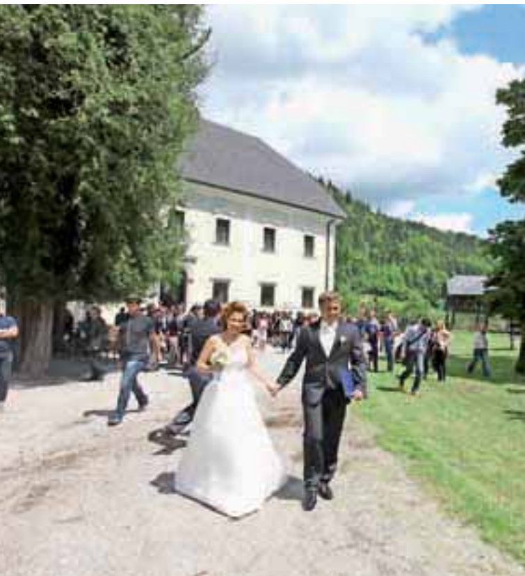
V Tavčarjevem dvorcu na Visokem so od letos naprej tudi poroke.

Na območju nekdanjega rudnika v Todražu je zrasla gospodarska cona, v njej pa številna podjetja, ki so prerasla garaže ali bila ustanovljena povsem na novo: Topos, Int vrata, Energija narave, Mizarstvo Potočnik, Hipler in drugi. To cono je rudnik uredil s pomočjo občine in evropske pomoči, podobno še eno gospodarsko cono v Dobju. V njej bo svojo novo tovarno gradilo podjetje Polcom, ki bi ga morda morali postaviti na prvo mesto, saj je eno od tistih, kjer kažejo, kaj je mogoče v 25 letih narediti z vizijo, znanjem in vztrajnostjo. Veliko manjših podjetij je zraslo tudi v okoliškem hribovju.