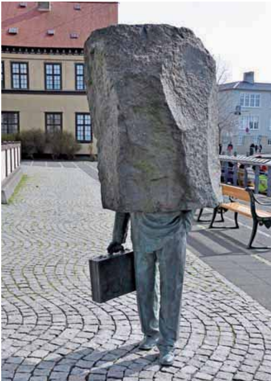
Kip smo po slovensko poimenovali tajkun.

gostov. Znan je po islandskih specialitetah, za predjed so se na krožniku znašli losos s koprom, naravno sušen kit, polenovka z gorčično omako in goska z melono. Sledil je jagenček z divjimi gobami, s krompirjevim ragujem in tradicionalno islandsko zeliščno omako. Večerjo smo končali s palačinkami, ki so na Islandiji zelo priljubljene, dodali so jagodni kompot. Vse te poslastice so stale 43 evrov, brez pijače seveda.