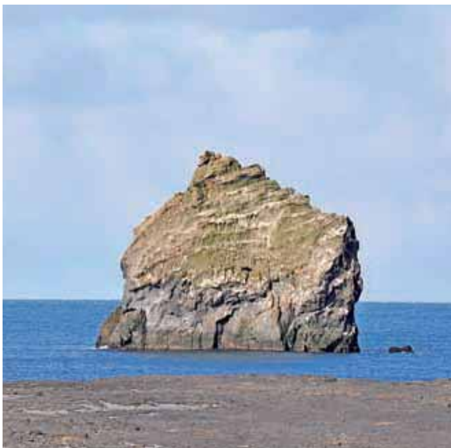
Islandija je raj za fotografe.

Islandijo sem pred leti videla z letala na poti v Ameriko. Leteli smo podnevi, vreme je bilo lepo, otok snega in ledu se je bleščal v soncu kot nevesta pred oltarjem. Vožnja od letališča Keflavik proti glavnemu mestu Reykjavik je ponujala povsem drugačno pokrajino – črno morje lave, ki je še najbolj spominjala na Lunino površino. Nič čudnega, da so Američanom očitali, kako so pristanek na Luni uprizorili kar na Islandiji. Občutek nenavadnosti pokrajine je še okrepil