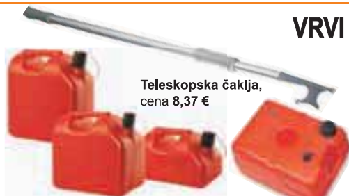
Teleskopska čaklja, cena 8,37 €

Kantica za gorivo 5 l, 5,25 € Kantica za gorivo 10 l, 7,53 € Kantica za gorivo 20 l, 12,05 € Rezervoar za gorivo 22 l, 18,90 €