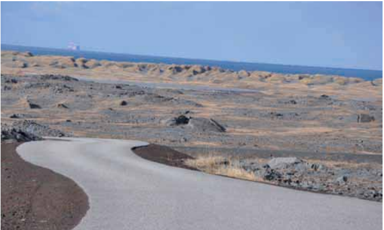
Polja črne lave

Za prvomajsko potovanje na Islandijo sem se odločila na hitro, ko sem prejela Kompasovo elektronsko obvestilo. Priložnost je bila odlična, saj je direktni letal-