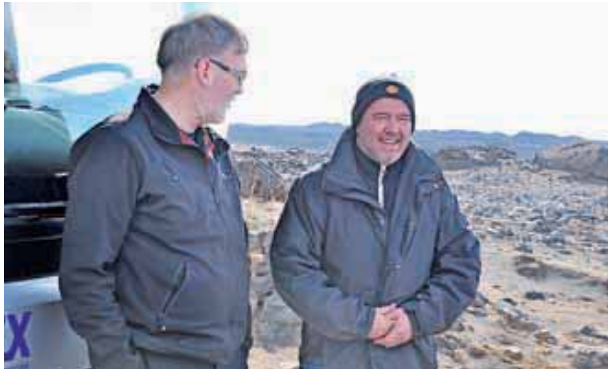
Malce je zeblo tudi islandska šoferja.

Nato je prišla gospodarska kriza, s katero so se Islandci spoprijeli na svoj način. Pustili so, da propadejo tri banke, kar je bilo za evropske politike in finančnike nezaslišano. Toda, po petih letih že prihajajo pohvale. Najpomembnejše je