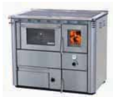
ŠTEDILNIK NA TRDA GORIVA ZA CENTRALNO OGREVANJE