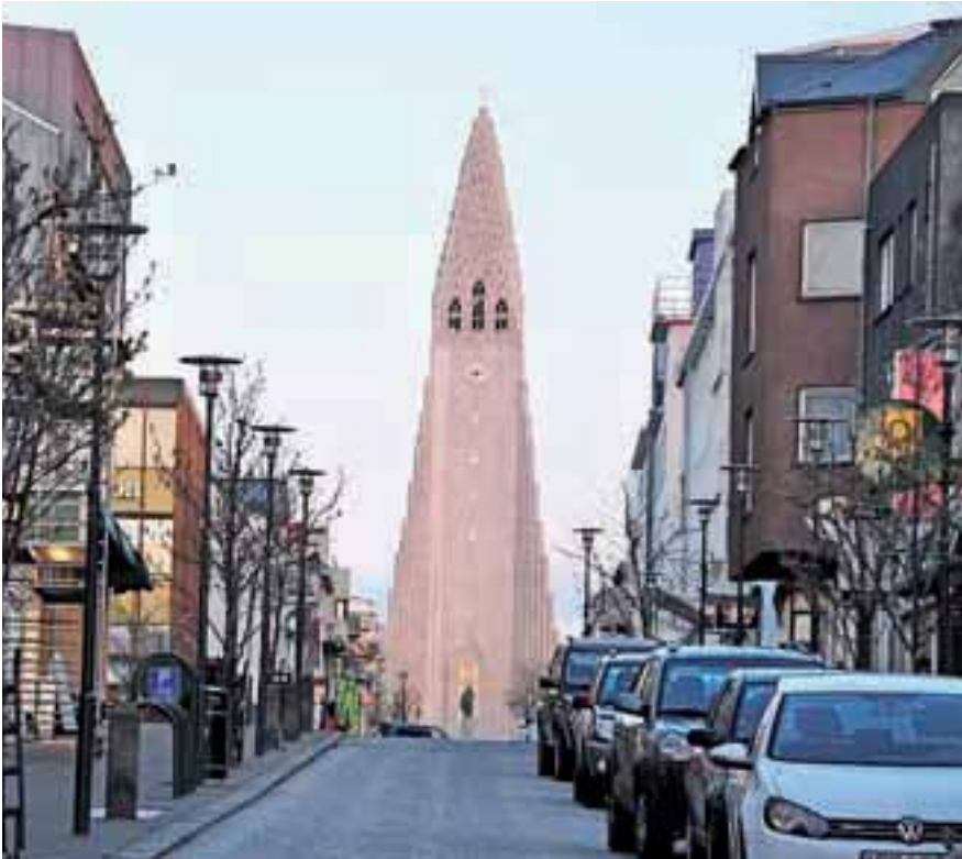
Veličastna Hallgrímurjeva cerkev je nova, postavili so jo sredi Reykjavika.

vsekakor evropsko priznanje, da Islandija angleškim in nizozemskim varčevalcem ni dolžna vrniti denarja, ki so ga pred krizo nalagali v islandske (spletne) banke. So pač tvegali, vsaka država pa je dolžna skrbeti za svoje državljane.