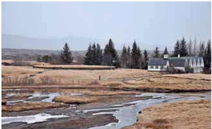
Prostor, kjer so imeli parlament že davnega leta 930 kot prvi na svetu.