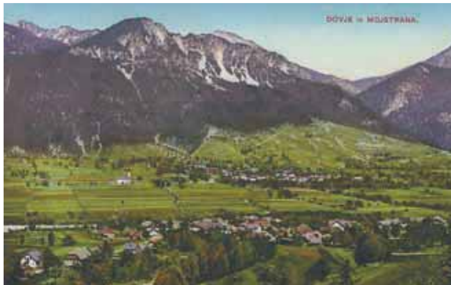
Dovje in Mojstrana leta 1912

V času kolonizacije so prav lahko prišli naseljenci ne samo s Koroškega ali Tirolskega, kjer so bila freisinška posestva, temveč z Dolenjskega, s Klevevškega go-