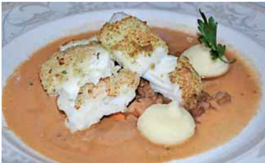
Na Islandiji boste vzljubili ribe.