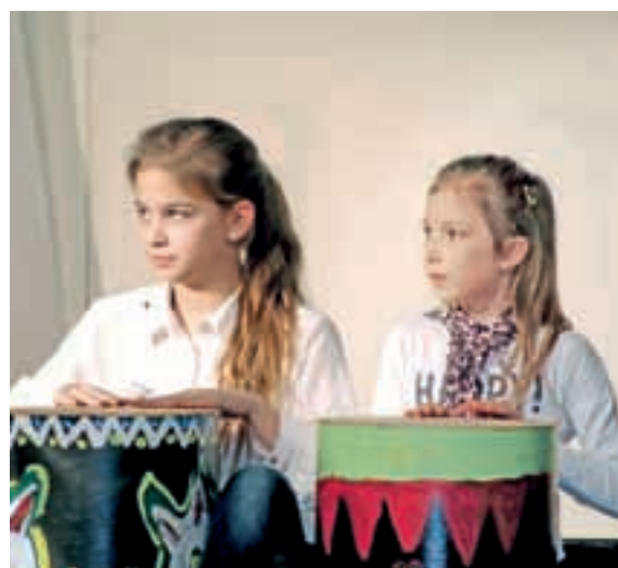
Glasbeni mojstrovalki pri igranju na bobne