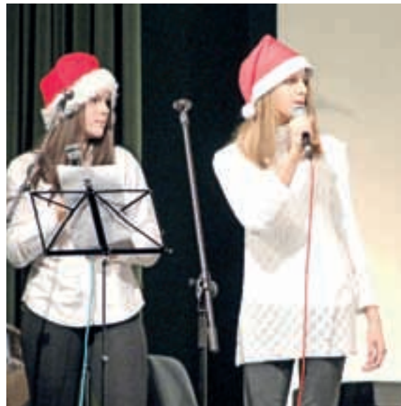
Solistki Šolskega benda

Za veliki finale so se vsi nastopajoči, skupaj z učiteljicami, ki so v pripravo koncerta zagotovo vložile veliko truda, zbrali na odru. Veselih praznikov ne bi