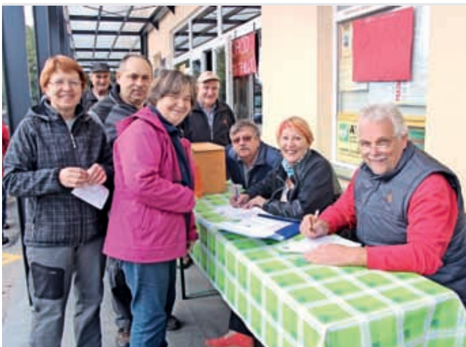
Jutranje zbiranje prijav na pohod

Ves trud je bil poplačan, ko smo videli, koliko ljudi prihaja na start. Kar 170 ljudi je hodilo, kuhalo, plesalo, igralo,