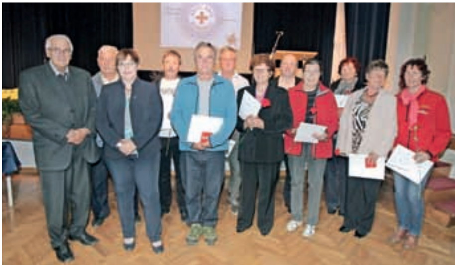
Priznanja krvodajalcem in prostovoljcem so letos podelili v Šenčurju.