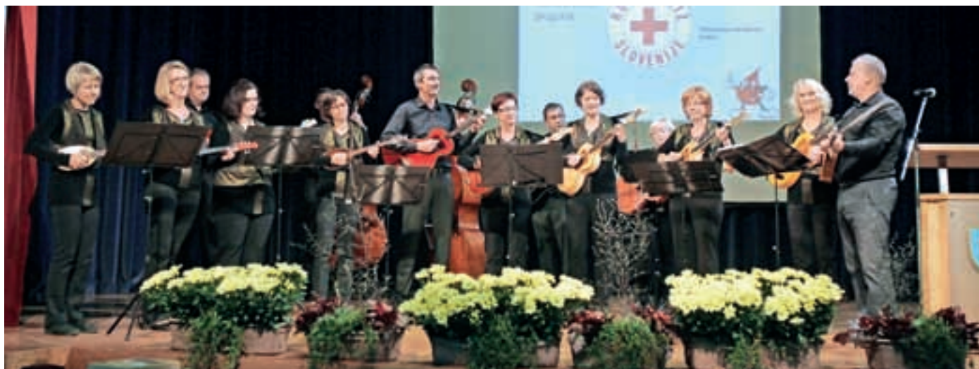
Na prireditvi ob podelitvi priznanj je nastopila tudi tamburaška skupina, ki deluje pri Folklorem društvu Kranj.

Spoštovani krajanji Primskovega! Krajevni odbor Rdečega križa vam želi lepo božično in novoletno praznovanje, predvsem pa obilo sreče, zdravja in zadovoljstva v prihajajočem letu 2016.