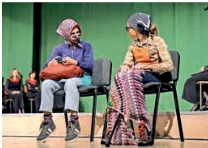
Na osrednji slovesnosti so nastopili tudi učenci podružnične šole.