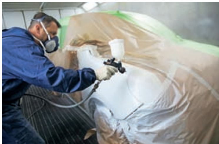
Avtomehaniki in avtoličarji si želijo boljšo poravnavo svojih storitev s strani zavarovalnic.

Iz Sekcije pooblaščenih trgovcev in serviserjev pri Gospodarski zbornici ter iz Društva slovenske avtostroke sporočajo, da je s strani zavarovalnic »priznana« cena storitve postala nevdržna in ne pokriva niti lastnih stroškov. Združeni želijo vsem omogočiti boljše pogoje pri zavarovalnicah, torej pošteno in pravično plačilo za njihovo delo, uveljaviti boljše evropske modele obdelave, cenitve in sanacije škode po škodnem dogodku v prometu. Pri tem gre tudi za storitve, ki pripadajo zavarovancu že iz naslova osnovnega zavarovanja. Po pomoč so se obrnili tudi na priznane institucije in tuje odvetnike, kjer že imajo pozitivne izkušnje pri reševanju tega vprašanja. Z zavarovalnicami si želijo bolj vzdržnega partnerskega odnosa.