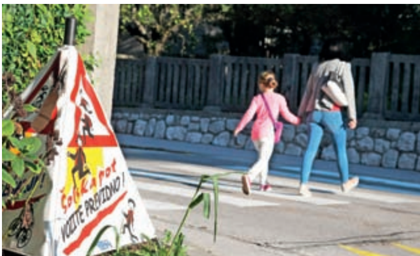
Cesto prečkamo na prehodu za pešce. Pri neprekinjeni črti na vozišču prečkanje ni dovoljeno. Za nepravilno prečkanje je globa 40 evrov.

Ministrstvo za zdravje in Policijska sta letos že osmič izvajala akcijo za manj popitega alkohola in manj opitih voznikov na slovenskih ce-