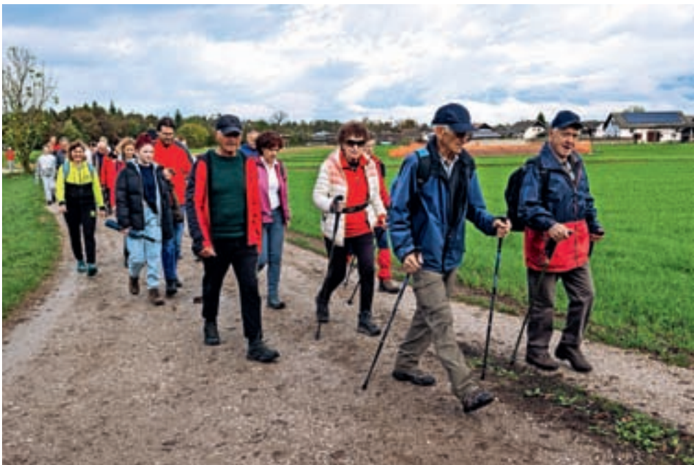
Na Pohodu po Poti Jeprškega učitelja od Drulovke do Podreče

Dan kasneje je bil v sklepnem delu letošnjih Jenkovih dnevov na sporedu že četrti Pohod po Poti Jeprškega učitelja od Drulovke do Podreče z zaključno slovesnostjo ob Jenkovem spomeniku na Podreči, ki ga vsako leto pripravljajo v