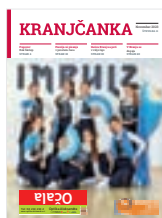
Na naslovnici: Plesna skupina Impulz

KRANJČANKA (ISSN 1408-7103) je mesečna priloga Gorenjskega glasa / Izdajatelj: Gorenjski glas, d. o. o., Kranj / Odgovorna urednica: Marija Volčjak / Urednica: Ana Šubic / Komercialist: / Jan Čimžar, T: 041/704 857 / Oblikovanje in tehnično urejanje: Matjaž Švab / Priprava za tisk: Gorenjski glas, d. o. o., Kranj / Tisk: Tiskarsko središče d. o. o. / Raznos: Pošta Slovenije, PE Kranj / Uredništvo, naročnine, oglasno trženje: Nazorjeva ulica 1, 4000 Kranj, telefon: 04/201 42 00, e-pošta: info@g-glas.si / Mali oglasi: telefon 04/201 42 47 / Delovni čas: ponedeljek, torek, četrtek in petek od 8. do 15. ure, sreda od 8. do 16. ure, nedelje in prazniki zaprto. / KRANJČANKA je priloga 92. številke Gorenjskega glasa, 17. novembra 2023, izšla je v nakladi 35.000 izvodov, priložena je Gorenjskemu glasu, prejela so jo vsa gospodinjstva v kranjski občini.