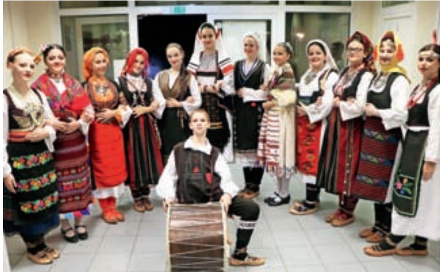
Ženska pevka skupina društva gostitelja Dnevov srbske kulture v Kranju

Predzadnji dan Dnevov so – ponovno na Kokrici – pripravili večer tradicionalnih pesmi Pjesma roda mog, kjer smo slišali moške in ženske zasedbe tako iz domačega društva kot iz Radovljice, nastopili