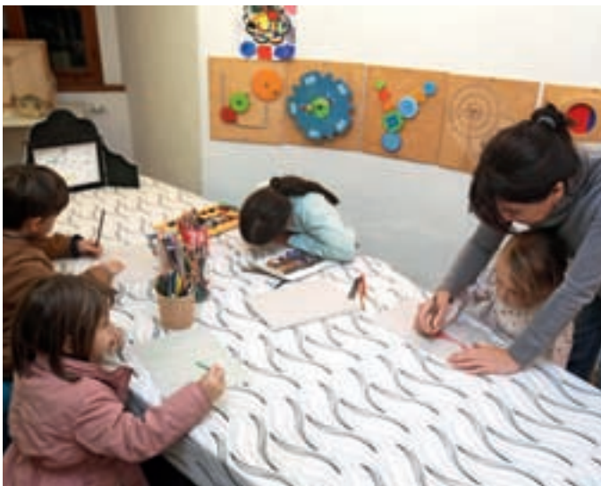
Svoje kamišibaje so na delavnicah izdelovali tudi najmlajši.