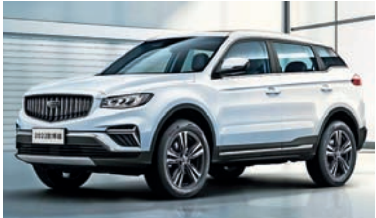
Na slovenske ceste v začetku prihodnjega leta prihaja najbolj prodajana znamka na Kitajskem, Geely, s 4,5 metra dolgim modelom Atlas Pro.

K itajska podpira proizvodnjo svojih avtomobilov z izdatnimi subvencijami, zato so ti lahko bistveno cenejši in ogrožajo evropski trg, menijo v Evropski uniji. V oktobru letos so zato začeli preiskavo spornega kitajskega subvencioniranja domačih proizvajalcev, in če bodo odkrili nepravilnosti, ki pomenijo nelojalno konkurenco, se bo Evropa branila z ustreznimi ukrepi (večje uvozne dajatve ...). Poznavalci svarijo, da bi to lahko imelo tudi učinek bumeranga, saj lahko tudi Kitajska udari s povračilnimi ukrepi, denimo v obliki omejevanja izvoza ključnih surovin in tehničnih delov, potrebnih za evropsko avtomobilsko industrijo. Končno tudi evropski proizvajalci, kot sta BMW in Renault, izdelujejo svoja vozila na Kitajskem.