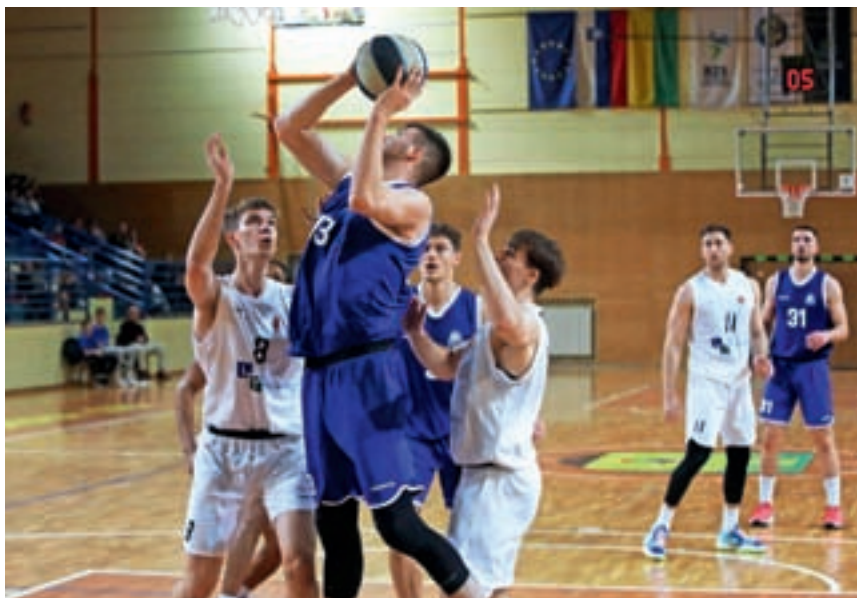
Kranjski košarkarji (v modrih dresih) so pretekli teden izgubili v Škofji Loki, naslednjo tekmo pa bodo 20. novembra igrali doma.

»Jusufa smo želeli zadržati v klubu, kjer smo imeli zanj pripravljen kratkoročni ter dolgoročni program dela. Skupaj z družino se je