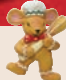
MIŠKA Velikost: 8 cm. 4,39 EUR/kos