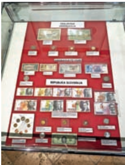
Portrete na nekdanjih dinarjih in tolarjih imamo še vedno v spominu.

Seveda je za obiskovalce še posebno zanimiv razvoj portretov v nekdanji Jugoslaviji, kjer smo na denarju poleg Tita imeli tudi junake dela, pa kasneje Nikolo Teslo, Slovenci pa smo, preden smo sprejeli evro, na svojih tolarjih raje upodabljali umetnike in znanstvenike.