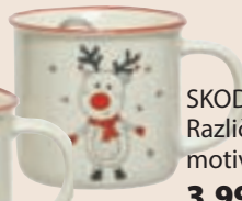
SKODELICA Različni božični motivi. 3,99 EUR/kos