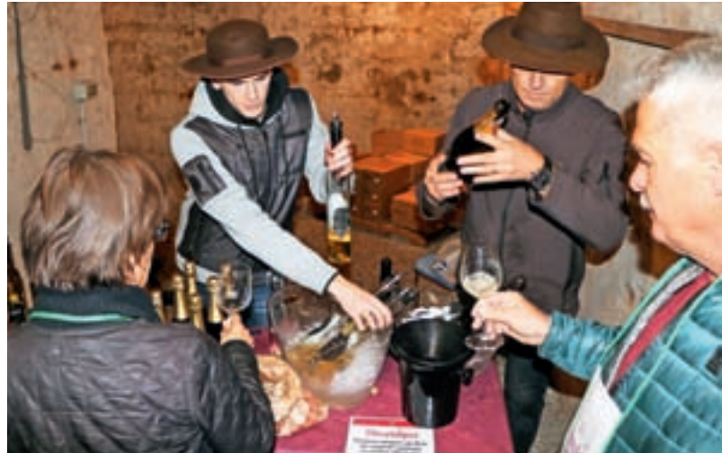
V petek, 17. novembra, se v rovih začenja Vinska pot. Organizatorji pričakujejo več kot pet tisoč obiskovalcev.

Bliža se tudi že Prešerni december, ki v stari del Kranja prinaša pestro dogajanje. Začelo se bo v nedeljo, 3. decembra, ob 17. uri s prižigom prazničnih luči, ki ga bosta pospremila koncert Moon Time Quarteta in prihod ledene kraljice s spremstvom. V nadaljevanju bodo po napovedih Petre Žibert petki in sobote vse do 22. decembra obarvani s koncertnim dogajanjem, ki ga bodo na Glavnem trgu sou-