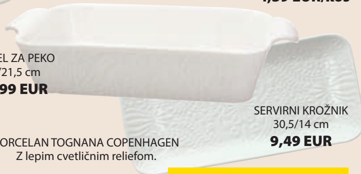
PORCELAN TOGNANA COPENHAGEN Z lepim cvetličnim reliefom.