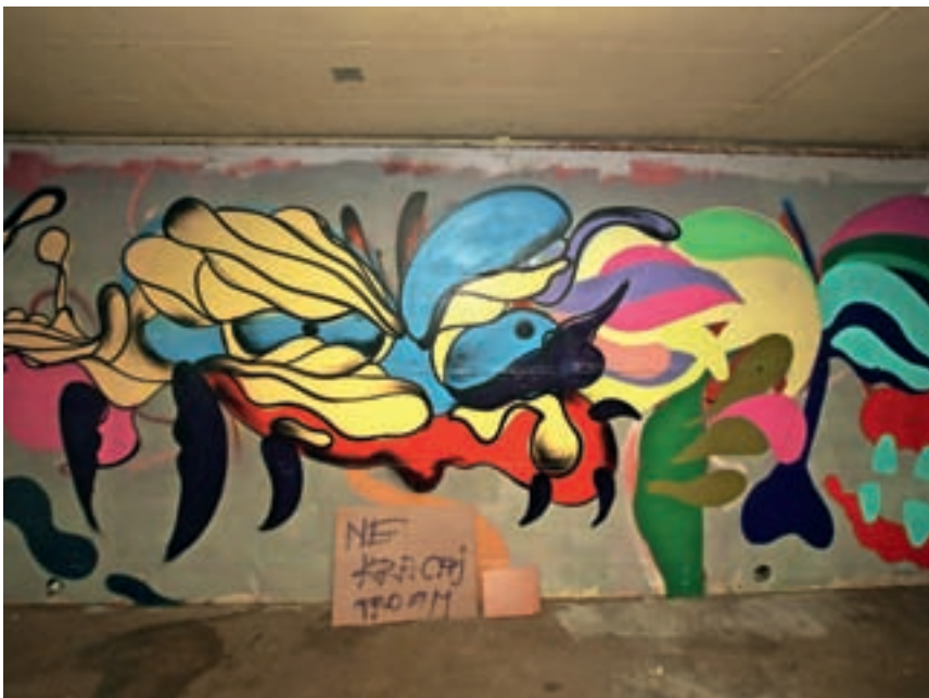
Konec oktobra je nastala poslikava podhoda pod Cesto Rudija Šeliga v Kranju.