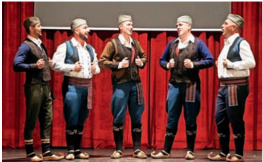
Na večeru tradicionalnih pesmi je nastopila tudi moška pevka zasedba KUD Djoka Pavlović iz Beograda.

so tudi goste iz Srbije. Dneve srbske kulture pa je tradicionalno zaključila folklorna manifestacija, a tokrat v dvorani kulturnega doma na Primskovem. Na Razigrani mladosti, kot