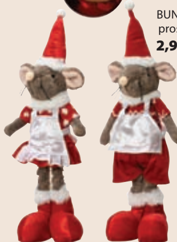
MIŠKA Velikost: 45 cm. 25,39 EUR/kos