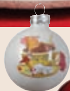
BUNKA, steklena, ø 6 cm 1,59 EUR/kos