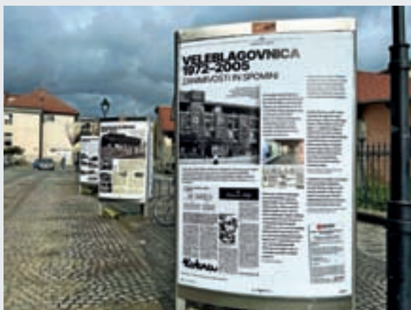
Vse o Globusu tokrat pred Globusom