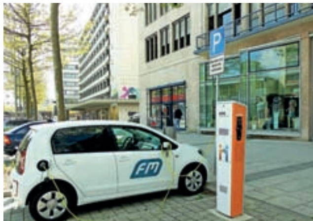
Polnjenje električnega vozila še vedno ni prijazno do slehernega voznika.

Pod drobnogled so vzeli 48 polnilnic z različnimi ponudniki, ki so jih izbrali naključno po celi Sloveniji. Preverjali so, kako preprosto je najti polnilnico, se prijaviti, začeti polnjenje in na koncu zanj plačati. Ugotavljali so tudi, kako je s servisnimi in drugimi storitvami, ali je prostor za polnjenje prilagojen invalidom in družinam z otroki. Manj so se posvečali tehničnemu delu, a so ven-