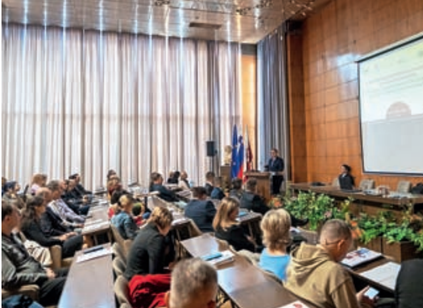
V Kranju so gostili 9. Nacionalno konferenco o varnosti v lokalnih skupnostih.

Na občutek varnosti v lokalni skupnosti vpliva mnogo dejavnikov, eden od njih je pojav kriminalitete, ki je po besedah Poklukarja večja v vseh večjih mestih, kjer je obmo-