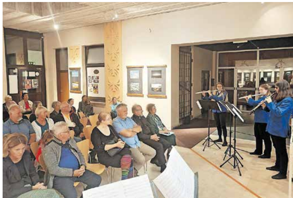
Z odprtja razstave