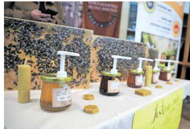
Med je privabljal dijake in druge obiskovalce, ki so lahko okušali razlike med posameznimi vrstami.