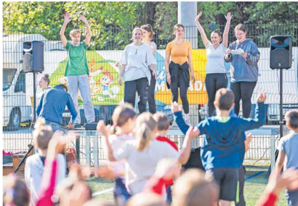
Dijaki izbirnega modula Šport za otroke Srednje šole Jesenice, program Predšolska vzgoja, so vodili otroke po vadbenih postajah.