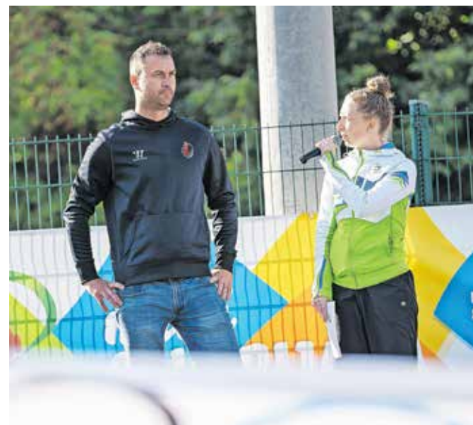
Svečano zaprisego športnikov je podal udeleženec olimpijskih iger, hokejist Sabahudin Kovačević. U. P. / FOTO: NIK BERTONCEJ

Operacija se izvaja v okviru Operativnega programa za izvajanje Evropske kohezijske politike v obdobju 2014-2020, prednostne osi 16, Spodbujanje odprave posledic krize pandemije COVID-19 in priprava zelenega, digitalnega in odpornega okrevanja gospodarstva v okviru REACT-EU ESS.