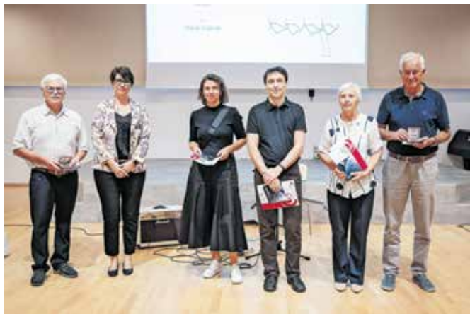
Nagrajenci v kategoriji Abstract

Za glasbeno obogatitev na odprtju je poskrbel kantavtor Staš Hrenič.