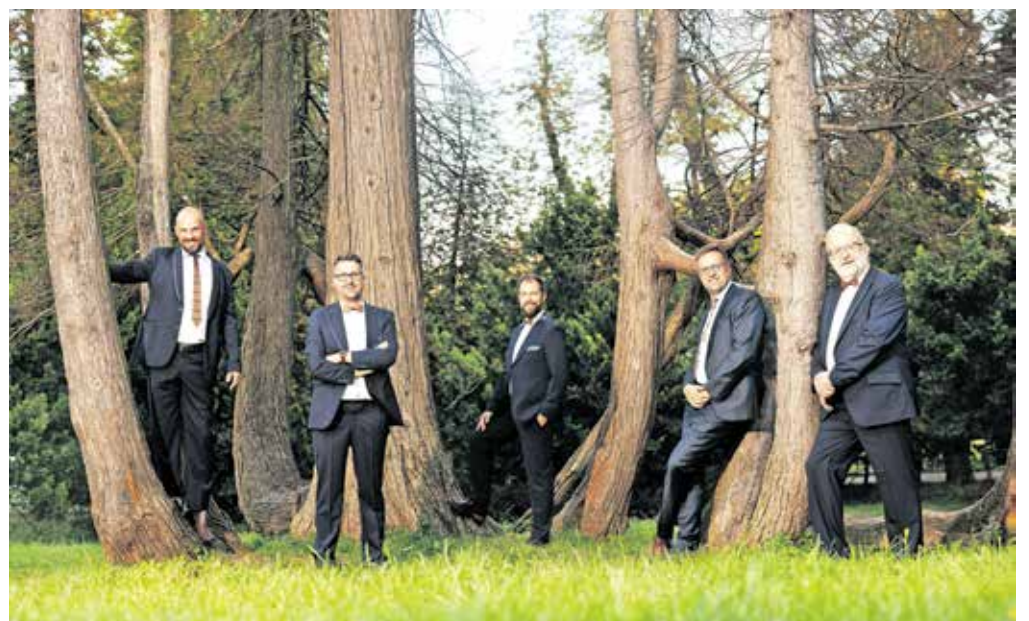
Kvintet Vintgar letos praznuje desetletnico delovanja. Krog publike si širi z repertoarjem različnih žanrov, od ljudskih, sakralnih do priredb modernih, gospel in narodnozabavnih skladb.