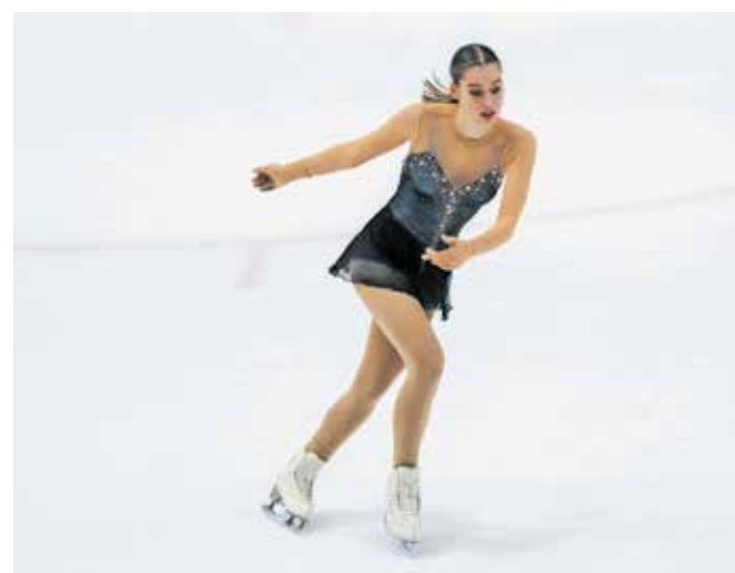
Drsalni klub Jesenice poleg nastopov na številnih tekmovanjih čakajo pomembni organizacijski zalogaji.

Veseli december na Jesenicah bodo pri klubu obogatili z veliko drsalno pravljico na ledeni ploskvi v dvorani Podmežakla. Svoje tekmovalne vrste želijo še pomladiti in razširiti. Od 15. oktobra naprej vsako soboto in nedeljo ob 15. uri na domači ledeni ploskvi prirejajo drsalni tečaj za otroke od četrtega do dvanajstega leta starosti. Cena je 30 evrov.