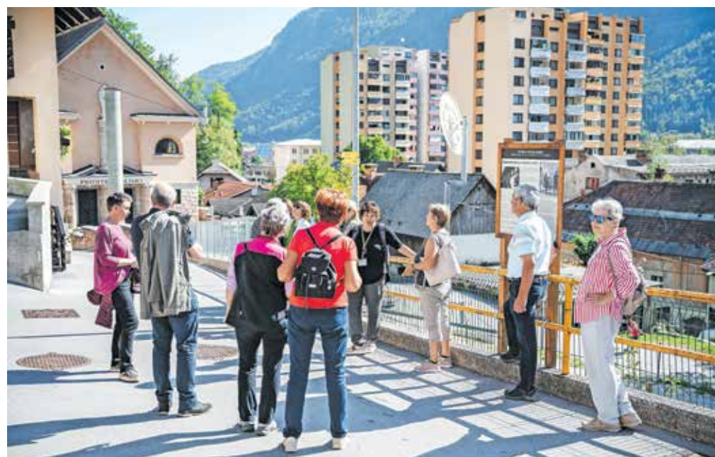
Ob svetovnem dnevu turizma so pripravili tudi strokovno vodenje po tematski poti Spomini starih Jesenic.

čine kot obiskovalce želijo popeljati v stare čase. Tako so v Hrenovci postavili šest informativnih tabel z zanimivimi informacijami in fotografijami o Hrenovci nekoč in danes ter izdali tudi razglednice. V projektu so moči združili Občina Jesenice, Razvojna agencija Zgornje Gorenjske, Gornjesavski muzej Jesenice in TIC Jesenice.