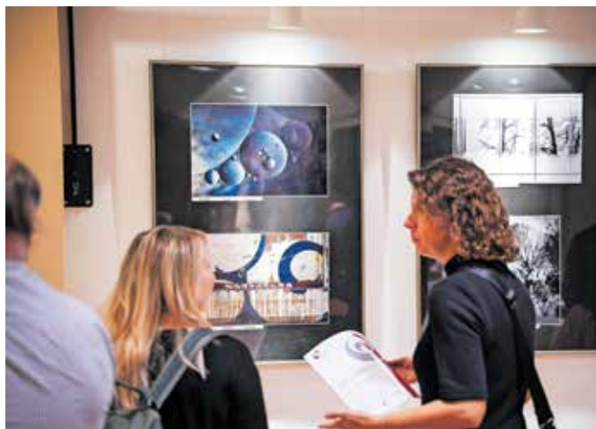
Fotografije so na ogled v Banketni dvorani Kolperna.