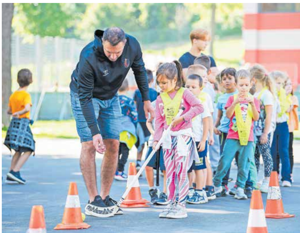
Na Mini olimpijadi je sodelovalo 738 otrok iz jeseniških vrtcev in prve triade osnovnih šol. Na 38 vadbenih postajah so spoznavali različne športne igre.