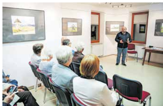
Z odprtja razstave

posvetil Vrbi, tamkajšnji krajini, spominskim znamenjem in kapelicam, pa tudi rojstni hiši Franceta Prešerna in Antona Vovka.