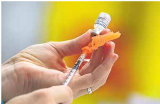
Cepljenje priporočajo zlasti starejšim osebam in kroničnim bolnikom.

Kot pravijo v ZD Jesenice, se bliža sezona gripe, ki pri starejših in kroničnih bolnikih poteka s težjo klinično sliko, pogostimi zapleti in višjo smrtnostjo kot pri mlajših osebah. Cepljenje proti gripi je smiselno tudi za druge osebe, saj tako zaščitimo sta-