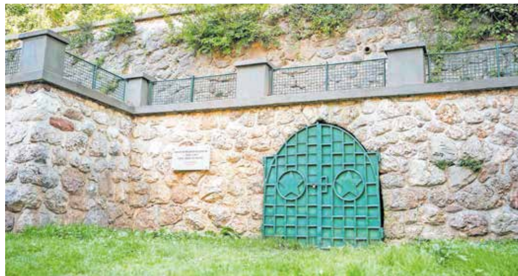
Vhod v zaklonišče v Kolarjevem parku. Ob vhodu je tudi spominska tabla žrtvam bombardiranja Jesenic 1. marca 1945.