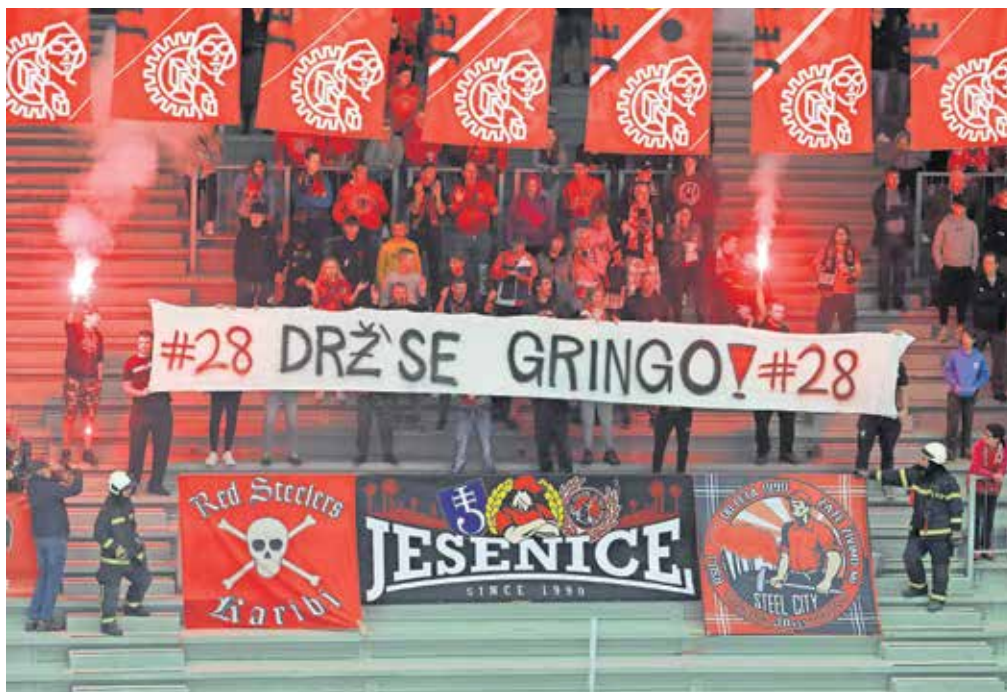
Srčni navijači so na tribuni dvorane Podmežakla razvili transparent z napisom Drž' se, Gringo! Zbralo se jih je kar tisoč.

na olimpijskih igrah, tokrat v Južni Koreji. Ob koncu svoje bogate kariere se je še enkrat vrnil bližje domu, tokrat je oblekel dres ljubljanske Olimpije, uradno pa je svoje zadnje tekme odigral v vrstah nemškega EV Lindau, tudi zaradi težav z zdravjem, ki so se po tiho že pretihotapile v njegov vsakdan.