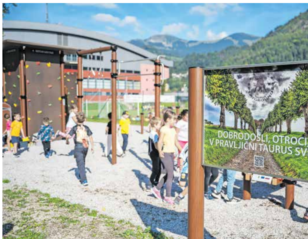
Ob tej priložnosti so odprli tudi novo otroško igrišče v Športnem parku Podmežakla, ki nosi ime Medgeneracijski živžav.