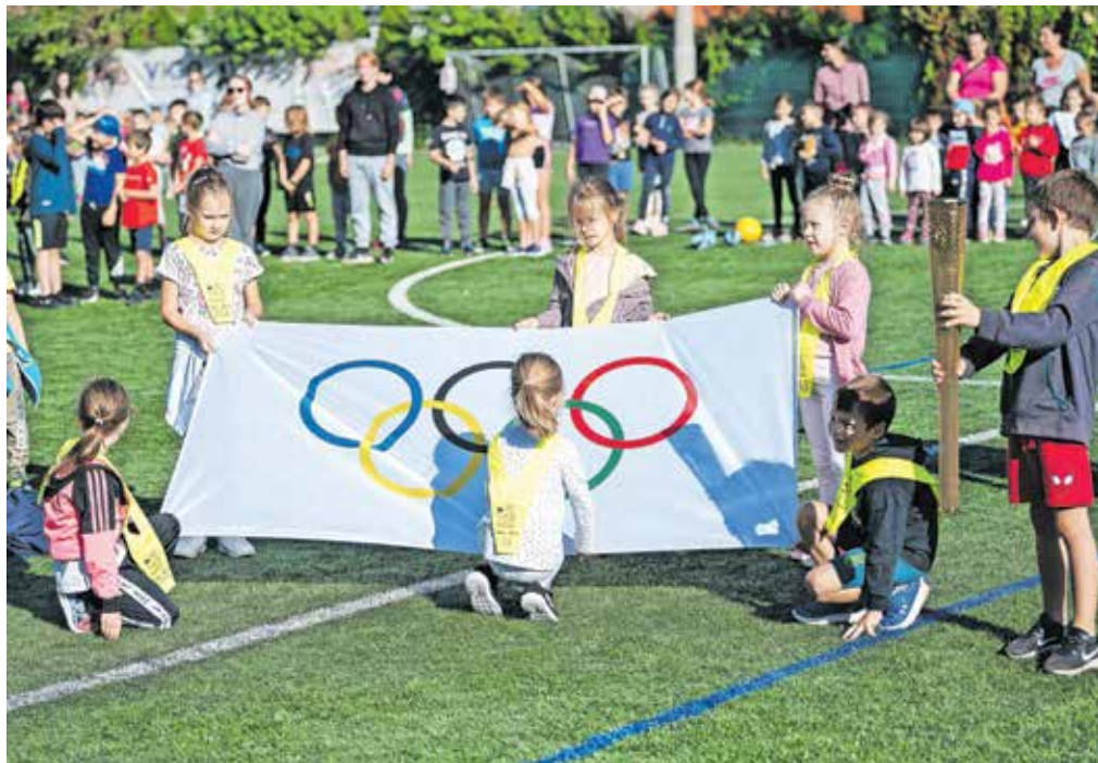
Priveditev v Športnem parku Podmežakla se je začela kot prave olimpijske igre: z olimpijsko himno ter mimohodom olimpijske zastave in bakle.

V Športnem parku Podmežakla je potekala Mini olimpijada za jeseniške otroke, na kateri je sodelovalo 738 otrok iz vrtca in prve triade osnovnih šol. Pri organizaciji so moči združili Zavod za šport Jesenice, Športna zveza Jesenice in regijska pisarna Olimpijskega komiteja Slovenije Jesenice. Pri izpeljavi olimpijade pa so sodelovali tudi dijaki predšolske vzgoje Srednje šole Jesenice ter domača športna društva: Curling klub Jesenice, Drsalni klub Jesenice, Hokejski klub SIJ Acroni mladi Jesenice in Nogometni klub Jesenice.