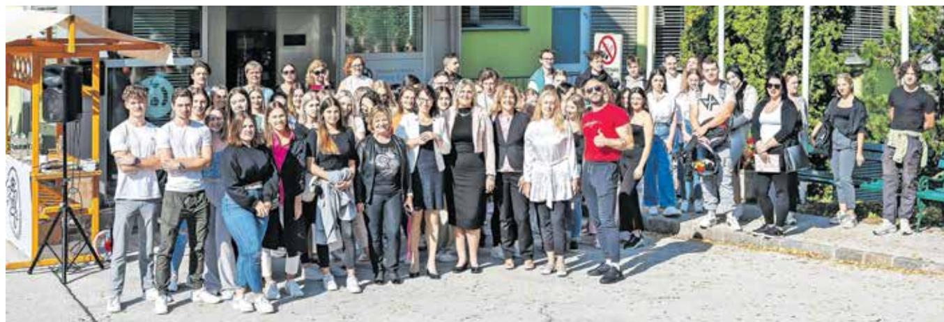
Prvi študijski dan za novo generacijo jeseniških študentov