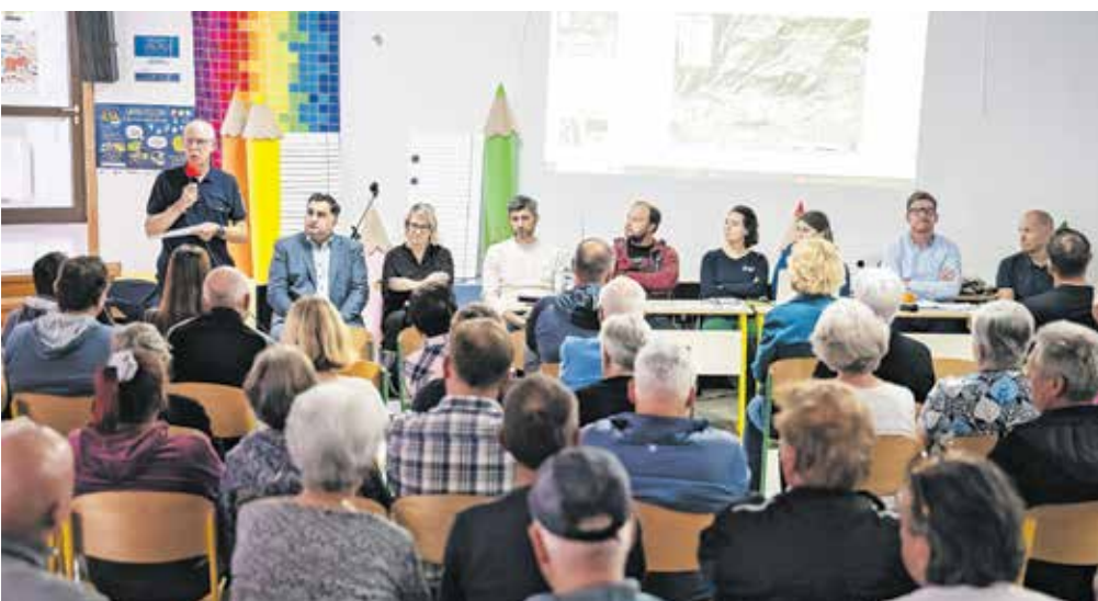
Strokovnjaki so krajanom predstavili trenutno stanje na plazovih nad vasjo in gradbeno-tehnične ukrepe, ki jih bodo izvedli za zagotovitev večje varnosti.