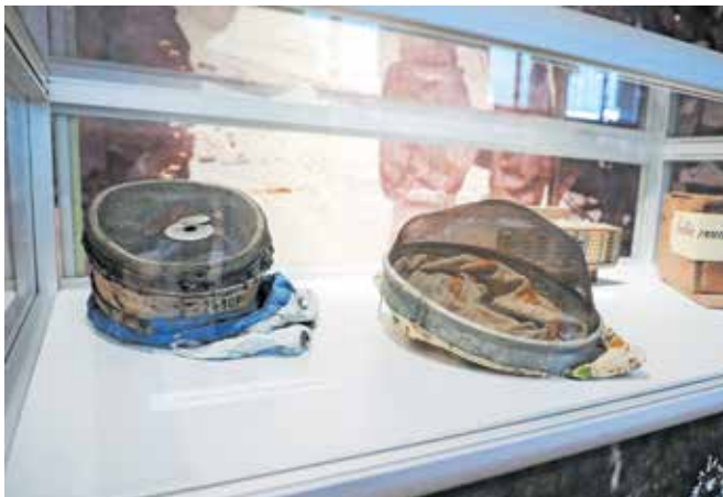
Približno sto let stari razstavljeni predmeti so prikazali, kako se je čebelarilo nekoč.