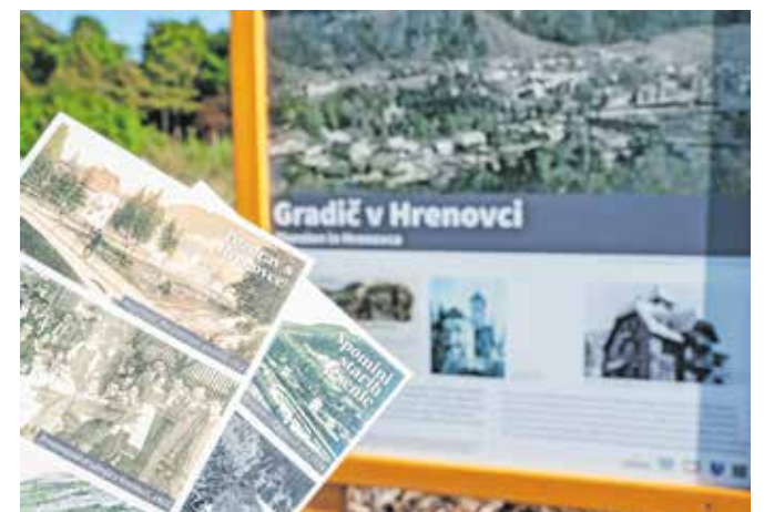
Poleg postavitve šestih informativnih tabel so izdali tudi razglednice.

zaključili krožno pot, ki se začne na Murovi, nadaljuje po nekdanji Gosposvetski cesti, tretji del pelje od Tancarjeve hiše do TVD Partizan, četrti pa po Hrenovci.