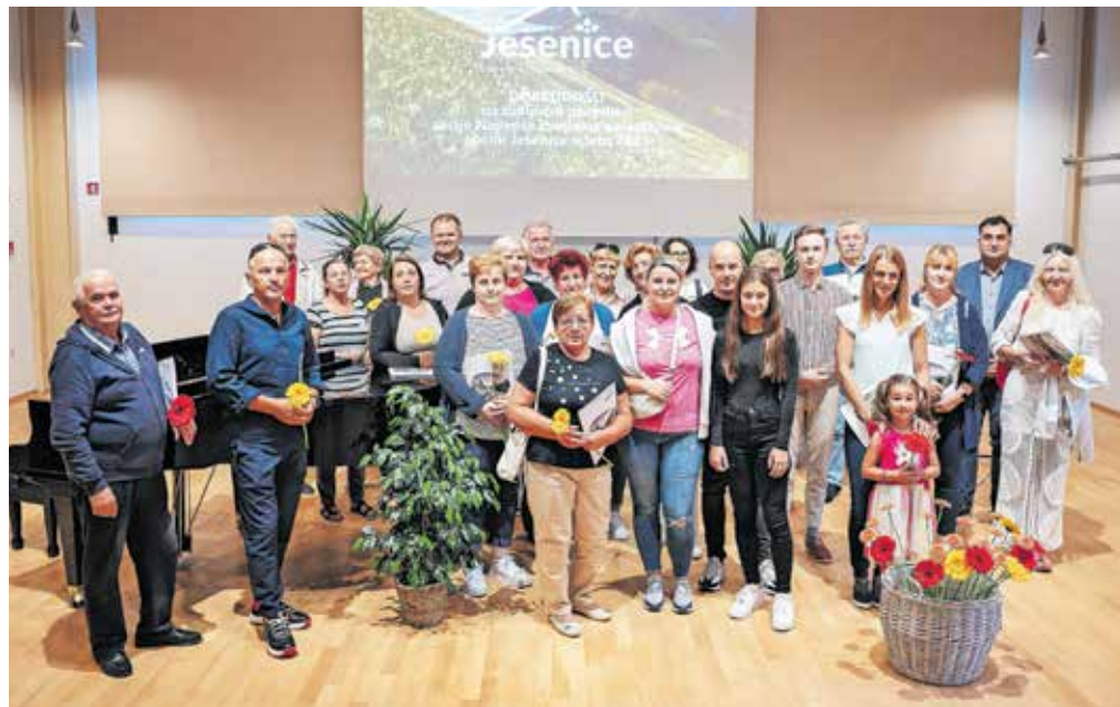
Prejemniki priznanj na podelitvi v Kolpernu

lepše urejene poslovne prostore pa so prejeli: Društvo upokojencev Jesenice, Restavracija Ejga Jesenice, Šiviljstvo Castello in Trgovina Štof.