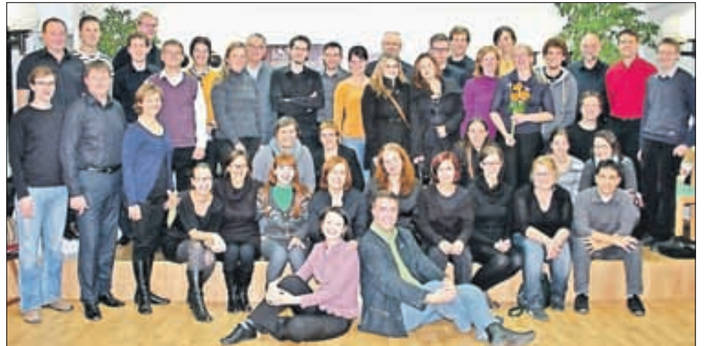
V pevsko dirigentski družini so se stakla prisrčna prijateljstva, ki bodo vodila k nadaljnjim sodelovanjem.