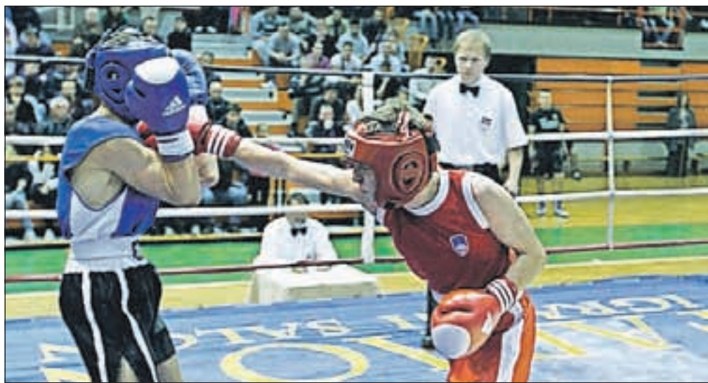
Gledalci so si v dvorani na Planini lahko ogledali zanimive boje.