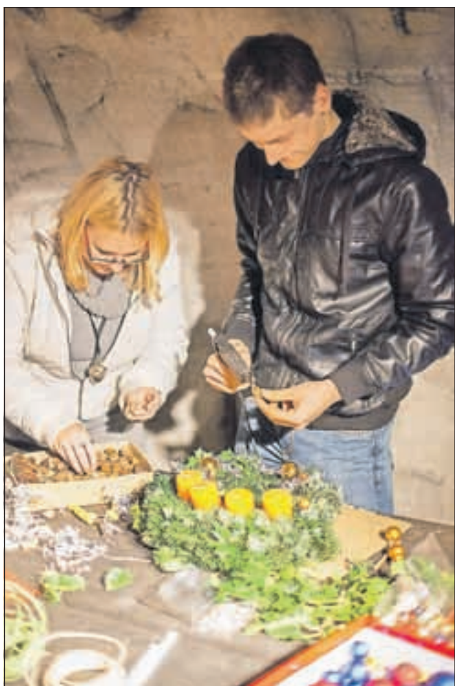
Svetovnemu mladinskemu prvaku v kolesarstvu Mateju Mohoriču tudi izdelava adventnega venčka ni povzročala večjih težav.

kolesarstvu Matej Mohorič. »Priznam, da sem tokrat prvič izdeloval adventni venček. Navdušen sem zlasti nad tem, da se iz preprostih in ne dragih stvari lahko izdelajo tako lepe venčke,« je povedal Matej Mohorič, ki sicer doma rad pomaga pri praznični okrasitvi. »Navadno je pri prazničnem okraševanju glavna mami, drugi pa pomagamo tako pri postavitvi smrekice kot jaslic,« je tudi povedal Matej, ki, kljub temu da trenutno ne tekmuje, veliko časa preživlja na kolesu. »Ravno sedaj največ treniramo, saj imamo bazične priprave,« je še dodal šampion iz Podblice.