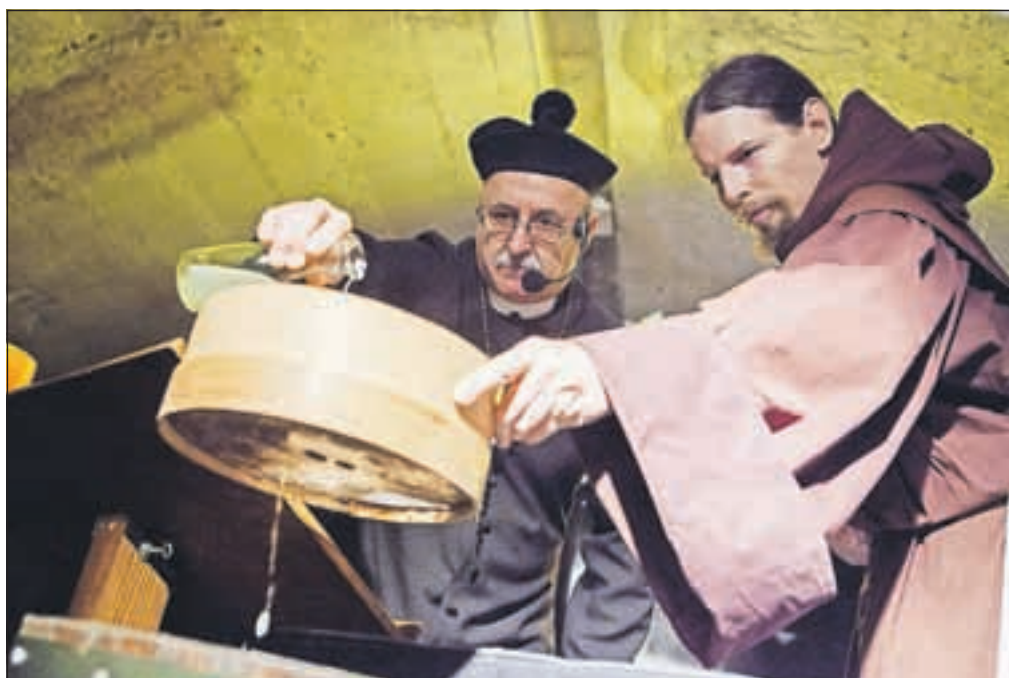
Člani DKD Vagart so poskrbeli, da so si obiskovalci lahko ogledali krst vina. Kako poteka, so prikazali za to najbolj pristojni: župnik, ministrant in dva vinogradnika. Letošnjo letino so zelo pohvalili.

Zavod za turizem Kranj je letos že peto leto zapored pripravil vinsko pot v rovih pod starim Kranjem. Kar tri dni so obiskovalci lahko pokušali vina razstavljalcev iz različnih slovenskih vinorodnih okolišev, prvič pa so se predstavili tudi italijanski vinarji. Del prireditve je potekal tudi v mestu, organizatorji pa so poskrbeli, da je bil spremljajoči program letos res zanimiv.