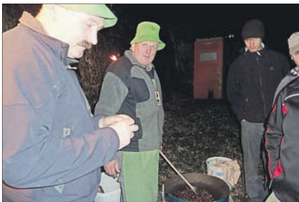
Na vinsko pot so prišli tudi Rokovnjači iz Besnice. Predstavili so različne marmelade, tudi tisto iz prašičjega mesa, ki ji po domače pravimo zaseka, seveda pa ni manjkal niti kostanj.