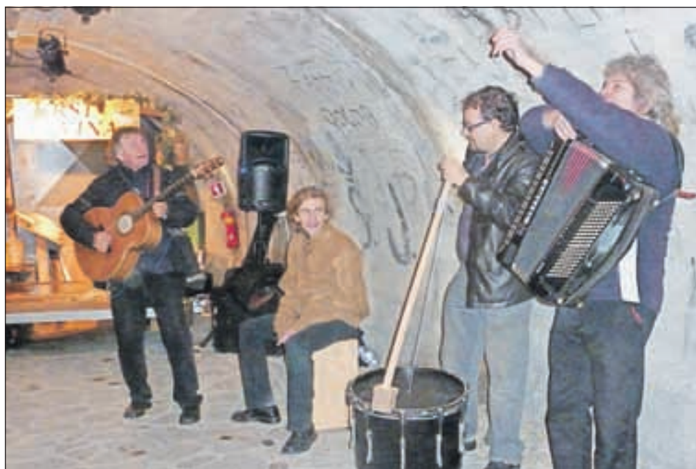
Na vinski poti je bilo poskrbljeno tudi za glasbo, saj smo veselim zvokom lahko prisluhnili v kanjonu Kokre, živahen glasbeni program pa je potekal tudi v mali dvorani, kjer je glasba še posebej lepo zvenela.