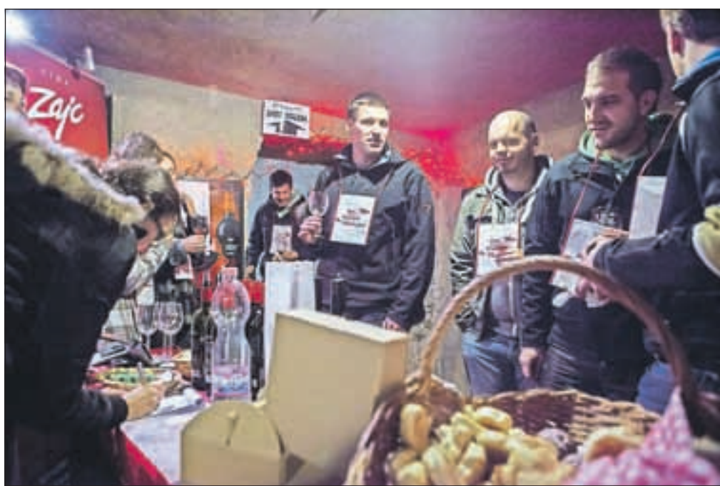
Vinska pot po rovih je bila zaradi velikega povpraševanja organizirana kar tri dni, skupaj pa se je na njej zbralo okoli tri tisoč obiskovalcev, ki so lahko pokušali vina kar štiriinpetdesetih različnih razstavljalcev.