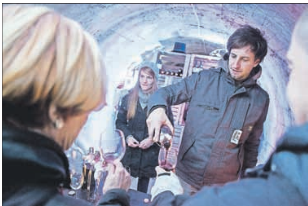
Obiskovalci so v rovih lahko spoznavali vina iz podravske, posavske in primorske regije, po zaslugi kmetije Zidarich iz Italije pa je bila udeležba vinarjev mednarodna. Vina je bilo moč pokušati, nekatera pa tudi kupiti.