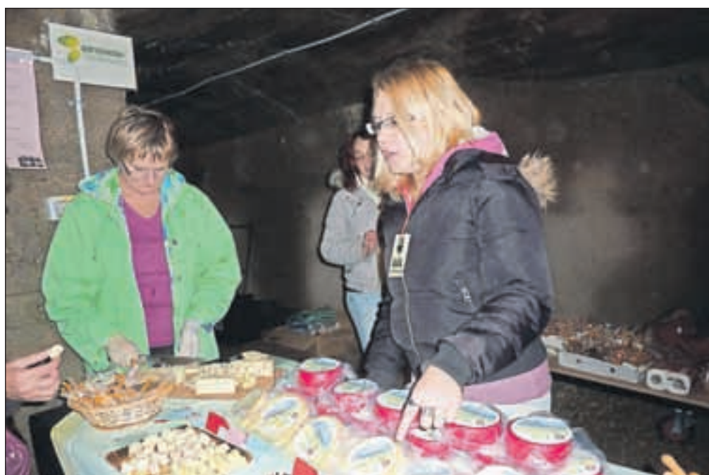
Ko pokušas vina, je prav, da tudi kaj poješ. Posebej prija sir, ki izostril okus. Da smo lahko okušali različne vrste sira, so poskrbeli pri Biotehniškem centru Naklo, kjer sire začinijo tudi s poprom in zelišči. / BESEDILO IN FOTO: VILMA STANOVNIK