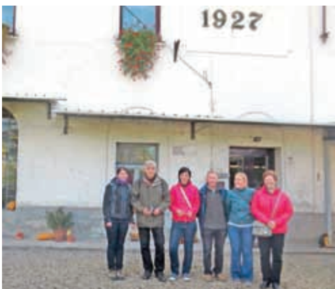
Lokalni turistični vodniki pred elektrarno na Bakovniku