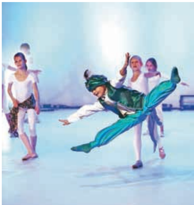
Plesalci Plesnega kluba Šinšin so v nedeljo, 20. decembra, v Domu kulture Kamnik pripravili že svojo deseto plesno produkcijo.

Plesni klub Šinšin je v nedeljo pripravil kar dve predstavi svoje zimske produkcije in obakrat napolnil dvorano Doma kulture Kamnik.