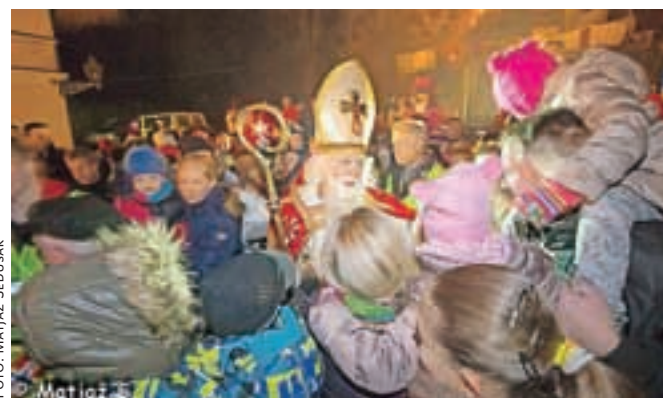
Miklavžev prihod je največ ljudi privabil v Kamnik.