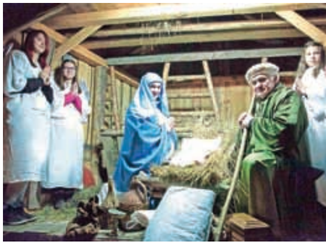
Božično vzdušje so v Tuhinjski dolini z živimi jaslicami, hlevčkom, svetimi tremi kralji, angelom in drugimi božičnimi elementi pričarali že v nedeljo.

Člani Turističnega društva Tuhinjska dolina so v nedeljo v Bizjakovih dolinah v Snoviku znova – že desetič – pripravili žive jaslice in tako številnim obiskovalcem že pričarali božično vzdušje.