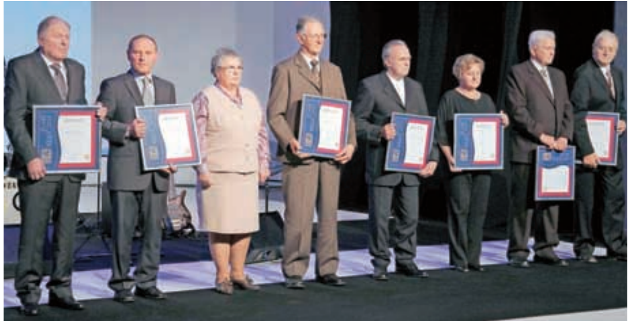
Prejemniki zlatih ključev OZS