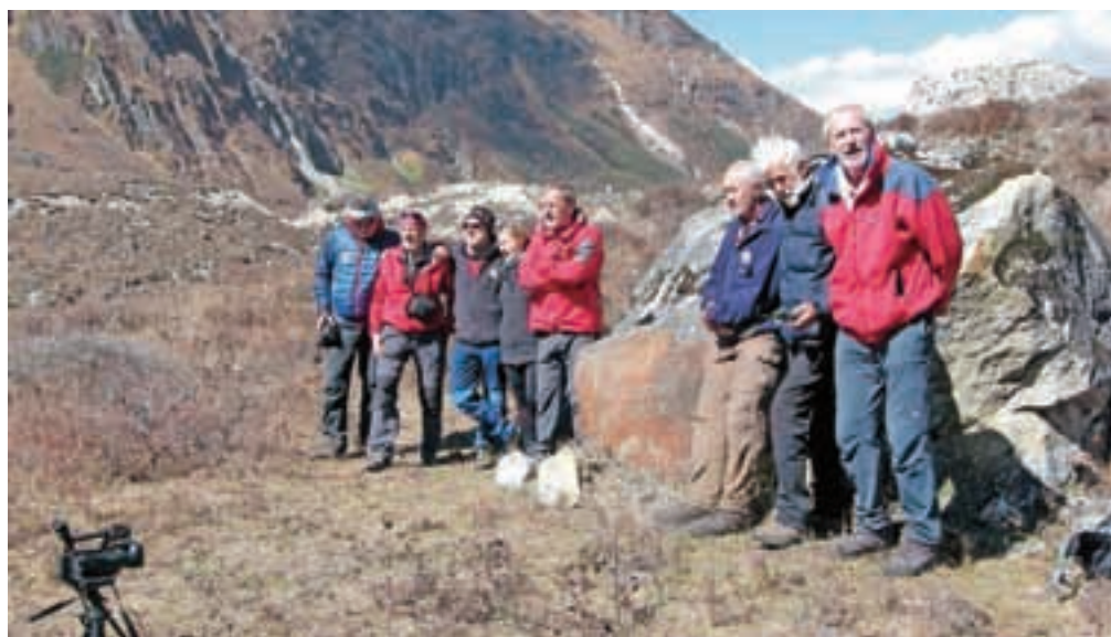
Ob spomeniku pokojnima Anteju Bučanu in Nejcu Zaplotniku

Naslednji dan smo šli že pred 6. uro na rob leve morene in nato po njej malo nad jezerom Dona skoraj tri