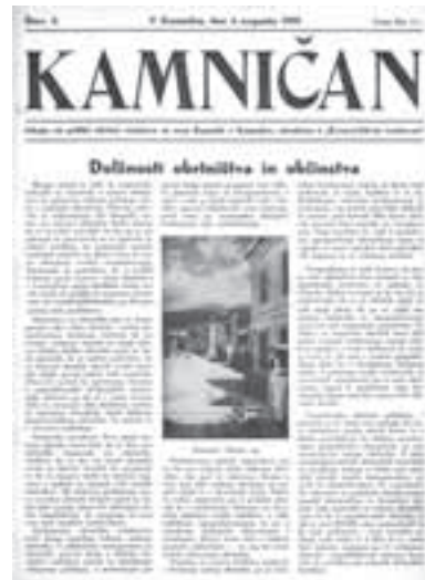
Naslovna stran časopisa Kamničan iz leta 1935

Zgodovina Območne obrtno-podjetniške zbornice (OOZ) Kamnik je zgodovina štirih organizacij: Združenje samostojnih obrtnikov Kamnik (1975–1979), Obrtno združenje Kamnik (1979–1991), Območna obrtna zbornica Kamnik (1991–2007) in Območna obrtno-podjetniška zbornica Kamnik (od decembra 2007 dalje). A zagotovo ne gre zanemariti tudi aktivnosti združevanja obrtnikov v Kamniku v letih 1920–1975. Po letu 1935 v arhivskih gradivih nismo uspeli najti dodatnih informacij o kamniškem obrtnem društvu, kar je nekako logično, saj se je le nekaj let kasneje začela druga svetovna vojna, v času katere ni bila prioriteta zagovarjanje obrtniških zahtev, temveč boj za golo preživetje, zato je po vsej verjetnosti društvo v tem obdobju prenehalo delovati. Takoj po koncu druge svetovne vojne so se začele aktivnosti za ustanovitev Okrajnega združenja obrtnikov Kamnik, ki je pokrival področje Kamnika in Domžal.