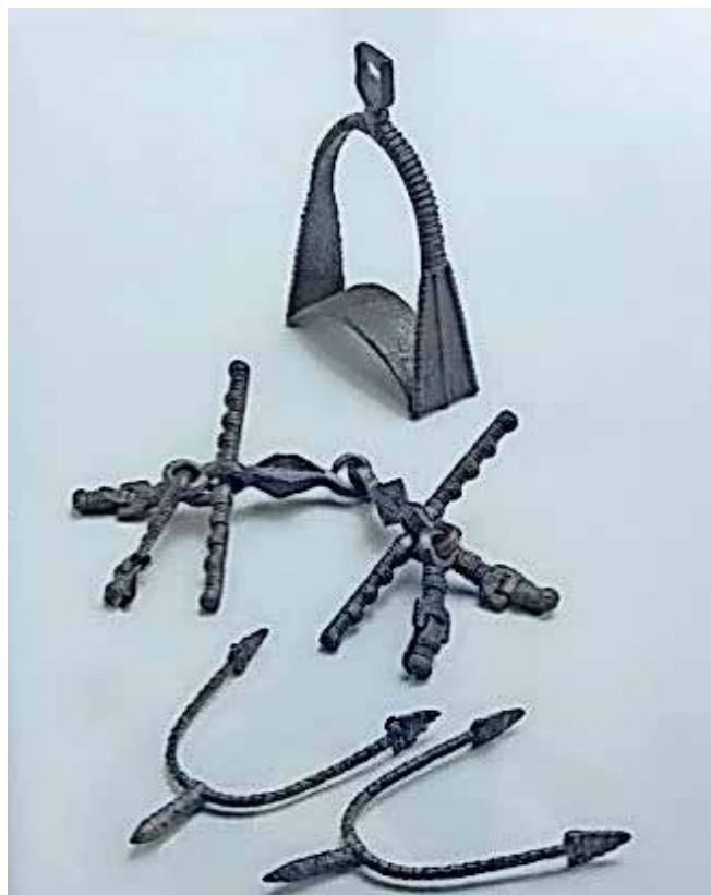
Konjeniška oprava z Gradišča nad Bašljem iz zgodnje slovanske dobe/ Foto: T. Lauko (hrani NMS)

Utrdba je bila sredi 12. stoletja, ko se Gradišče prvič omenja v stari listini, zagotovo že v razvalinah, a številna ognjišča in živalski ostanki potrjujejo zadrževanje človeka na gori tudi še dolgo po tem obdobju. Opustošenje postojanke se je zgodilo verjetno s strani Frankov po zatrtju slovanskega upora okoli leta 820, toda naselbina bi bila lahko požgana še v prvi polovici 10. stoletja med madžarskimi plenilnimi vpadi v bogato Furlanijo. Gradišče nad Bašljem velja z najdbami iz treh arheoloških dob v razponu skoraj treh tisočletij za pomembno najdišče v proučevanju starejše poselitvene zgodovine slovenskega prostora. Zaradi izjemnih najdb in kot izstopajoče najdišče zgodneslovanske dobe pri nas je uvrščeno med spomenike državnega pomena in kot širša dediščina Karla Velikega v pot Francia Media Heritage