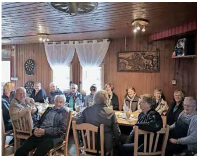
V Bašlju so se po dveh dolgih letih ponovno srečali osemdesetletniki.

skim vozičkom odpelje kar sama.« Povedo pa še, da kljub naglušnosti še vedno sodeluje tudi v domskem Žoga bendu, rada pa se udeleži tudi molitvene ure, svete maše, raznih prireditev in pristočasnih aktivnosti.