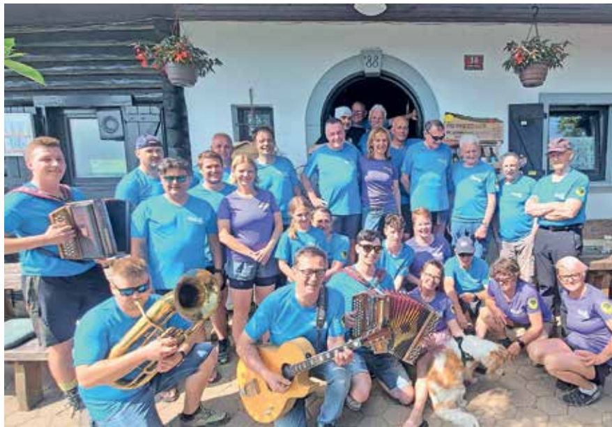
Brez gasilske fotografije ob zaključku seveda ni šlo.