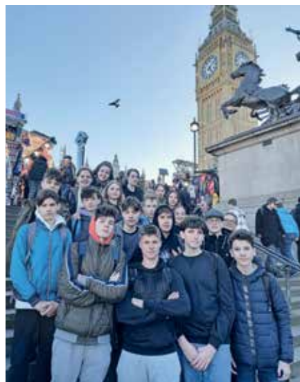
Pred Big Benom

Petkovo jutro se je začelo že zelo zgodaj z obiskom konjeniške straže in