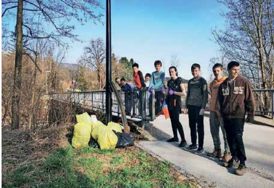
Čistilna akcija na Bregu

Osnovna šola Matije Valjavca Preddvor je tudi letos z množično in aktivno udeležbo vseh razredov in podružnic sodelovala na čistilnih akcijah občin Preddvor in Jezersko. Potem ko sta bili za konec tedna napovedani akciji zaradi neugodnega vremena dvakrat prestavljeni, smo se čiščenja lotili med tednom popoldne, na Jezerskem v torek, po na-