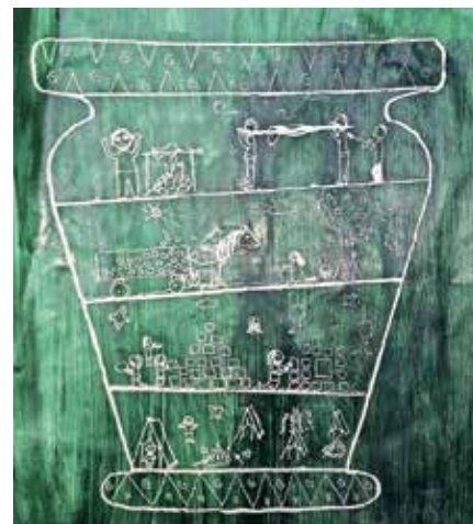
Situla, Sara Arh, 5. b

Nekoč je bil en pralni stroj. To ni bil navaden pralni stroj. Bil je drugačen od ostalih. Bil je zelo požrešen in tudi izbirčen. Ko si vanj dal oblačila, jih je razgrizel in pojedel. Ko pa je v kopalnici zmanjkalo oblačil, je šel po celi hiši in pogledal v vse omare ter pojedel vsa oblačila, ki so bila v omarah. Ko pa je res zmanjkalo vseh oblačil v celi hiši,