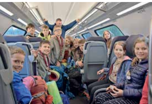
Na vlaku

S pomladjo smo se v ustaljene tire po koronskih časih vrnili tudi skavti. V preteklih tednih smo se udeležili številnih akcij, tekmovanj in dogodkov. V aprilu smo bili del čistilne akcije v občini Preddvor. Organizirali smo srečanje dveh sosednjih čet, na katerem so izvidnice in vodniki postavili naše nove šotore. Te smo čakali kar dobro leto. Na srečanjih smo redno utrjevali znanje iz veščin, saj mora vsak skavt pred obljubo opraviti prav poseben izpit. V začetku maja pa smo po dolgem času ponovno imeli obljube za cel steg. Naši člani so se z vlakom odpeljali do Radovljice, kjer so ob tematiki potovanja v veselje preživeli cel konec tedna. Na koncu so novinci dali slovesno obljubo in dobili svojo skavtsko rutko. Teh je kar 23. Za konec naj omenimo še, da so se v sredini maja naše klanovke udeležile skavtskega kuharskega tekmovanja na državni ravni in zmagale. Poleg sladice so pripravile posebno enolončnico s klobaso, zdrobovimi žličniki z divjimi zelišči, čičeriko in še neko skrivno sestavino. Da so vse obroke pripravile na skavtski način, torej sredi narave, nam seveda ni treba posebej poudariti. Do konca leta nas čaka še nekaj srečanj, vsi pa že nestrpno pričakujemo poletje in s tem poletne taborne.