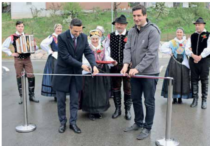
Cesto so slavnostno odprli pred dobrim mesecem dni.

Župan je bil vesel, da so se kljub dežju odprtja občani udeležili v tolikšnem številu. Zahvalil se je vsem sodelujočim deležnikom ter spregovoril tudi o varnostnem vidiku ceste. Ker so odprtje ceste tokrat pripravili na uvozu v