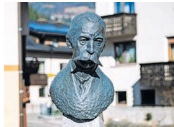
Doprski kip dr. Franca Kosa v spominskem parku v Selcih