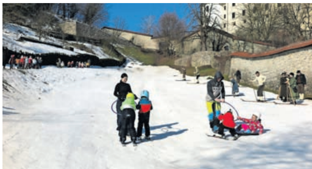
Na snegu pod Loškim gradom je bilo januarja in v začetku februarja ves čas živahno.

Najmlajši, stari komaj tri leta, sicer niso smučali, so si pa z zanimanjem ogledali smučarje s starodobno opremo. »Zelo nam je všeč, tudi mi radi smučamo in se veseljem opazovali smučarske zavoje in se veselili zimskih radosti.