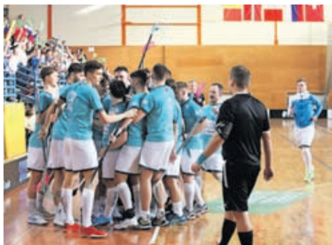
Slovenci so slavili skupaj s številnimi navijači.