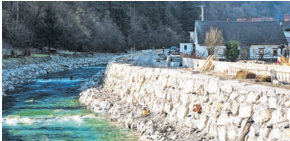
Gradnja obvoznice v Železniki, ki bo umeščena na obrežni zid Selške Sore

bo objavljen predvidoma še letos, gradnjo pa načrtujemo v letu 2025. Predvidena je ureditev površin za pešce ob vozišču, sanacija državne ceste, ureditev odvodnjavanja in avtomatskega postajališča,« so pojasnili na DRSI. Glede rekonstrukcije državne ceste skozi vas Sorica so razložili le, da je občina pridobila projektno dokumentacijo za izvedbo gradnje (PZI), da so z njo tudi podpisali sporazum o sofinanciranju in da so pridobljena dokazila o razpolaganju z zemljišči. Pred leti je bilo govora tudi o obnovi državne ceste od Rotka proti Soriški planini, a na DRSI pravijo, da za rekonstrukcijo tega odseka ni odprte investicije. Navedli pa so, da naj bi se še ta mesec začela sanacija usoda in ceste Sorica–Petrovo Brdo v dolžini 40 metrov. V občini Železniki težko čakajo tudi na rekonstrukcijo državne ceste v Selško dolino na dobre tri kilometre dolgem odseku Podlubnik–Praprotno, ki sicer sodi v škofjeloško občino. »V teku je priprava razpisne dokumentacije. Začetek gradbenih del je predviden še letos, zaključek pa v letu 2026,« so pojasnili na DRSI.