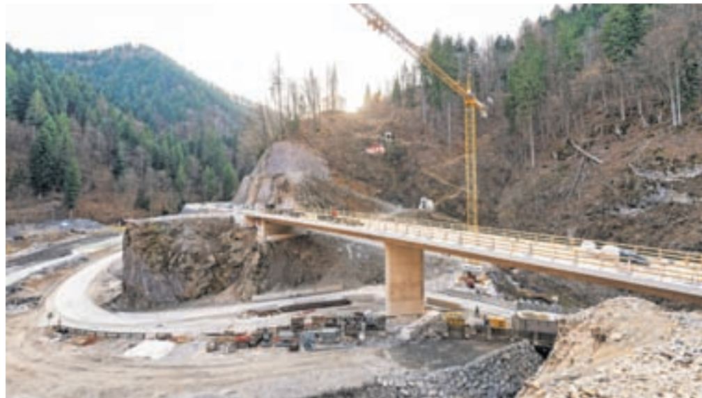
Na lokaciji pod Sušo v bližini Zalega Loga urejajo območje zadrževalnika, ki bo lahko zadržal milijon kubičnih metrov vode.