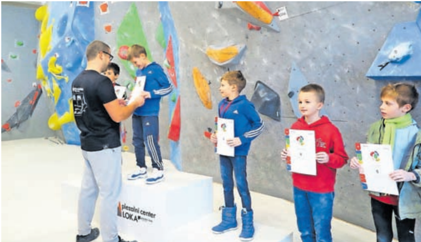
Najboljši mladi plezalci v balvanskem plezanju so se v Škofji Loki razveselili kolajn in priznanj.

tru, sklenili, da pripravimo balvansko tekmo. Na njej je kar precej gneče, saj nas je presenetilo, da se je prijavilo kar tristo devdeset tekmovalk in tekmovalcev. Na žalost smo morali tekmi kadetinj in kadetinj zato odpovedati, saj spored poteka oba dneva od jutra do večera in se nam časovno ne bi izšlo. To bo v nadaljevanju sezone gotovo postal tudi problem drugih organizatorjev,« je povedal predsednik