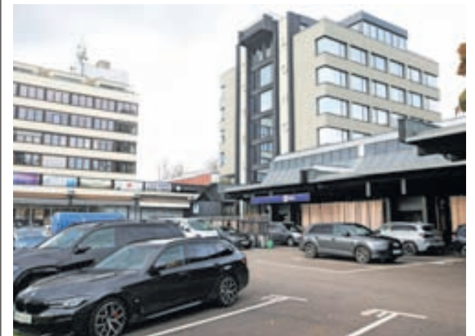
Za goste je pred hotelom Lonca urejeno tudi parkirišče.

iz Danske, Belgije in Švice. »Hotel je za tovrstne dogodke ustrezna izbira, tako zaradi lokacije same, ki nudi dodatne možnosti športnega udejstvovanja na Škofjeloškem, kot tudi zaradi individualiziranih ponudb glede na posamezno skupino gostov,« se dobrega obiska in tega, da dobivajo pozitivne odzive od gostov, veselijo v Lonci. Kot so nam povedali, so imeli v hotelu od odprtja dalje večkrat bistveno večje povpraševanje, kot imajo možnosti ponudbe nočitev. Dolej so v hotelu bivali gosti iz Španije, Francije, Grčije, Nemčije, Italije, Nizozemske in celo Kanade in drugih držav ameriške celine, so nam povedali in dodali, da je ena izmed novosti, ki so jo uvedli v hotelu, t. i. brunch, ki je v Lonci, kot pravijo, prvi oziroma edini v ponudbi na Škofjeloškem.