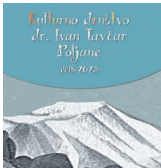
Naslovnica zbornika, ki je nastal ob 75-letnici delovanja Kulturnega društva dr. Ivan Tavčar Poljane.