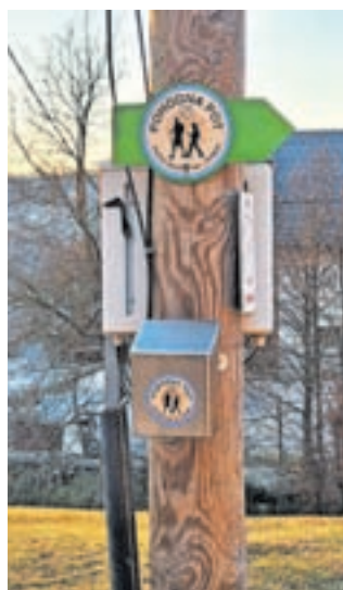
Kontrolni žig v Leskovici

Leskovica, Lučine – Skrbniki občinskega pohodnega in kolesarskega kroga so sporočili, da je prišlo do sprememb pri lokacijah kontrolnega žiga občinskega pohodnega kroga v Ogradah in kontrolne točke kolesarskega kroga v Lučinah. Kontrolni žig občinskega pohodnega kroga KT7 je iz Ograd prestavljen v Leskovicu na leseni električni drog ob cerkvi svetega Urha. Kontrolno točko občinskega kolesarskega kroga KT3 pa so z Okrepčevalnice Matija prestavili na Kulturni dom Lučine.