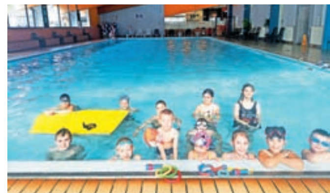
Počitniške Čofotalnice v plavalnem bazenu

Sredi marca JZR uvaja še eno novost: Klepetalnice-ustvarjalnice za starejše. Prostore lokala v Športni dvorani Železniki bodo vsak četrtek dopoldne odprli za starejše prebivalce občine Železniki; prvič 14. marca. Ob 8. uri jih vabijo v kavarno, kjer bodo lahko poklepetali, odigrali družabno igro ter negovali in širili socialno