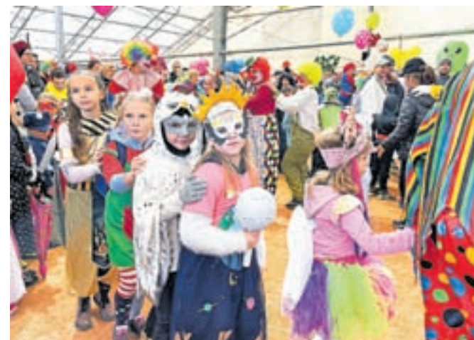
Pustno rajanje v središču Žirov