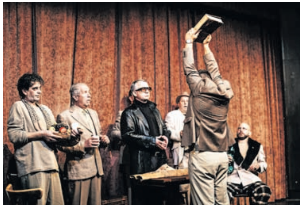
Predanost odlične ekipe Loškega odra igri se odraža skozi vso predstavo.

»Vsebinsko je projekt zasnovan na Tavčarjevi Visoški kroniki, natančneje na poglavju 'Krvava rihta' (sojenje Agati). Situacija je postavljena na večer pred sodbo. Vsi liki so povzeti po Tavčarju, vendar so postavljeni v novo situacijo. Skozi novonastali