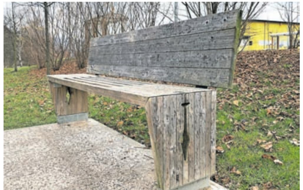
V okviru projekta Lesni feniks je iz odsluženega lesa nastala urbana oprema.

Razpis za dobre prakse trajnostnega urbanega razvoja Mesta >> mestom je potekal med oktobrom in decembrom lani. S pozivom so iskali inovativne prakse in nove rešitve, s katerimi občine, javna podjetja in regionalne razvojne agencije rešujejo izzive v svojem lokalnem okolju in poudarjajo aktualne tematike, ki so relevantne tudi za druge slovenske občine. Ocenjevalna skupina, ki so jo sestavljali