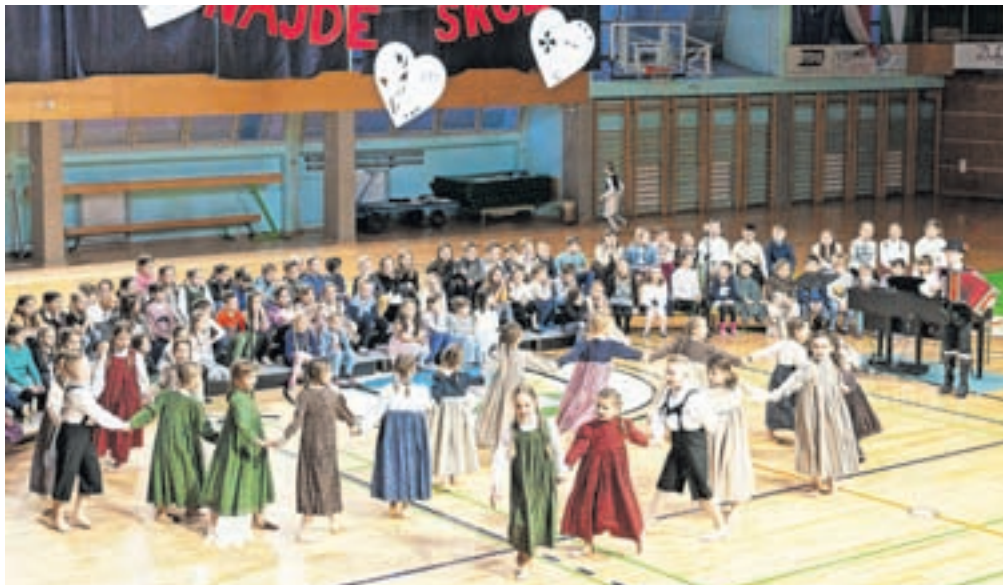
V množici nastopajočih otrok so bili tudi mladi folklorniki.