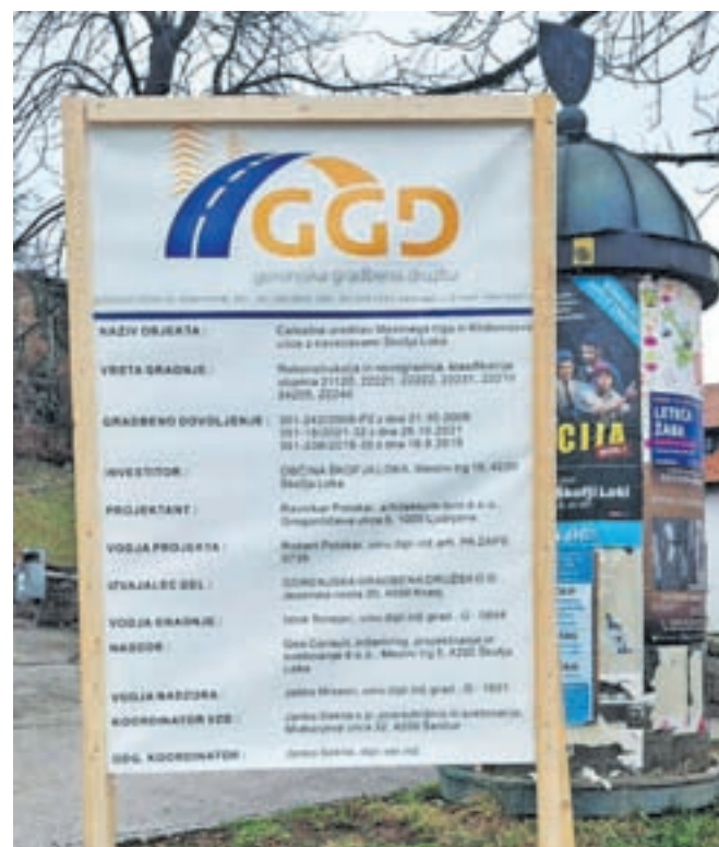
Prenova Mestnega trga bo predvidoma trajala poldrugo leto.

Škofja Loka – Ena od letošnjih prednostnih nalog Občine Škofja Loka je poleg odprave posledic poplav začetek težko pričakovane obnove Mestnega trga. Na tem območju bo, kot piše na spletni strani občine, urejena tudi celotna podzemna infrastruktura: meteorna in fekalna kanalizacija, vodovod, kabelska kanalizacija in strelodovi, javna razsvetljava in plinovod. V posamezni stavbi bo treba zagotoviti priključke oziroma povezavo z obstoječimi internimi napeljavami. »Ker gre pri tem lahko tudi za poseg v skupne dele in naprave, predlagamo skupni sestanek na vsakem od naslovov za razjasnitev vseh vprašanj glede izvedbe hišnih priključkov. S predstavniki izvajalcev bomo v vsaki stavbi individualno predstavili okvirni potek in