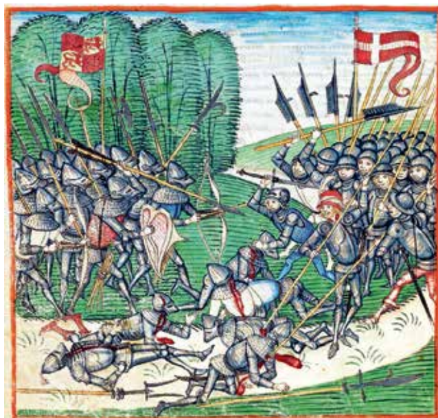
Lokostrelci sodelujejo v vojnem spopadu; Diebold Schilling: Kronika mesta Bern, 1478–1483, hrani Burgerbibliothek, Bern

V srednjem veku so bili loki na Loškem glede na samostrele v povsem podrejenem položaju. Pisni viri jih praktično ne omenjajo.