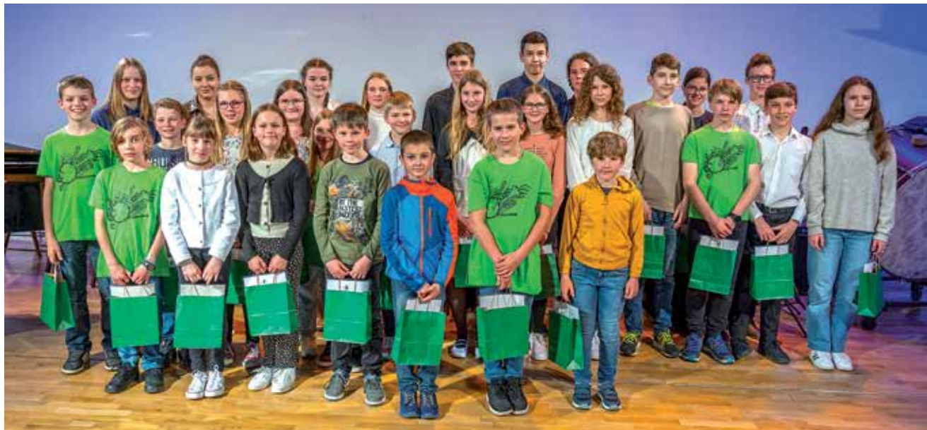
Podelitev priznanj najuspešnejšim učencem Glasbene šole Škofja Loka na letnem koncertu maja v Sokolskem domu