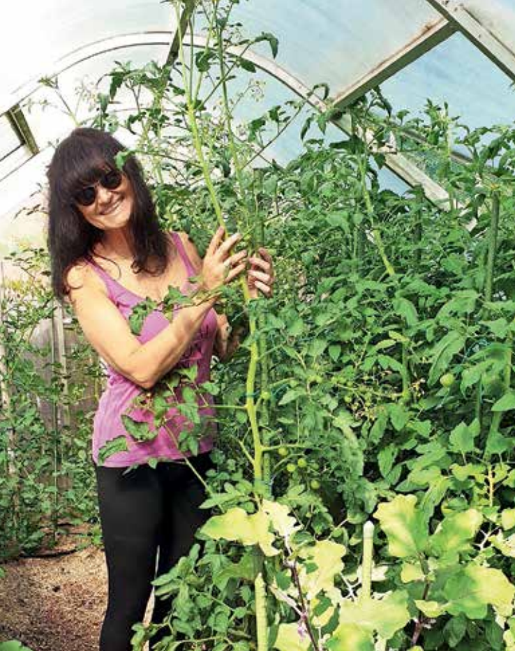
V rastlinjaku jima uspevajo paradižnik, paprika in jajčevci, vse leto pa tudi solata.

veselita. Prav tako obožujemo bučke, ki jih pripravljamo na 'sto načinov'.« Vse to dopolnita še z zelenjavo v velikih loncih, v katerih imata celo limono in borovnice. Prav tako sta si pred hišo uredila zeliščni kotic, vsak možni prostor na vrtu pa izkoristila še za sadna drevesa – dve češnji, jablo, hruško, kivije, maline, borovnice, breskev, slivo ter celo asimino in kaki.