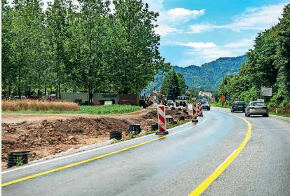
Dela v Lipici potekajo nemoteno, promet poteka po sicer zoženi cesti, a zaenkrat tekoče

V Lipici se že resno gradita predvsem kanalizacija in kolesarska navezava, za zdaj promet poteka po zo-