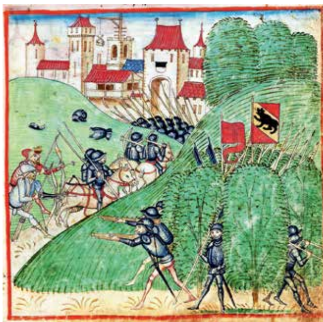
Prikaz vojnega pohoda, kjer so poleg samostrelcev in enot z ognjenim orožjem prisotni tudi lokostrelci; Diebold Schilling: Kronika mesta Bern, 1478–1483, hrani Burgerbibliothek, Bern

ga je izpodrinil dolgi lok. Dolgi lok je ime za klasične angleške in valižanske preproste vojaške loke. Razvil se je iz navadnega kratkega loka. Izdelan je bil iz enega samega kosa lesa, navadno iz tisovine, redkeje iz hrasta. Lok je bil visok približno toliko kot strelec. Skrajni domet dolgega loka je znašal od 250 do 275 metrov. Puščice so bile smrtonosne še na razdalji 90 metrov. Dolgi lok odlikujeta predvsem nizka cena izdelave ter preprostost in hitrost streljanja. Izurjen lokostrellec je lahko izstrelil 6 namerjenih puščic v minuti ali 12 z manjšo natančnostjo. Dolge loke so do pojava in uveljavitve strelnega orožja uporabljali v številnih evropskih deželah, čeprav je bil na celini dosti bolj priljubljen samostrel.