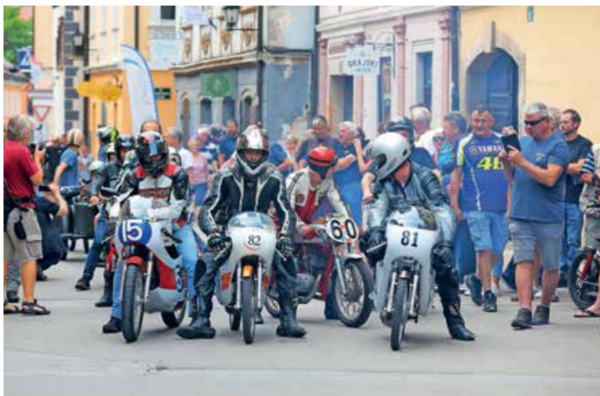
Pet desetletij po zadnji loški dirki in ob 1050-letnici Škofje Loke so se v mestu spet zbrali motoristi in njihovi občudovalci.