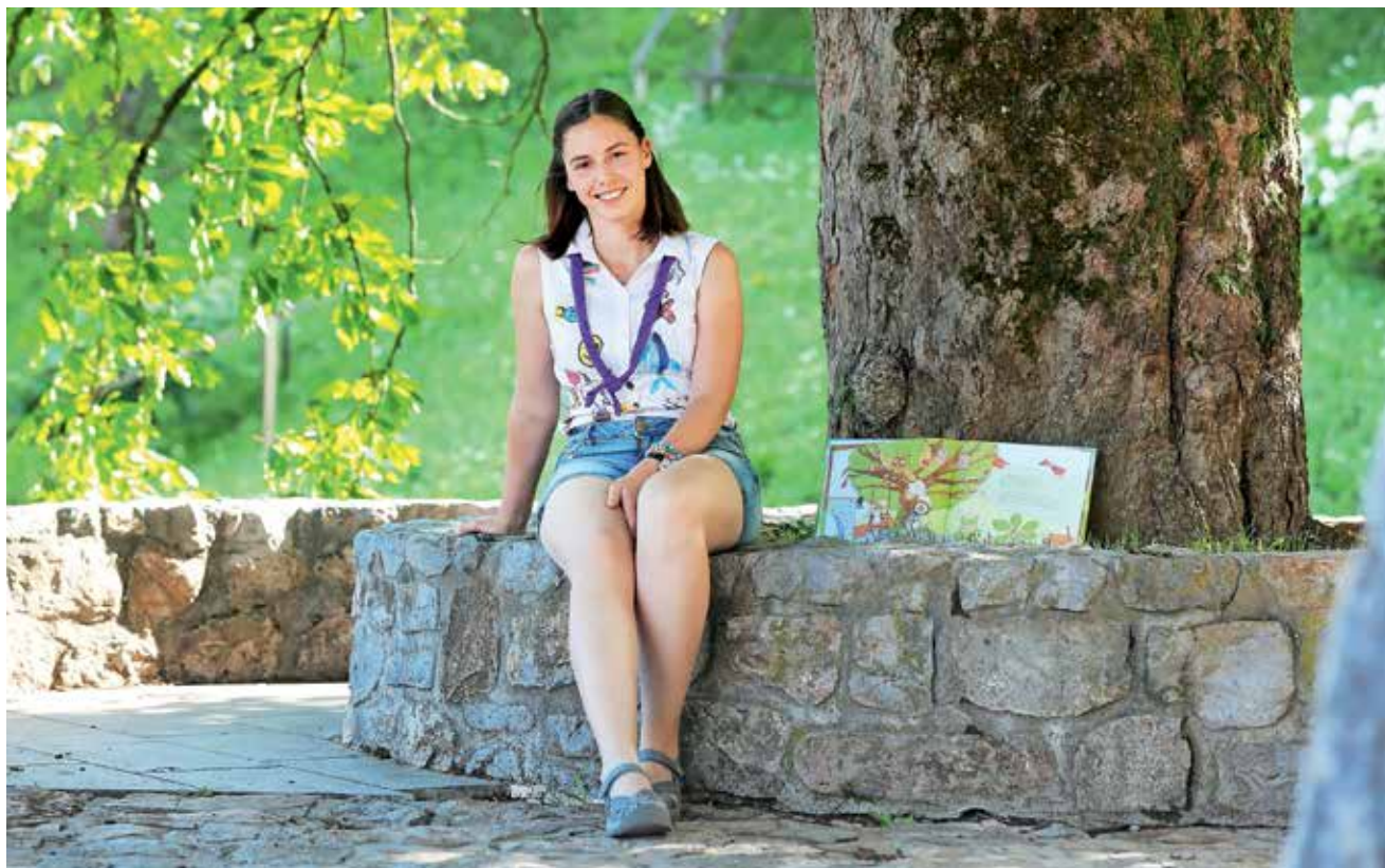
Na podlagi njene pravljice Miška Rubi in zlati list so letos osnovali tudi novo tematsko pot po mestnem jedru.

Prednost digitalizacije je, da je danes vse dostopno na spletu, saj kot umetnik ne moreš napredovati, če se zraven ne učiš. Ustvarjanje je tudi večšina, ni ti kar položeno v zibelko. Talent ti sicer do neke mere pomaga, da na začetku hitreje napreduješ, potem pa je vse odvisno samo še od tega, koliko časa si pripravljen