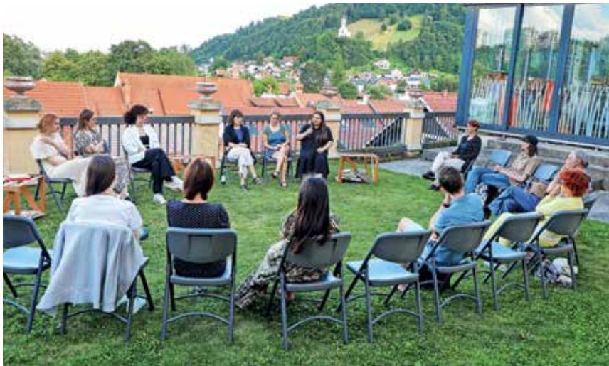
Minuli torek so v sklopu Bralnice mladi avtorji predstavili zbirko kratkih pripovedi Polževi razmisleki.