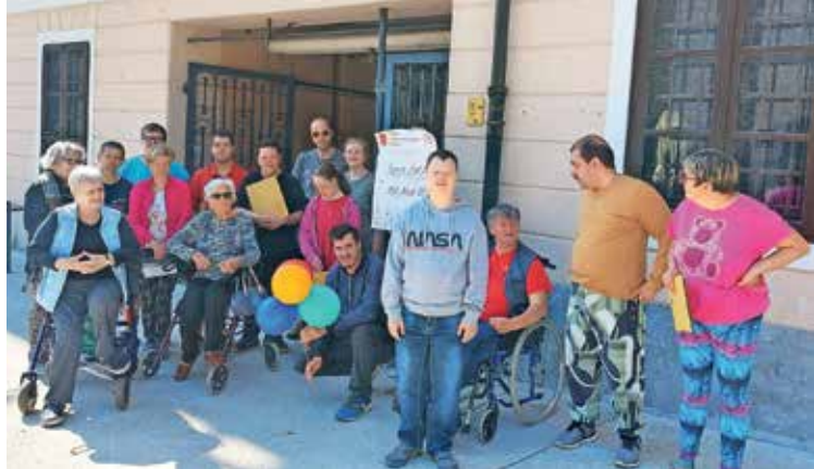
Utrinek s turističnega vodenja po mestnem jedru Škofje Loke, ki ga je pripravila škofjeloška enota VDC Kranj.

V okviru TVU so 24. maja pripravili tudi osrednji promocijski dogodek, Parado učenja – dan učečih se skupnosti, ko so se v starem mestnem jedru Škofje Loke