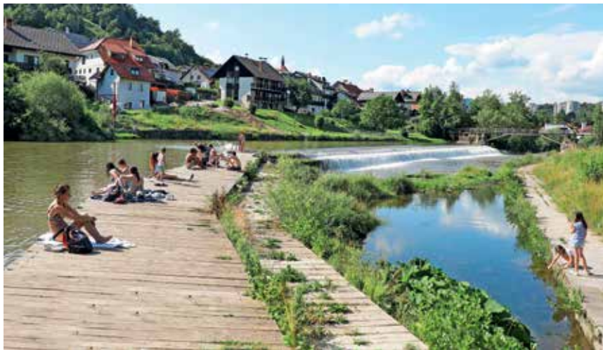
Tudi Poljanska Sora na kopališču v Puštalu je primerna za kopanje.

Strokovno analizo vzorcev kopalnih voda je Nacionalni laboratorij za zdravje, okolje in hrano, oddelek za mikrobiološke analize živil, vod in drugih vzorcev okolja Kranj opravil na treh lokacijah: na Selški Sori v Podlubniku ter na Poljanski Sori na Visokem in kopališču Puštal. Kot so pojasnili na občini, so bili rezultati vzorčenja na vseh lokacijah ustrezni. »Selška Sora je v spodnjem toku še vedno precej motna, ker v sosednji občini Železniki izvajajo dela v sklopu protipoplavnih ukrepov na Selški Sori. Lebdeči delci v vodi sicer nimajo neposrednega vpliva na zdravje ljudi,