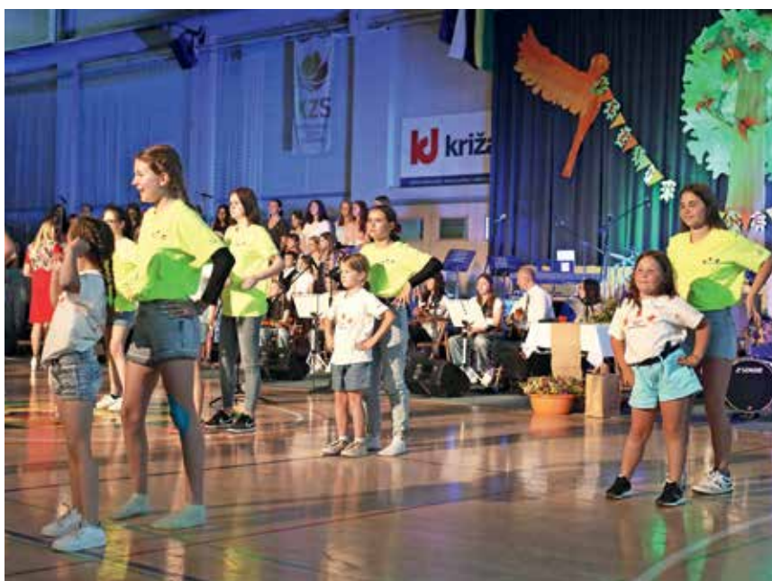
V kulturnem programu so nastopili tako sedanji kot nekdanji učenci šole.