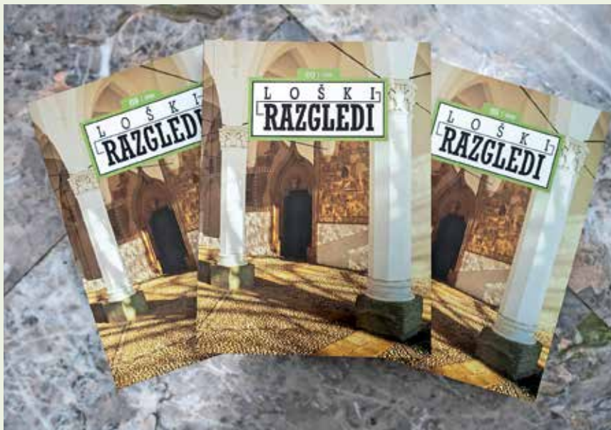
Naslovnico Loških razgledov krasi fotografija pokojnega Tomaža Lundra.

Loški razgledi vsebujejo izvirne znanstvene, poljudnoznanstvene in leposlovne prispevke s področja