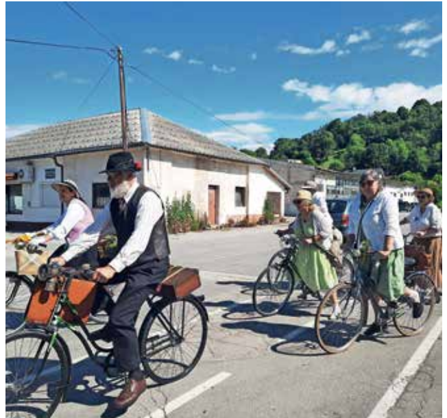
Takole so kolesarke in kolesarji s parkirišča pri nekdanji vojašnici krenili na pot po Škofji Loki.