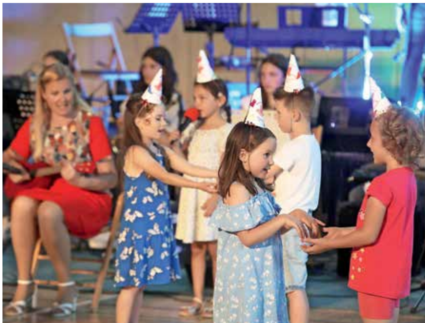
V Športni dvorani Trata je potekala osrednja prireditev v sklopu praznovanja šestdesetletnice Osnovne šole Cvetka Golarja.