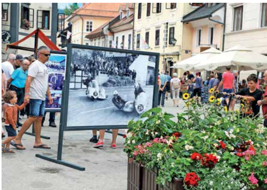
Na panojih na Mestnem trgu je zanimiva razstava o zgodovini loških dirk, prav tako si je razstavo moč ogledati v Sokolskem domu in Pr' Pepet.

je bila tudi slavnostna akademija. Na njej so nekdanjim dirkačem podelili spominske plakete, zbrane pa je iz Nove Zelandije po video poveza-