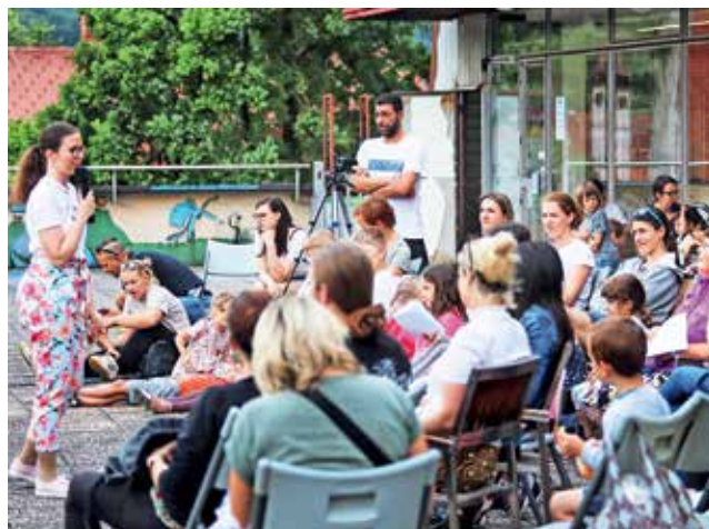
Obiskovalci so na terasi mladinskega oddelka Knjižnice Ivana Tavčarja uživali ob ljudskih pravljicah in pesmih.