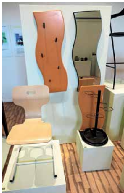
Stol Gelio (2021) in v ozadju garderobna garnitura Marelica (1993)

(načrti, renderji, makete ...), pa tudi različno arhivsko dokumentacijo (fotografije, članki, videoposnetki) v začetku preteklega leta podaril Loškemu muzeju.