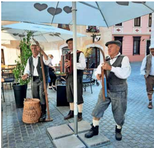
Na Cankarjevem trgu so jih pozdravili zvoki ansambla Suha špaga

Ob pomoči kustosinje Loškega muzeja in vodnice po mestu so udeleženci Škofjo Loko dodobra spoznali. Peš