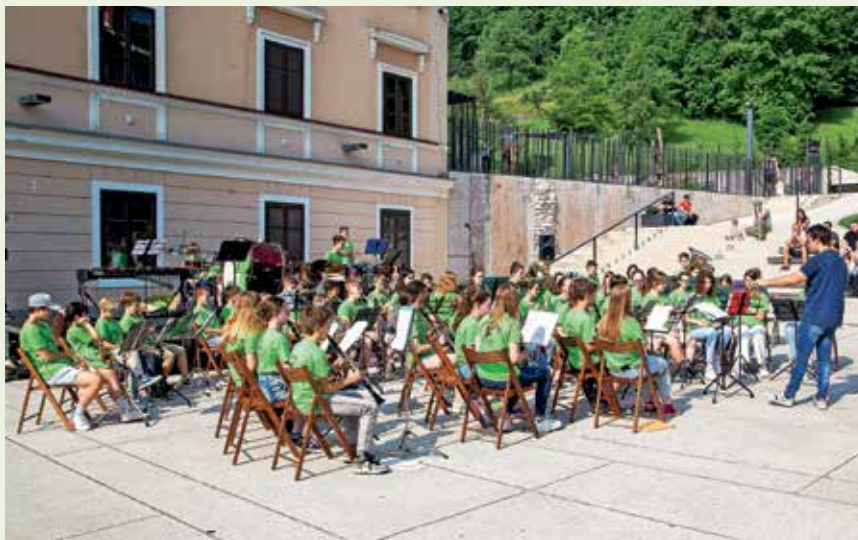
O'glasbeno Loko je na Trgu pod gradom odprl šolski pihalni orkester s 57 nastopajočimi.