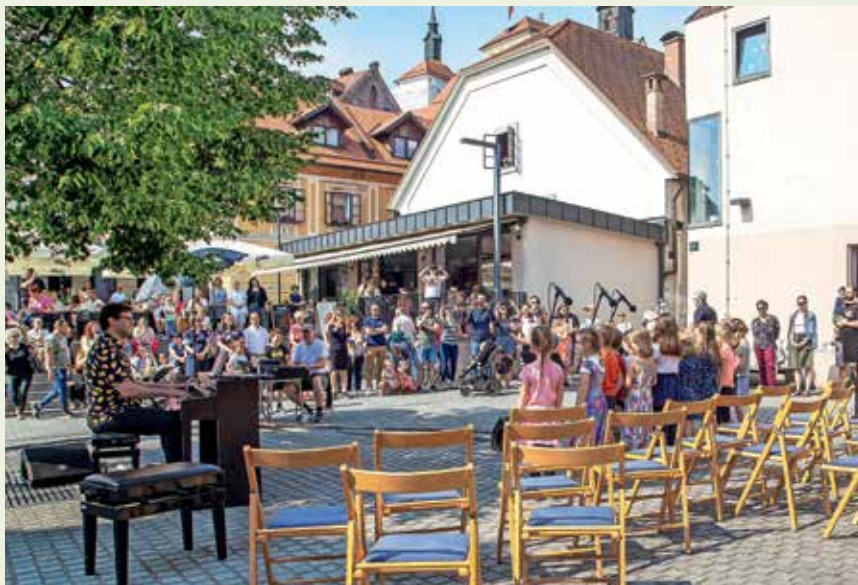
Eno od prizorišč O'glasbene Loke je bil tudi Cankarjev trg.