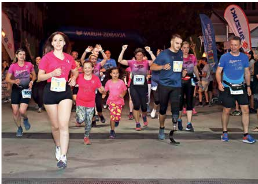
Čeprav niso prvi prečkali ciljne črte, so bili na teku vsi zmagovalci.

Športni utrip se je sredi Mestnega trga v soboto začel že zgodaj dopoldne, na progo pa so se najprej podali najmlajši tekači in tekačice. Vrtčevski otroci sicer niso