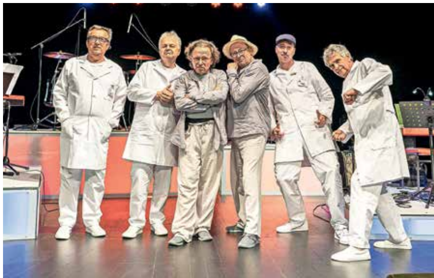
Rokenrol ekipa iz satiričnega kabareta Moj život je ROKentROL.

Do konca julija še poteka predpis v gledališki abonma, ki ga lahko vpišete po elektronski pošti (info@smejmo.se) ali po telefonu (051 606 220) med 17. in 19. uro. S predvpisom si zagotovite nižjo ceno vstopnice in stalni sedež v dvorani.