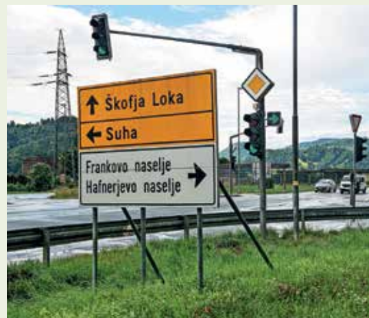
Novi znak za dovoljeno zavijanje desno ob rdeči luči na Trati

ti, da to lahko stori varno, pozoren mora biti na morebitne pešce in kolesarje, obenem pa se mora zavedati, da imajo drugi vozniki prednost pred njim. Zavijanje v desno ob rdeči luči je omogočeno, ni pa obvezno. Sicer na direkciji ugotavljajo, da novo prometno pravilo generalno pripomore k izboljšanju pretočnosti prometa, obenem pa tovrstna prometna ureditev zahteva upoštevanje številnih dejavnikov: od števila in hitrosti vozil in preglednosti, predvsem pa prisotnosti ranljivejših skupin, kot so pešci, šolarji in kolesarji ter osebe z omejeno mobilnostjo.