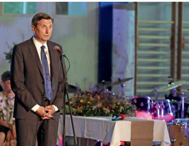
Zbrane je nagovoril tudi nekdanji predsednik Borut Pahor.

prav v osnovni šoli. Opazila je, da je bila na letošnji podelitvi priznanj učencem za velike dosežke na tekmovanjih skupina OŠ Cvetka Golarja zelo velika. »Tudi to dokazuje, da ste odlična šola.«