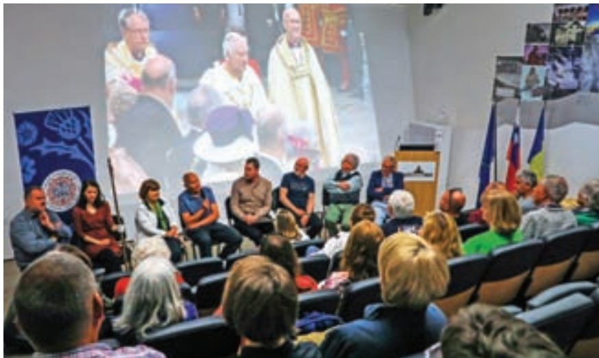
Sodelujoči na okrogli mizi so podelili spomine na obisk takratnega princa Charlesa.

Ob kronanju kralja Karla III. v soboto, 6. maja, sta britansko veleposlaništvo in Slovenski planinski muzej v Mojstrani pripravila dogodek, ki je obudil del poti takratnega princa Charlesa pred 25 leti. Ob tem so poudarili vrednote novega kralja, kot so skrb za skupnost, ekologija, trajnostni razvoj in prostovoljstvo; vezi, ki ga povezujejo s Slovenijo.