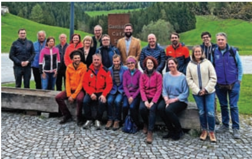
Na predstavitvi del delovne skupine iz Mojstrane skupaj s koordinatorji za Gorniške vasi