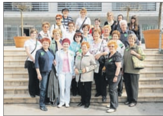
Fotografija iz strokovnega izleta: ogled Tovarne Krka, Grada Otočec, Galerije Božidarja Jakca in obisk prve Cvičkove princeze v Jablancih pri Kostanjevici.

brazi ter povzroči prehod iz zunanje motivacije v notranjo. Velja namreč, da se bo posameznik, ki mu je šola privzgojila ljubezen do spoznanja in znanja, kar pomeni "ljubezen" do odkrivanja neznanega, izobraževal vse življenje. Znanja, veščin in spretnosti ni nikoli preveč in nikoli v življenju ni prepozno, da bi se človek začel ukvarjati s čim novim ali pa da bi dokončal že v preteklosti zastavljeno pot. Zato na Ljudski univerzi Tržič skrbimo za nadaljevanje razvoja lokalnega andragoškega središča s celostno ponudbo v izobraževanju odraslih in se borimo za uresničevanje koncepta vseživljenjskega učenja. Želimo si novih izzivov, novih spodbud in novih znanj, k iskanju novega pa spodbujamo tudi vse naše sodelavce in udeležence izobraževanja.