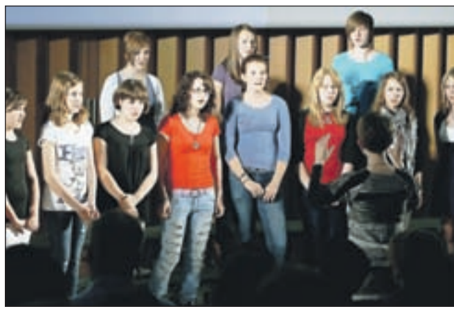
Navdušil je tudi Mladinski pevski zbor OŠ Bistrica.