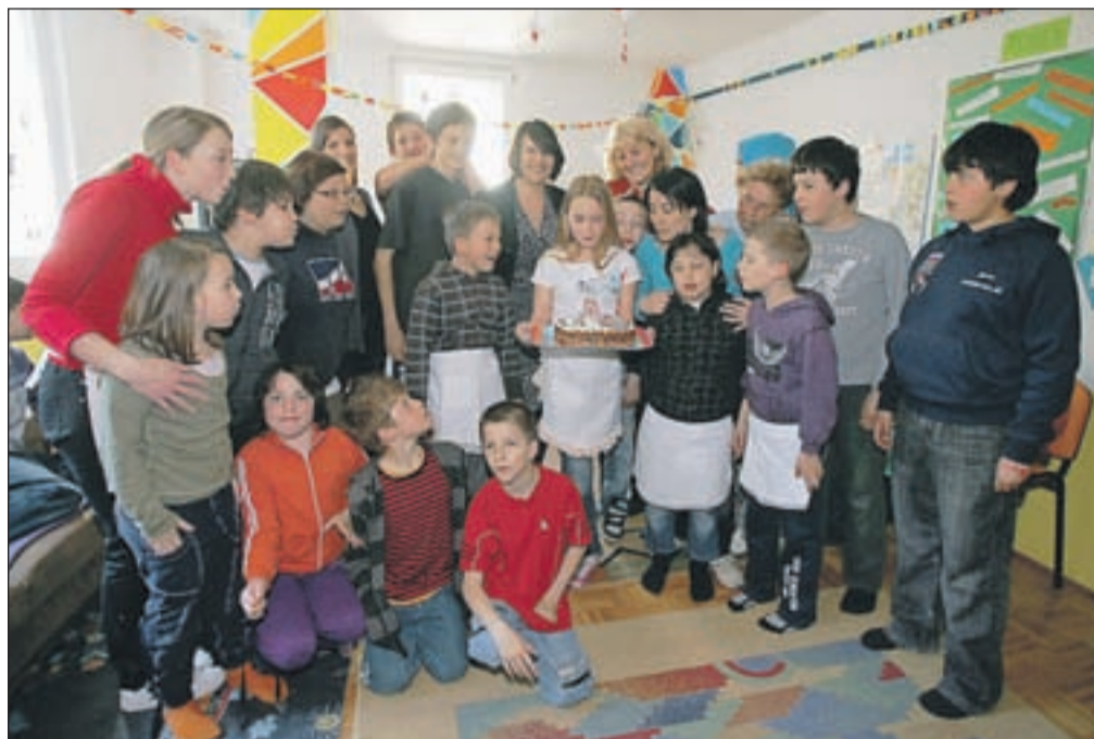
Šest svečk na rojstnodnevni torti za šesti rojstni dan