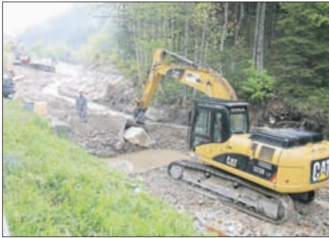
V Jelendolu bodo delali še do sredine maja.

Nad objektom Dolina 31 je struga Tržiške Bistrice močno zasuta, poškodovana je desna brežina. V dolžini 250 metrov je predvideno vzpostavljane ustreznega pretoč-