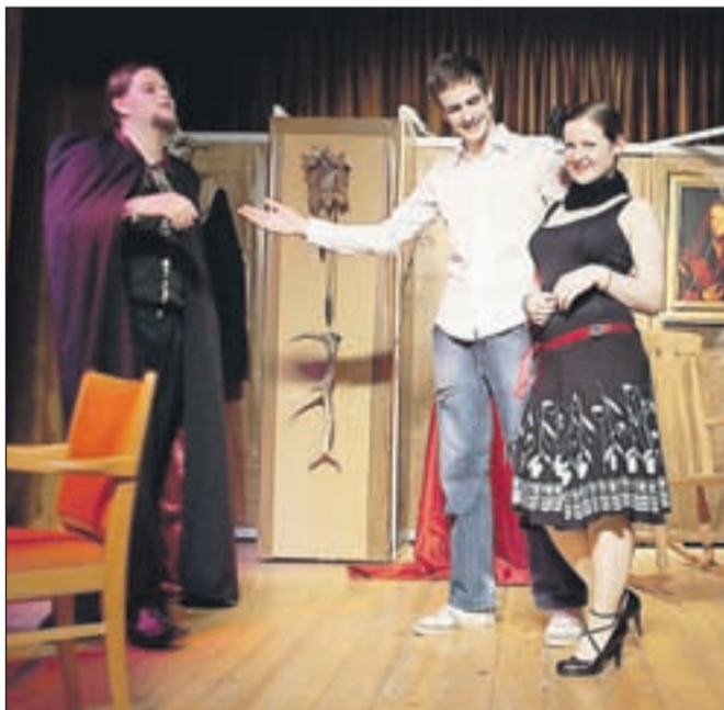
Na generalki v dvorani v Podljubelju...