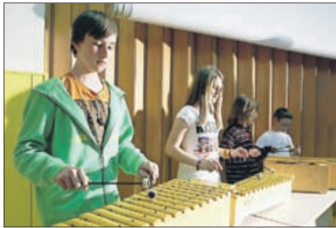
Orffova skupina, ki je spremljala otroški zbor OŠ Tržič.