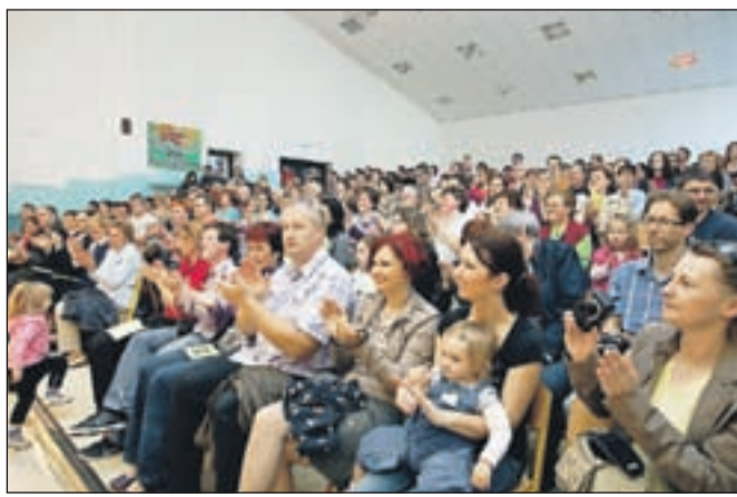
Številni obiskovalci so bili nad nastopi navdušeni.