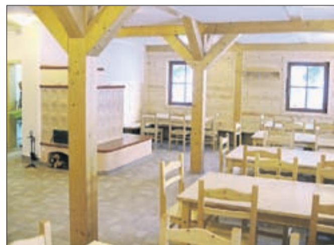
Notranjost doma