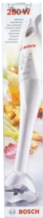
ali palični mešalnik BOSCH

ali darilni bon za Očesno optiko Naklo v vrednosti 20 EUR