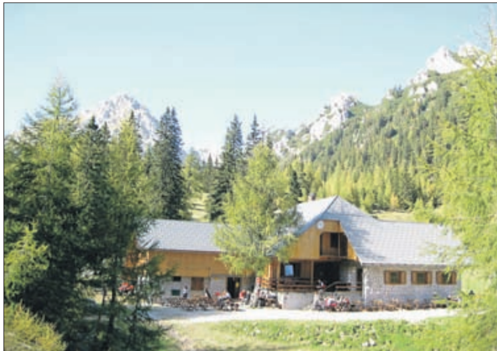
Nov dom že kaže končno obliko.