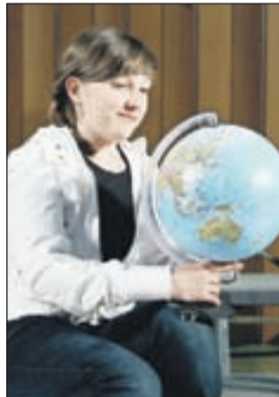
Delček nastopa dramskega krožka OŠ Bistrica