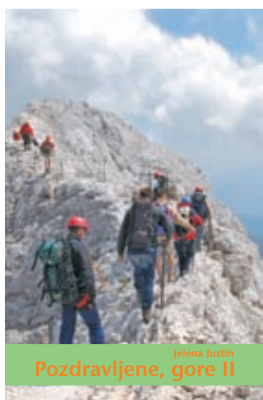
ali knjiga Pozdravljene gore II