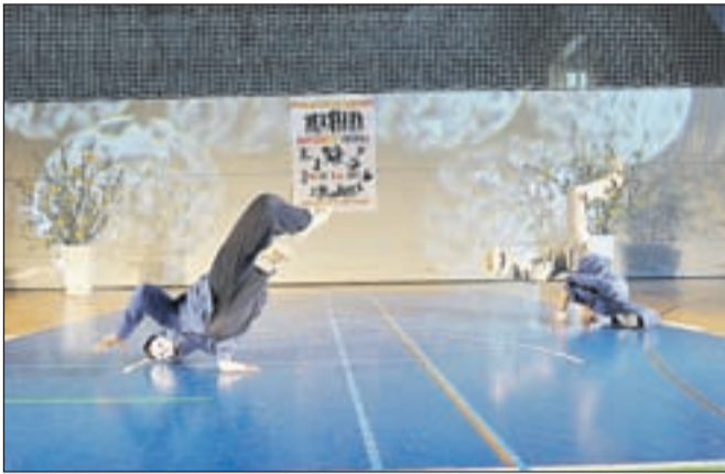
Tako je bil videti nastop break danca.

Neverjetno vzdušje so pripevali gledalci, ki so do zadnjega kotička zapolnili prireditveni prostor in spet pokazali, da so najboljše občinstvo na svetu, saj so vsi nastopajoči bili deležni velike podpore in navijanja. Navdušili so plesalci orientalskih plesov, hip hop plesov, break danca, navijaških skupin, izraznih plesov, najmlajših CICI plesalci, pop in rock and roll. Glavni namen prireditve je bil druženje otrok, mladine in ostalih ljubiteljev plesa v obliki skupnega nastopa, da se zabavajo, spoznajo in seznanijo tudi z drugačnimi plesnimi koraki, kot jih sami poznajo in plešejo. Glede na odzive je prireditev uspela, dokazali smo, da je v Tržiču ples doma.