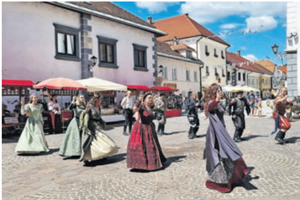
Seveda ni manjkalo niti tradicionalnih srednjeveških plesov, ko so vitez in njegovi spremljevalci zavrteli svoje izbranke.