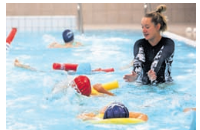
Novi bazen za učenje plavanja že pridno uporabljajo najmlajši.

Iz Plavalnega kluba Radovljica so sporočili, da sta od sredi septembra odprta pokriti olimpijski bazen in tudi novi terapevtski bazen na radovljiškem kopališču. Olimpijski bazen, v katerem je temperatura vode 27 °C, je odprt od ponedeljka do petka med 9. in 12. uro ter od 20. ure do 21.30, ob sobotah in nedeljah pa od 9. do 12. ure in popoldan od 16. do 19. ure. Terapevtski bazen čez dan uporabljajo organizirane skupine iz šol, vrtcev in zdravstvenega doma, med tednom zvečer pa je od 19. ure do 21.30 na voljo za posamezne uporabnike. Ob sobotah in nedeljah je tako kot veliki pokriti olimpijski bazen na razpolago od 9. do 12. ure ter od 16. do 19. ure. Temperatura vode v terapevtskem bazenu je 30 °C. Plavalni klub Radovljica ima sicer razpisana tudi dva programa za odrasle – vadba v vodi za odrasle v terapevtskem bazenu in vodeno rekreacijsko plavanje v olimpijskem bazenu.