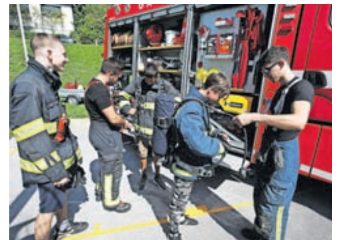
Seveda se je Dneva in pol krajanov udeležilo tudi gasilsko društvo, ki je z veseljem pokazalo svojo opremo.

dogajanje všečno, saj so ponudili veliko aktivnosti za otroke. »Všeč nam je, ker se lahko preizkusijo v različnih stvareh. Naša dva se navdušujeta nad Tomosi, ogledali smo si gobarsko razstavo in super bi nam bilo, da bi to ponovili tudi drugo leto.«