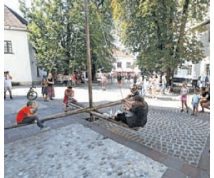
Srednjeveški vrtljak je pritegnil veliko pozornosti predvsem najmlajših obiskovalcev.