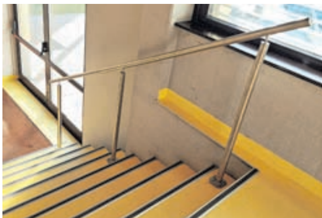
Nova ograja na stopnišču, ki vodi v avlo Osnovne šole F. S. Finžgarja v Lescah; v času volitev je tam tudi voliše.