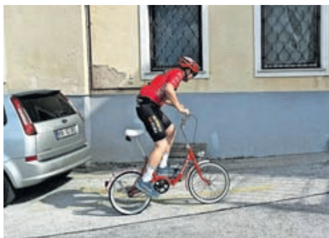
Nekateri so se na traso podali s pravimi dirkalniki, spet drugi z legendarnimi ponyji.