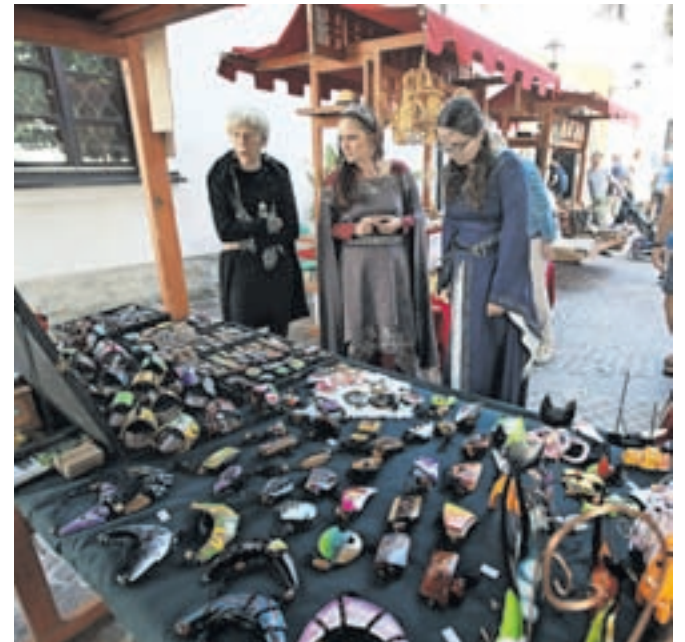
Grajske gospe so se sprehodile med stojnicami – mogoče pa bodo snubci radodarni.