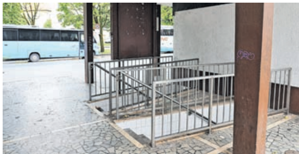
Javno stranišče na radovljiški avtobusni postaji je že dolgo zanemarjeno in zaprto.

ga objekta, podjetja Arriva, spomladi pridobila brezplačno stavbno pravico za obdobje 25 let.