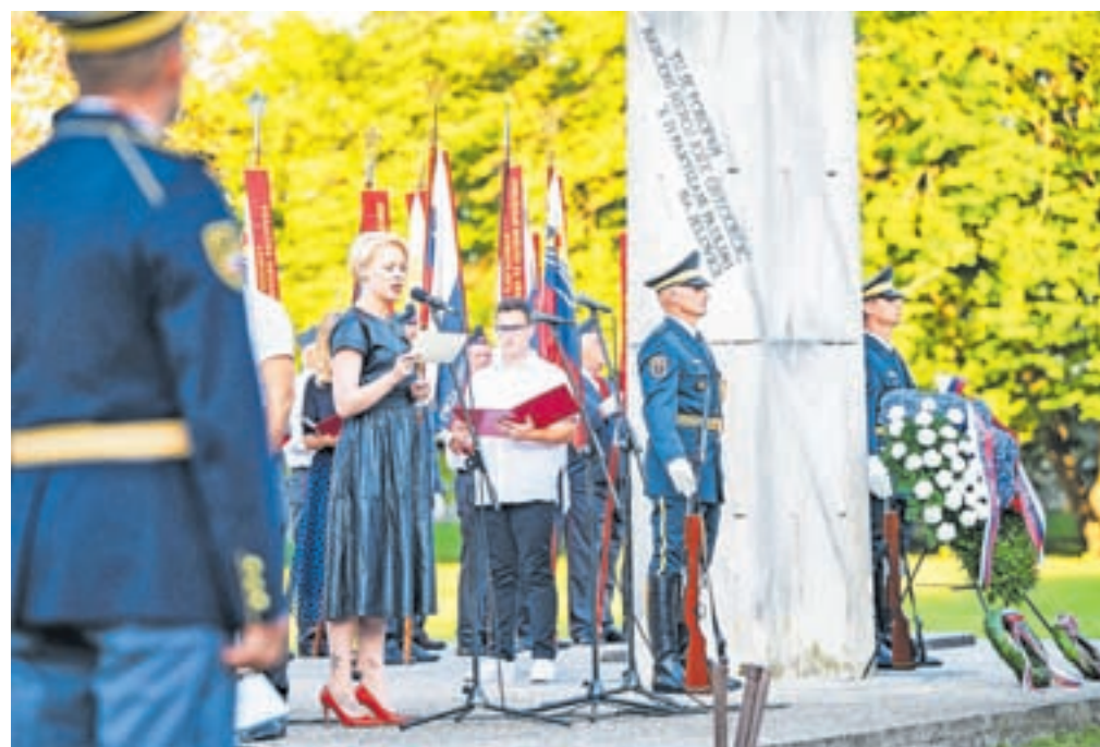
Spominska slovesnost ob grobnici in obelisku arhitekta Eda Ravnikarja v grajskem parku