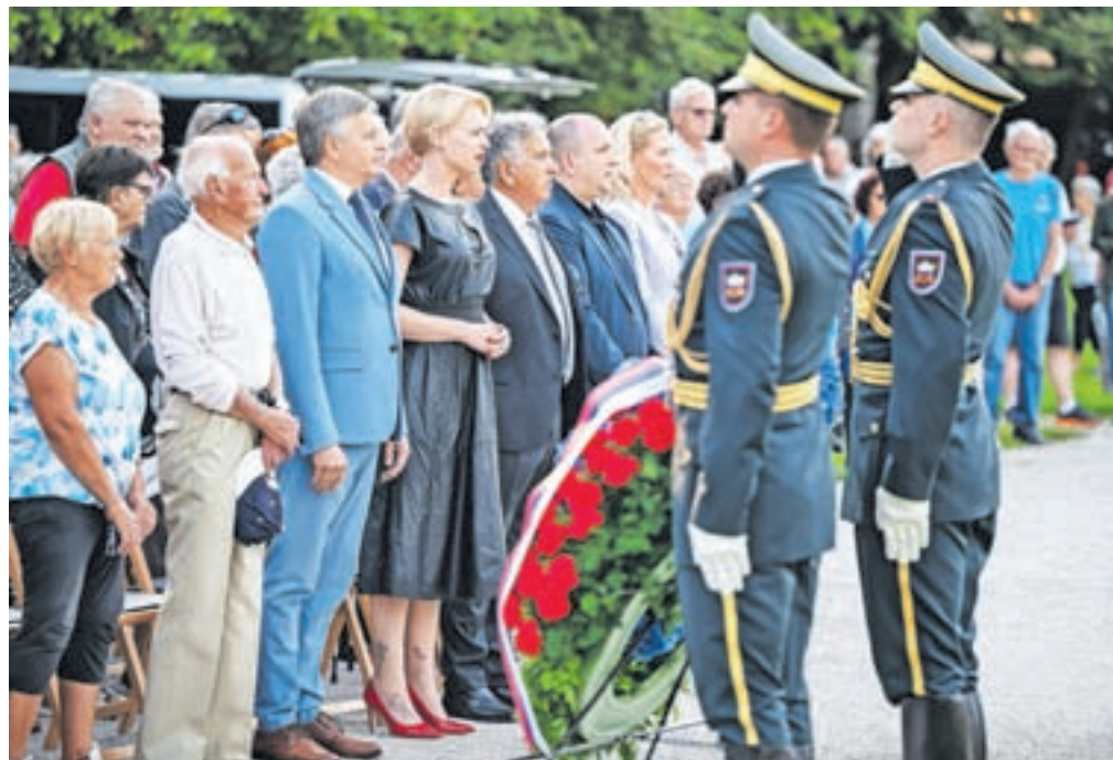
Ponovno so se spomnili borcev, ki so življenja izgubili na Jelovici.

Tisti, ki so pokopani tukaj, so želeli spremeniti svet na bolje. Bili so samo ženske in moški, ki so se zaradi želje po svobodi in preživetju slovenskega naroda hrabro bojevali. Ampak bili so junaki.