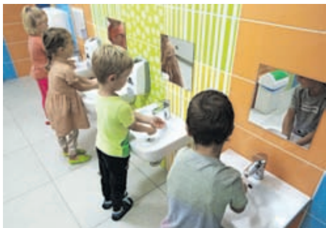
Otroci so navdušeni nad novo kopalnico

ca Radovljica. Julijina risbica je res zbrala največ glasov in prenova ene od štirih dotrajanih kopalnic v radovljiški enoti vrtca se je med počitnicami začela. »V podjetju Tapro so prijazno upoštevali