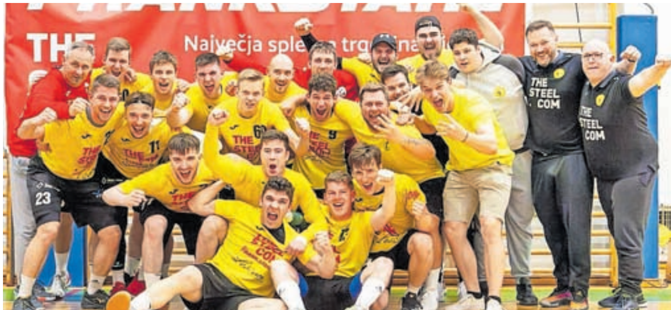
Članska ekipa Rokometnega kluba Frankstahl Radovljica

Poletje je Radovljičanom prineslo še več uspehov. Kadeti so se avgusta udeležili mednarodnega turnirja v Bijeljini (BiH) in domov prinesli pokal za prvo mesto. Konec avgusta se je v Ivančni Gorici odvijal tudi tradicionalni rokometni turnir, ki ga mlajše selekcije vsako leto izkoristijo kot