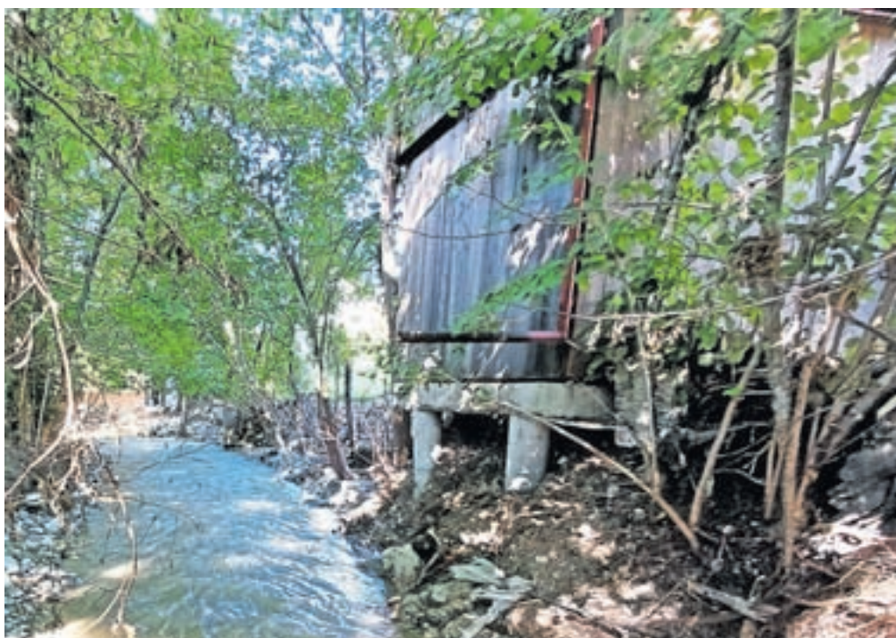
Eden od objektov ob vodotoku na območju občine Radovljica, postavljen brez vodnega soglasja

»Občina Radovljica in Direkcija RS za vode lastnike priobalnih zemljišč redno seznanjata z njihovimi dolžnostmi in jih pozivata k njihovem izvajanju, saj neodzivnost predstavlja grožnjo naseljem, kjer so vodotoki. Tudi z osebni opozorili želimo preprečiti primere, ko posamezniki tudi po vodni ujmi obnavljajo in nameščajo