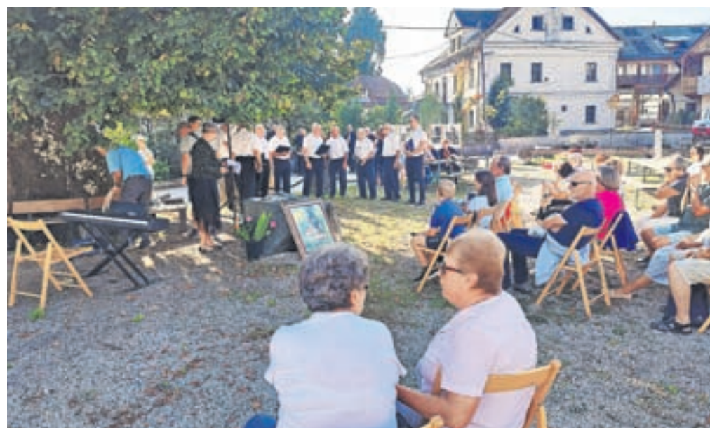
Praznovanja krajevnega praznika se je udeležilo lepo število krajanov.