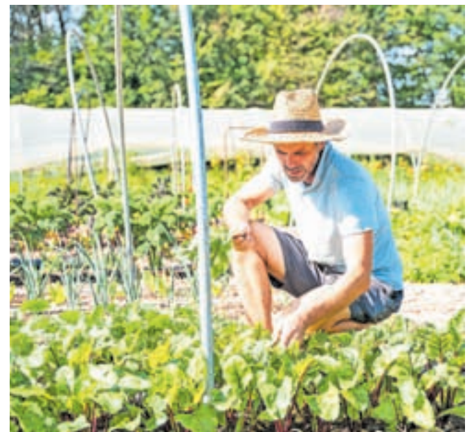
V oktobru se bodo zvrstili še dnevi odprtih vrat na kmetijah Vegerila, Brinšek in Dolenc.