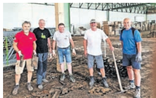
Pet članov zgornjegorenjskega združenja veteranov vojne za Slovenijo je pomagalo čistiti poplavljenе prostore podjetja Svilanit v Kamniku.

ska, je organizacija poplavljenim ponudila pomoč na spletni aplikaciji za oddajo pomoči ob poplavih. Kmalu po prijavi so bili razporejeni v Kamnik, kje je na podlagi prošnje pet članov združenja pomagalo čistiti skladiščne prostore podjetja Svilanit.