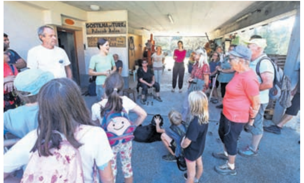
Sobotno dogajanje se je začelo s pohodom po krajevni skupnosti.