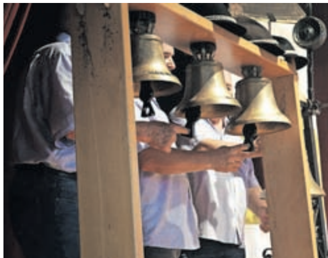
Da bi ohranili spretnosti pritrkovanja, so pritrkovalci iz Kamne Gorice s pomočjo donacij kupili male zvončke, s katerimi pritrkovalci nastopajo tako na domačih prireditvah kot na gostovanjih v Sloveniji in zamejstvu.