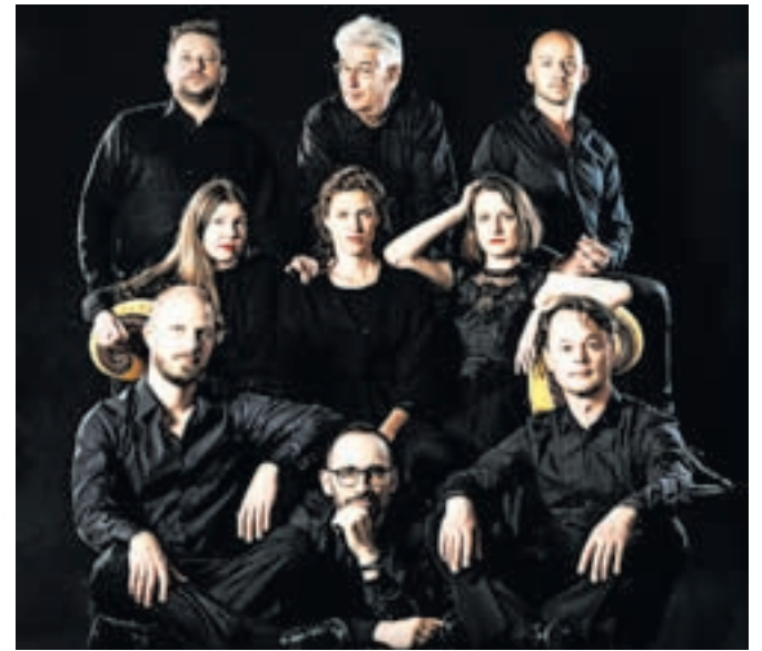
Ensemble Minui vas popelje v svet opere.