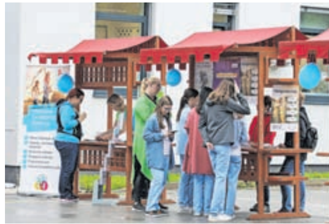
Center za krepitev zdravja, ki deluje v okviru Zdravstvenega doma Radovljica, je tudi letos organiziral Dan zdravja.

»V svetu, v katerem nam trgovci ponujajo skoraj neomejeno število izdelkov, ki nam obljublajo zdravje, izgubo telesne mase ter dobro počutje, je res težko med vsemi informacijami razbrati relevantne in strokovne podatke. Diplomirana diete-