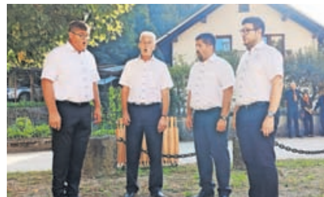
Z izborom pesmi je nastopila tudi vokalna skupina Lipa.