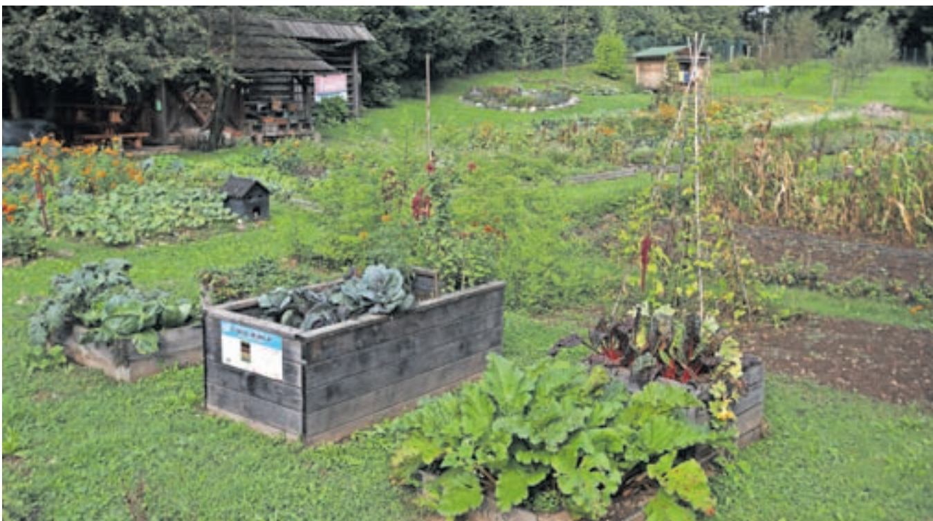
Biodinamični učni vrt za radovljiško osnovno šolo je v teh jesenskih dneh lep in cvetoč.

usmerjenih učnih vsebin, usposabljanj in aktivnosti na vrtu, ki vključujejo različne skupine prebivalcev in omogočajo medgeneracijsko sodelovanje in izmenjavo znanj ter izkušenj. Vrt je že kmalu poleg ekološkega pridobil tudi certifikat Demeter. Gre za blagovno znamko, ki označuje hrano najvišje kakovosti za prehrano ljudi, pridelano po načelih biodinamike in ob upoštevanju strogih standardov pridelave in predelave.