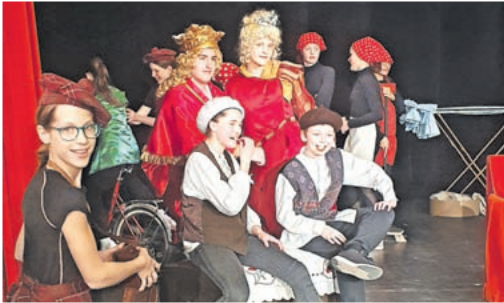
Iz domače predstave Kralj v časopisu v izvedbi Linhartovih Čukov