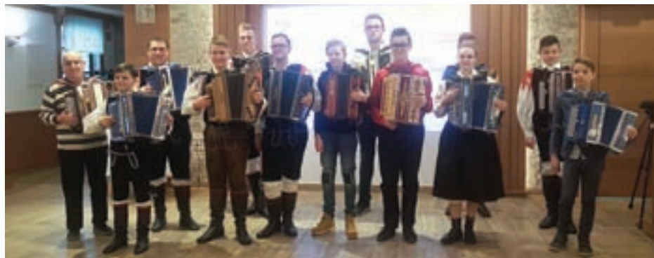
NA PREDIZBORU V ŠKOFJI LOKI UVRŠČENI HARMONIKARJI ZA 5. DRŽAVNO TEKMOVANJE HARMONIKARJEV ZA NAGRADO CYRILL A DEMIANA