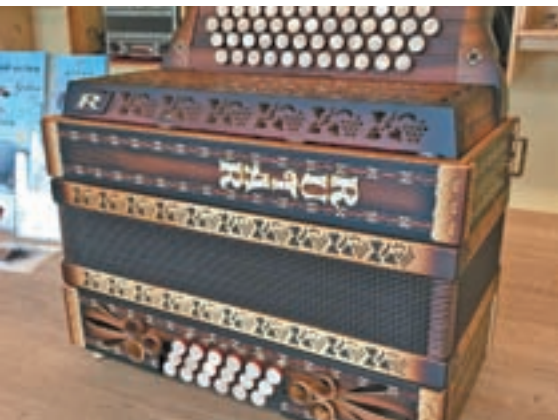
RUTAR – MODEL FABIJAN LD Z 18 BASI, REGISTRI IN POLTONI

Vsekakor je treba dopustiti, da se instrument – diatonična harmonika – in glasba, ki se igra na njem, razvijata naprej tako kot doslej. Ne zapirajmo vrat ustvarjalnosti skladateljev, izvajalcev-harmonikarjem, izdelovalcem diatoničnih harmonik, saj ne nazadnje s tem lahko približamo glas diatonične harmonike tudi zahtevnejšim poslušalcem.