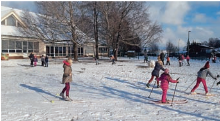
Letošnji sneg je učencem omogočil spoznavanje zimskih športov kar v šolski okolici.

Letošnji sneg do nižin pa je učencem poleg snežnih radosti omogočil spoznavanje zimskih športov kar v šolski okolici. Pri urah športa in dejavnostih v podaljšanem bivanju med dru-