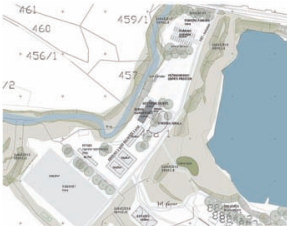
Idejna zasnova Športnega parka Bobovek

Letos se je končala prenova velike dvorane v kulturnem domu. V naslednjem letu nameravajo urediti še klet v kulturnem domu in posodobiti otroško igrišče, za kar bodo uporabili sredstva za investicijsko vzdrževanje, ki jih bodo krajevne skupnosti po novem prejele na podlagi 8. člena novega občinskega odloka o financiranju krajevnih skupnosti. V primeru KS Kokrica gre za približno dvajset tisoč evrov letno.