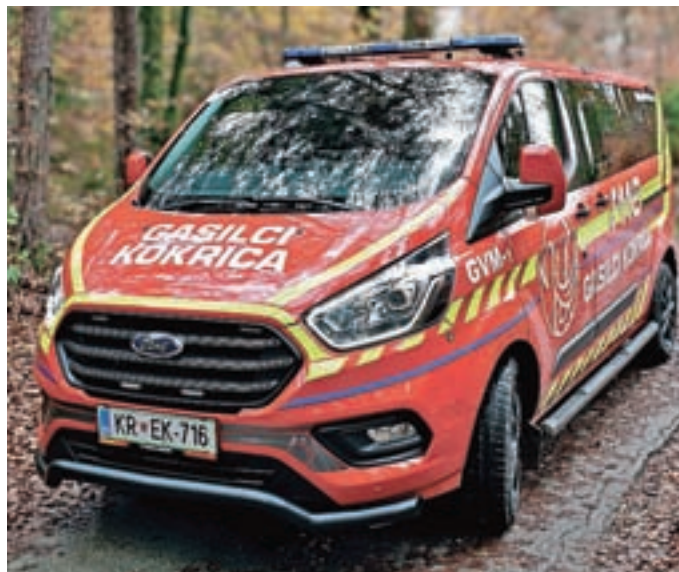
Novo gasilsko vozilo GVM-1 Ford Transit

V preteklem letu so bile vse dejavnosti precej okrnjene – prav tako so odpadla vsakoletna tekmovanja, z izjemo državnega tekmovanja. Tja se