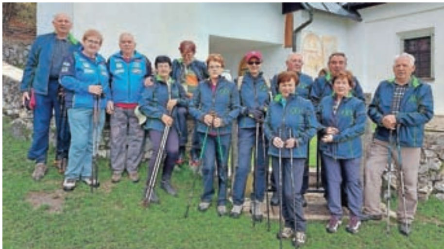
S pohoda na Sv. Lovrenc

Pred pobiranjem prijav sem bil kar malo v dvomih, ali bo sploh dovolj prijav, a je bilo teh nad vsemi pričakovanji. V sodelovanju s turistično agencijo Loka turist iz Škofje Loke smo se v torek, 12. oktobra, v jutranjih urah z modernim 59-sedežnim avtobusom, ki je bil napolnjen do zadnjega sedeža, krenili proti Prekmurju. Po kavi na Tepanjah in degustaciji pečenih in tekočih dobrot, s katerimi smo se dobro založili, smo hitro prispeli v Lendavo do razglednega stolpa Vinarium. Vreme nam je bilo še kar naklonjeno in tako smo ob vzponu na vrh stolpa uživali v lepih pogledih na tri države.