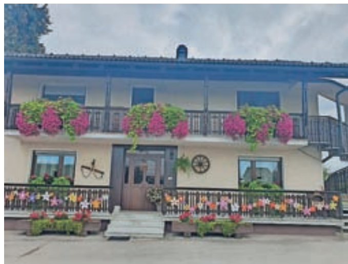
Tudi letos smo ocenili urejenost hiš in vrtov.