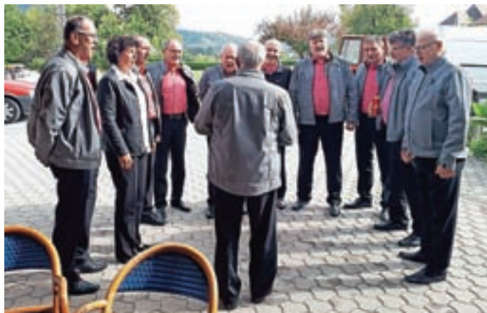
S petjem smo polepšali in popestrili nekaj praznovanj in drugih dogodkov.

Konec leta je tudi čas, ko smo se vedno povselili skupaj in nazdravili novemu letu. Tudi letos bo to žal malo drugače. Z nekaj potrpežljivosti,