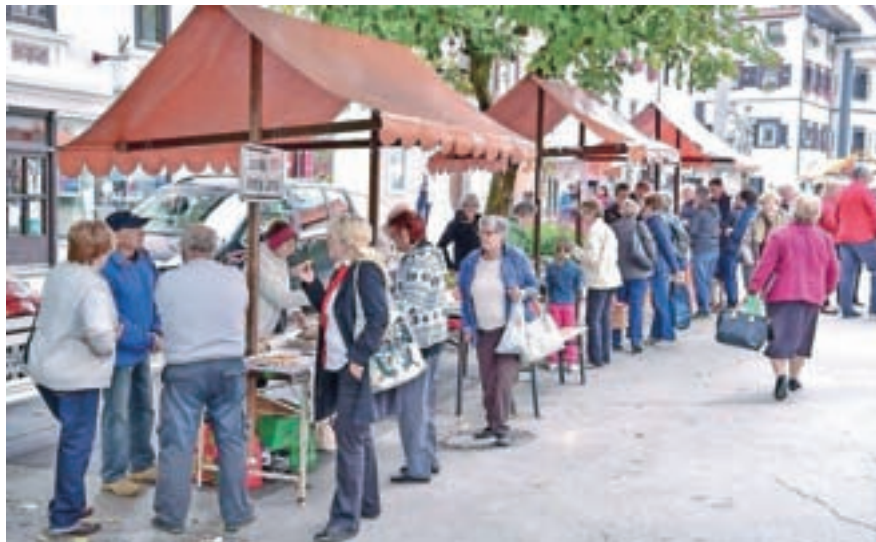
Ob stojnicah se je na Prazniku prosa gnetlo obiskovalcev.

Danes znajo v gostilnah jedi iz prose- ne kaše povzdigniti na višjo raven, o čemer smo se nedavno lahko prepri- čali v Gostilni Starman, kjer v okviru Okusov loškega podeželja svojim gos- tom pripravljajo tradicionalne jedi s sodobnejšo noto. Praznik prosa, ki ga je v Škofji Loki drugič zapored (prvič leta 2015) pripravilo Turistično dru- štvo Škofja Loka v sodelovanju z dru- štvom Sorško polje, je bil poklon temu skromnemu žitu in jedem, ob katerih so rasli naši starši in stari starši. Kako so na Sorškem polju v preteklo- sti pridelovali prosa, kako so sušili žito, kako so ga "meli", da se je zrnje