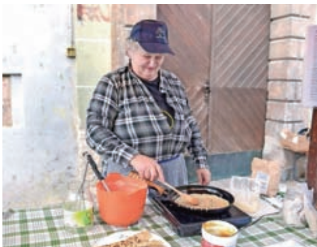
Za posladek pa še prosene palačinke