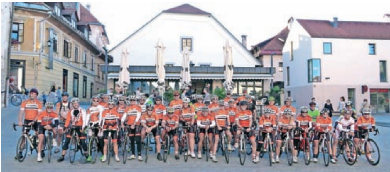
Skupinska fotografija na zadnjem GP-ju