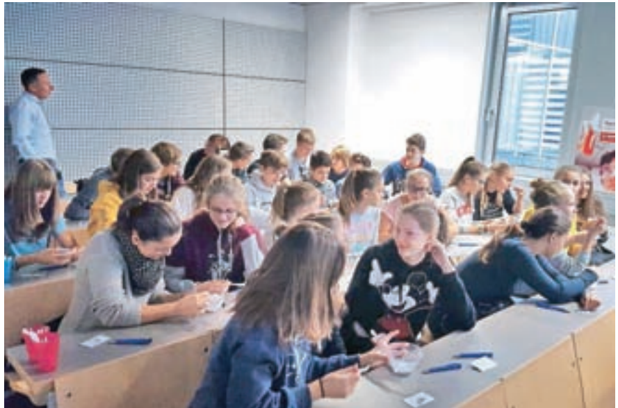
Kemijskih delavnic so se udeležili tudi dijaki Gimnazije Škofja Loka.

Delavnice, s katerimi želijo pri dijakih spodbuditi zanimanje za naravoslovne znanosti ter jim predstaviti povezavo med kemijo in vsakdanjim življenjem, je omogočila družba BASF v okviru projekta Teens' Lab. Na za dijake brezplačnih delavnicah so izvajali eksperiment, ki so ga naslovili Labirint snovi. Delavnice so vodili študenti fakultete za kemijo in kemijsko tehnologijo, pedagoške fakultete in fakultete za farmacijo, ki tako svoje znanje in entuziazem predajajo naprej mlajšim generacijam, so pojasnili organizatorji delavnic.