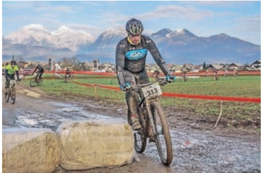
Udeležba na ciklokrosu

"Šport mi veliko pomeni, pravzaprav mi daje "žmoht" v življenju. Celo življenje sem rekreativni športnik in ogromno časa preživim v naravi. Tako sem se tudi spoznal s tako imenovanimi "adventure race" tekmovanji in veliko tekmoval ter se udeleževal tekm v tujini ... Ljubezen do športa v kombinaciji z naravo se je zasedrala v srce in takšen način ukvarjanja s športom mi pomaga tudi pri spopadanju z vsakodnevnim stresom. Če se vrnem k vprašanju, zakaj se ukvarjam tudi z organizacij ... Ko sem se udeleževal številnih športnih dogodkov v tujini, sem spoznal, da bi bilo to odlično prenesti tudi v domače okolje. Vesel sem, ker pomagam pri organizaciji, saj na ta način pripomorem k izvedbi številnih dogodkov, na katerih uživam s somišljeniki. Določene prireditve so mi še posebno pri srcu. Tudi Triatlon jeklenih, ki poteka po čudovitih hribovih okoli Bohinja. Na njem bom sodeloval, dokler bom fizično še sposoben premagati traso, ne glede na rezultat."