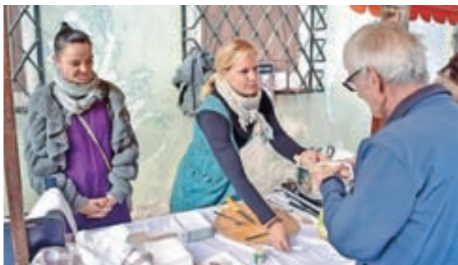
Dober tek ob proseni klobasi