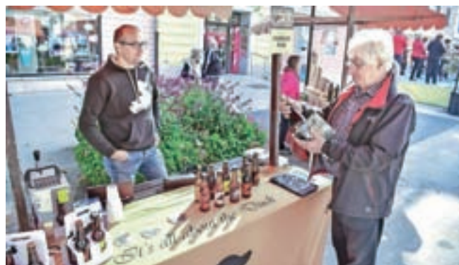
V Žireh so zvarili proseno pivo.