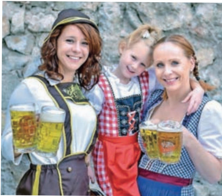
▲ V soboto, 29. septembra, so povabili v Krčmo Mihol na tradicionalni Miholfest. Poskrbeli so tako za žejne kot lačne – v stilu priljubljenega Oktorberfesta pa je seveda glavno vlogo imelo pivo. Točili so "superce", stregli preste in okusne klobase. V večernih urah se je pridružila še glasba, za prijazen vtis pa so skrbeli domači ter strežno osebje lokala. A. B.