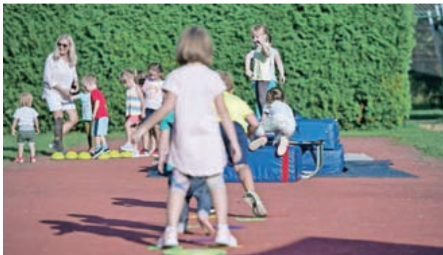
Otroci so se lahko zabavali ob številnih športnih dejavnostih.