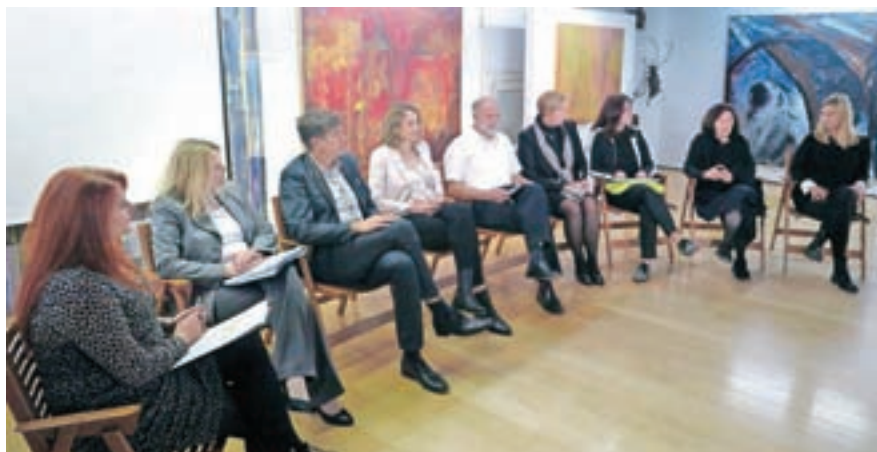
Občinska Škofja Loka, Mestni trg 15, Škofja Loka