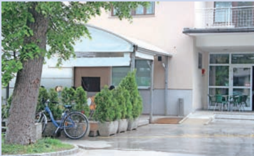
Oddajajo tudi gostinski vrt.

Javna dražba za najem poslovnega prostora bo v torek, 24. maja, ob 10. uri v sejni sobi številka 14 na sedežu Mestne občine Kranj na Slovenskem trgu 1 v Kranju. Najkasneje do petka, 20. maja, do 12. ure pa morajo pravne in fizične osebe na občinski Urad za splošne zadeve dostaviti zahtevane dokumente iz splošnih pogojev. Za pogoje najema in pravila javne dražbe in še več drugih informacij v zvezi s tem se kandidati lahko obrnete na Mestno občino Kranj na telefonski številki 04 2373 113 ali 051 603 297 ali na spletni strani www.kranj.si . S.K.