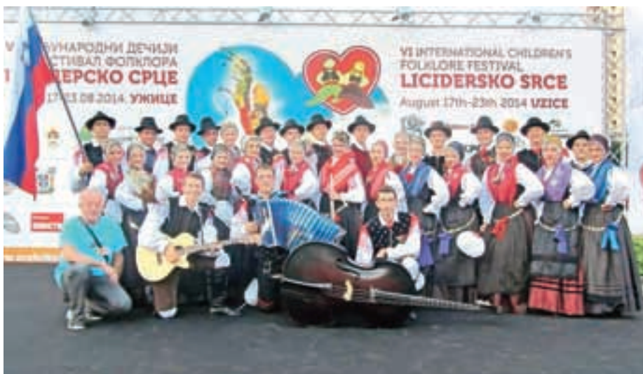
Mlajša skupina FS Iskraemeco v Užicah