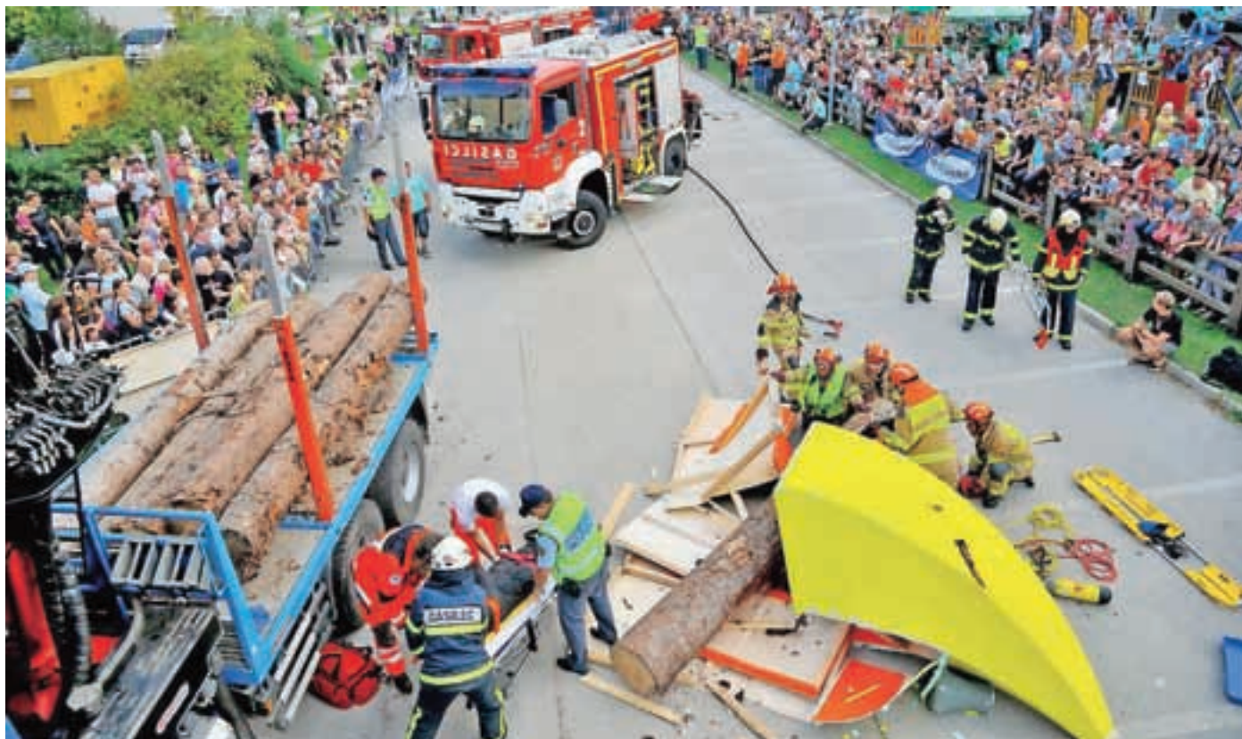
Vaja v izvedbi JZ GRS Kranj, Policie, PGD Predoslje, PGD Britof in PGD Suha

Še enkrat en velik HVALA vsem, ki ste izkazali podporo, na takšen in drugačen način, HVALA vsem društvom oziroma njihovim članom za sodelovanje, in HVALA vsem, ki ste se dogodka udeležili in s tem ves trud tudi poplačali.