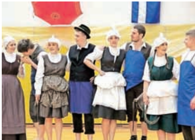
Revija Požinka, v delovnih oblekah