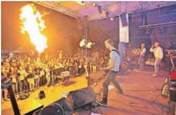
Več kot odličen obisk Naaaj dneva.