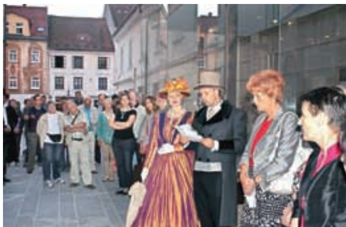
Nastop pred Mestno knjižnico Kranj