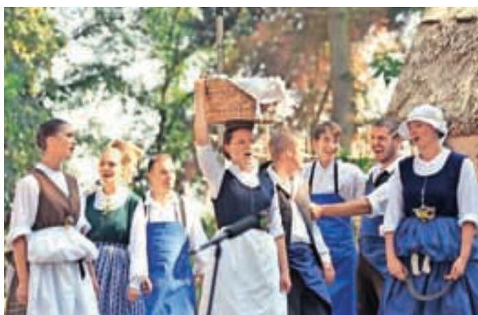
Gorenjsko državno prvenstvo 2013