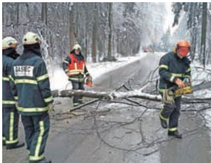
Odpravljanje posledic žledoloma