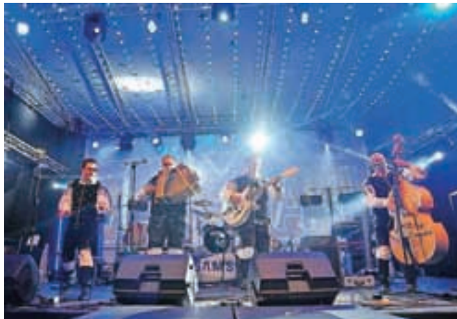
V družbi Modrijanov

Tudi letos so združena društva vasi Predoslje in Suha ter člani PGD Britof uspešno z roko v roki izpeljala že osmi Naaaj dan. Tokrat je bilo vreme dogodku naklonjeno, kot že dolgo ne. In tudi nedeljski večerni dež ni preplašil vztrajnih plesalcev in plesalk.