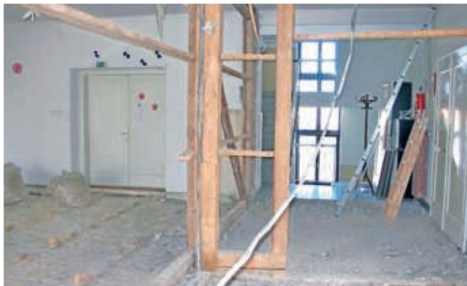
Poškodovana konstrukcija kulturnega doma. S prenovo je dom zasijal v celoti.

Krajevna skupnost Predoslje, Predoslje 34, Kranj