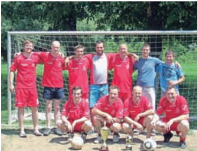
Športniki PGD Predoslje

Tako kot vsako leto je tudi letos v oktobru, mesecu požarne varnosti, čas, ko se člani PGD Predoslje ozrejo nazaj in ocenijo, ali je njihovo delo obrodilo sadove.