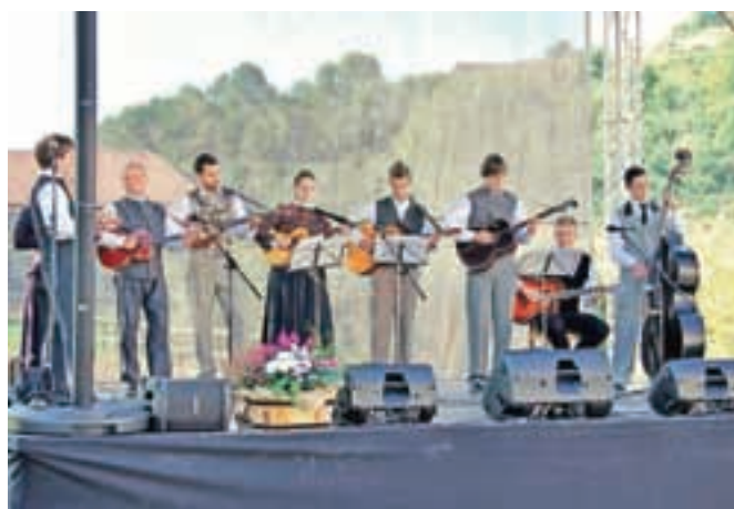
Tamburaška skupina Iskraemeco