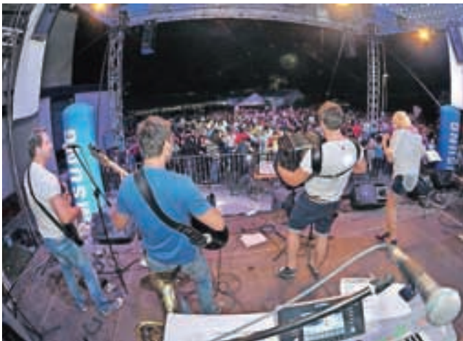
To so Veseli svatje