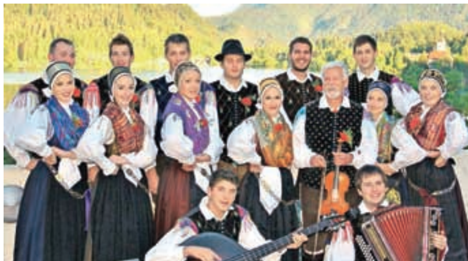
FS na Bledu

Društvo se povezuje: Javni sklad Republike Slovenije za kulturne dejavnosti; Javni sklad