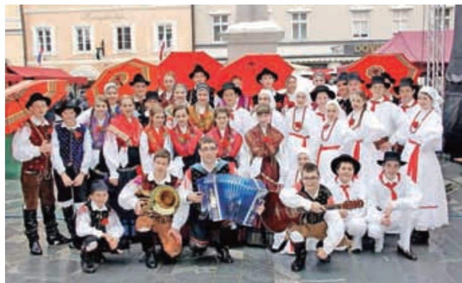
Mladinska in otroška FS Iskraemeco