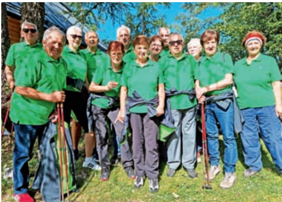
Pohod na Krvavec

Na Ptuj smo prispeli z zamudo, zato smo si vzeli čas samo za kavo in kratek sprehod po mestu. Na železniški postaji nam je uslužbenka svetovala, naj se zapeljemo v Maribor, od tam pa nazaj v Ljubljano z direktnim vlakom. Tako smo prispeli v Maribor, ki je bil naš prvotni cilj. Posedli smo se v bližnjem lokal, ker pa nas je