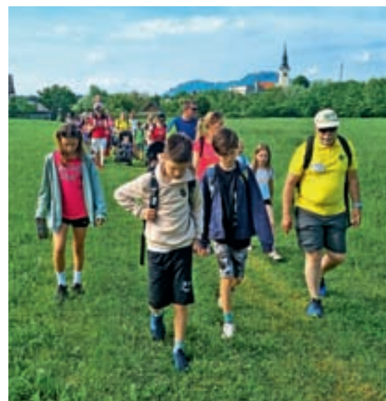
Pohod po mamutovi deželi smo nadgradili s tri kilometre dolgim pohodom za otroke.

In že je tu december, ko bo 5. decembra ob 17. uri predšolske otroke naše KS obiskal Miklavž, 10. decembra vabimo na božično-novoletni koncert z ansamblom Slovenski zvoki,