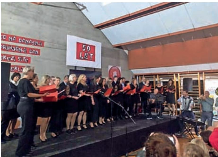
Skupaj s predstavniki društev smo se udeležili zaključne proslave ob praznovanju 50-letnice Podružnične šole Kokrica. / Foto: KS Kokrica

Fotografija na naslovnici: Primož Pičulin