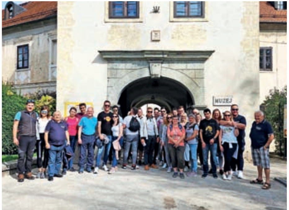
Na izletu

Poleg intervencij smo kokriški gasilci tudi aktivno sodelovali v družabnem, športnem in kulturnem življenju svoje skupnosti. Organizirali smo tradicionalno gasilsko zabavo na Kokrici, ki je privabila veliko obiskovalcev in jim ponudila zabavo, glasbo in dobro hrano. Vse leto so naše ekipe vseh starosti tekmovali na gasilsko-športnih tekmovanjih, organizirali pa