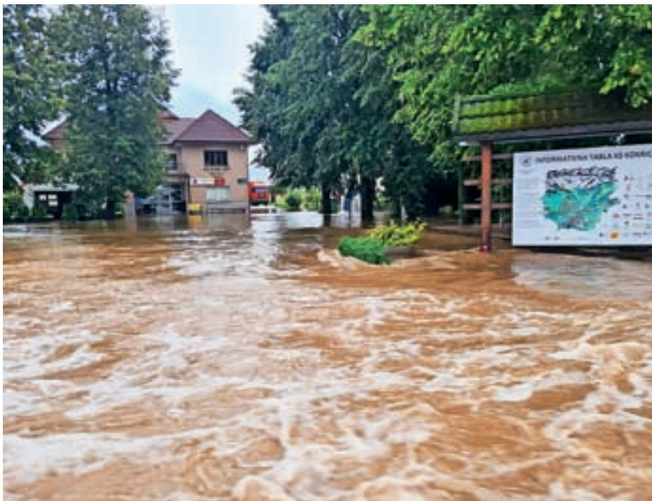
V avgustovskih poplavah je bil poplavljen tudi Kulturni dom Kokrica.

V avgustovskih poplavah je bil poplavljen tudi Kulturni dom. Kurilnico v kleti je voda zalila do stropa, uničene so bile plinska peč, razsvetljava in električna napeljava. Poleg tega je voda zalila tudi nedavno prenovljeno kletno sejno sobo, ki je tako potrebna ponovne prenove, v samo enem letu. Sanacija sejne sobe je še v teku, saj zaradi konstantnih padavin in veliko vlage izsuševanje sten ni tako učinkovito, kot smo sprva pričakovali. Prav tako smo že zamenjali peč in uredili elektroinštalacije v kurilnici, da bodo dogodki v dvorani lahko potekali nemoteno tudi ob nizkih zunanjih temperaturah.