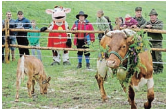
Posebna atrakcija planšarske prireditve je bila kravja ruleta.