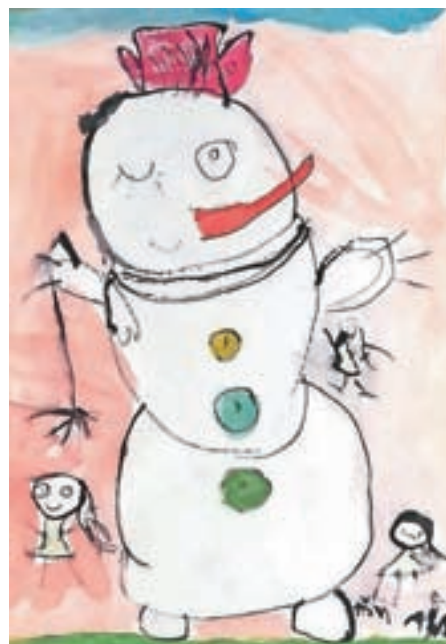
Nanča, skupina Miška

– Rekel bi mu: »Sneženi mož, ali bi tudi spomladi še hotel živeti?« Lev, 2. č