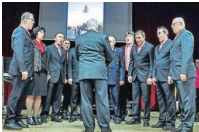
Vokalna skupina Kokr'čan je nastopila tudi na občnem zboru gasilcev konec januarja na Kokrici.

Poseben dogodek bo letos praznovanje 25-letnice delovanja naše skupine. Odločili smo se, da namesto vsakoletnega Pevskega večera organiziramo slavnostni koncert, ki bo v soboto, 6. aprila, v dvorani kulturnega doma na Kokrici. Program bo kar zahteven, saj bomo pokazali, kaj vse smo se v tem obdobju naučili. Čeprav tudi nam ne prizanašajo razne viroze in prehladi, se bomo potrudili, da poslušalci