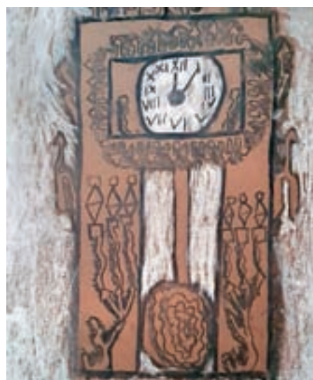
Tobjija, 3. c