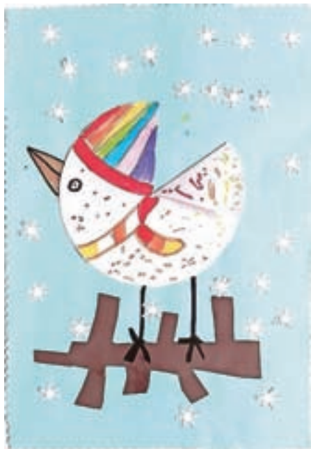
Nik, 1. c