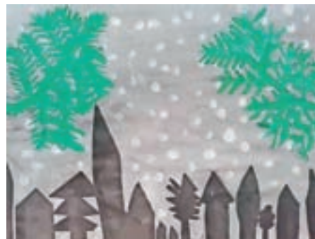
Elona, 1. c

Na torek v mesecu januarju smo se s šolo odpravili na Krvavec. Med potjo smo videli veliko zanimivih stvari. Peljali smo se tudi mimo ranča, na katerem živi moja sestrična. Proti koncu vožnje smo se začeli strmo vzpenjati. Ta pot do gondole je trajala približno pol ure.