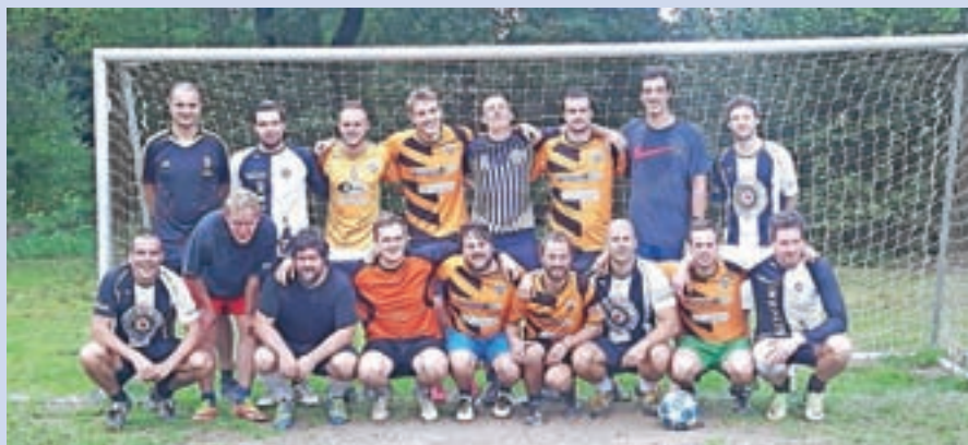
Tudi lansko ligo v malem nogometu so končali s pokalnim tekmovanjem.

Pod okriljem NK Kokrica bomo tekmovanje in zaključni dogodek z nogometnim turnirjem organizirali tudi letos. Tekmovalne aktivnosti začnemo v maju, predvidoma pa jih zaključimo nekje v sredini septembra. Tekme se bodo odvijale ob torkih in četrtek popoldan. Vabljeni vsi, ki si želite kakšno tekmo tudi ogledati. V primeru vprašanj po aktivnem sodelovanju v nogometnem tekmovanju smo vam na voljo na naslovu: sdzg@gmail.com .