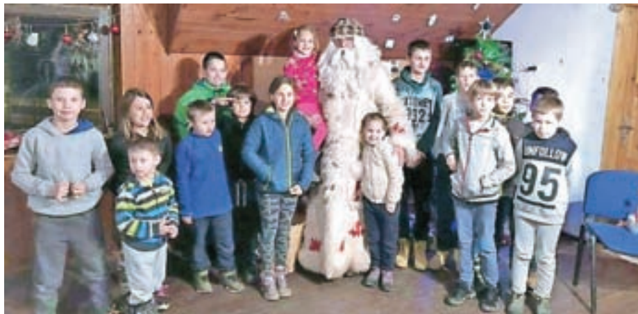
Dedek Mraz je obiskal podmladek našega društva.

Ker gasilci nismo vajeni počitka, smo se v zadnjih dneh starega leta odločili, da začnemo z drugim delom obnovitvenih del. Že ste lahko prebrali, da smo obnovili pisarno in spominsko sobo v gasilskem domu. Dotrajane prostore smo popolnoma preuredili v modernem slogu,