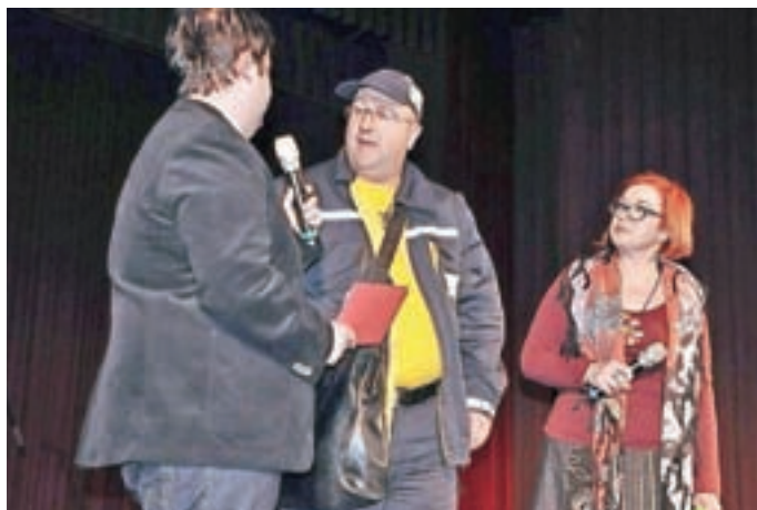
Gardelinovca in humorist Peška

Društvo Gardelin se že nekaj let ukvarja s pomanjkanjem aktivnih članov, predvsem igralk in igralcev. Kljub temu nam vsako leto uspe izpeljati sezono dokaj razgibano in z vsaj nekaj prireditvami.