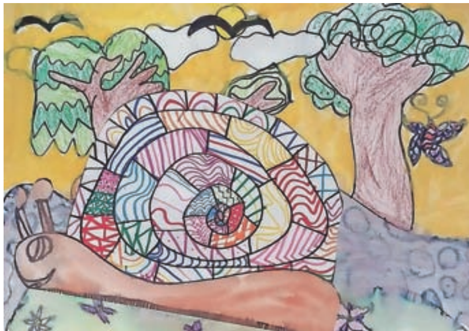
Gaja, 2. c

Učiteljice in učitelji na podružnični šoli na Kokrici učence spodbujamo, da razmišljajo o tem, kaj bi radi postali, ko odrastejo, in kaj bodo za to morali znati. Učimo jih, da iščejo te informacije iz različnih virov. V okviru rednega pouka učenci ob koncu ur občasno pišejo refleksije o tem, kaj so se novega v tisti uri naučili in kako jim bo to znanje koristilo pri kasnejšem izobraževanju. Kompetence podjetnosti krepijo tudi pri načrtovanju in izvedbi različnih dni dejavnosti, pa tudi pri načrtovanju in izvedbi