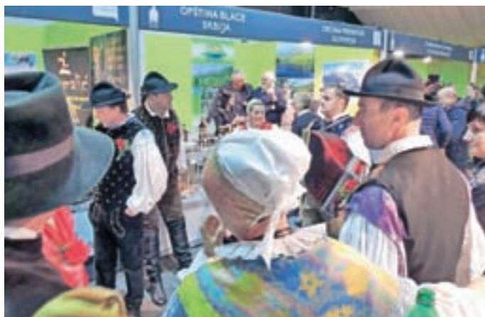
Lep obisk preddvorske stojnice na festivalu v Vodnjanu

Novembra so predstavniki Občine Preddvor sodelovali na festivalu Dnevi mladega olivnega olja v Vodnjanu. S to hrvaško občino Preddvor že nekaj let prijateljsko sodeluje. Na prireditvenem prostoru so se predstavili na svoji stojnici, ob odprtju in tudi pozneje pa so nastopili veterani Folklorne skupine OŠ Matije Valjavca Preddvor. Ob preddvorski stojnici se je ustavila tudi hrvaška predsednica Kolinda Grabar-Kitarović, obiskovalci pa so bili še posebej navdušeni nad kruhom z zasko.