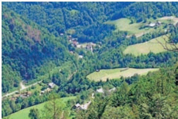
Kokra, kot jo vidijo ptice