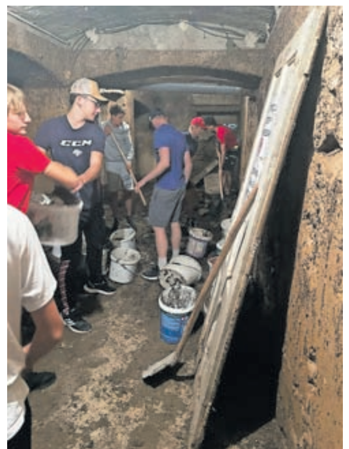
Mladi hokejisti so v delovni akciji priskočili na pomoč Mladinskemu centru Jesenice, ki jim je v avgustovskem deževju zalilo klet.

Za pomoč so se jim v Zavodu za šport Jesenice iskreno zahvalili.