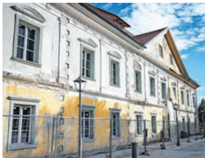
V proračunu za prihodnje leto bodo za nadaljevanje obnove Ruardove graščine namenili 200 tisoč evrov.