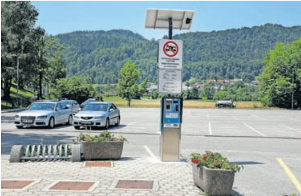
Parkirni avtomat na parkirišču pri pokopališču na Blejski Dobravi ne vrača denarja.

ni dobra izkušnja za turiste. Zanimalo ga je, ali se lahko na tem parkomatu spremeni programska oprema, tako da bo parkomat vračal denar. Kot so pojasnili v občinski upravi, je plačilo na parkomatih na Blejski Dobravi možno na dva načina. Prvi način je plačilo z gotovino,