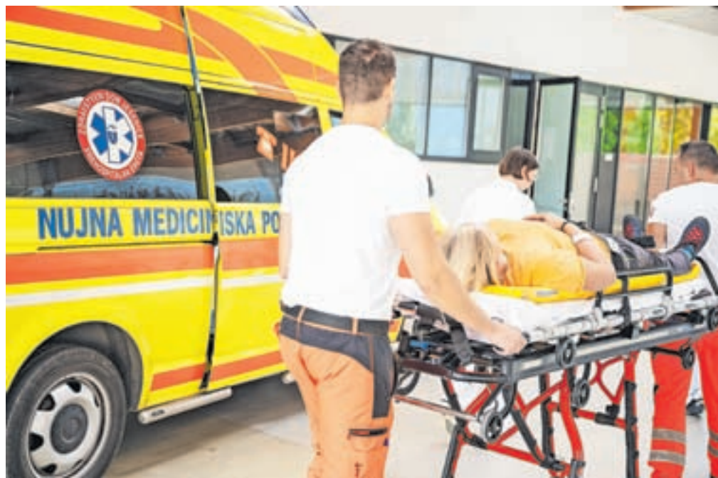
Analiza vaje je pokazala, da je odzivnost vpletenih služb ustrezna.

Zato pa tudi imamo vaje, da bo v morebitni realni situaciji to izboljšano.« Analiza je torej pokazala, da je odzivnost vseh sodelujočih ustrezna in da so ekipe, kljub temu da so se znašle v situa-