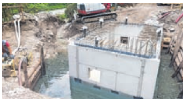
Izgradnja regulacijskega jaška

Po zaključku teh del so bili vzpostavljeni pogoji, da se vodooskrba lahko začne izvajati po novi cevi, hkrati pa se je začelo z deli na lokaciji, kjer bo vgrajen UV dezinfektor. Tre-