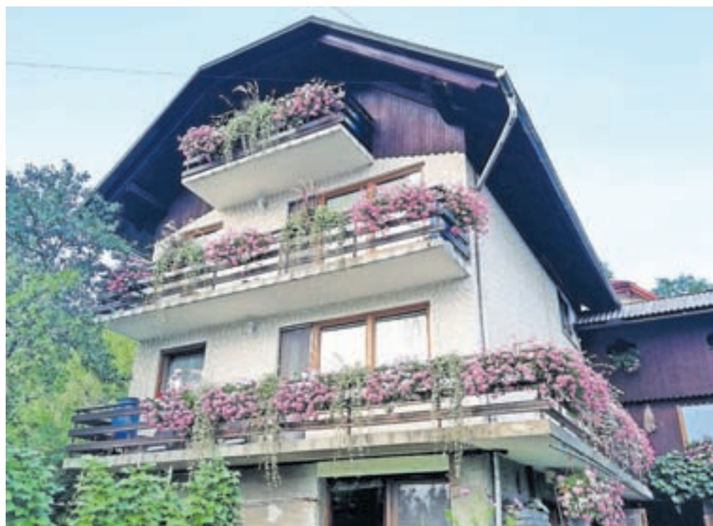
Čudovita rožnata zasaditev Damjane Klinar