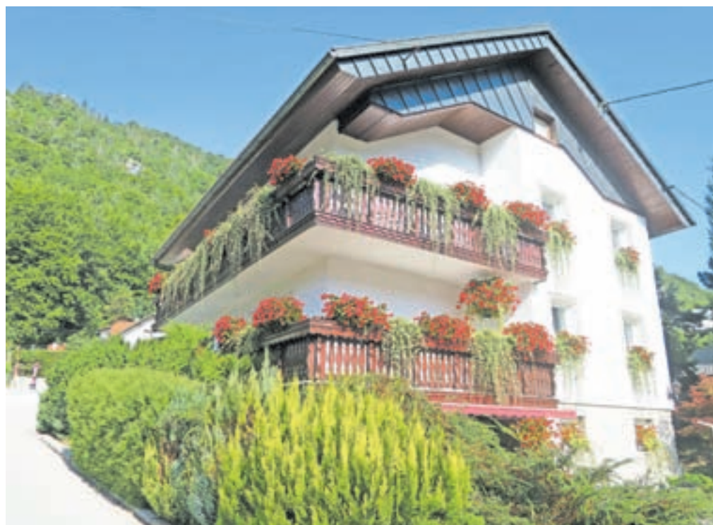
Razkožje cvetja na balkonih Marije Dobravec