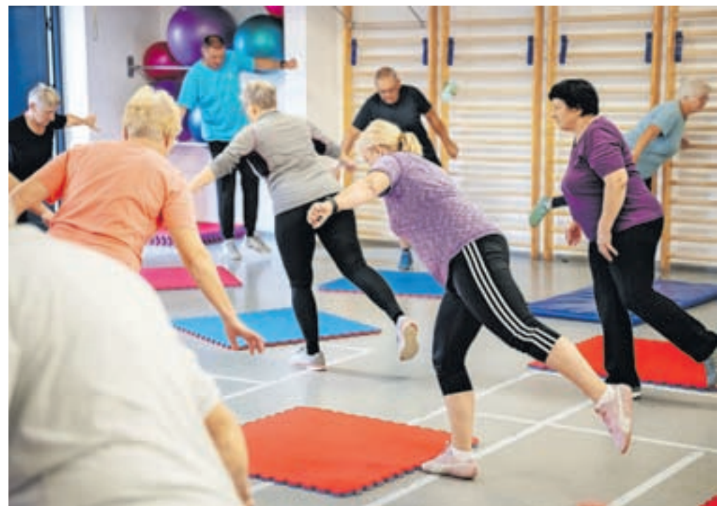
Vaje so prilagojene starejšim, sama izvedba pa ne predstavlja težave nobenemu od udeležencev, ki so za svojo starostno skupino zelo aktivni.

lovadbi za starejše temelji na tem, da bi lokalnemu okolju ponudili nekaj, kar še nimamo,« je poudaril Samar. Vaditelja vadbo prilagajata starejšim, in kot je pojasnil Šorn, vanjo večkrat vključita tudi vaje, vezane na izboljšanje koordinacije, ravnotežja