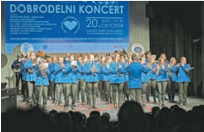
Pihalni orkester je prijateljem z Raven na Koroškem priskočil na pomoč z dobrodelnim koncertom.