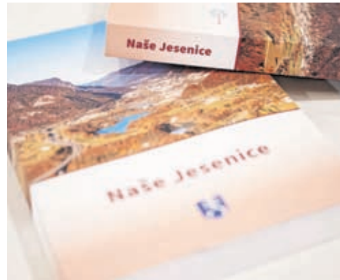
Knjiga Naše Jesenice