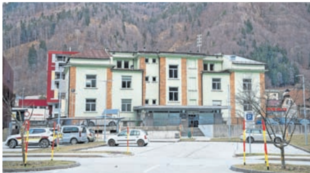
Letos mineva 95 let, kar je kralj Aleksander trg Jesenice skupaj s Plavžem in Savo razglasil za mesto.

V sklopu praznovanja bo tudi letos potekal tradicionalni Jožefov sejem, in sicer od sobote, 16. marca, do torika, 19. marca, na Stari Savi. Uradno odprtje sejma bo v