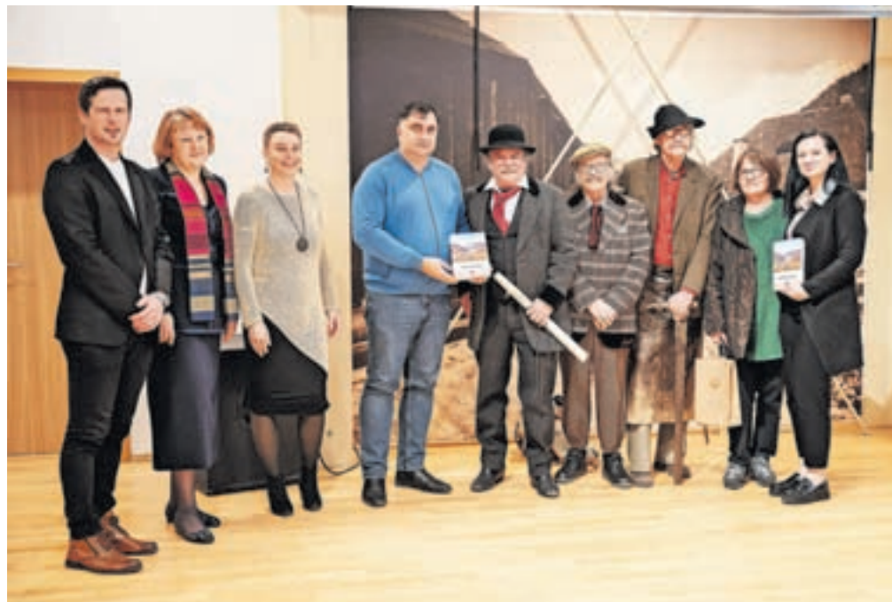
Sodelujoči na predstavitvi knjige z županom

Potem ko je predlani nastala v elektronski verziji, je knjiga Naše Jesenice zdaj izšla tudi v tiskani obliki. Predstavili so jo v Kolpernu na Jesenicah. Kot so povedali snovalci, gre za knjigo, ki so jo napisali Jeseničani. V njej so na 374 straneh zbrane zgodbe Jeseničanov o tem, kako so živeli nekoč. Te so nastale na osnovi pripovedovanj domačinov na študijskih krožkih v sklopu projekta Raziskovanje kulturne dediščine v lokalni skupnosti, ki so zapisana tudi v knjižnicah z naslovom Kako so včasih živeli. Zbrane zgodbe krajanov so združili z zapisi lokalnih zgodovinarjev, etnologov, arheologov in drugih poznavalcev krajevne zgodovine. Tako knjiga združuje že zapisano zgodovino mesta s spomini in življenjskimi zgodbami njegovih prebivalcev. Obogatili so jo z izborom starih fotografij, ki so jim ponekod dodali današnje vzporedne podobe.