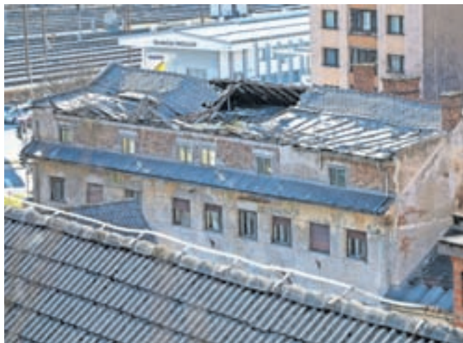
Konec lanskega leta se je ob deževju vdrla tudi streha, kar je stanje stavbe, ki stoji v Centru 2, najbolj gosto poseljenem delu Jesenic, še poslabšalo.

Stanovalci, ki živijo v bližini opuščenega Hotela Pošta sredi Jesenic, že dalj časa opozarjajo, da je objekt nevaren. Pred meseci se je ob močnem deževju celo ugreznila streha, kar je stanje stavbe, ki stoji v Centru 2, najbolj gosto poseljenem delu Jesenic, še poslabšalo.