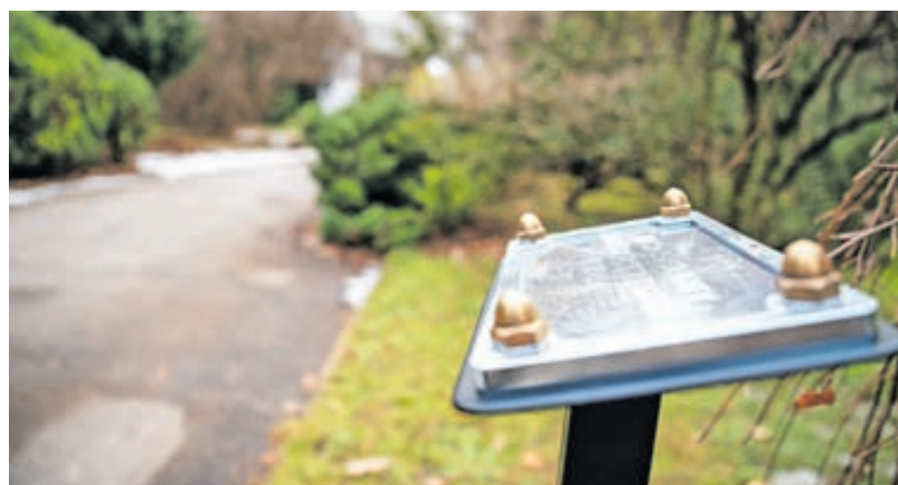
Manjkajoča drevesa in grme v Spominskem parku bodo posadili glede na preostale gravirane ploščice in načrt parka.

V Neodvisni listi Za boljše Jesenice so dali tudi pobudo glede Spominskega parka. »Projekt označitve dreves in grmovnic v jeseniškem Spominskem parku je zaključen. A iz objave na Facebooku profilu enega od uporabnikov smo zasledili, da je ostalo nekaj neporabljenih, a že graviranih kovinskih ploščic. Ne bomo se spuščali v to, da je bil morda