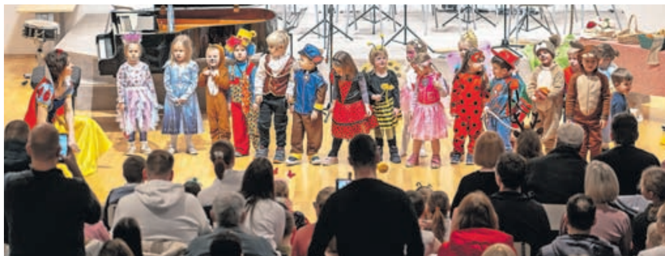
Glasbeni vrtec na pustnem nastopu

bene pripravnice, učenci prvega in drugega razreda baleta, godalni orkester, komorne zasedbe in solisti. Učitelji pa so pripravili zanimivo pustno dramatizacijo in jo vpletli med glasbene nastope.