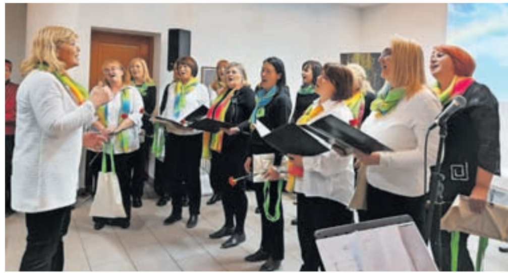
Ženski pevski zbor Mavrica Jesenice med nastopom v Ukvah v Kanalski dolini