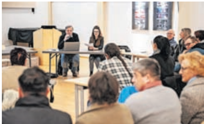
Predstavniki društev so izrazili kar nekaj pomislekov glede prvotne ideje mreže.

izhaja iz potrebe po organiziranju prostovoljstva, še posebej v situacijah, kjer so ljudje želeli pomagati, vendar niso vedeli, kam se obrniti. V okviru mreže naj bi delovala tudi prostovoljska pisarna s sedežem na Jesenicah, kamor bi se potencialni prostovoljci lahko zatekli