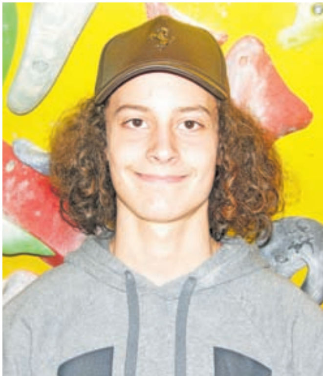
Maj Travnik

Z letošnjim začetkom sem res zadovoljen, saj sem bil na obeh tekmah Zahodne