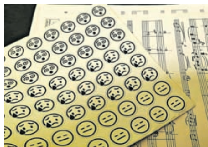
Z lepljenjem emotikonov so učenci ocenjevali pripravo, izvedbo in počutje.

po njenih besedah plod sinergije celotnega kolektiva. Da je resnično šlo za skupinsko prizadevanje, kaže že dejstvo, da so prav vsi člani kolektiva opravili posebna izobraževanja, kjer so pridobili še dodatna znanja in veščine, povezane s premagovanjem strahu pred nastopom.