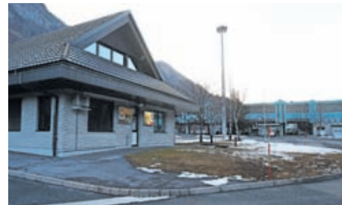
Po načrtih naj bi poslovno stavbo podjetja Conditus odstranili.