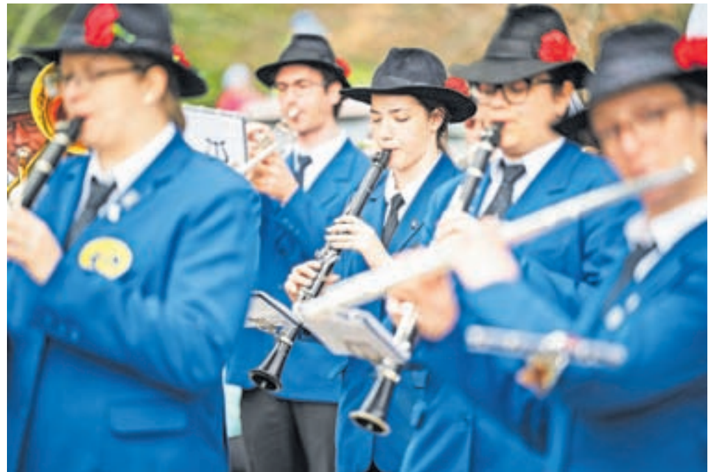
Tema letošnjega kviza je 150-letnica Pihalnega orkestra Jesenice - Kranjska Gora in 95-letnica mesta Jesenice.

V sklopu praznovanja občinskega praznika pa pripravljajo tudi spletno obliko kviza, ki bo objavljen na spletni strani Občine Jesenice (na elektronski povezavi www.jesenice.si/kviz ), in sicer v tednu od 14. do 20. marca, in bo namenjen vsej zainteresirani javnosti. Na spletni strani Občine Jesenice bo tudi gradivo z informacijami, ki bo v pomoč pri reševanju kviza.