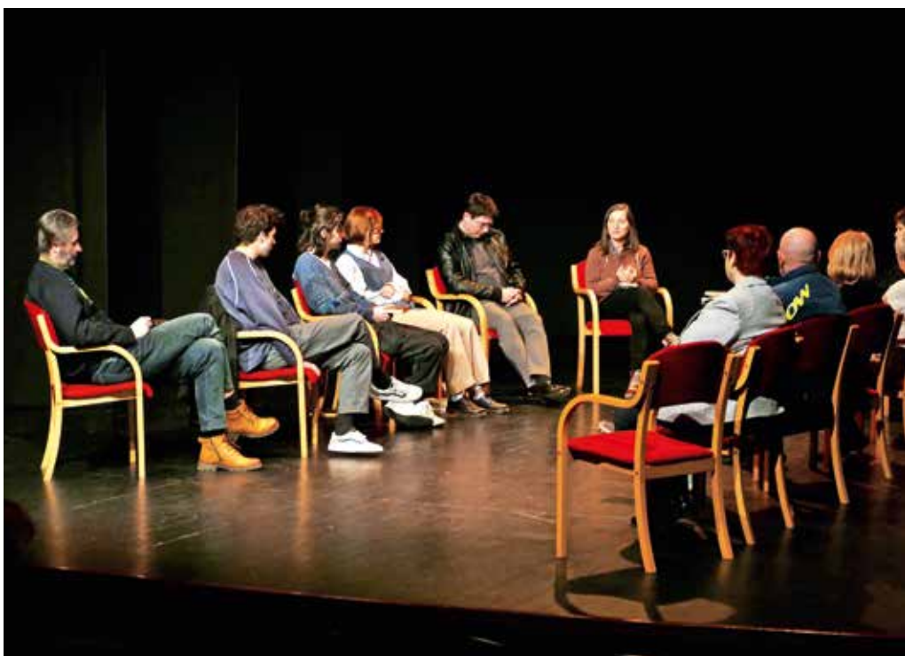
Literarni večer je potekal ob interpretiranju del različnih avtorjev.

da se položaj umetnika od Prešernovih časov do danes ni prav nič spremenil, zato verz iz njegove znamenite pesmi