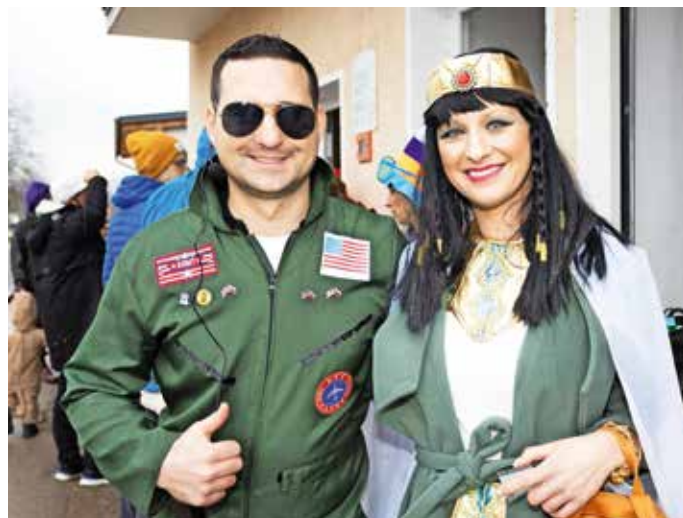
V Mošah sta se pomešala sedanost in preteklost – Top Gun in Kleopatra.