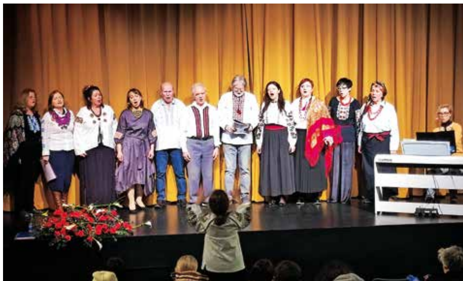
Pesmi, ki povezujejo: ukrajinski pevski zbor Drevo svobode