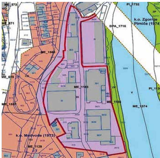
Prikaz območja lokacijske preveritve

Kontaktne osebe za dodatne informacije sta Sonja Rifel (01 361 95 43, rifel@medvode.si ) in Teja Zajec (01 361 95 41, teja.zajec@medvode.si ).