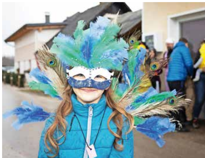
Strokovna komisija je v Mošah za najlepšo izbrala masko, ki je predstavljala pava.