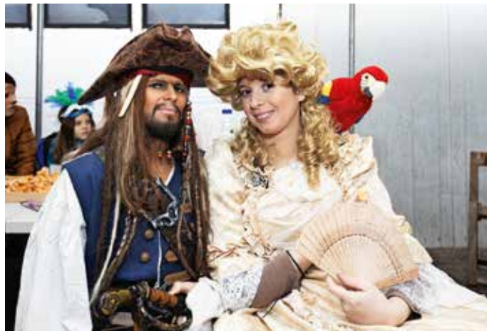
Veliko pozornosti sta vzbudila tudi pirata s Karibov.