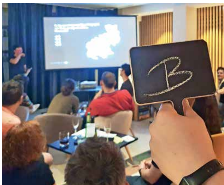
Barski kviz je priložnost za drugačen način zabavnega druženja.

Če vas barski kviz zanima, spremljajte objave na strani Bara kulture na Facebooku. Znana sta že datuma nasled-