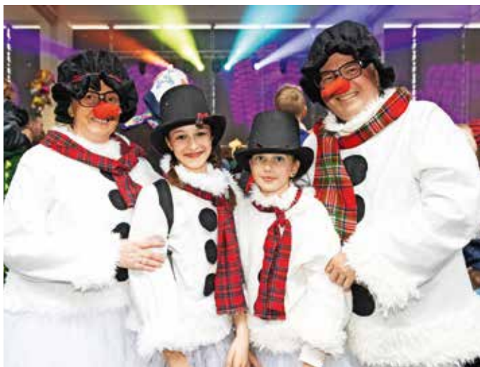
Družina snežakov na pustovanju v medvoški športni dvorani