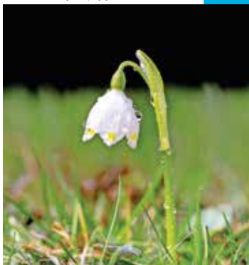
Po dežju