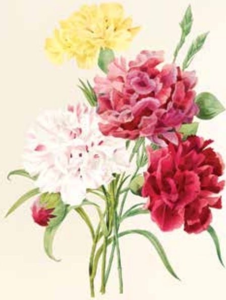
www.gorenjskiglas.si / foto: Freepik.com

Drage bralke, želimo vam prekrasen dan žena!