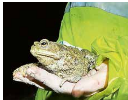
Lokacije za pomoč žabicam so objavljene na spletni strani www.pomagajmo-zabicam.si .

Mokrišča za nas in vsa živa bitja »zbirajo« pitno vodo. So med najhitreje izginjajočimi, a najpomembnejšimi ekosistemi. Vodotoki potrebujejo poplavne ravnice. Meandriranje je v naravi nižinskih rek in obraščena je tisočletja imela svoj smisel. To so bile privlačne krajine.