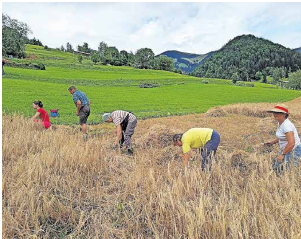
Jari ječmen so letos žanjice spet požele s srpi.

še druga dela, kosijo travo, jo nosijo v rjuhah, pridelujejo pa tudi domači mošt.