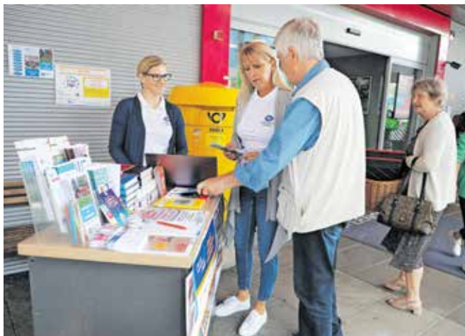
Na stojnici, ki so jo predstavili v okviru Dnevov svetovanja za znanje, je bilo mogoče izvedeti vse o prihajajočem vpisu in tudi drugih programih LUJ.

šport, zdravje, umetnostno zgodovino, kulturno dediščino in geografijo, letos pa tudi novost: osma sekcija – tuji jezik italijanščina.« je dejala in obenem poudarila, da se zelo veselijo novih udeležencev. Vsi upokojenci ste tako vabljeni, da se udeležite prvih predavanj in uvodnih sestankov, na katerih boste seznanjeni s tem, kaj določene sekcije sploh ponujajo. »Predavatelji bodo na uvodnih sestankih predstavili vsebino predavanj in potem imajo ljudje čas, da premislijo, kam bi se želeli vključiti. Letna članarina znaša 61 evrov, lahko se plača tudi v dveh obrokih, člani pa se potem poljubno odločijo, v koliko in v katerih