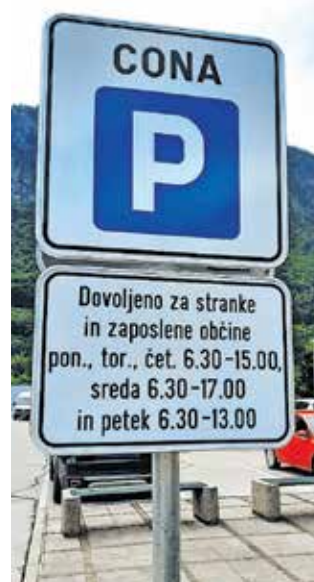
Dopolnilna tabla, na kateri so navedene ure, ko je parkiranje ob občinski stavbi omejeno.

Občina Jesenice je na območju ob občinski stavbi vzpostavila nov parkirni režim. Parkirišče na območju zgornjega platoja (vzhodno, južno in zahodno od občinske stavbe) je tako od ponedeljka do petka v urah, ki so navedene na dopolnilni tabli, rezervirano za stranke Občine Jesenice in zaposlene. Stranke, ki obiščejo Občino Jesenice, lahko v sprejemni pisarni občine prevzamejo dovolilnico za obiskovalce, ki jo v času opravkov na občini namestijo na vidno mesto v avto in jo po zaključku vrnejo v sprejemno pisarno. V neposredni bližini stavbe občine na spodnjem parkirišču je sicer na voljo dovolj parkirnih mest.