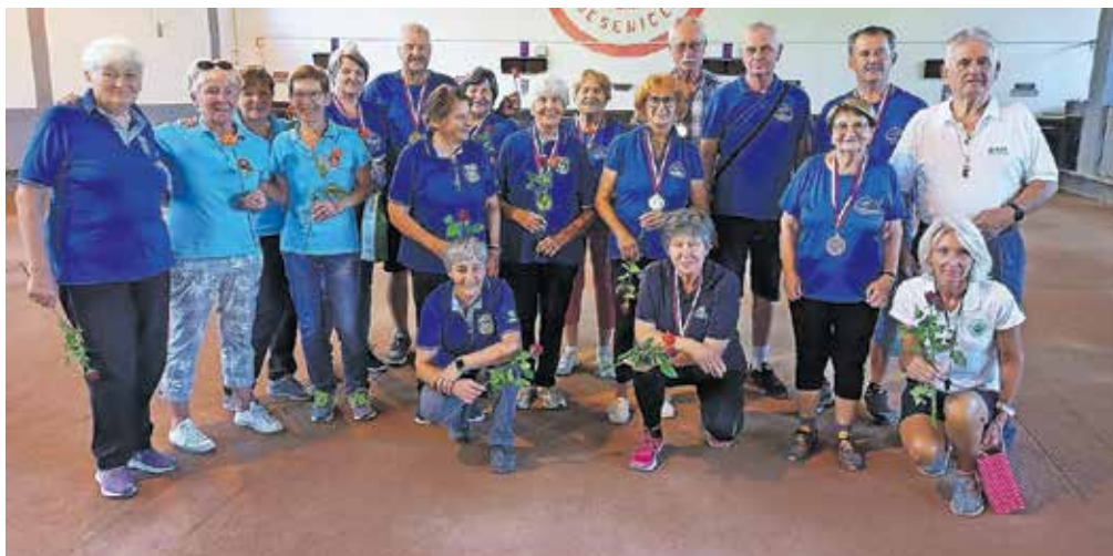
Najboljše ekipe na balinarskem turnirju Društva diabetikov Jesenice

Pri Društvu diabetikov Jesenice poleg izvajanja osnovnih programov, ki so namenjeni izobraževanju in ozaveščanju o sladkorni bolezni in možnih posledicah te bolezni, velik poudarek dajejo različnim rekreativnim dejavnostim in akcijam za zdrav način življenja. Organizirajo športna tekmovanja, pohode in izlete v naravo. Med priljubljenimi športi je balinanje, vsak teden imajo člani treninge na baliniščih v Bazi na Jesenicah, udeležujejo se tekmovanj v okviru društev diabetikov in organizirajo svoj turnir. Na letošnjem je nastopilo osem