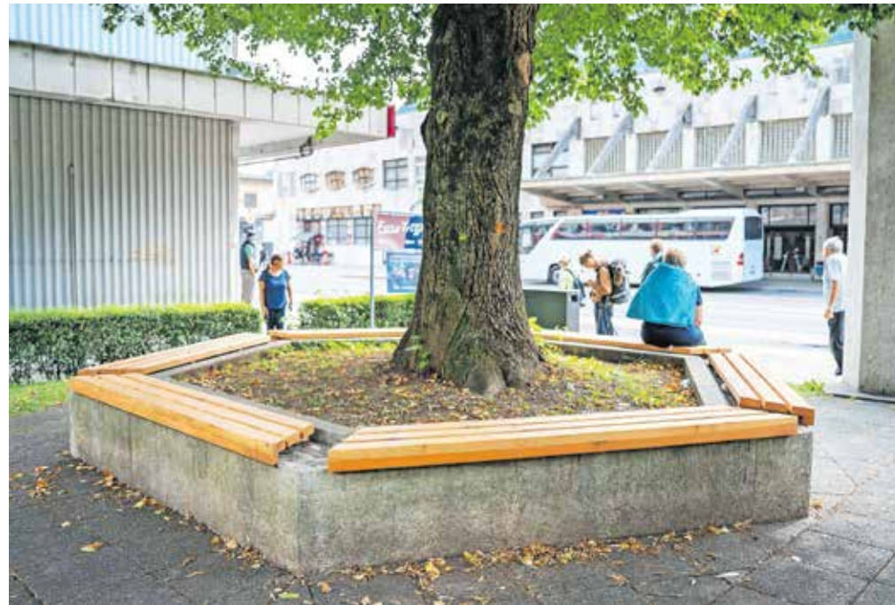
V parku pri Murki so postavili štiri nove klopi in šesterokotno klop okoli lipe.