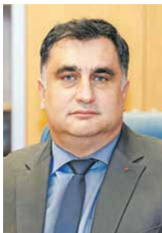
Župan Peter Bohinec

Za prijetno življenje na Jesenicah pa moramo začeti posodabljanje mesta in ga skladno z novimi smernicami in