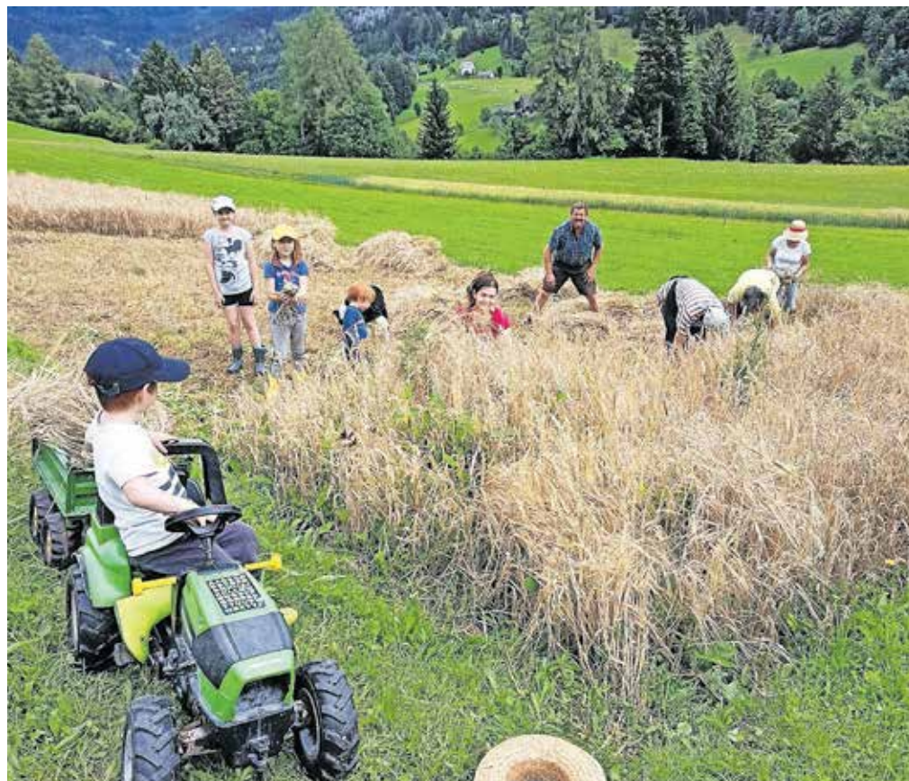
Delo so z zanimanjem spremljali tudi otroci.