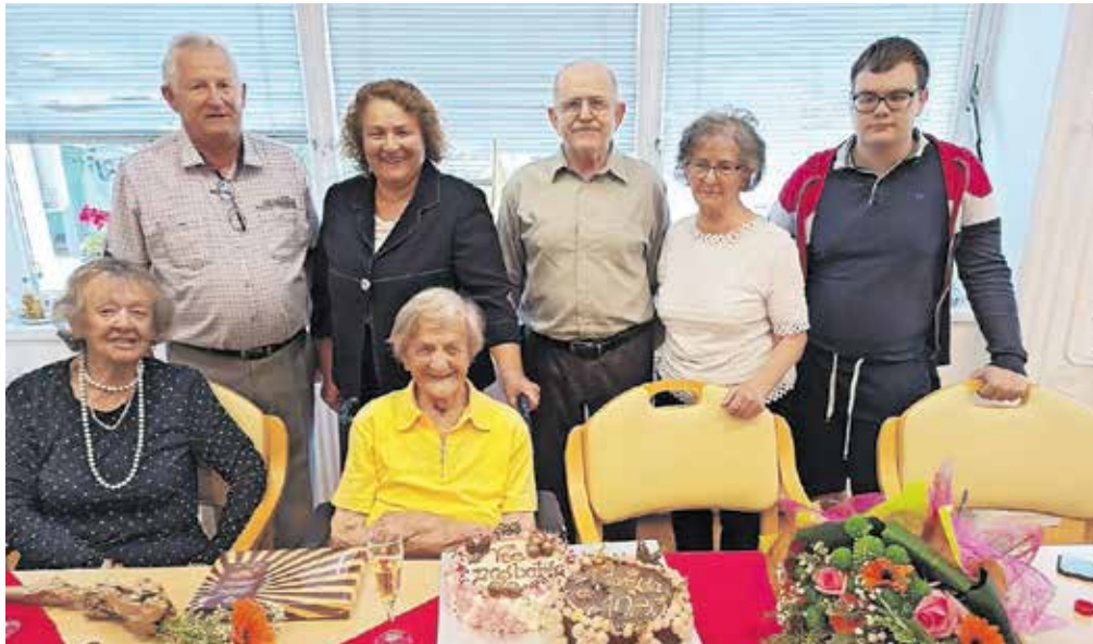
Praznovanje častitljivega rojstnega dneva je trajalo kar nekaj dni. Najprej v krogu njenih najdražjih in zatem v Domu upokojencev dr. Franceta Bergelja.