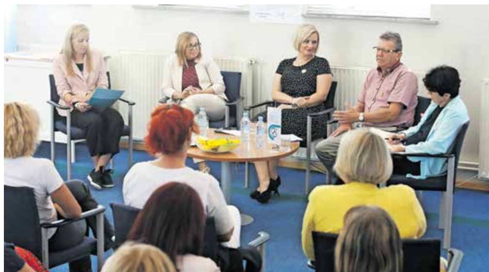
Izmenjava mnenj je omogočila, da so zdravstveni delavci in pacienti stopili v čevlje drug drugega.