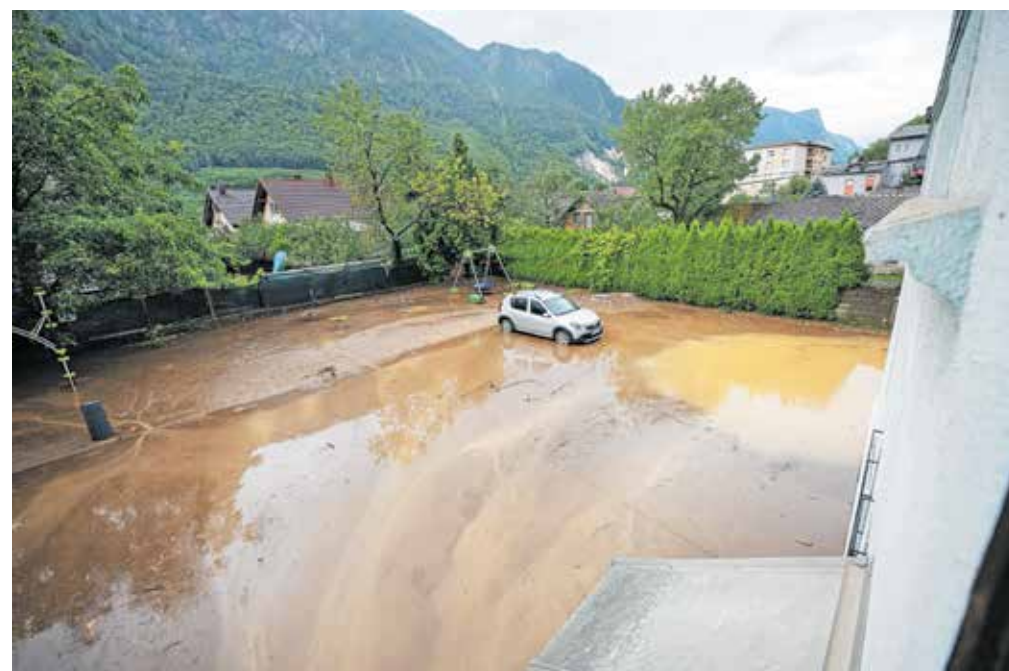
V času avgustovskih poplav (na sliki) je poplavelo tudi otroško igrišče ob Mladinskem centru Jesenice. Ker je prišlo tudi do izliva fekalij, bo treba zamenjati vso zemljinu na igrišču.

»Sicer je območje na Straži namenjeno za stanovanjsko gradnjo, vendar je pogoj Stanovanjskega sklada, da se najprej naredi nova povezovalna cesta do Slovenskega Javornika,« je pojasnila.