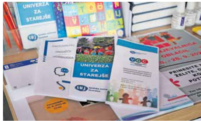
Vpis na Univerzo za starejše Jesenice poleg novih znanj ponuja tudi priložnost za nova poznanstva in izmenjavo izkušenj.

jih nič ne zavezujejo, saj se za vpis še vedno lahko odločijo naknadno; naj nas pokličejo za boljše informacije ali pa se oglašijo na LUJ.«