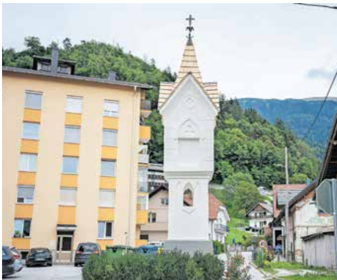
Obnovljeno Štefančevo znamenje sredi Koroške Bele

znamenja so bili v preteklosti nabožne slike in kipi, ki pa niso več ohranjeni.