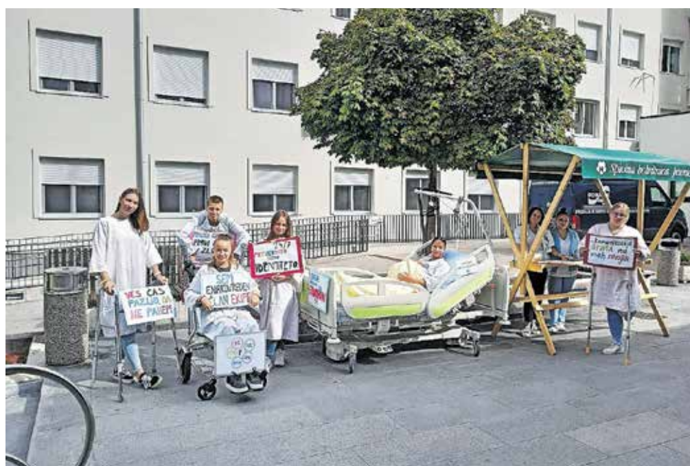
Pred vvhodom v stavbo je bila v postelji nosečnica, prisoten je bil pacient z zlomljeno nogo, prikazali so možnost zamenjave identitete pacienta.

opozorili na področja, kjer morajo biti v bolnišnici še zlasti pozorni do pacientov. Pred vvhodom v stavbo je bila v postelji nosečnica, prisoten je bil pacient z zlomljeno nogo, prikazali so možnost zamenjave identitete pacienta. Predvsem so opozarjali na možne varnostne zaplete, za