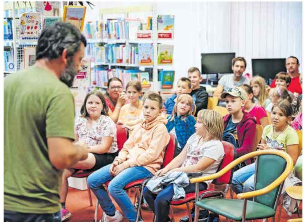
Letos je jeseniška knjižnica dobila 41 novih Poletavcev in devet novih Najpoletavcev.

knjig tudi med poletnimi počitnicami, je Mestna knjižnica Ljubljana, jeseniška knjižnica pa se je tokrat pridružila že petič. Otroci, ki so prebrali knjige vse od 10. junija pa do 10. septembra, so lahko postali Poletavci ali pa Najpoletavci. Prvi naziv je namenjen mlajšim otrokom, stari med sedem in dvanajst let, ki so med poletjem trideset dni namenili polurnemu prebiranju knjig, Najpoletavci pa so lahko postali najstniki, stari med 13 in 16 let, katerih naloga je bila prebrati tri knjige po lastni izbiri ter napisati mnenje. Občinsko knjižnico Jesenice je v letošnji poletni bralni sezoni dopolnilo kar 41 novih Poletavcev in devet novih Najpoletavcev, kar v skupno