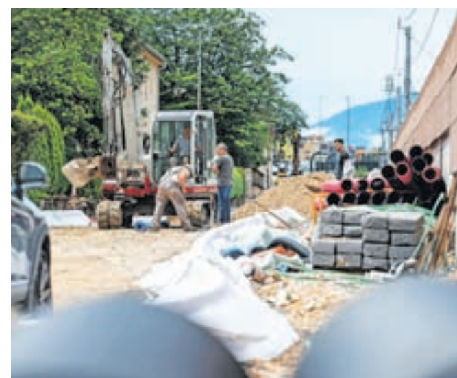
Obnova dveh najbolj dotrajanih jeseniških ulic, Delavske in Kejžarjeve, se počasi bliža zaključku.

Glede na trenutni potek del na Občini Jesenice pričakujejo, da bodo ta zaključena v prvi polovici septembra.