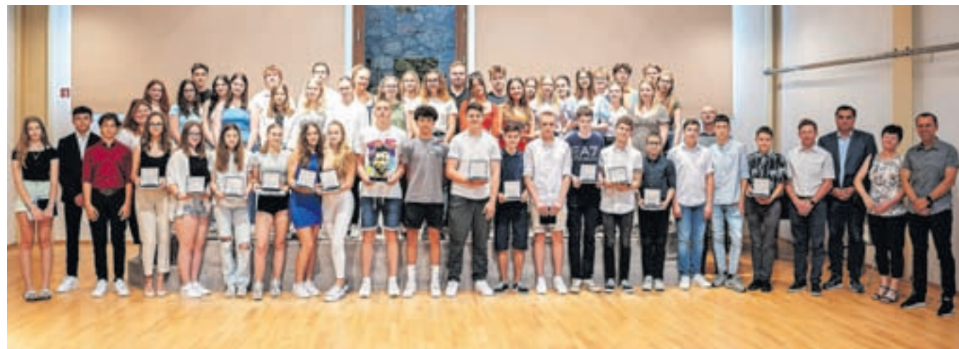
Najboljši učenci in dijaki z županom in ravnatelji na sprejemu v Kolpernu