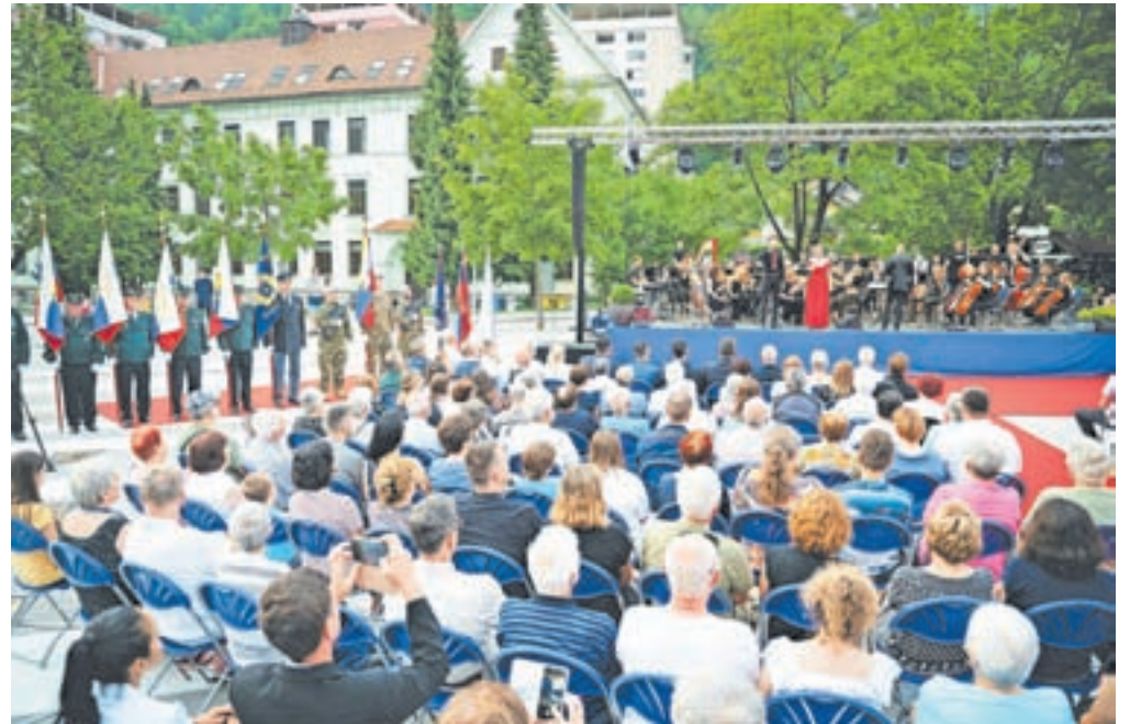
Trg se je spremenil v čudovito poletno prizorišče.

nostjo, podjetnostjo, predanostjo, pravičnostjo, odprtostjo, strpnostjo in poštenjem gradimo naše Jesenice in naše Slovenijo. Če se bomo pogovarjali in se slišali, če se bomo upoštevali, bodrili in si pomagali, če bomo povezana in solidarna