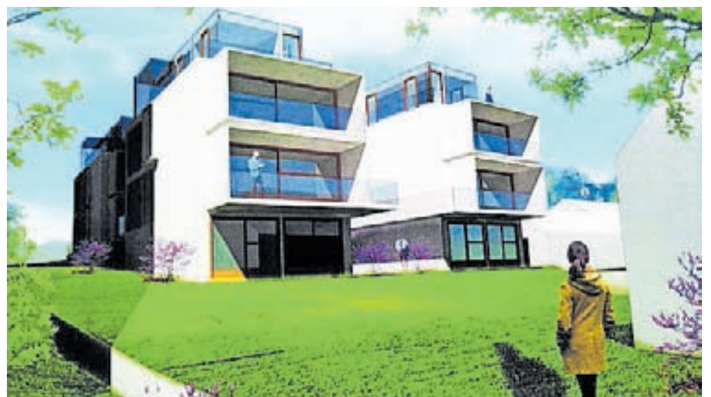
V štirih dvostanovanjskih enotah bo skupaj osem stanovanj.

Ta čas pripravljajo gradbišče, investitor ureja financiranje, stanovanja pa naj bi bila vseljiva konec prihodnjega leta.