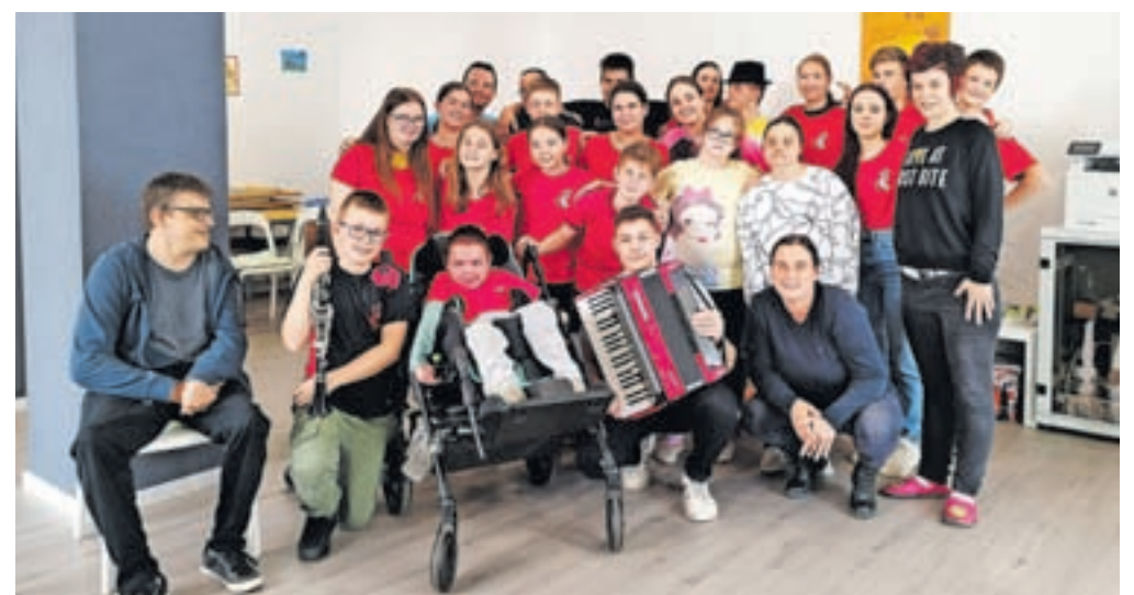
Člani društva Lepa si v novih prostorih

Društvo Lepa si je bilo ustanovljeno z glavnim ciljem omogočiti osebam s posebnimi potrebami enakovredno vključevanje v družbo, večjo samostojnost in nudenje raznovrstne pomoči. Pomembna pridobitev za uresničevanje ambiciozno zastavljenega programa so novi prostori na Ulici Cirila Tavčarja 3b na Jesenicah, kjer izvajajo različne aktivnosti, delavnice ali zgolj prijetna srečanja, ki tem osebam vedno veliko pomenijo. Med pomembnimi nalogami so pridobivanje novih znanj in veščin ter ohranjanje že pridobljenih, večanje samostojnosti, socialna in delovna integracija, reševanje osebnih stisk, informiranje glede pravic invalidov in zmanjševanje diskriminacije. V septembru bodo v okviru društva izvedli projekt Vsi mladi, zdravi, enaki, ki