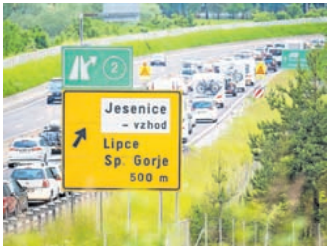
Ob zastojih na avtocesti se poveča tudi prometna obremenitev občinskih cest v jeseniški občini.

Tudi to poletje je zlasti ob koncih tedna občasno povečan promet skozi Jesenice, saj zaradi zastojev na avtocesti nekateri vozniki uporabljajo ceste skozi mesto. Kot so povedali na Občini Jesenice, so se s policijo in DARS-om dogovorili za sistem vodenja prometa po avtocesti, da bi bile občinske ceste čim manj obremenjene. Povečan promet pričakujejo tudi na Blejski Dobravi, predvsem na pokopališču, kjer se parkirni prostori uporabljajo za obisk soteske Vintgar. »Medobčinski inšpektorat in redarstvo občin Jesenice, Gorje, Kranjska Gora in Žirovnica se bo skupaj z ostalimi službami potrudil, da bo promet skozi Jesenice potekal čim bolj nemoteno in da bo življenje Jeseničanov moteno v čim manjši meri,« so povedali na Občini Jesenice.