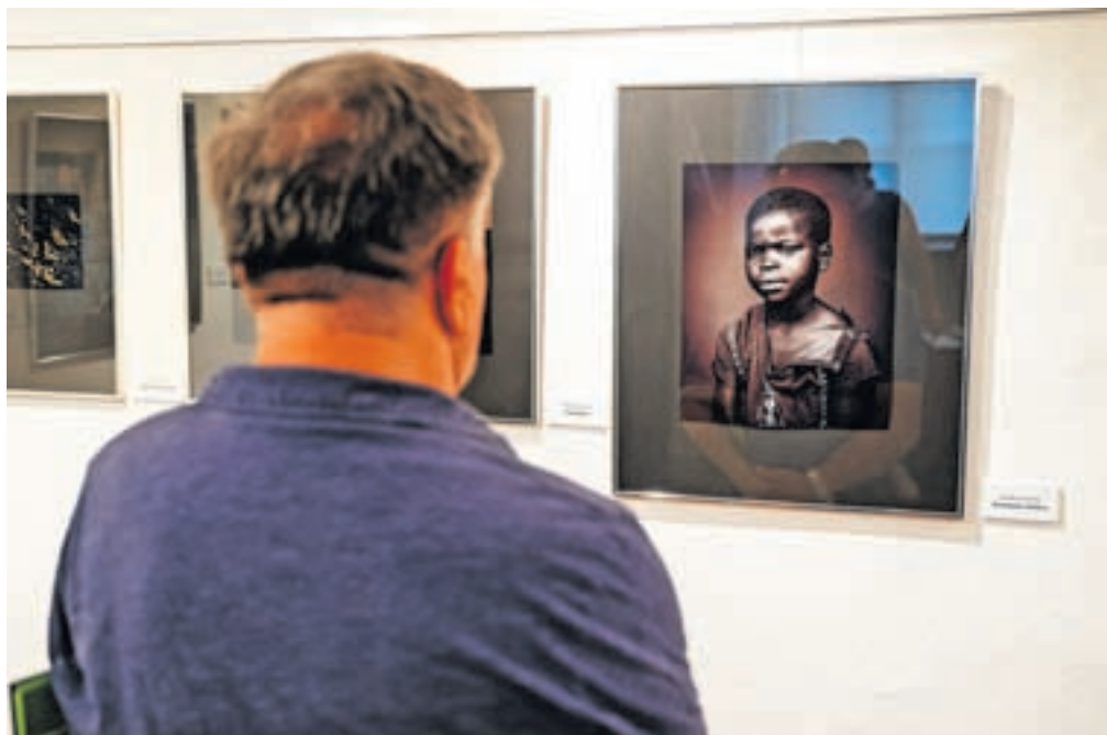
Na razstavi je bilo mogoče občudovati različne zvrsti fotografije, saj fotografinje niso bile omejene s specifično tematiko.

iz Digitalnega foto kluba Celje, srebrno medaljo je osvojila Samanta Krivec iz Rogaske Slatine, medtem ko je tretje, bronasto mesto pripa-