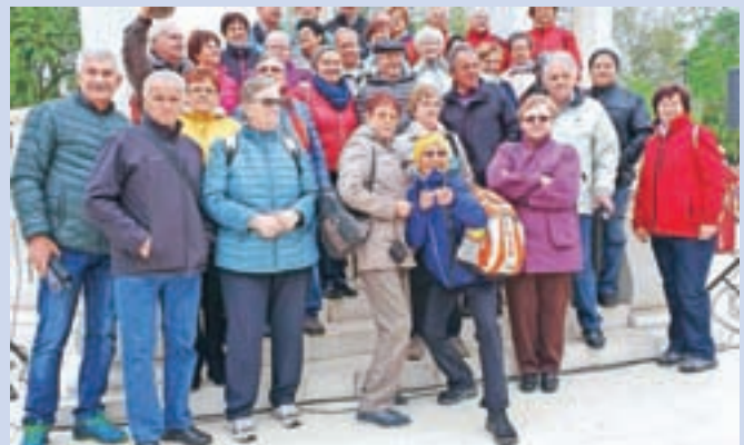
Na prvem letošnjem izletu smo obiskali hrvaško mesto Bjelovar.

Da ne bi vsega našteval, naj omenim, da nam je letošnji piknik društva, kljub temu da brez dežja ni šlo, zelo uspel. Tudi na srečanju starejših nad 80 let, ki smo jih gostili v brunarici Štern na Kokrici,