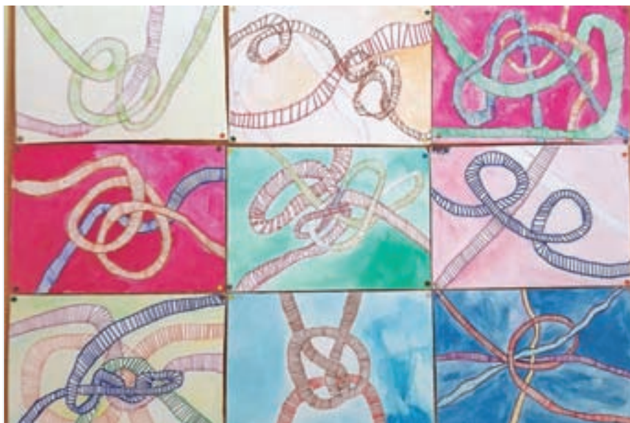
Učenci 3. č