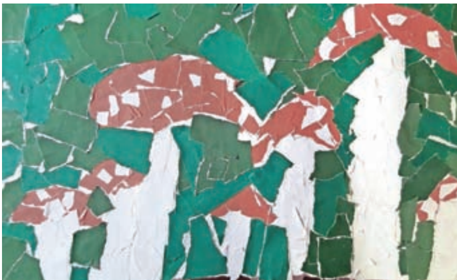
Neža, 1. c