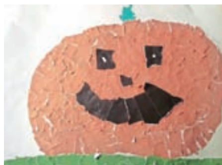
Monika, 1. č