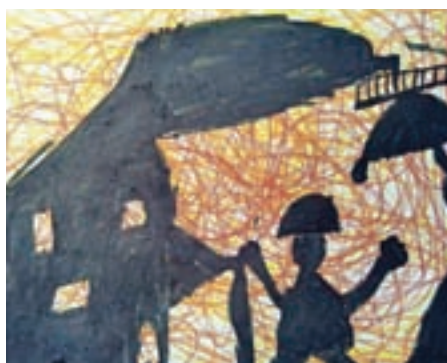
Gaber 3. c