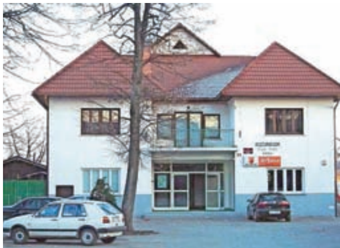
Kovinski napis »Kulturni dom Mrak Franc – Kokrica« je bil odstranjen tik pred obnovo fasade kulturnega doma v letu 2009.

Franc Mrak je bil rojen 19. novembra 1907 na Kokrici. Kot predvojni revolucionar in eden prvih organizatorjev OF na območju Kokrice in Kranja je v začetku vstaje proti nemškemu okupatorju v letu 1941 bil imenovan za komandirja ene prvih partizanskih enot na Gorenjskem in v slovenskem prostoru, in sicer Kranjske čete, ki se je nato dne 4. avgusta 1941 na Mali Poljani pod Storžičem združila skupaj s Tržiško četo v prvi partizanski bataljon (Storžiški oz. Kranjski bataljon) v Sloveniji. Žal je tega nemški zločinski okupacijski bojni stroj s pomočjo domačih izdajalcev že naslednjega dne vojaško onemogočil. Francu