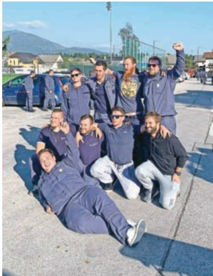
Ekipa članov A ob uvrstitvi na državno tekmovanje

Prav tako smo začeli vaje za gasilsko mladino. Vsi se zavedamo, da le dovolj podmladka lahko pomeni uspešno delovanje društva na dolgi rok. Zato v svoje vrste vabimo vso mladino od šestega leta starosti dalje. Pod očesom usposobljenih in strokovnih mentorjev mladine našega gasilskega društva se bodo otroci začeli učiti različnih gasilskih veščin, hkrati pa se bodo naučili odgovornega ravnanja, dela v ekipi in zavedanja družbene odgovornosti. Vse vabimo, da se nam pridružite na vajah v dveh možnih terminih: od 6. do 12. leta se zbiramo vsak ponedeljek med 18. in 19. uro, od 12. do 16. leta pa vsak četrtek med 18. in 19. uro.