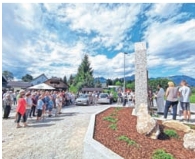
Na uradnem odprtju in blagoslovitvi novega znamenja se je zbralo veliko krajanov.

Žal imamo še precejšen del neplačanega dolga, zato nadaljujemo zbiranje prostovoljnih prispevkov na hranilni račun predsednice odbora Mete Cvirn. ŽR: SI56 0760 6462 1704 661 ali pa nas pokličite na tel: 031/200 915. Z veseljem se oglasimo za vaš dar.