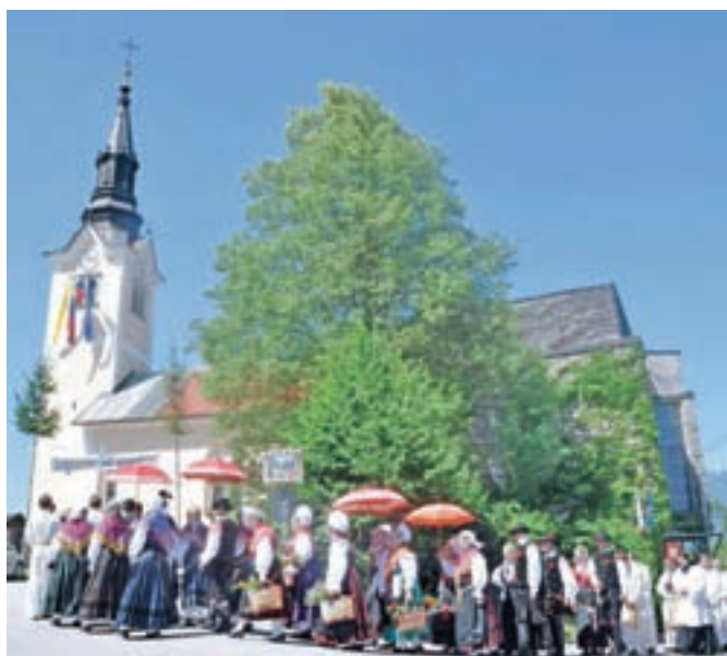
Prihod narodne noše

A zato se še nima za nevernega. Je preprosto iskalec resnice. Išče pa jo pošteno. Na vsakem razpotju si izbere težjo pot. Dodal je: »Zaviram vernim. Imajo svoj dom. Ob nedeljah jih gledam, ko se vračajo iz cerkve. Razodevajo, da so bili nekje, kjer se počutijo kot doma. Jaz takega doma nimam. Sem sicer član naroda, v katerem sem se rodil. A kot človek sem sam. Ne vem, od kod sem prišel in kam grem. Blagor vam, ki to veste!«