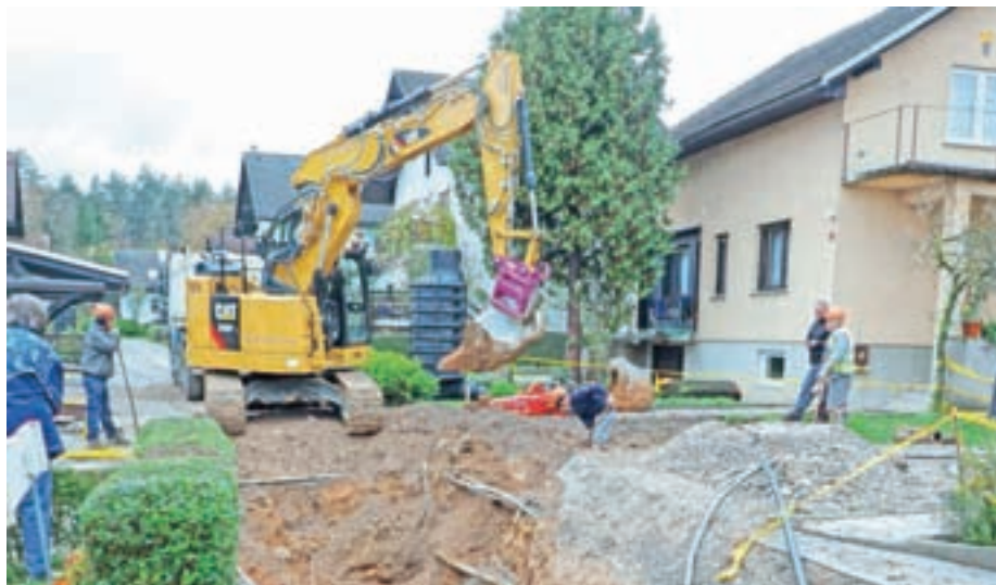
Gradnja kanalizacije v Nedeljski vasi

Na Mlaki so ta mesec začeli graditi kanalizacijo v okviru projekta Gorki 2.