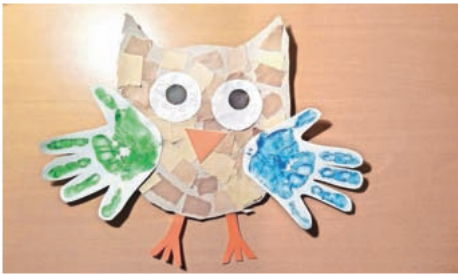
Ema, skupina Sovica