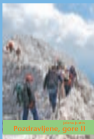
Pozdravljene, gore II

ali darilni bon za refleksno masažo stopal