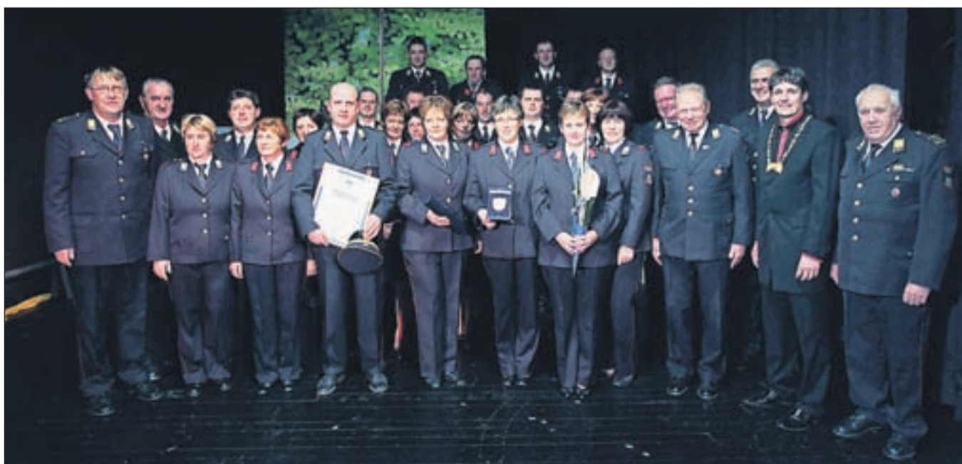
Članice in člani Prostovoljnega gasilskega društva Lom pod Storžičem

Vseh devetdeset let so člani in članice Prostovoljnega gasilskega društva (PGD) Lom pod Storžičem nesebično delovali v prid kraja in pomagali ljudem ne le v primeru požara, temveč ob vseh elementarnih nesrečah in ne ljubih dogodkih posameznih krajanov. V zadnjem obdobju so dogradili in posodobili gasilski dom, ob pomoči občine Tržič pa so pridobili tudi kombinirano gasilsko vozilo. Vse aktivnosti pri delu gasilskega društva opravljajo člani sami na prostovoljni bazi. S tem se društvo razvija in posodablja, posledično pa to pripomore k sodelovanju in druženju velikega števila ljudi. PGD Lom poleg redne gasilske dejavnosti vedno sodeluje tudi pri organizaciji vseh prireditev v kraju, ki jih organizirajo bodisi sami, krajevna skupnost, društva ali drugi. "Ob devetdesetletnici smo predali namenu orodno vozilo za prevoz moštva, obnovili in dokončali fasado na gasilskem domu, vse skupaj v sodelovanju s krajevno skupnostjo, krajanji in občino, ki nam je ob tem tudi finančno pomagala. Plaketa je sad preteklega dela, hkrati pa nam daje motivacijo za delo naprej. Trenutno nas je v PGD Lom 130 članov, od tega trideset operativnih. V svoje vrste vključujemo tudi mladino," je povedal predsednik PGD Lom Gregor Meglič.