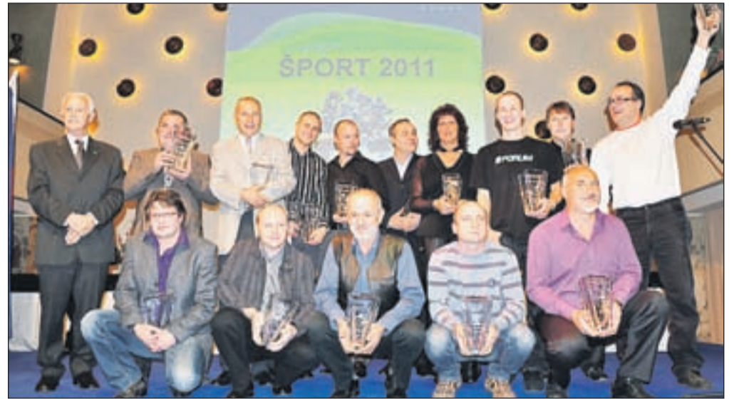
Najuspešnejši moto športniki v letu 2011 | FOTO: MATIC ZUPAN