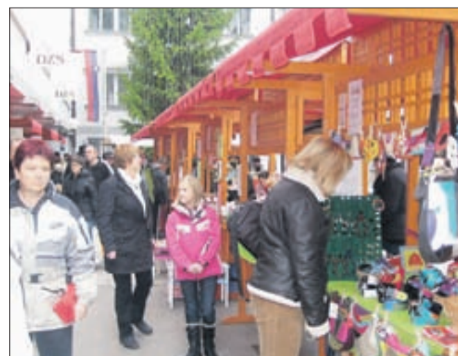
Lične pokrite lesene stojnice