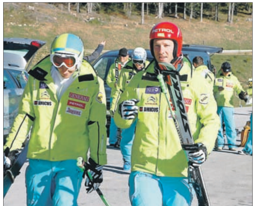
Za Andreja Jermana se je nova sezona končala po padcu na smuku v Beaver Creeku.