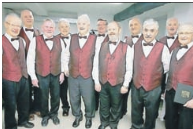
Moški pevski zbor Društva upokojencev Tržič praznuje 35-letnico.

namene uresničuje še danes, saj se udeležujejo raznih srečanj upokojenskih zborov tako doma kakor tudi zunaj občine. Vsako leto sodelujejo na Srečanju usnjarske in predelovalne industrije v Tržiču, dobre sosedske odnose vzdržujejo tudi s Koroško, kjer so na primer nastopili v Borovljah, pa tudi drugod. Vaje imajo enkrat tedensko, veseli pa so vsakega novega člana, ki želi sodelovati v zboru. Tudi v prihodnje želijo ohranjati visoko kulturno