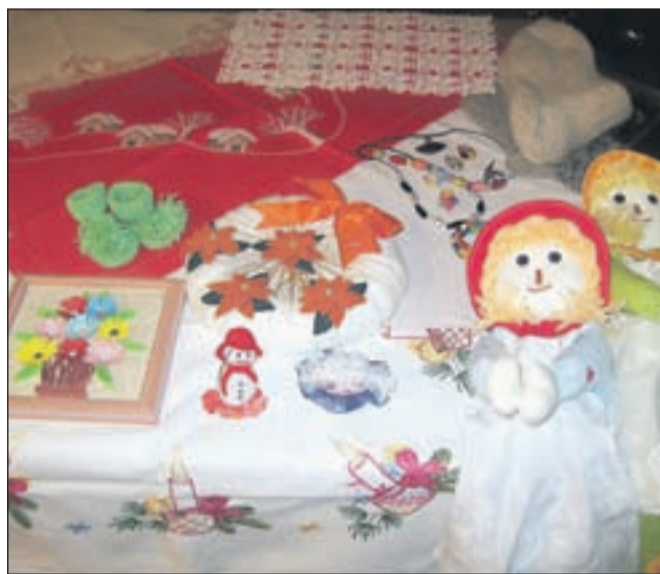
Nekaj izdelkov članic skupine Nežke, ki za ročna dela želijo navdušiti tudi mlajše generacije.