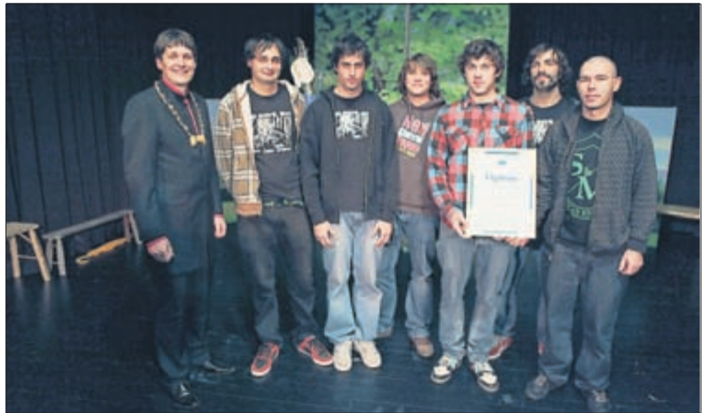
Ekipa Red Shovel team

ne odgovornosti zaposlenih Tržičanov, pa tudi konstruktivnega odnosa občinskih struktur zadovoljna z izbiro svojega stalnega bivališča.